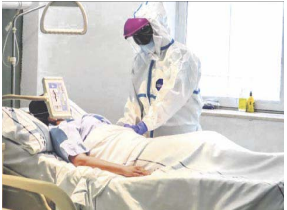
Quintana Roo pasa de reportar sólo 50 casos de Covid-19 diarios, a más de 800 en las últimas jornadas.

“Nos encontramos aplicando protocolos de seguimiento a diversos colaboradores, incluyendo las tripulaciones, lo que ha implicado la realización de ajustes en las operaciones planeadas”, se puede leer en el documento.