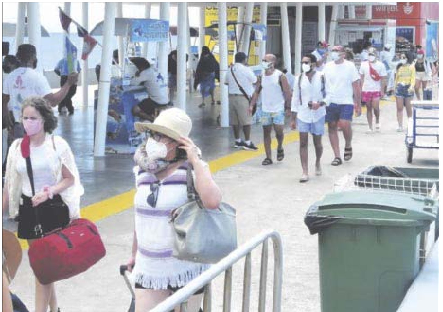
Instan a respetar protocolos sanitarios contra coronavirus para frenar cuarta ola de contagios en Quintana Roo.

A finales de diciembre, Biden anunció que el gobierno enviaría 500 millones de pruebas caseras a los habitantes, y el viernes la Casa Blanca informó que firmaron un primer contrato, valorado en 51.6 millones de dólares, con la compañía Goldbelt Security.