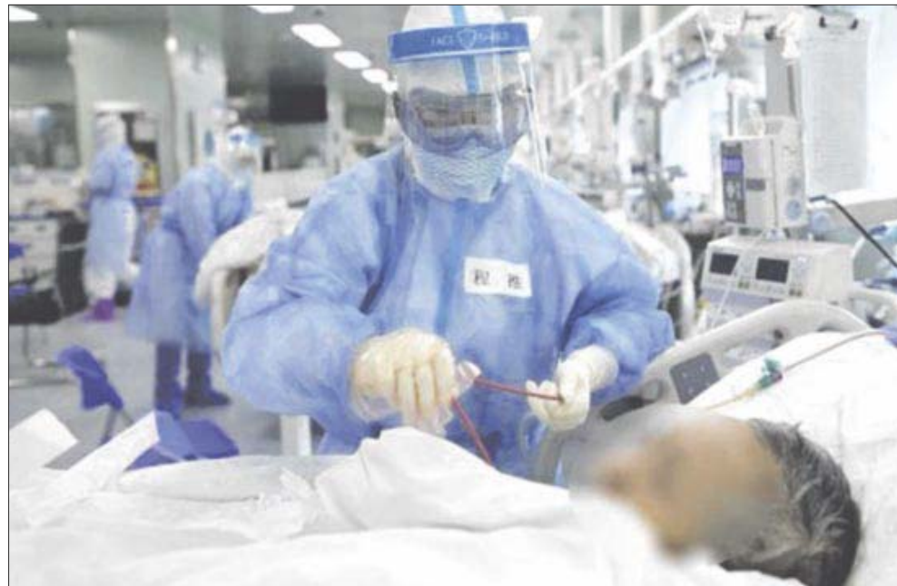
Hasta ayer 9 de enero, se habían confirmado 66 mil 852 casos positivos de Covid.

Sobre la ocupación hospitalaria, la actualización apunta que en la zona norte se encuentra en 7% mientras que la zona sur está en 1%. Mientras que la velocidad en el crecimiento de contagios es de 0.13 en la zona norte y de 0.01 en la zona sur. Asimismo, se informó que se han aplicado 2 millones 321 mil 659 dosis de vacuna contra Covid-19, por lo que se le pide la población que continúen con los hábitos de higiene para proteger su salud sobre todo ahora con el descubrimiento de la nueva variante de Covid-19 denominada Ómicron.