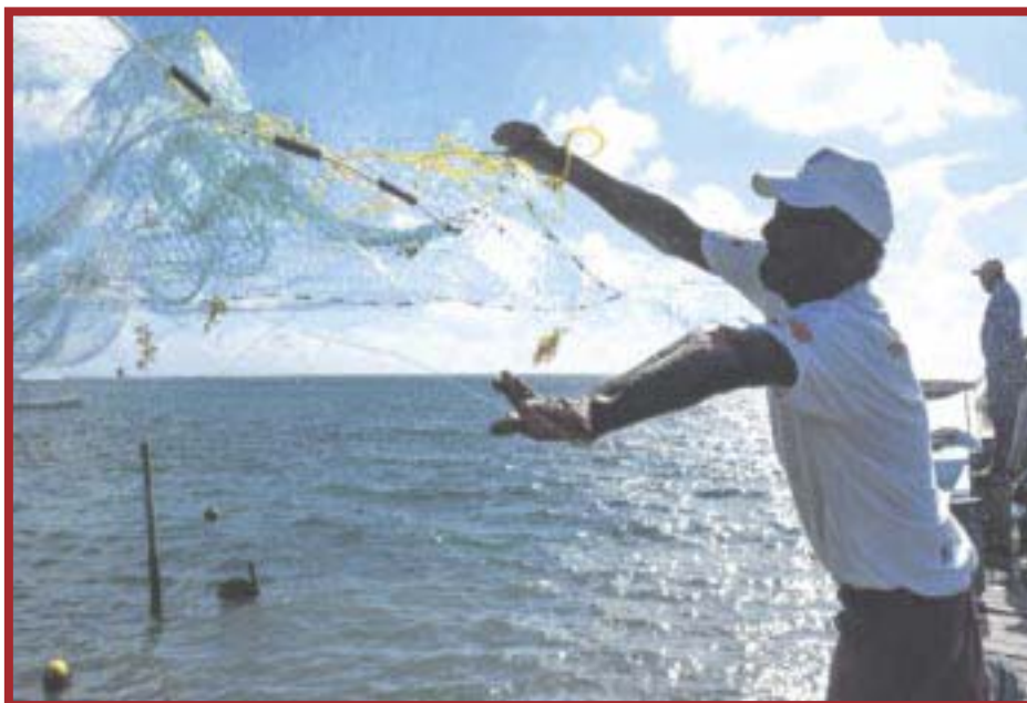
La “cuesta de enero” comienza a causar estragos entre todos los sectores económicos.

Turismo de Quintana Roo (Sedetur), informó que durante 2021, llegaron a la entidad 12 millones 548 mil 582 turistas, predominando los visitantes extranjeros sobre el mercado nacional, siendo Cancún y la Riviera Maya los destinos con mayor afluencia de paseantes.