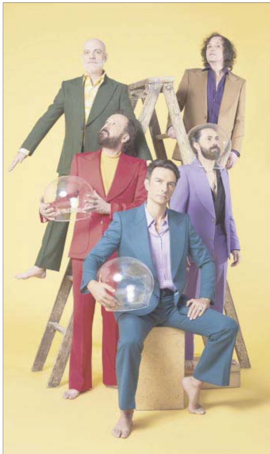
A más de un año del estreno de su último material discográfico, Fobia reinventó su sonido y revivió sus más grandes éxitos en formato desenchufado.

Dos años más tarde, 1995, gestaron Amor Chiquito , que fue producido por Gustavo Santaolalla y Aníbal Kerpel. Aquí, el grupo mostró una gran madurez y creatividad. Canciones como Revolución sin manos , Descontrol , Vivo , Hipnotizame y Veneno vil fueron bien recibidas por los fans y la crítica especializada.