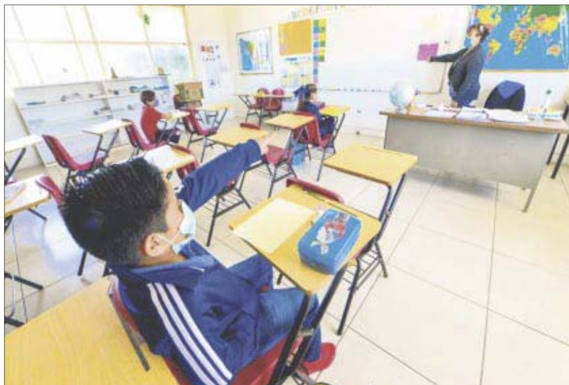
El regreso a clases presenciales se complica por rebrote de Covid-19 y semáforo amarillo en el estado.

Hay que recordar que durante las fiestas decembrinas es justo cuando se provocó este rebrote de Covid-19, que corresponde principalmente a ca-