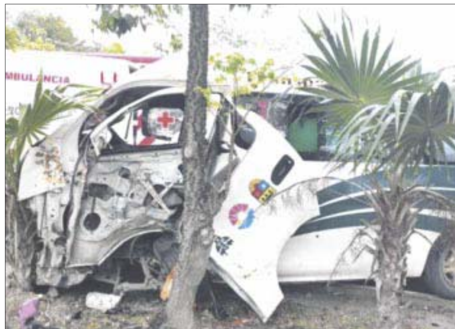
Durante los primeros cinco días de este mes de enero, se reportaron al menos 30 accidentes de tránsito en Cancún.