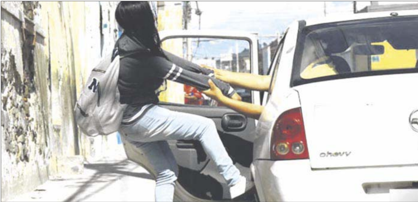
Un total de 43 personas, entre hombres y mujeres, fueron secuestrados en distintos puntos de Cancún a lo largo de 2021.

Según el reporte del Secretariado Ejecutivo del Sistema Nacional de Seguridad Pública, hasta noviembre, en el estado se habían abierto 889 carpetas de investigación por delitos contra la libertad personal, 13 fueron por secuestro y 11 más por extorsión.