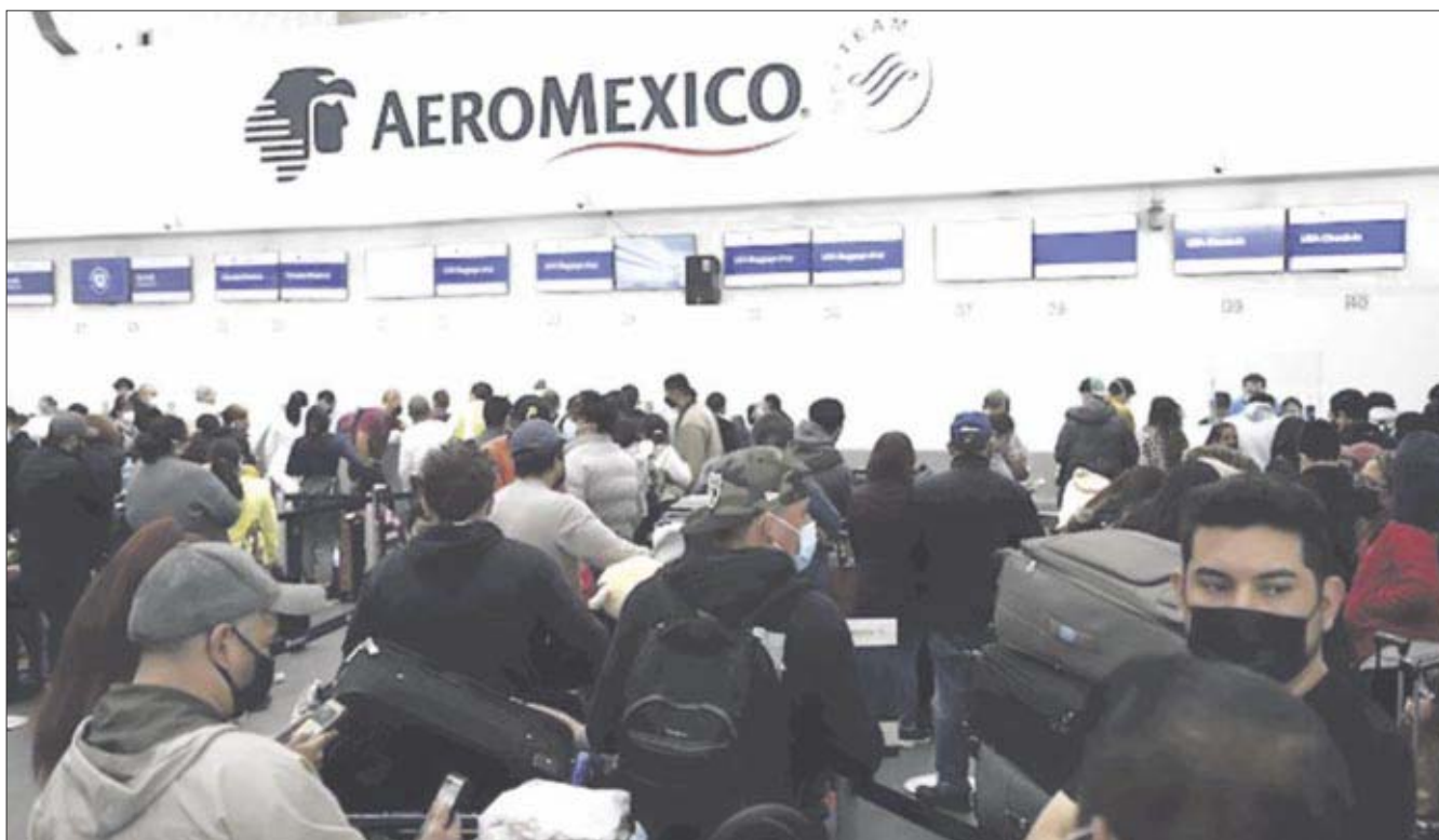
Aeroméxico anuncia la cancelación de vuelos por un presunto brote de Covid entre sus trabajadores.

El repunte de Contagios ya comienza a resentirse en todos los sectores, desde el económico con la entrada en vigor del semáforo amarillo y sus restricciones, hasta el turismo y obviamente el de la salud, pues aunque la mayoría no son casos graves, sí representan un riesgo de más hospitalizaciones.