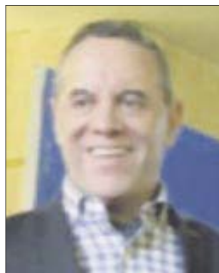
Por José Luis Montañez