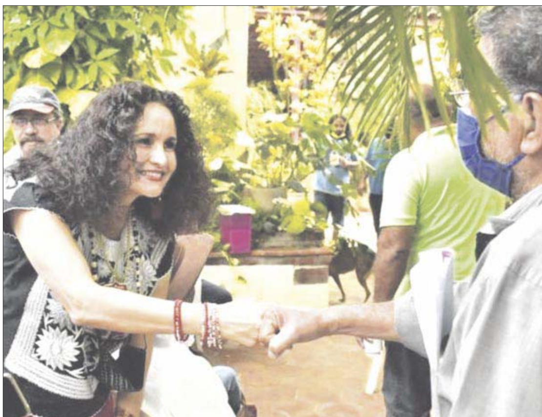
La senadora morenista Susana Harp se inconforma.