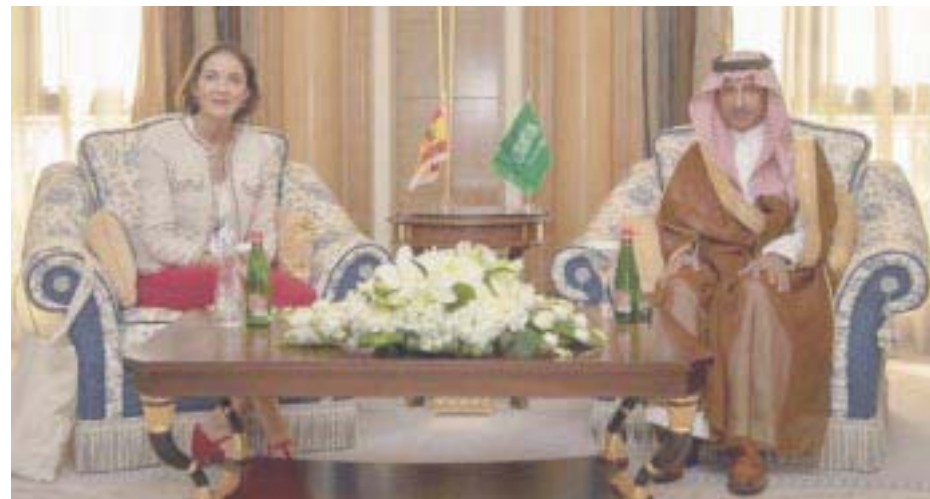
España y Arabia Saudita encabezan nuevo grupo de trabajo.

En tanto, el ministro de Turismo de Jamaica, Edmund Bartlett , comentó: “esto marca un paso crítico hacia un futuro nuevo y más brillante para la OMT. Esta organización tiene un papel crucial que desempeñar, y solo tendrá éxito con el pleno apoyo y compromiso de