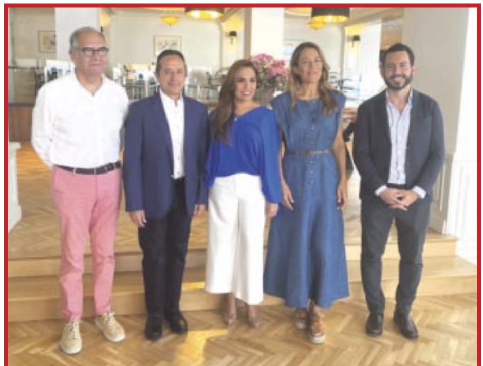
Acompañaron al gobernador y a la mandataria electa, el secretario de Turismo del estado, Bernardo Cueto Riestra; y el director general del Consejos de Promoción Turística de Quintana Roo (CPTQ), Darío Flota Ocampo.

Esta reunión transmite certidumbre y estabilidad a los inversionistas del sector turístico, ante la transición gubernamental en Quintana Roo, dejando de manifiesto que cuando se conjuga voluntad y trabajo en favor de un estado y de la sociedad es viable dar continuidad a las inversiones y al desarrollo de destinos como los que hoy tiene la entidad.