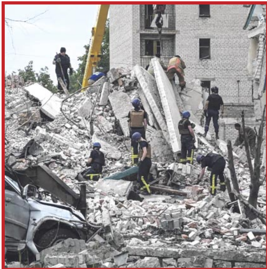
Se intensificaron los bombardeos en el este de Ucrania, donde al menos 15 personas murieron tras el impacto de un misil contra un edificio residencial en Chasiv Yar.

No es algo nuevo y el apagón del gas está siendo progresivo, al menos de momento. La empresa estatal rusa Gazprom ya ha reducido considerablemente los volúmenes de suministro a través del gasoducto de 1.200 kilómetros entre Rusia y el norte de Alemania, alegando retrasos en las obras de reparación.