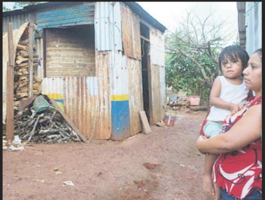
De acuerdo con el Inegi, en Chetumal cada vez hay más familias consideradas de “clase baja”.