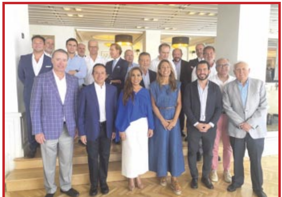
Carlos Joaquín González y la gobernadora electa, Mara Lezama Espinosa, en compañía del Embajador de México en España, Quirino Ordaz Coopel, se reunieron en Palma de Mallorca con inversionistas asociados en Iverotel.

Al cierre de la reunión los empresarios españoles establecieron su disposición para participar en acciones para la sustentabilidad social y ambiental en Quintana Roo.