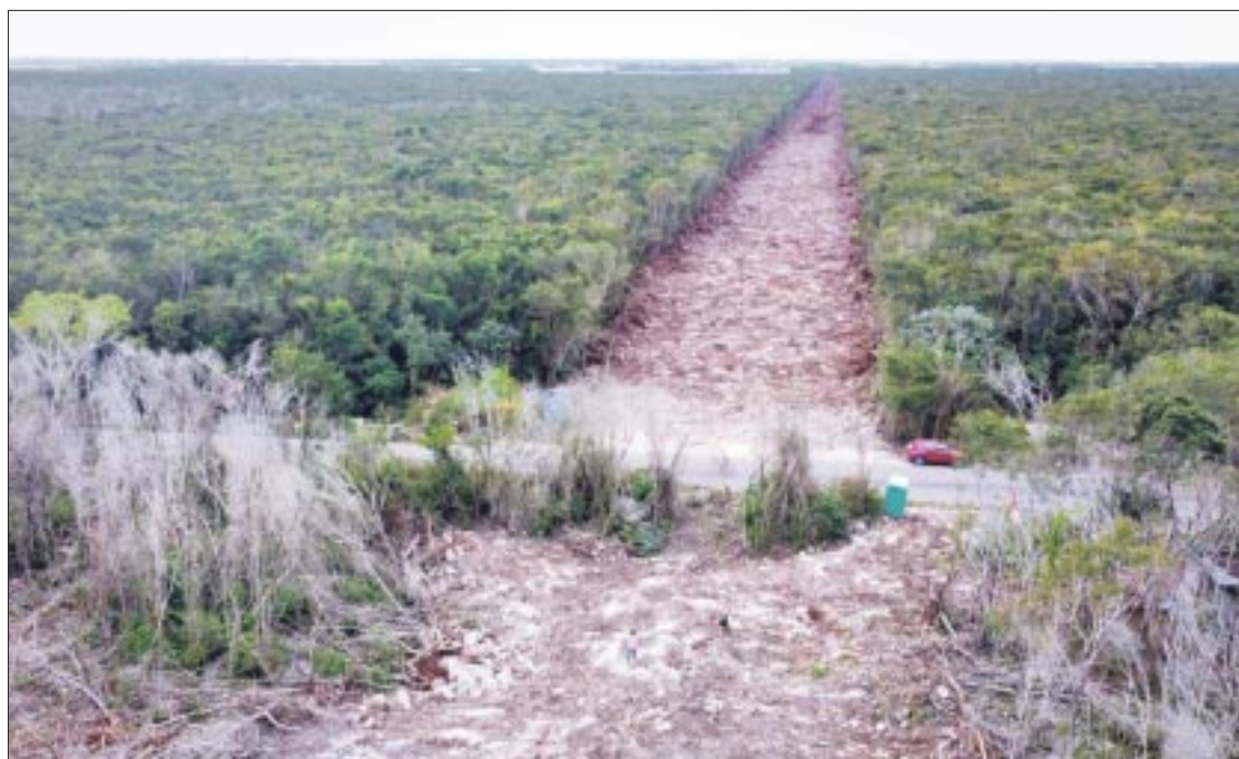
La audiencia de amparo que mantiene detenidas las obras del Tramo 5 sur del Tren Maya se pospuso hasta el 23 de julio.

Hay que recordar que este proceso para la resolución del amparo se ha venido alargando