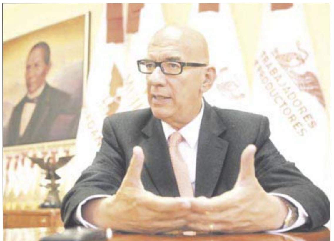
Pese a sus bajas votaciones, Movimiento Ciudadano, de Dante Delgado, anunció que iría solo para 2024.

El gobierno y las autoridades electorales han mostrado un gran paternalismo hacia los partidos, los que bajo todo tipo de argucias siguen participando, sin importar que pierdan el registro, reciben otra oportunidad. Afortunadamente, para 2024 no habrá apertura para nuevos partidos.