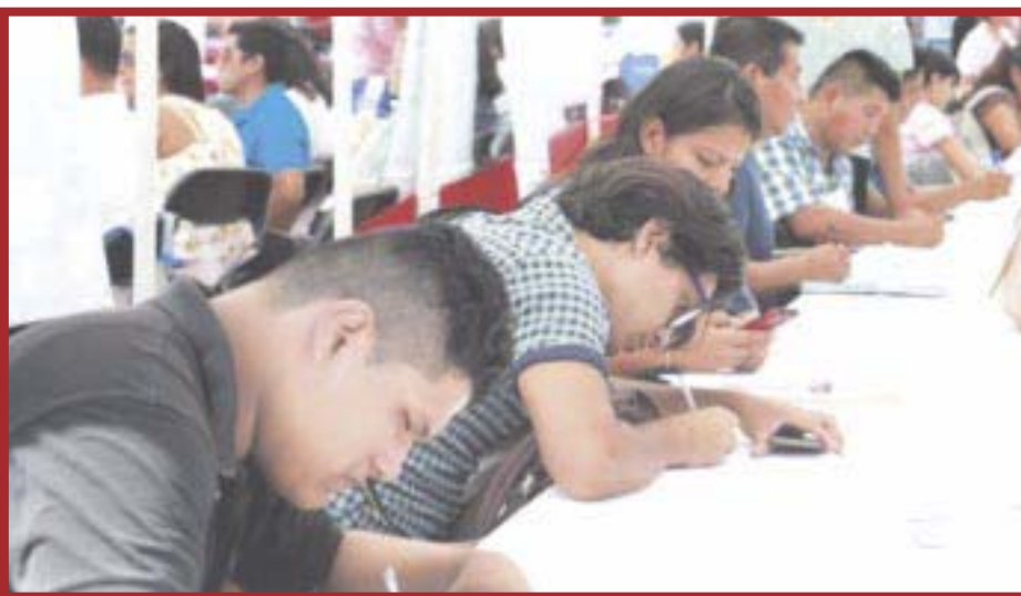
Capacitarán a jóvenes para que se puedan integrar de forma óptima al mundo laboral.

Luego de denuncias de diversas organizaciones dedicadas a salvaguardar los derechos de pacientes con VIH/Sida, Salud en Quintana Roo descartó el supuesto desabasto de medicamentos para atender a los pacientes, no obstante, sí reconocen que sufren una falta de personal para esta atención especializada.