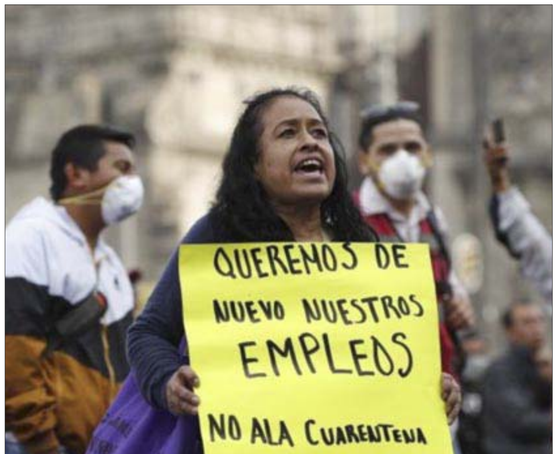
Hay temor de una nueva ola de contagios que trastoque nuevamente la estabilidad laboral y social.

* Lic. en Derecho por la UNAM. Lic. en Periodismo por la Carlos Septién. Conferencista. Experto en procesos de comunicación. Ex presidente de la Academia Nacional de Periodistas de Radio y Televisión, Miembro del Consejo Nacional de Honor ANPERT, con 50 años de experiencia en diversos medios de comunicación.