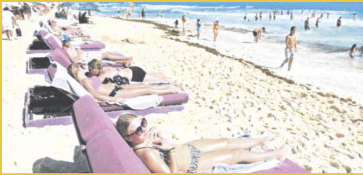
La Sedetur celebra la franca recuperación turística post Covid en el estado en 2022.

A dos años de la reapertura de actividades, tras la crisis sanitaria, el Caribe mexicano ha recuperado la economía, los empleos e incluso ha rebasado los niveles de afluencia turística registrados antes de la contingencia, según datos de la Secretaría de Turismo estatal.