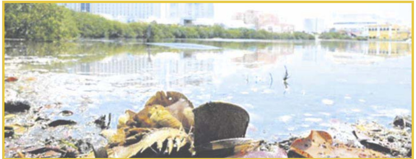
La asociación Pepenice, en la Laguna Nichupté, ha logrado recolectar durante tres jornadas, más de 400 kilos de basura.

La asociación realiza estas limpiezas de manera periódica, por lo que invitan a las personas a unirse y sanear este lugar, “es un Área de Protección de Flora y Fauna, por ello la importancia de que este