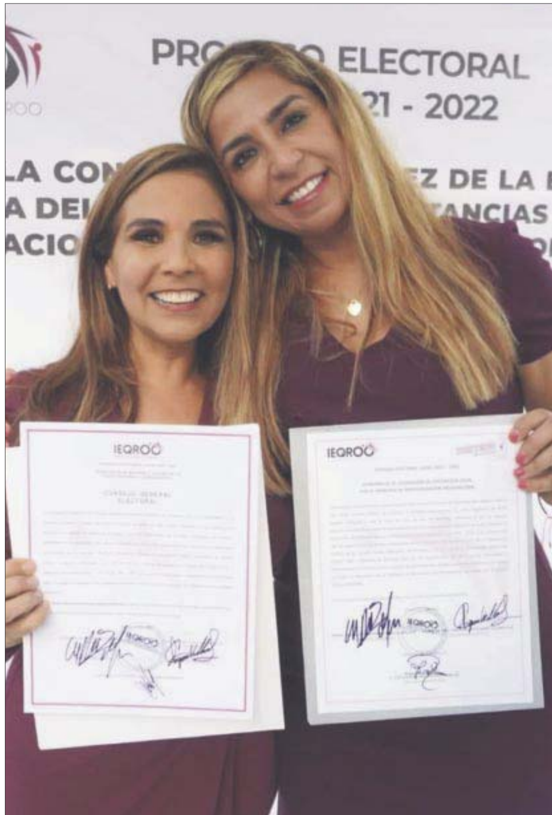
Mara Lezama recibió la constancia que le avala como la candidata con la mayor cantidad de votos para ser la próxima gobernadora del estado.

Asimismo, destacó que no sólo se ganó la gubernatura, sino que también hubo grandes resultados en el Congreso local, “arrasamos en las elecciones”, aseveró, celebrando que toda la coalición entre Morena, el Partido Verde (PVEM) y el Partido del Trabajo (PT), ahora