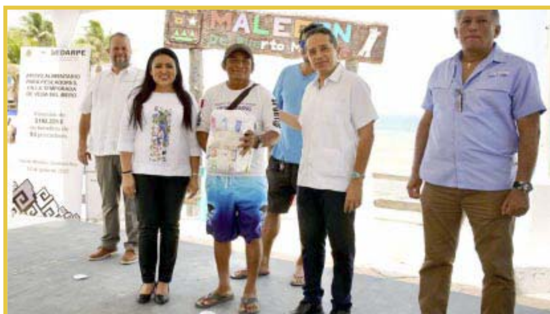
En el muelle principal del casco antiguo de Puerto Morelos, el gobernador Carlos Joaquín entregó apoyo alimentario a 93 pescadores de Puerto Morelos y de Cozumel.

antiguo de Puerto Morelos, el gobernador entregó apoyo alimentario a 93 pescadores de Puerto Morelos y de Cozumel, a fin de minimizar el impacto económico que enfrentan por la temporada de veda del mero.