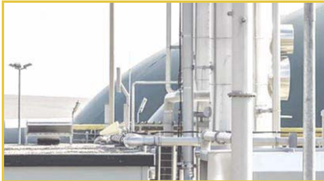
Sema de Quintana Roo presentará un programa para el aprovechamiento energético de residuos orgánicos.

sin fines de lucro que busca impulsar el desarrollo sustentable de la cadena de valor del sector biogás, a partir del aprovechamiento energético de residuos, mediante la colaboración, el desarrollo de capacidades y soluciones técnicas, la comunicación e