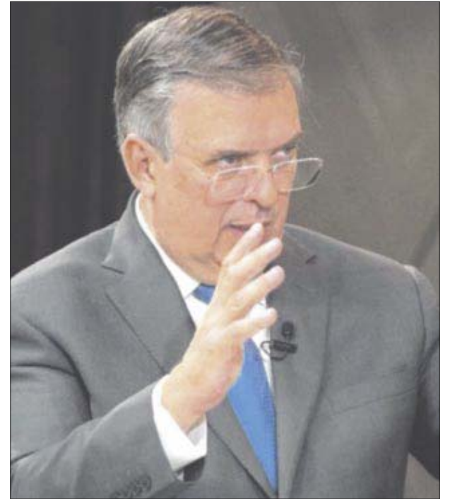
El canciller Marcelo Ebrard, aspirante a la candidatura presidencial por parte de Morena, pide que la encuesta interna sea creíble.

El canciller dijo que tiene firme su proyecto político, al ser cuestionado sobre la posibilidad de que en caso de que las encuestas de Morena no lo