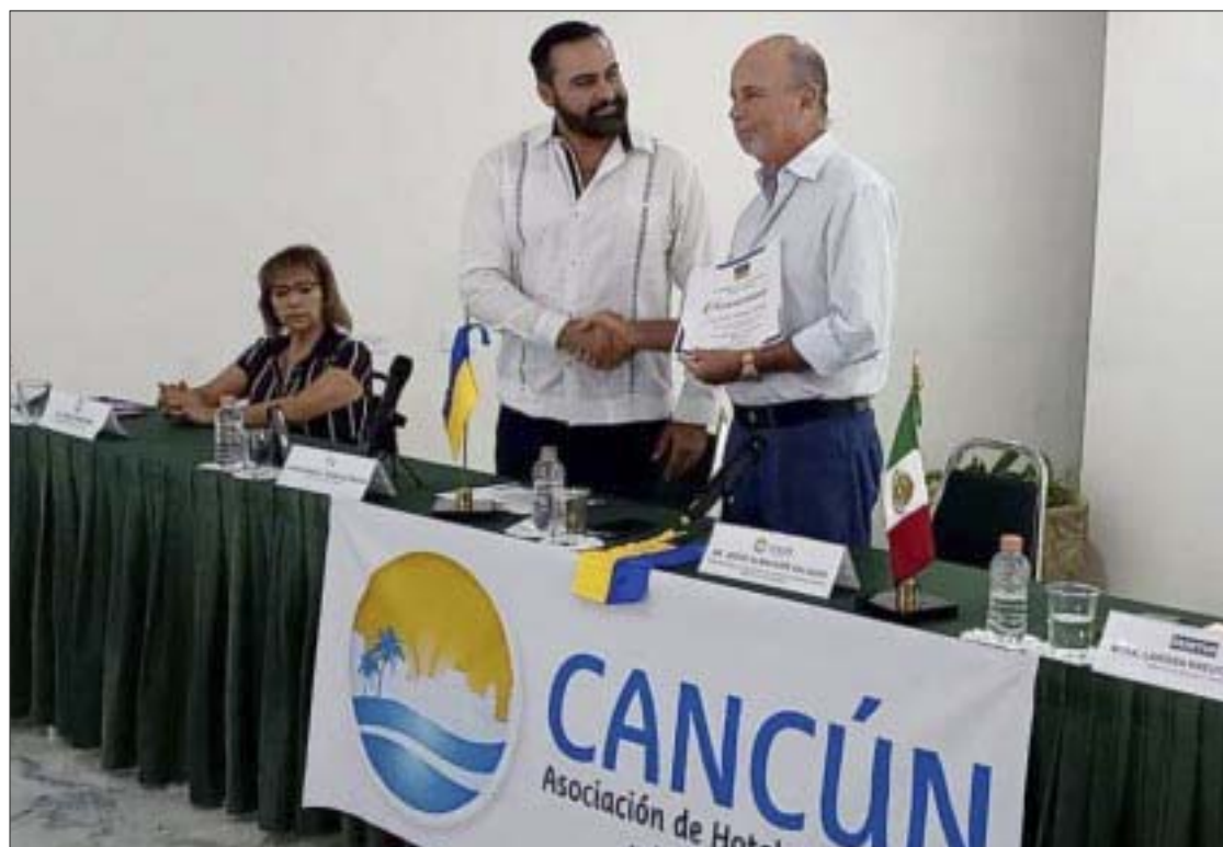
Representantes diplomáticos de Ucrania entregaron un reconocimiento a hoteleros de Cancún por su labor humanitaria en favor de turistas ucranianos varados