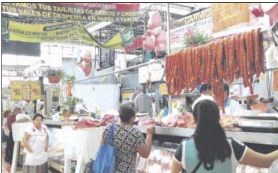
Ante los elevados precios de la carne, las amas de casa optan por comprar más verdura para surtir la despensa semanal.

Para lograr el botín, eligieron los contenedores con la mercancía que les interesaba y posteriormente los montaron en plataformas de tractocamiones para poder sacarlos del patio de la empresa y trasladarlos a un lugar cercano.