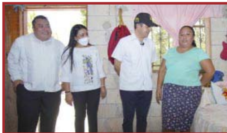
Carlos Joaquín destacó que las acciones sociales contribuyen al combate a la pobreza, a la disminución de la desigualdad y a generar más y mejores oportunidades.