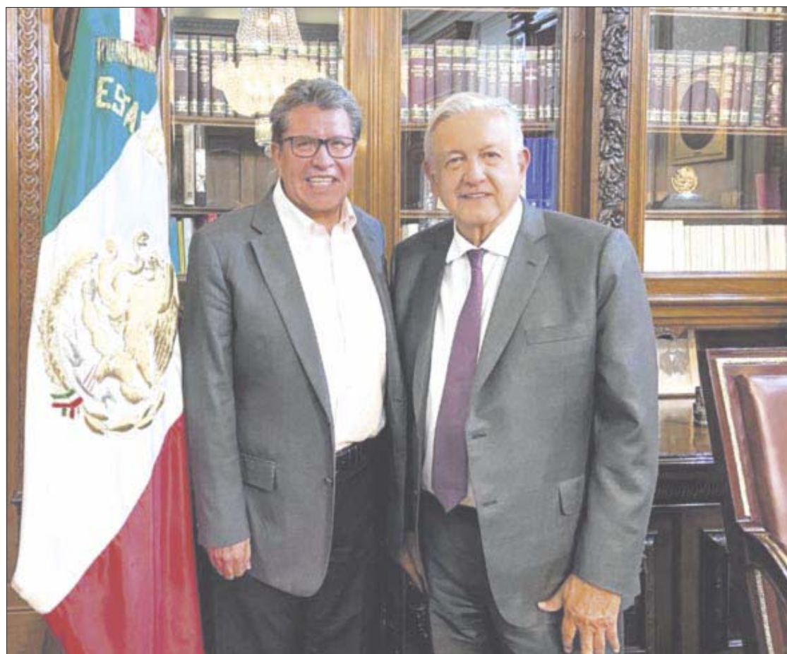
El senador morenista Ricardo Monreal Ávila y el presidente Andrés Manuel López Obrador.