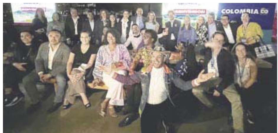
Empresarios colombianos y mexicanos en el inicio de la Semana de Colombia.

destacó que es innegable y de todos conocido que Colombia y México, cada día están creciendo más en su intercambio cultural, industrial y de servicios, entre otros, pero es aún más tangible e innegable lo que sucede en el área del turismo, donde día a día se suma interconectividad de destinos, lo que amplía el abanico de posibilidades para el viajero colombiano a México y el mexicano a Colombia.