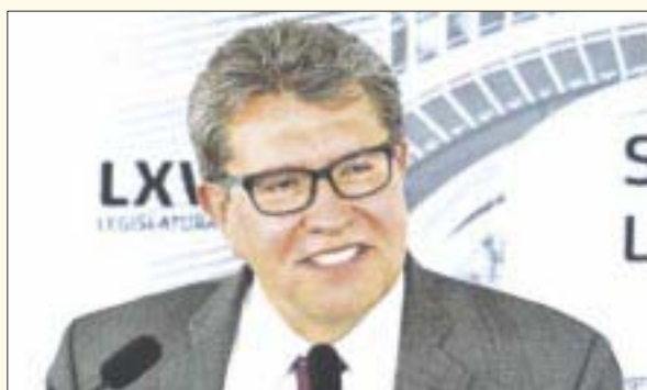
El senador morenista Ricardo Monreal advirtió que agotará su derecho que le asiste a participar en un proceso democrático por la candidatura presidencial, pero con piso parejo.

Ebrard rechazó que al momento haya sostenido algún tipo de conversación con el presidente Andrés Manuel López Obrador sobre la elección del candidato.