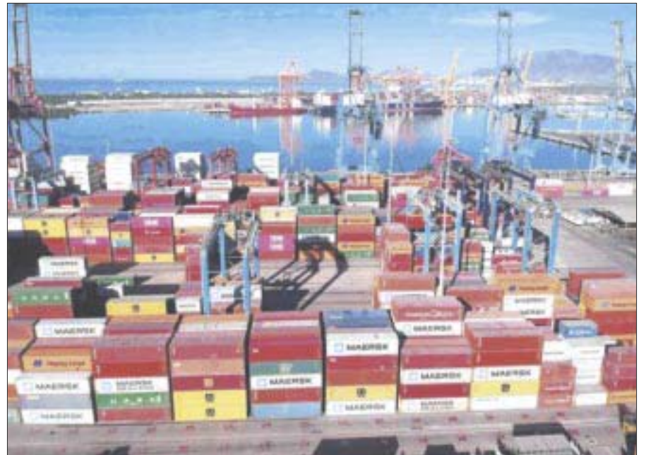
Autoridades confirmaron el mayor atraco de oro y plata en la historia de Manzanillo, el principal puerto comercial de México.