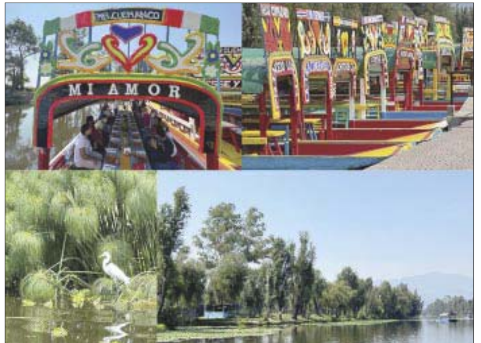
Desde Cuemanco a la Reserva Ecológica de Xochimilco.

Esos espacios destacan como lugares de importancia internacional pero, lamentablemente,