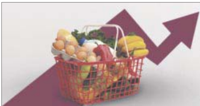
Los precios de la canasta básica continúan creciendo en Quintana Roo.