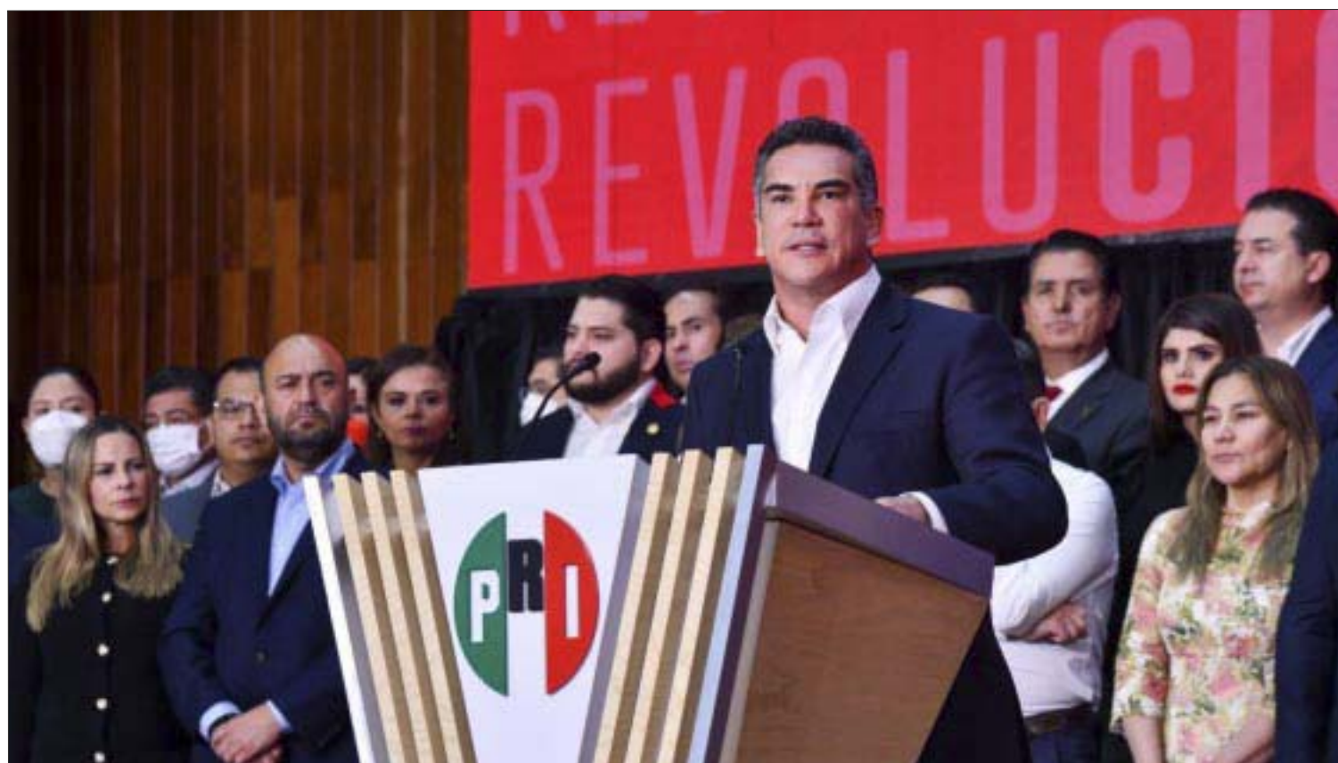
Ex dirigentes del PRI exigieron la renuncia de Alejandro Moreno.