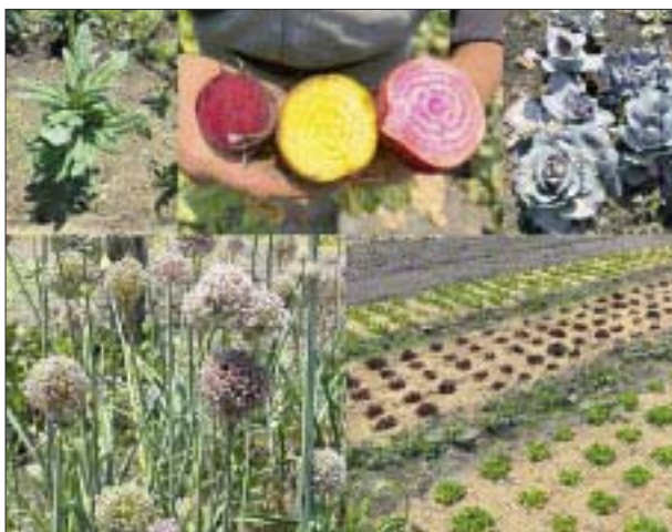
Los cultivos de la chinampa.

victoriagprado@gmail.com Twitter: @victoriagprado