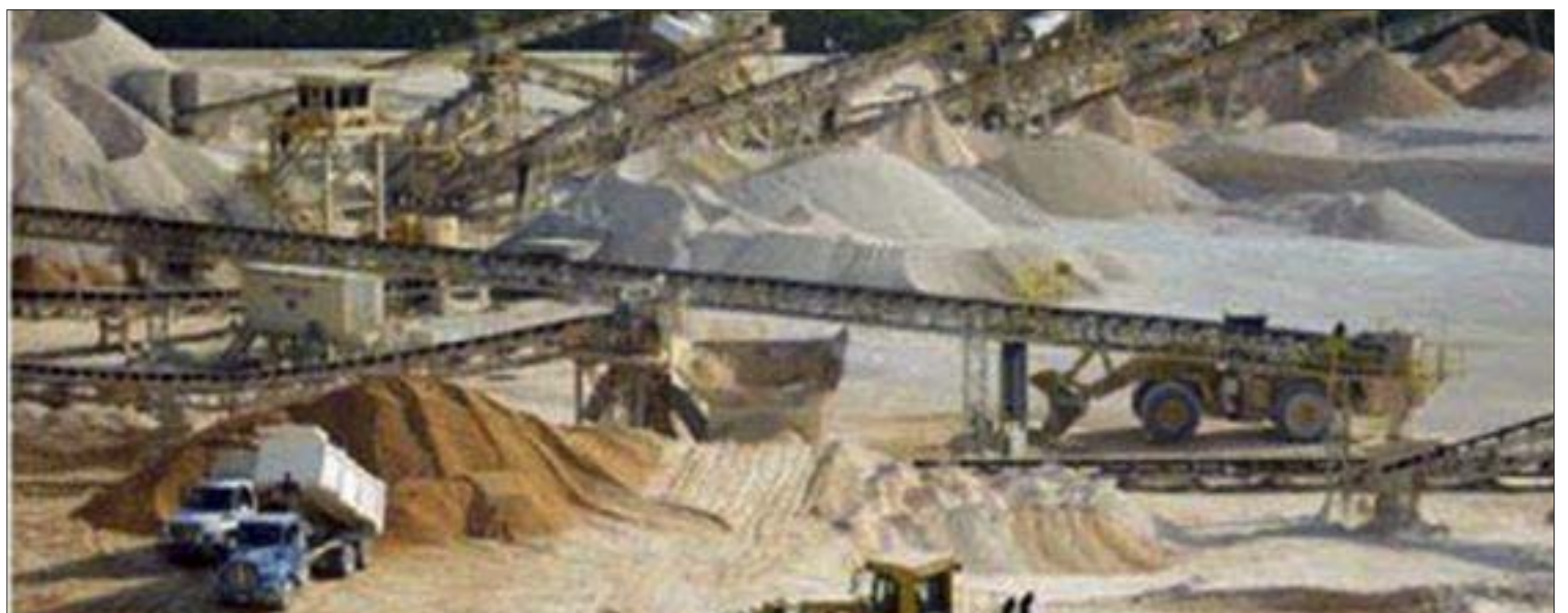
Vulcan Materials Company

* Lic. en Derecho por la UNAM. Lic. en Periodismo por la Carlos Septién. Conferencista. Experto en procesos de comunicación. Ex presidente de la Academia Nacional de Periodistas de Radio y Televisión, Miembro del Consejo Nacional de Honor ANPERT, con 50 años de experiencia en diversos medios de comunicación.