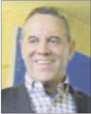
Por José Luis Montañez

Durante poco más de dos décadas la fundación Teletón México hizo felices a miles de hogares, por medio de sus clínicas, establecidas a lo largo y ancho de todo el país, construidas, por cierto, con el financiamiento de colectas nacionales, en las que el actor destacado siempre ha sido el pueblo de México.