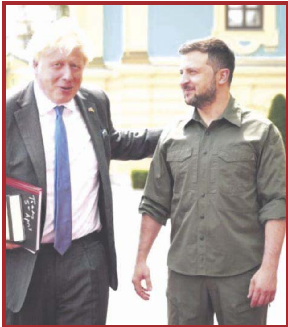
Boris Johnson , primer ministro de Gran Bretaña realizó su segunda visita sorpresa a Ucrania, donde se reunió con Volodimir Zelenski.

Los 27 miembros de la UE deberán dar su luz verde de forma unánime. Pero los líderes de las principales economías europeas -Alemania, Francia e Italia - ya expresaron su apoyo total en un viaje a Ucrania el jueves.