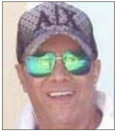
Por José Luis Montañez