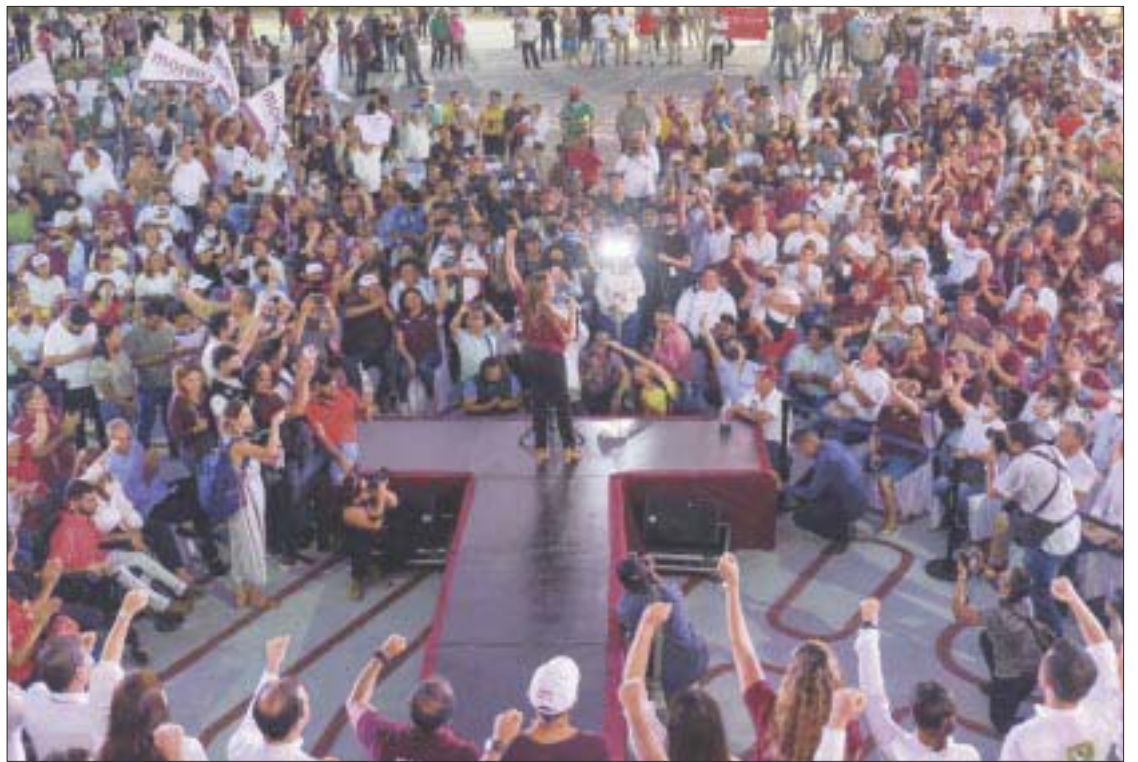
Mara Lezama, gobernadora electa de Quintana Roo, concluyó en Cancún su gira de agradecimiento.

Finalmente, reconoció que hay mucho trabajo por hacer y no hay tiempo que perder, por lo que convocó al Nuevo Acuerdo por el Bienestar y Desarrollo de Quintana Roo, como lo ha hecho en cada una de sus paradas durante su campaña y posteriormente en esta gira de agradecimiento que ya