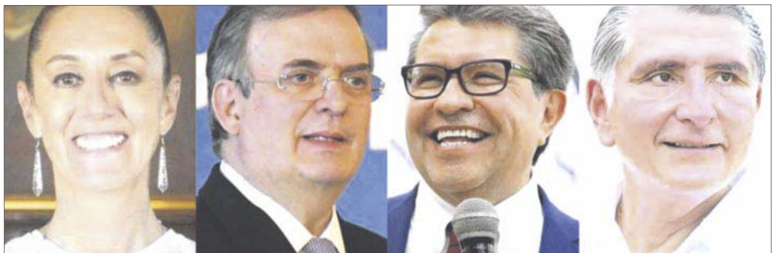
Los nombres de Claudia Sheinbaum, Marcelo Ebrard, Ricardo Monreal y Adán Augusto López son repetidos con gran insistencia.