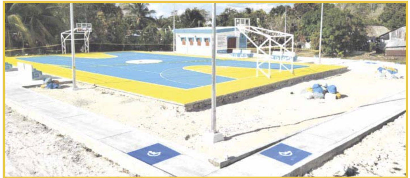
Entregan la construcción finalizada de un módulo comunitario y espacio de usos múltiples en la localidad de La Unión en Chetumal.

A fin de mejorar el tránsito de automóviles en las principales avenidas en la capital de Quintana Roo, la Secretaría de Obras Públicas anunció el inicio de la obra de Modernización de cruceos vehiculares mediante la implementación de semaforización y obras adicionales en la ciudad de Chetumal