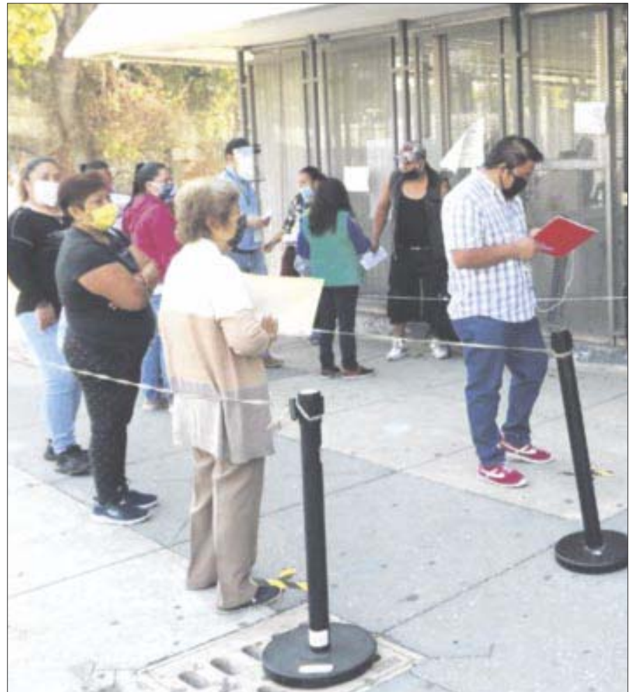
La informalidad, el lastre económico de México, mostró un avance importante en mayo, según encuesta de Inegi.

En el caso de los alumnos que tuvieron una comunicación intermitente o inexistente durante el ciclo escolar 2021-2022, las calificaciones de dicho curso se asientan en la boleta al término del periodo extraordinario de recuperación, con las calificaciones obtenidas en el último.