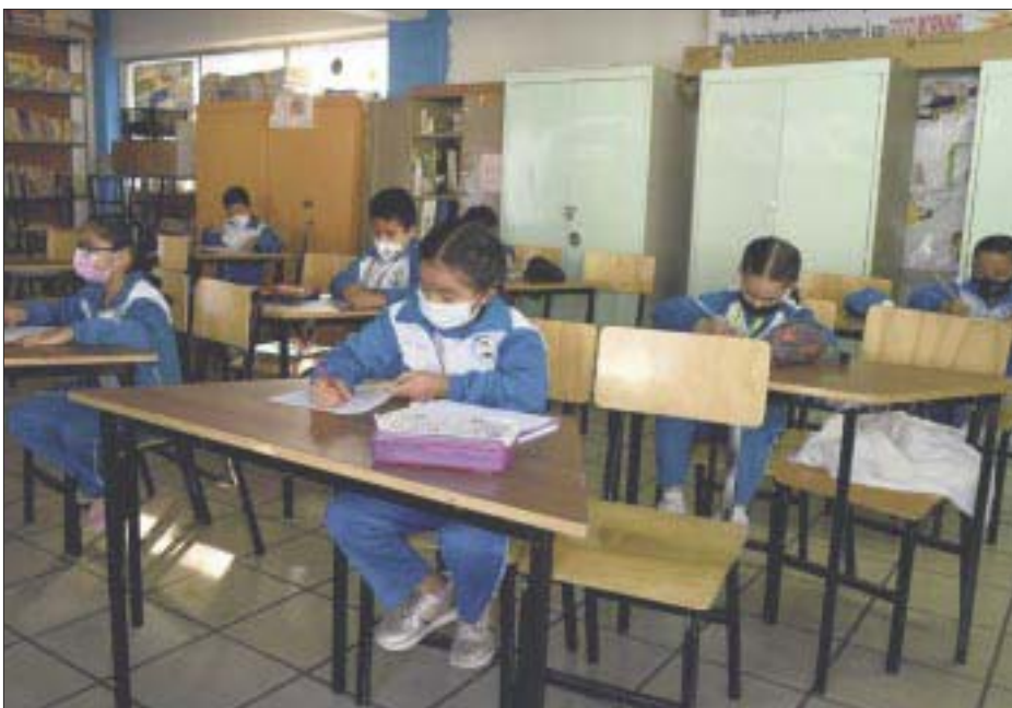
La SEP ordenó que ningún alumno de primaria y secundaria podrá tener una calificación menor a 6, en este ciclo escolar.

La población subocupada, es decir, quienes declararon tener necesidad y disponibilidad para trabajar, se ubicó en 8,37%, una disminución de 0,4% respecto al mes pasado, pero que representa 4,8 millones de personas en el limbo del empleo. Las mujeres siguen siendo el grupo más vulnerable, con una tasa de desocupación de 3,5% en contraste con el 3,3% de los hombres al finalizar mayo de 2022.