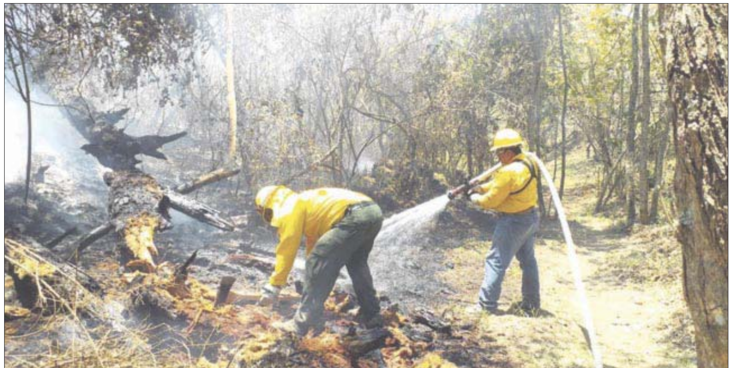
La Conafor reportó tres incendios forestales, que se han registrado en la actual temporada y han afectado más de 83 hectáreas.

“Esperamos tener en los próximos días un control total, al igual que la liquidación; por el momento están trabajando en puro combate directo