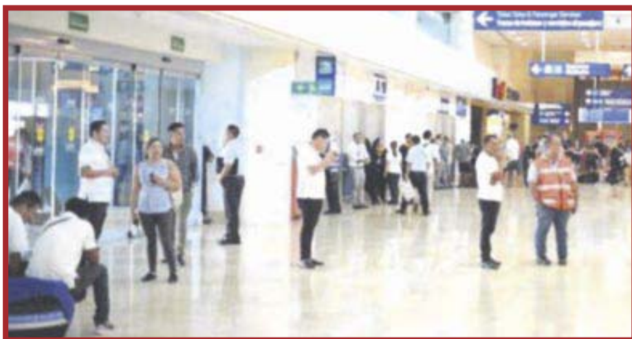
El Aeropuerto Internacional de Cancún cerró 2021 con 22.3 millones de viajeros movilizados.

El Aeropuerto Internacional de Cancún es el segundo con el mayor tráfico de pasajeros a nivel nacional, detrás del Aeropuerto Internacional de la Ciudad de México, donde reportaron un total de 6.2 millones de pasajeros transportados, es decir, el 42.4% del total de viajeros, entre enero y febrero.