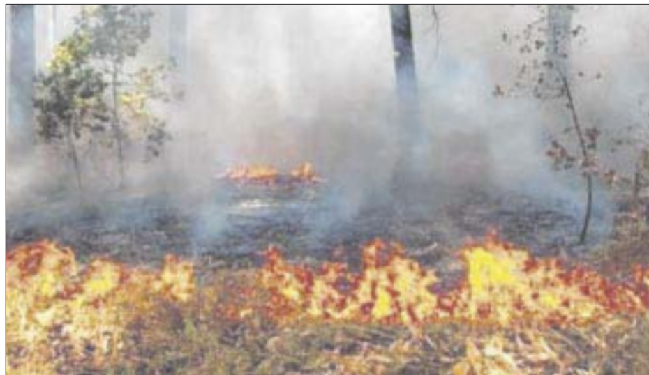
La Sema reconoce que hasta ahora no hay ningún detenido relacionado con los incendios provocados en los diferentes puntos de la entidad.

Finalmente, recordó que a la fecha, el último predio que ha entrado en veda a consecuencia de un incendio forestal, del cual se les solicitó el apoyo como Sema, ocurrió en el 2008, y fue en Cancún de una superficie menor a las mil hectáreas.