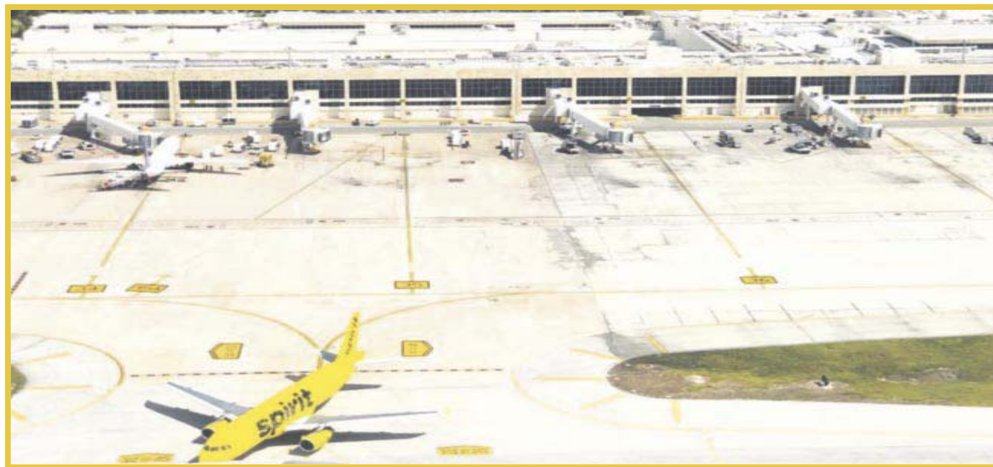
Durante enero y febrero, Cancún aportó 4.3 millones de viajeros al tráfico aéreo nacional.

Sin embargo, el Aeropuerto Internacional de Cancún es la terminal de mayor volumen a nivel nacional en viajeros internacionales movilizados entre enero y febrero de 2022, pues en ese periodo su tráfico de viajeros foráneos fue de 3 millones, es decir, 1.1 millones más respecto de los 1.9 mi-