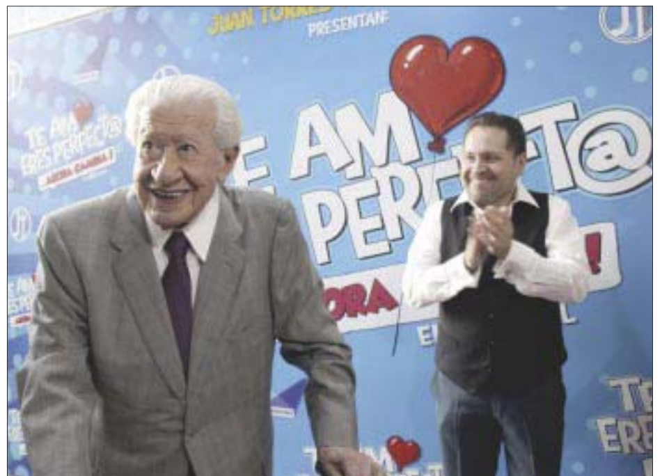
A su arribo al Teatro Hidalgo, el primer actor Ignacio López Tarso expresó su amor a tan emblemático escenario.