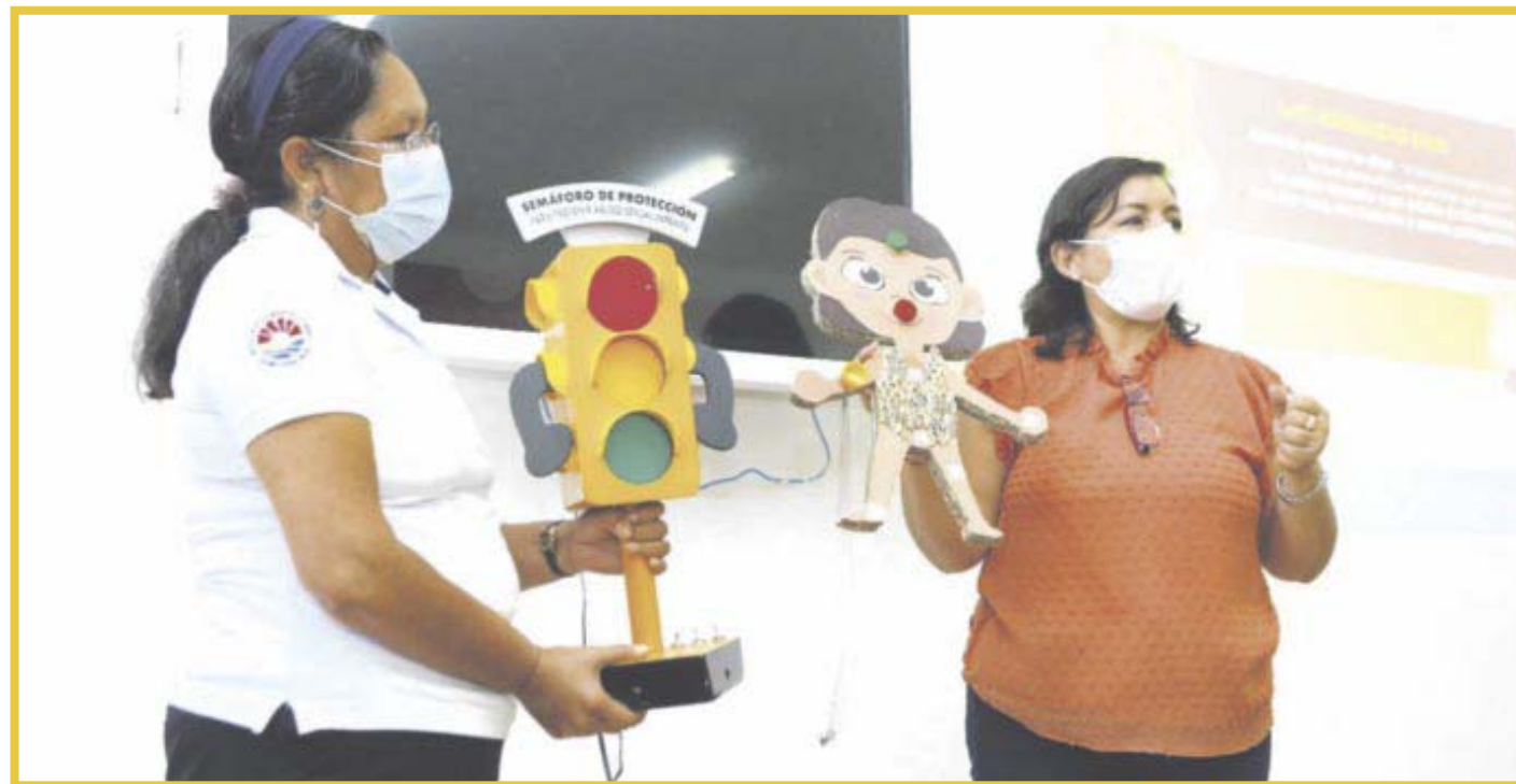
DIF Q. Roo implementa acciones de Prevención de Abuso Sexual Infantil, Prevención de Acoso Escolar y Prevención de Trata de Personas.

Cabe mencionar, que esta capacitación se ha