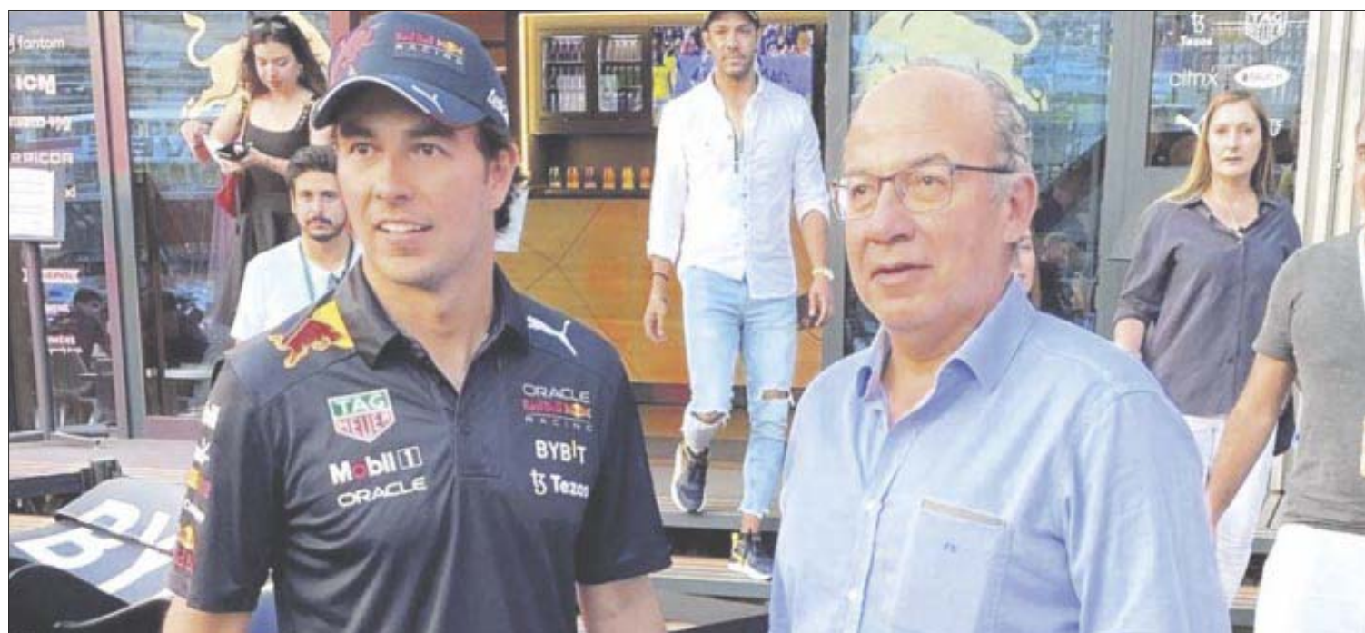
A "Checo" Pérez se le cuestiona su relación con Felipe Calderón Hinojosa, cuando éste es el principal adversario del actual Presidente.