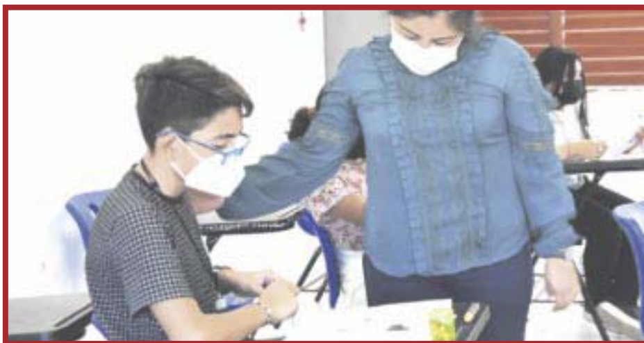
La SEQ evalúa a los estudiantes dentro de la segunda etapa del concurso de la Olimpiada del Conocimiento Infantil.

Autoridades estatales y municipales afirman que la capacitación a personal tiene como objetivo sensibilizar y prevenir sobre este problema social, que sin duda preocupa a toda la población y familias quintanarroenses, para garantizar la seguridad y calidad de vida de niños y adolescentes.