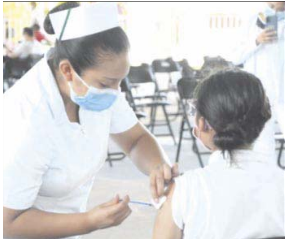
Esta semana se dispuso como sede el Hospital Militar de Chetumal para aplicar dosis anti-Covid-19 a los rezagados mayores de edad.

Con esto se da una nueva oportunidad a la población de Chetumal y varias localidades del municipio de Othón P. Blanco, para poder protegerse del Covid-19, que cabe destacar, aún se mantiene en estado de pandemia en el mundo, ya que la epidemia no ha sido determinada por las autoridades de salud en ningún punto del globo terráqueo.