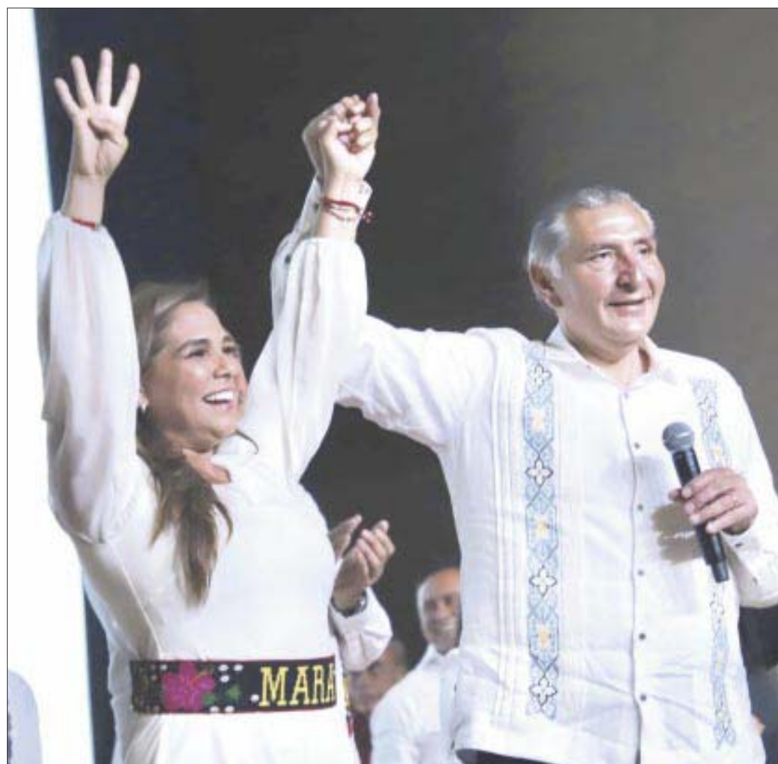
Adán Augusto López, secretario de Gobernación, acudió a Quintana Roo para brindar su apoyo a Mara Lezama Espinosa, candidata de Morena al gobierno del estado.

También de forma hilarante comentó. “Mara tiene los tamaños, así como la Ven de chi-