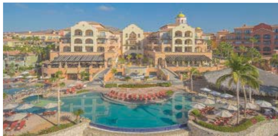
El inmueble en Los Cabos.

vertido en el lugar ideal para los viajeros cuando se habla de disfrutar Los Cabos, pues con 542 habitaciones y suites, cada una con terraza privada ha sido reconocido por mantener los más altos estándares de hospitalidad.