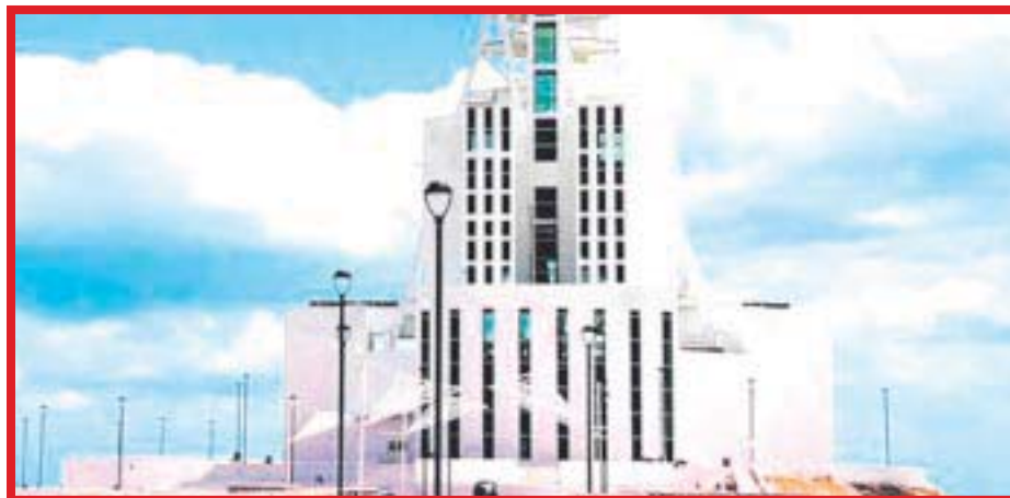
Descartan Torre del Mestizaje , en Boulevard Bahía, para el traslado de Sectur a Chetumal, pues no hay recursos

“Me enteré por el Reforma que ya nos había demandado Grupo México. Entonces le pregunté al secretario de Gobernación, porque él fue el que me dijo que no había ningún problema. Le digo ‘pues no es como te dijeron’ y ya volvió a hablar y que sí aceptan el acuerdo”, concluyó y reiteró que la inauguración del proyecto sigue vigente para diciembre del próximo año.