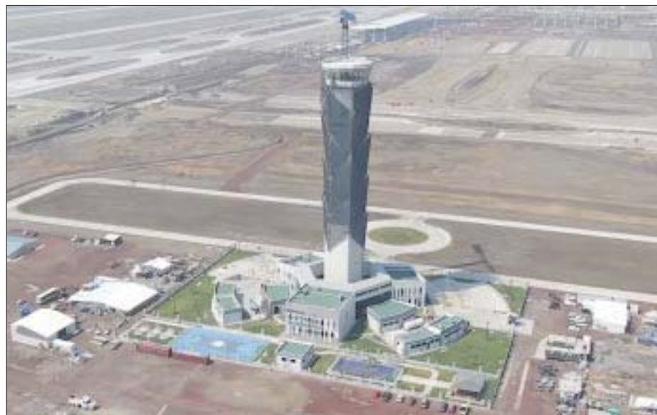
La industria aérea nacional atraviesa por momento clave.

Obtener dicha certificación es muestra de que Hacienda del Mar Los Cabos Resort , es propiedad comprometida 100 por ciento con la diversidad, y nos hemos con-