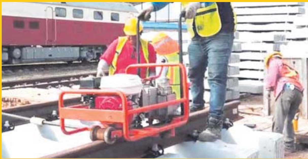
El presidente López Obrador, afirmó que ya se ha logrado un acuerdo con Grupo México sobre sus trabajos en el Tramo 5 del Tren Maya.

Se logró un acuerdo con Grupo México en relación al retiro del contrato para la construcción del Tramo 5 del Tren Maya, y es que la empresa argumenta que sólo está pidiendo el “finiquito correcto” por los trabajos que prestaron al proyecto, declaró el presidente Andrés Manuel López Obrador durante su conferencia mañanera.