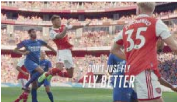
‘Lovers of Sport’ con la aerolínea de los Emiratos Árabes.

La histórica FA Cup también está patrocinada por la línea aérea al igual que la Confederación Asiática de Fútbol y tiene fuerte presencia en otros deportes de primera línea mundial, como el tenis, golf, rugby y las carreras de caballos.