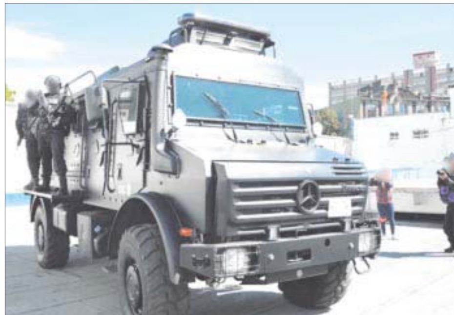
Desmantela la policía de la CDMX una célula de la Unión Tepito que se dedicaba a la extorsión de comerciantes en las alcaldías Cuauhtémoc y Venustiano Carranza y a reclutar sicarios.

Precisó que Ómicron y la nueva variante Xibalbá se mantienen porque hay personas que no se han vacunado, “pero la permanencia de Ómicron no representa una nueva alarma sanitaria”.