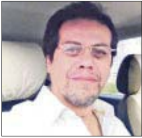
Por Mauricio Conde Olivares