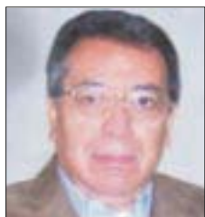
Por Roberto Vizcaino