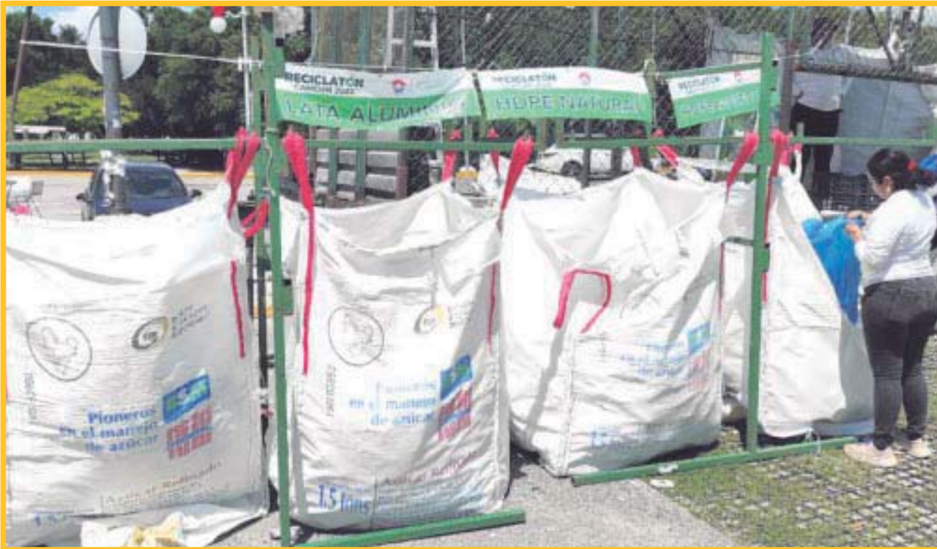
Celebran la décimo sexta jornada del programa Reciclatón para crear conciencia ciudadana en la separación de los desechos.

De acuerdo a la Dirección de Ecología, en lo que va del año se han recolectado 283 mil 625 kilos de residuos reciclables, gracias a la participación de 18 mil 696 personas. Cabe señalar que, durante la última edición, se acopiaron 10 mil 829 kilogramos de residuos.