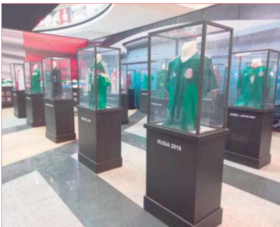
Los diferentes jerseys del seleccionado nacional son uno de los principales atractivos en esta edición.