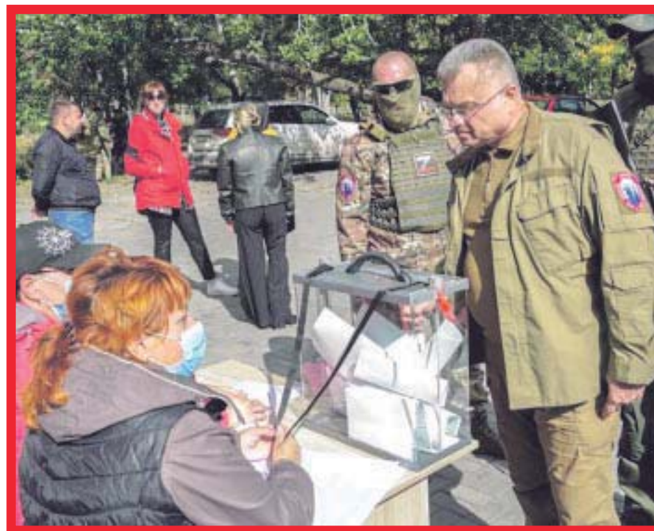
Antony Blinken , jefe de la diplomacia estadounidense, aseguró que Estados Unidos y sus aliados “nunca reconocerán” la anexión de territorio ucraniano por parte de Rusia.

“Es importante recordar lo que está pasando aquí. Rusia invadió Ucrania, se apoderó del territorio y realiza un esquema diabólico en parte del territorio tomado, de donde desplazó a la población local”, dijo. Algunas personas son objeto de deportaciones y otras “simplemente desaparecen”, agregó el secretario de Estado. “Luego traen rusos, instalan gobiernos títere y realizan el referendo y manipulan, en cualquier caso, el resultado para luego afirmar que el territorio pertenece a Rusia”, indicó.