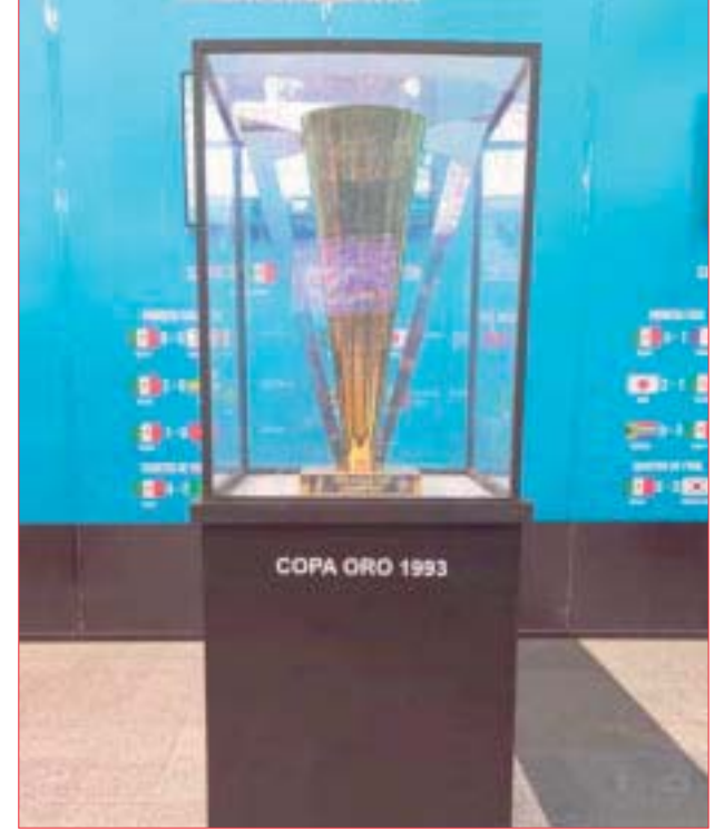
La Copa de Oro de 1993 es parte de las vitrinas de esta gran exposición.

Unidos y Canadá en el año 2026. Y esperemos que así sea, pues lamentablemente, México ha puesto en riesgo su participación después de los hechos violentos en el estadio Corregidora en Querétaro recientemente, además de que no se ha podido erradicar el grito “homofóbico” de las gradas por parte de los aficionados mexicanos.