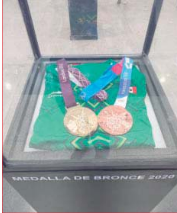
Medallas de obtenidas en las olimpiadas son exhibidas para deleite de los asistentes.