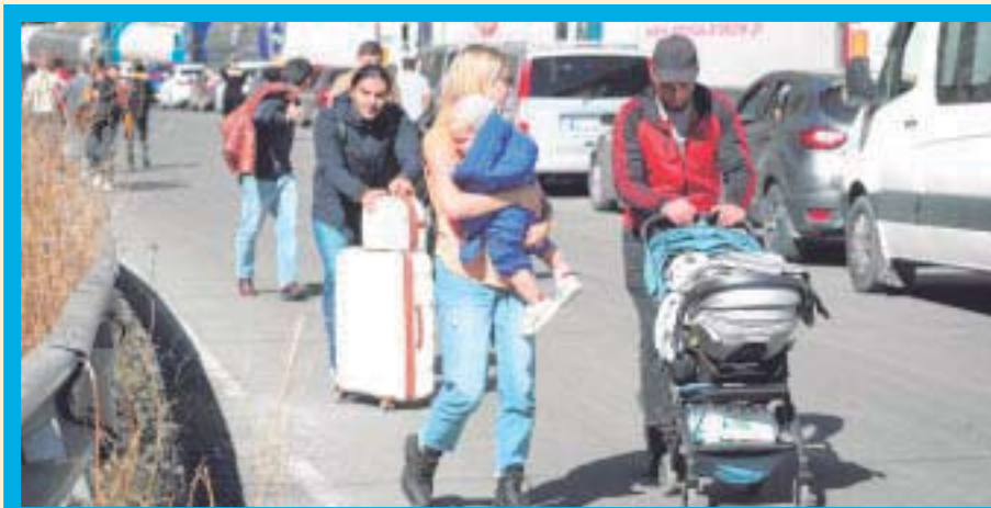
Familias enteras abandonan Rusia hacia Georgia, el país vecino, para evitar que los hombres sean enviados a la guerra en Ucrania.

Mientras tanto, en el pueblo de Stepantsminda, algunos georgianos hacen su agosto.