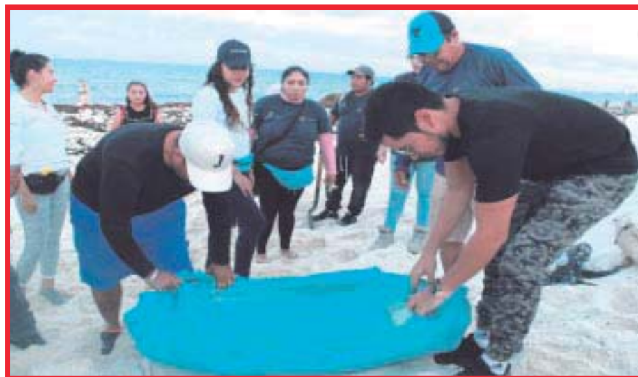
Resguardan nidos de tortuga marina en los campamentos tortugueros instalados en playa Delfines y Marlín.

Además de las brigadas municipales que salieron a realizar estas instalaciones, en los hoteles se llevaron a cabo acciones preventivas similares, permitiendo que de manera conjunta se fortalezca la seguridad de 54 corrales de protección; aunado a una jornada de liberación de tortugas que se realizó bajo las mejores condiciones.