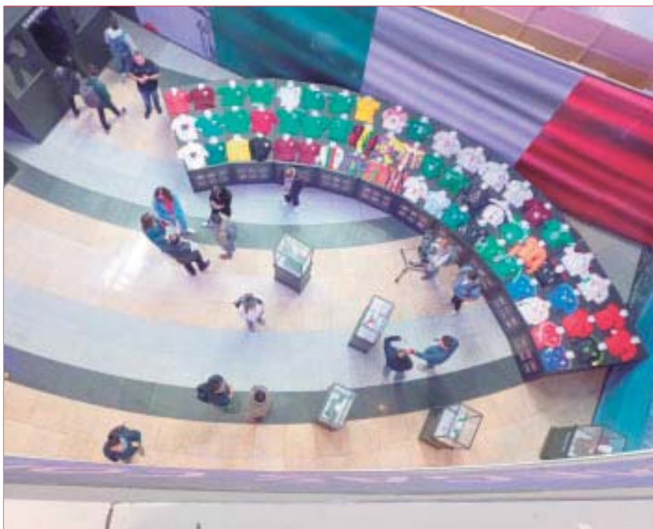
El museo reúne las playeras del seleccionado nacional de todas las épocas de gloria.

*** Desde el 1 de octubre podrás disfrutar de esta memorabilia futbolera