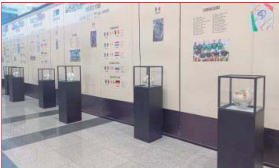
Los balones con los que se han jugado los partidos mundialistas, también son parte de esta gran colección.