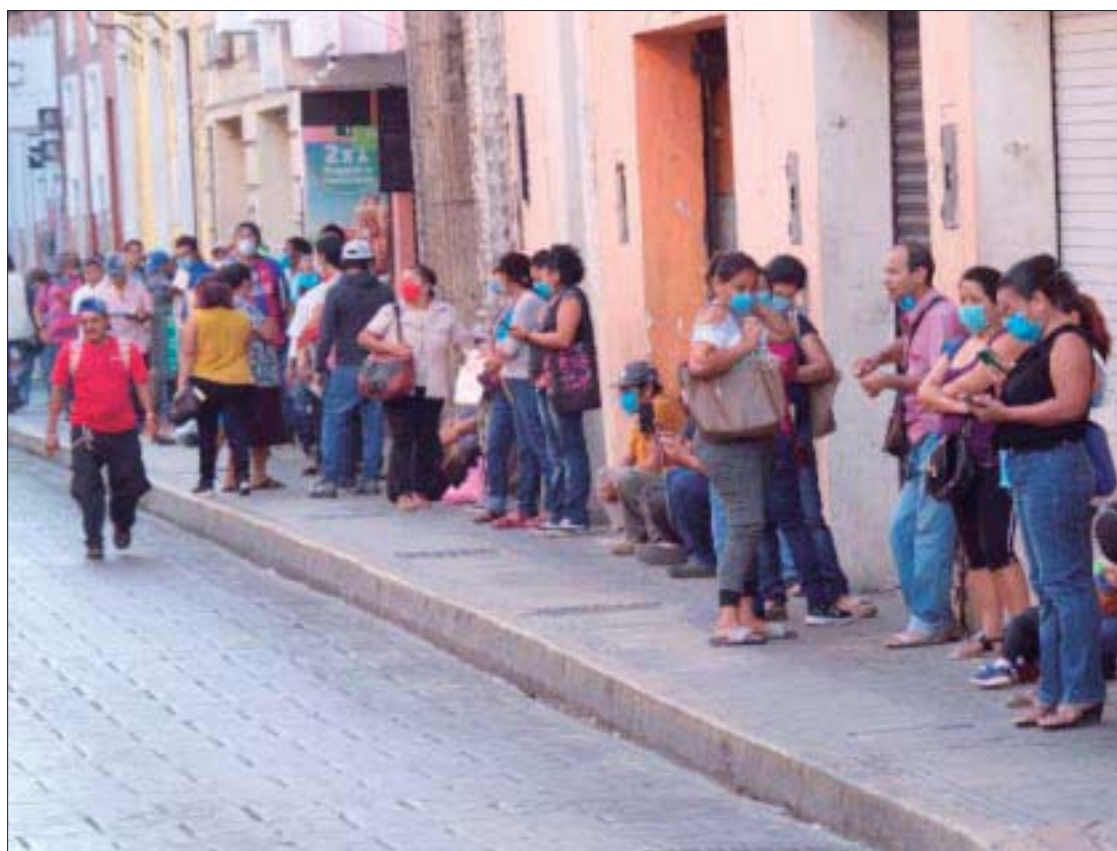
En grandes zonas del país se padece desempleo y una desigual distribución del ingreso.

* Lic. en Derecho por la UNAM. Lic. en Periodismo por la Carlos Septién. Conferencista. Experto en procesos de comunicación. Ex presidente de la Academia Nacional de Periodistas de Radio y Televisión, Miembro del Consejo Nacional de Honor ANPERT, con 50 años de experiencia en diversos medios de comunicación.