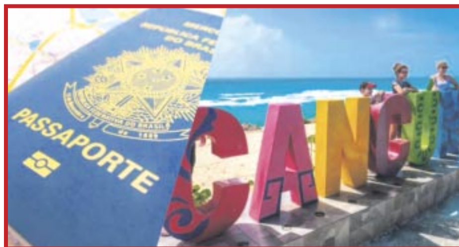
Sedetur informó que continúan las reuniones con la Cancillería y que ya hay avances en el tema del visado electrónico para los turistas de Brasil.

La situación ha sido grave, en un sentido tal, que los vuelos directos que existían entre Brasil y Cancún tuvieron que ser eliminados, y se espera que pronto se puedan retomar.