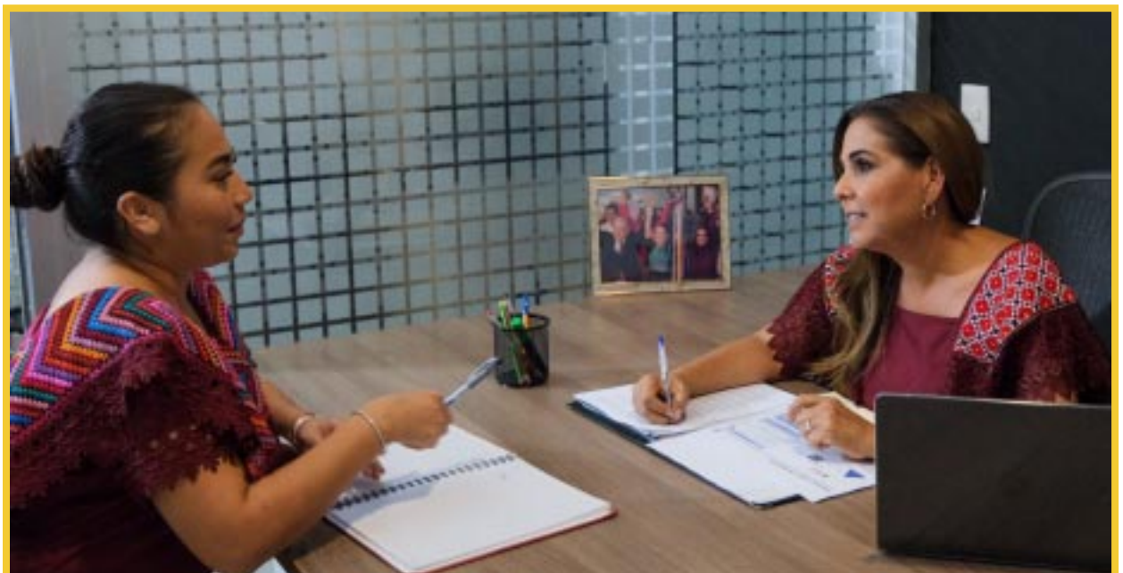
La gobernadora Mara Lezama Espinosa refrendó su compromiso con cerrar las brechas de desigualdad en el centro del estado de Quintana Roo, especialmente en la zona maya.

Adicionalmente, se destinaron 1.7 millones de pesos para restaurar el templo del Santo Niño Jesús de Tihosuco, 21 millones de pesos para mejorar y ampliar la red de agua potable, y más de 5 mi-