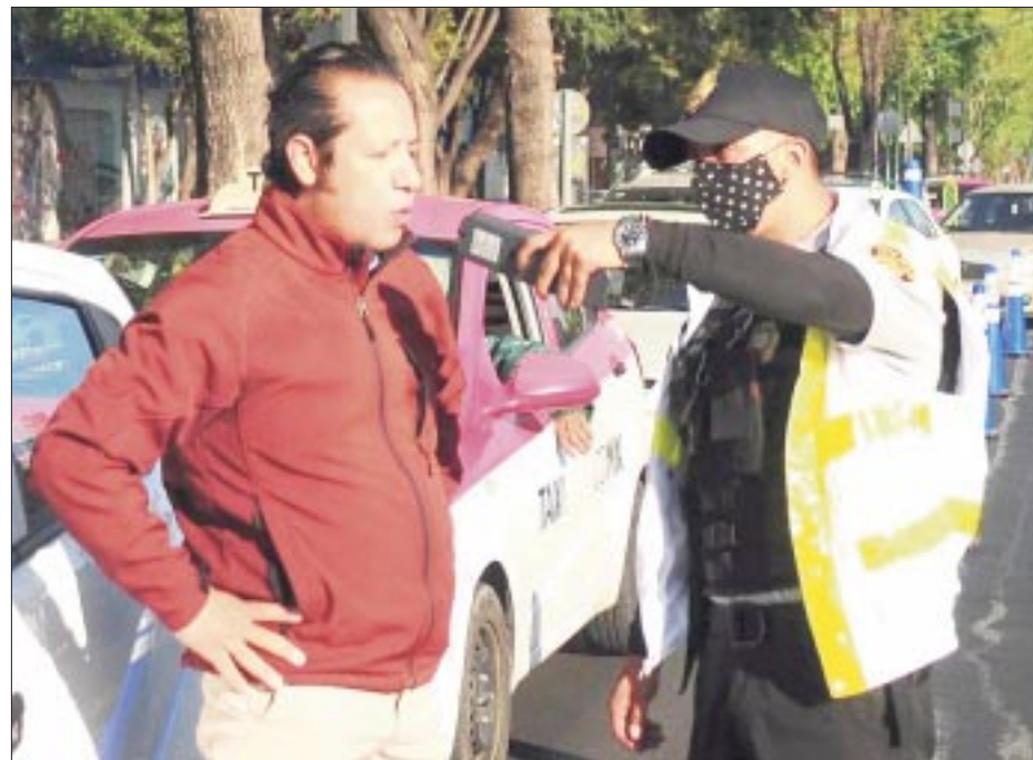
La Secretaría de Seguridad Ciudadana puso en marcha el operativo “Conduce Sin Alcohol fin de año”, que se mantendrá permanente los siete días de la semana durante las 24 horas en esta época decembrina.

Según el mandatario, México se convirtió en 2022 en el segundo país del mundo, solo por detrás de India, en volumen de recepción de remesas.