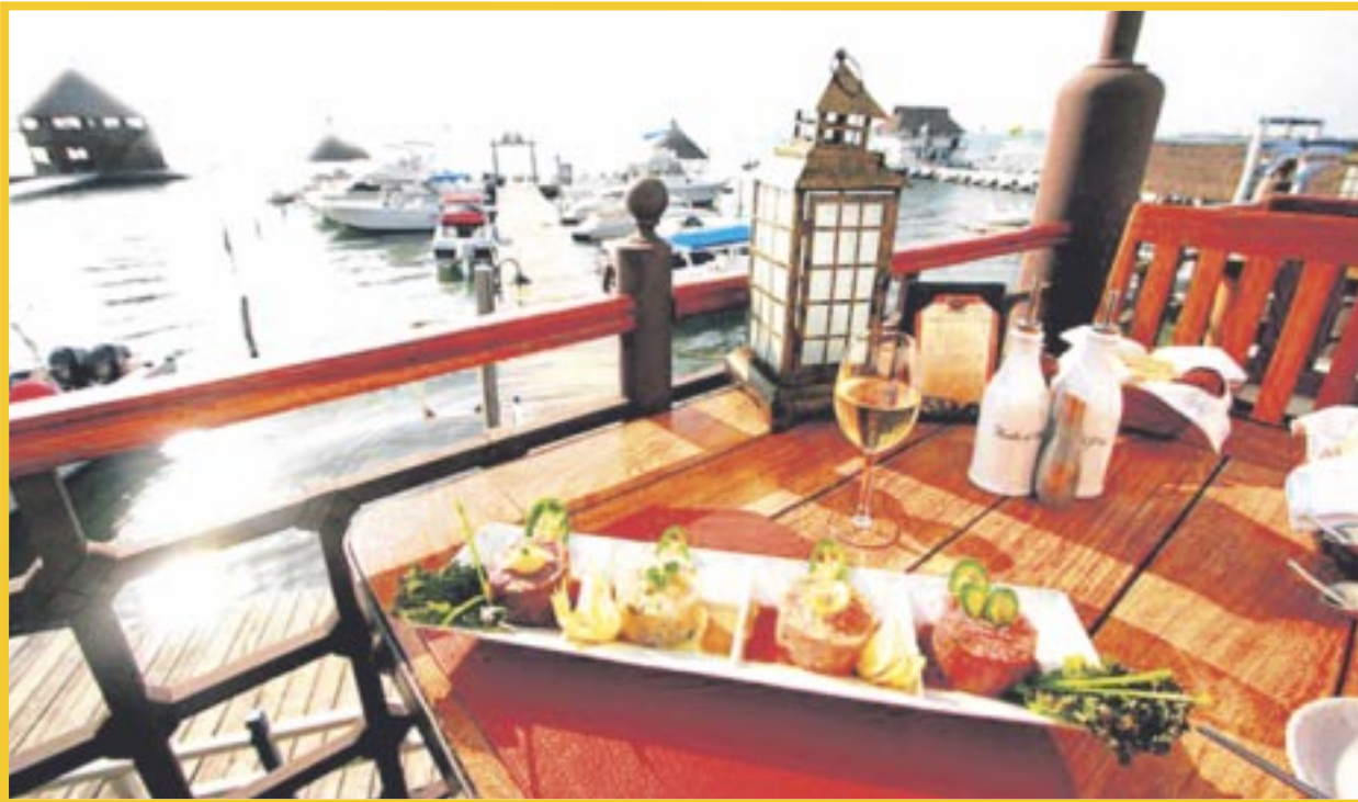
Canirac adelanta que se espera que unos 20 restaurantes serán inaugurados en plazas de Cancún.