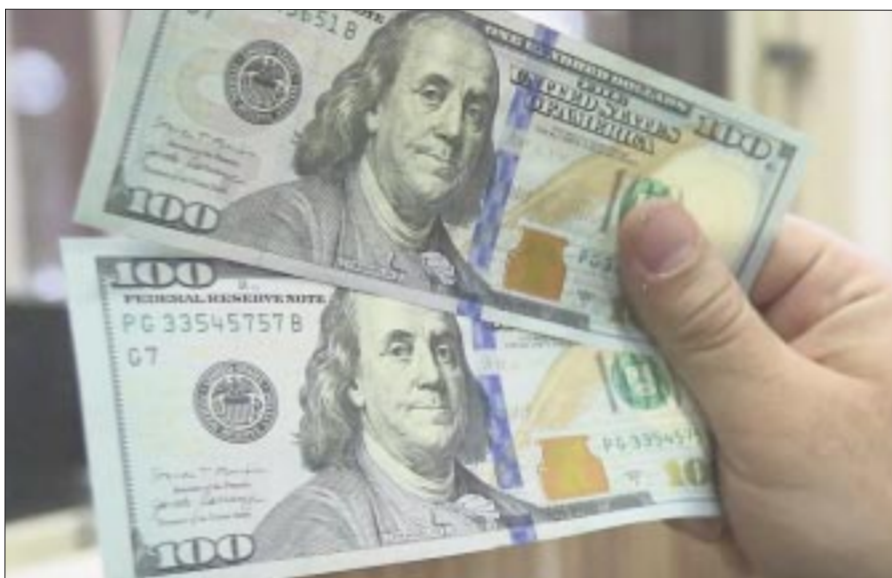
México recibió 52,888 millones de dólares de sus ciudadanos residentes en el extranjero entre enero y octubre de este año, un aumento interanual del 9.4% con respecto al mismo periodo del año anterior.

Aquellos automovilistas a bordo de vehículos con presencia de alcohol en el ambiente, o que durante la entrevista por policías en el punto de control muestran síntomas de haber ingerido unas “copitas”, deberán de descender de su unidad y acercarse al módulo móvil del programa, en donde serán sometidos a una prueba de Alcolstop, en la que deberá soplar ante una pipeta conectada al dispositivo que mide los grados de alcohol en la sangre.