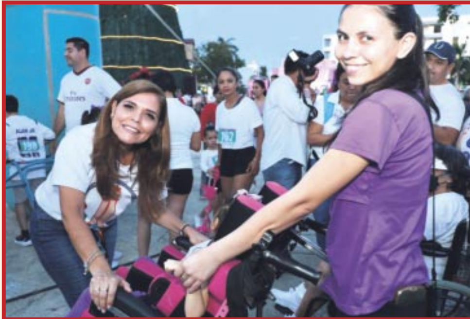
Verónica Lezama , presidenta honoraria del DIF Quintana Roo, dio el banderazo de salida carrera "Unidas y Unidos por la Discapacidad", en la que participaron más de 250 cozumeleños.

Cozumel.- La presidenta honoraria del Sistema DIF Quintana Roo, Verónica Lezama Espinosa, y la presidenta municipal de Cozumel, Juanita Alonso Marrufo, dieron el banderazo de salida de la carrera "Unidas y Unidos por la Discapacidad" celebrada en este municipio.