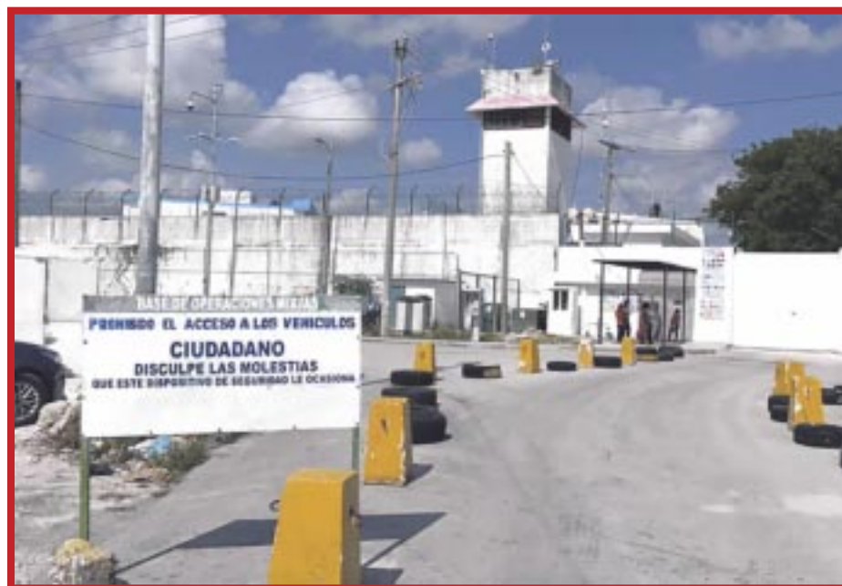
La Agepro ha entregado un terreno de 160 hectáreas para la edificación del próximo centro penitenciario en Cancún.

Finalmente, refieren que la decisión de ceder el terreno para la construcción del nuevo penal responde a la necesidad de abordar el crecimiento de la población penitenciaria en Cancún, y es que, de acuerdo con datos reportados hasta agosto, el Centro de Reinserción Social (Cereso) de Cancún registra una población que supera las mil 800 personas privadas de la libertad, abarcando tanto casos del fuero común como del ámbito federal.