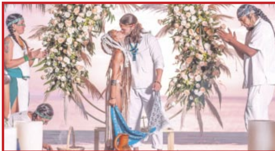
Ya se encuentra saturada la agenda para bodas de extranjeros para el último mes del año en Cozumel.

Hay que destacar que Cozumel cuenta con una variedad de lugares para bodas, desde resorts de lujo hasta hermosas playas. Algunos de los lugares más populares para bodas en Cozumel incluyen el Dreams Cozumel Cape Resort & Spa, The Westin Cozumel, Presidente InterContinental Cozumel, Playa Uvas, y Hacienda Ixtlan1. Estos lugares ofrecen una variedad de paquetes de bodas para satisfacer las necesidades de cada pareja.