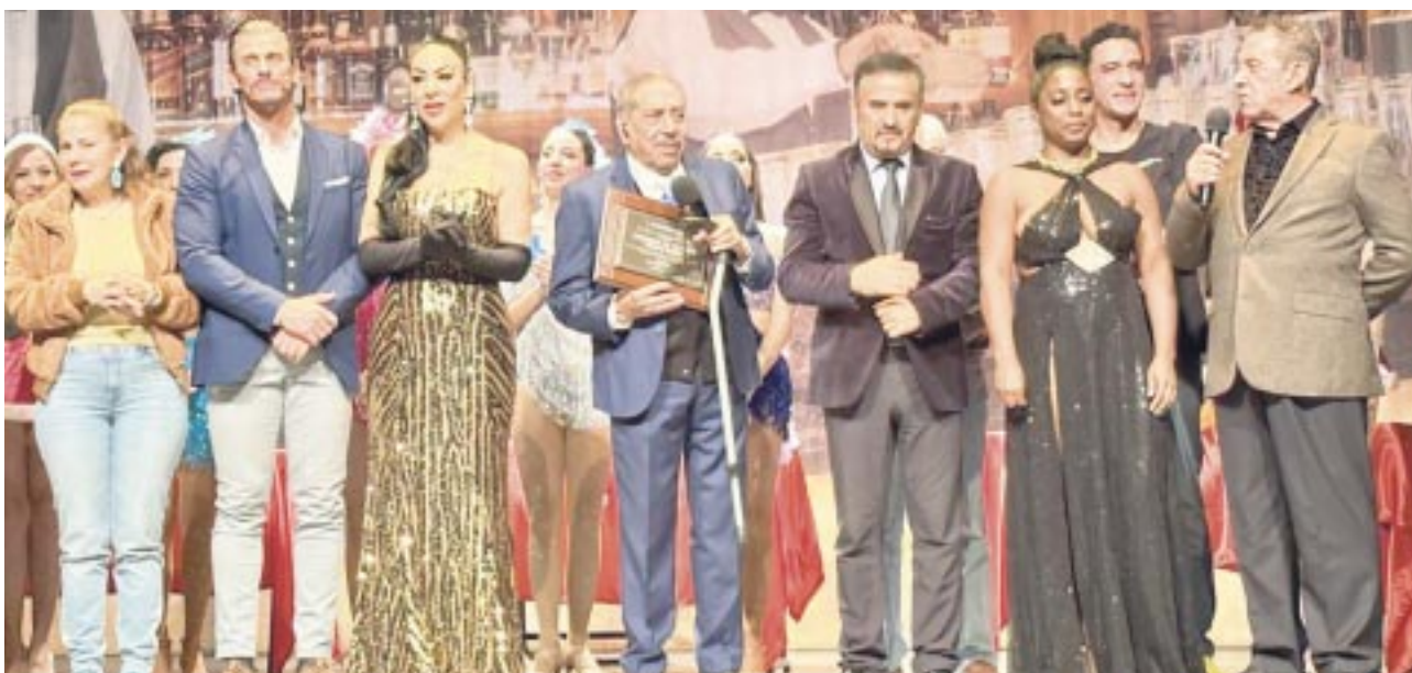
“La Casa de la Bandida: Gran obra del Teatro Mexicano” llegará próximamente a diferentes puntos del país, para luego ofrecer una función en Las Vegas.