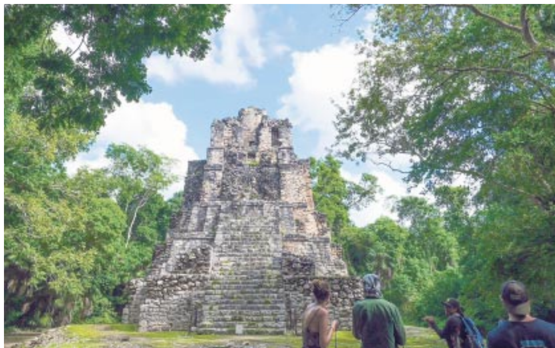
El Tren Maya contempla 473 kilómetros de recorrido en su etapa inaugural en el tramo de Campeche a Cancún, Quintana Roo.

mos a iniciar, es la preapertura, cuando ya iniciemos con la apertura, a finales del 29 de febrero, otro gallo nos cantara y programaremos los trenes de manera simultánea” dijo Lozano Águila.