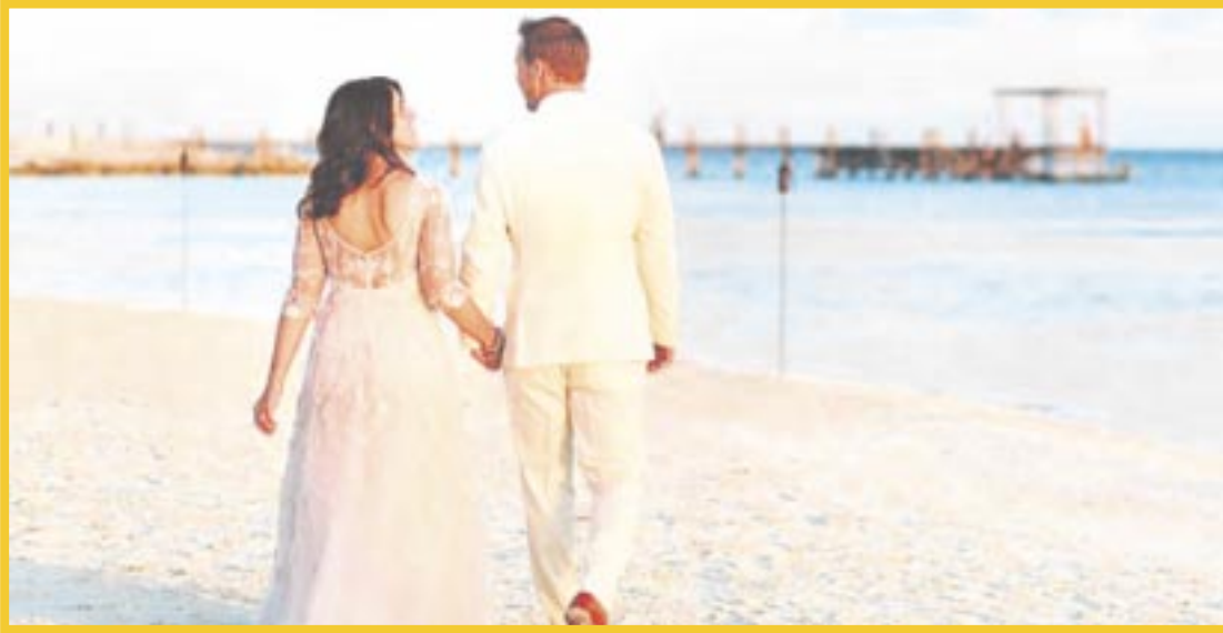
El Registro Civil en Cancún dio a conocer que el número de bodas se cuadruplicó este año.

El costo de un boda varía, pues la ley establece diferentes catálogos con relación al matrimonio; si se trata de una boda en oficina del Registro Civil, en día y hora hábil, el costo es de 673 pesos, pero si es un matrimonio fuera de la oficina, en fin de semana o día inhábil se eleva a 6 mil 400 pesos.