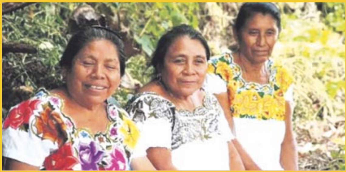
La defensoría pública electoral en Q. Roo. dio a conocer que van a contar con intérpretes en lengua originaria para asistir a personas mayahablantes.