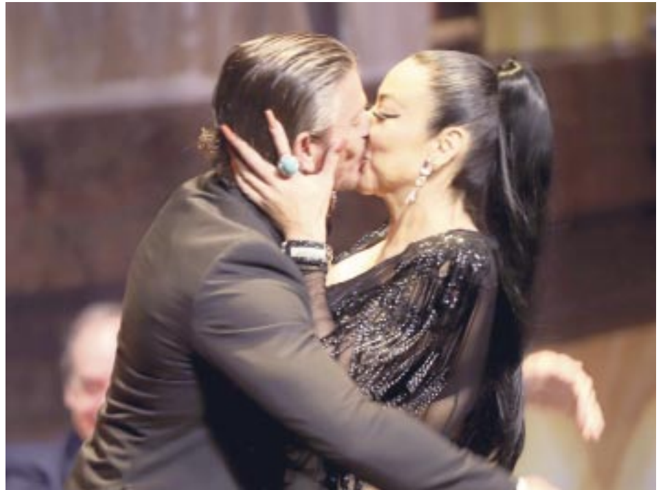
El amor se desborda en “La Casa de la Bandida”.