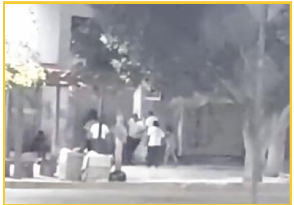
Un grupo de taxistas del sindicato "Andrés Quintana Roo" golpearon a una pareja de turistas.

Al menos hasta el cierre de esta edición no se brindó mayor información, sobre si los taxistas tomarían acciones legales.