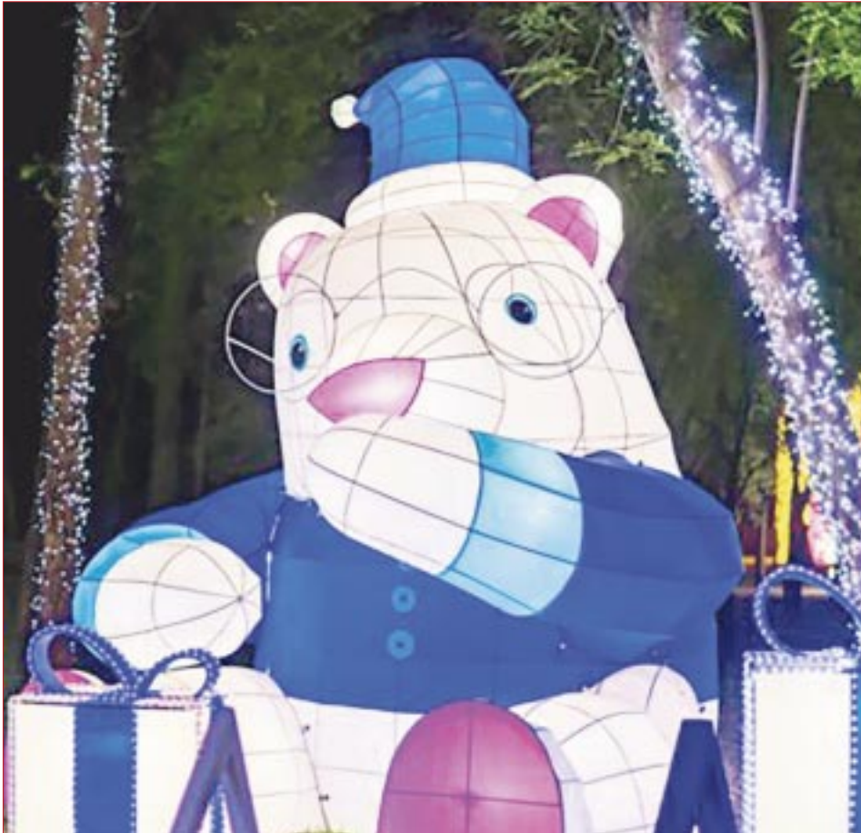
Osos polares, renos y otros animales invernales podrás encontrar en Brilla Fest.