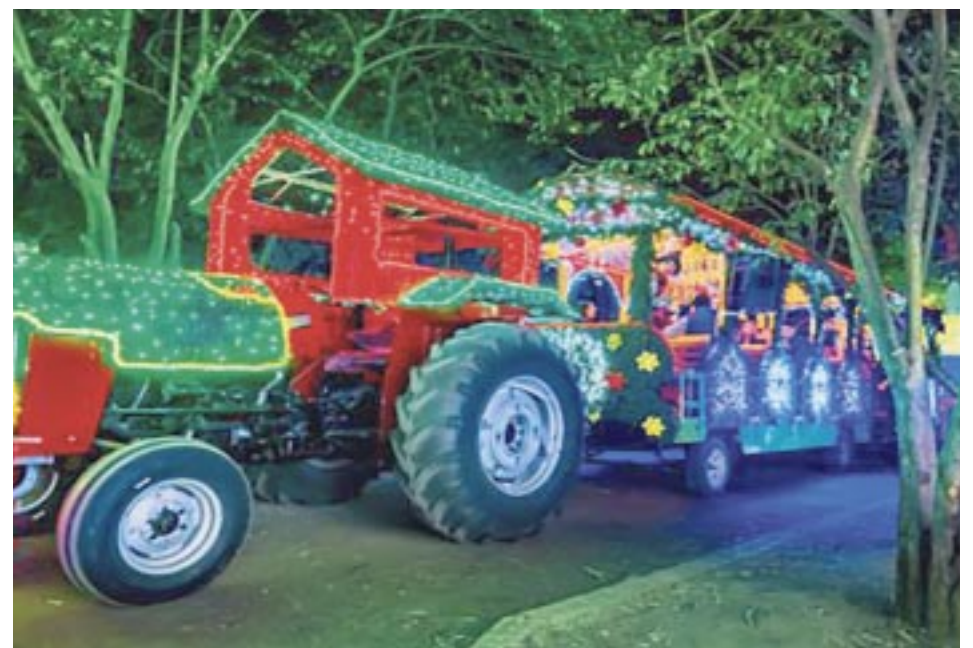
El paseo en Tren es una de las atracciones más demandadas en el lugar, por lo que te recomendamos apartar tu lugar.