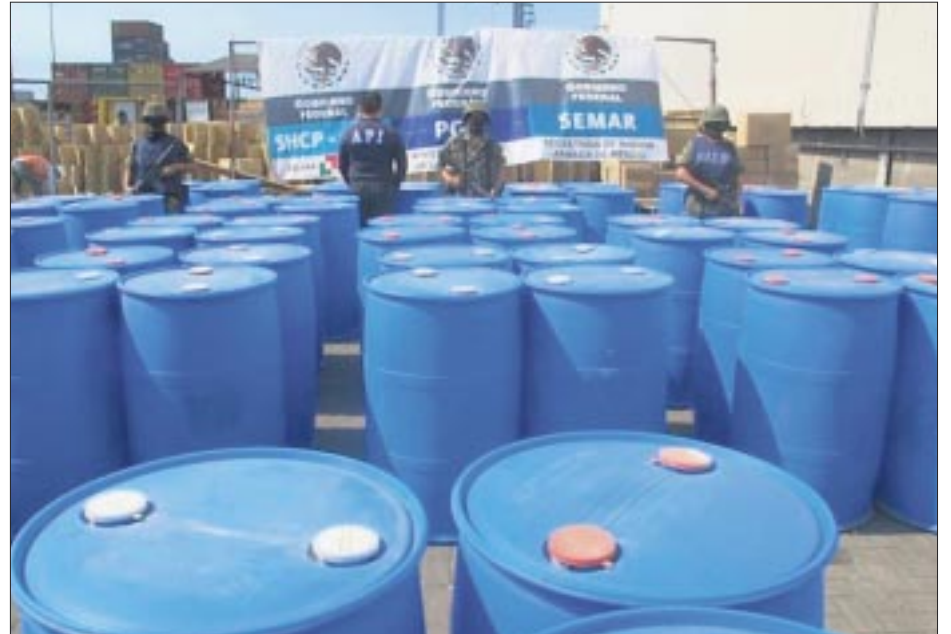
Los envíos de precursores químicos comprueban la expansión de actividades de la delincuencia china en México.

Los miembros de la diáspora china en México suelen operar como intermediarios en las transacciones. Los precursores principalmente entran a través de los puertos de Lázaro Cárdenas y Manzanillo,