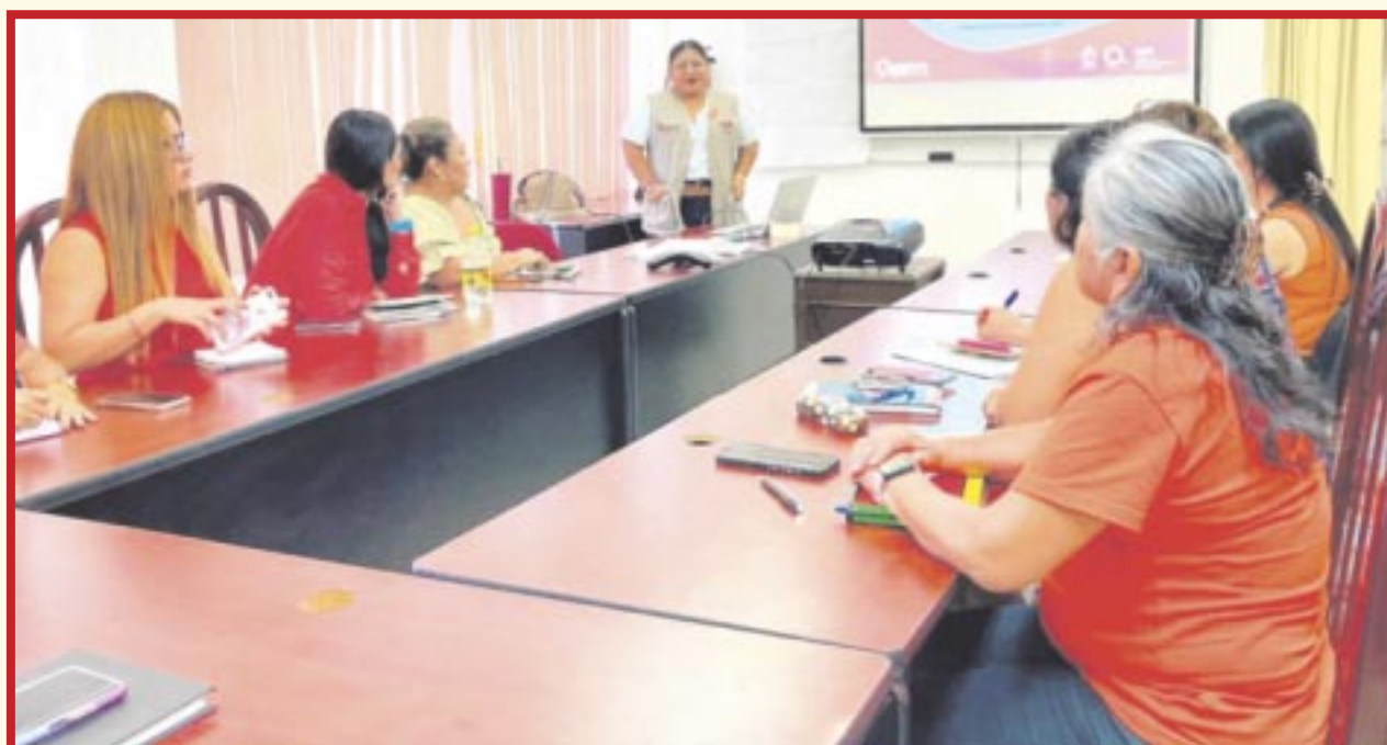
El IQM impartió el taller de capacitación “Construyendo Sororidad”, dirigido a servidoras públicas del gobierno estatal.

Chetumal.- El Instituto Quintanarroense de la Mujer (IQM), en el marco de los 16 días de Activismo, impartió el taller de capacitación “Construyendo Sororidad”, dirigido a servidoras públicas del gobierno del estado.