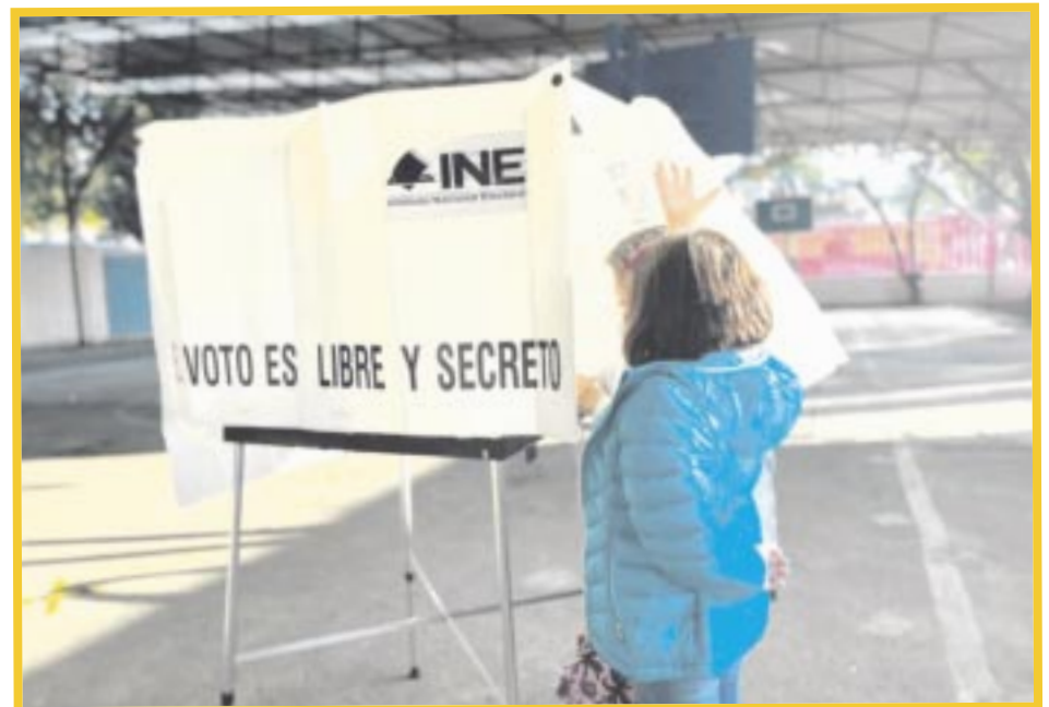
Las elecciones en Quintana Roo están a la vuelta de la esquina y se dio a conocer que el calendario electoral 2024 ya se encuentra listo.

Es importante mencionar, que la fecha para la jornada electoral del 2024, será el próximo 2 de junio, donde las urnas para la votación estarán abiertas de 8:00 a 18:00 horas.