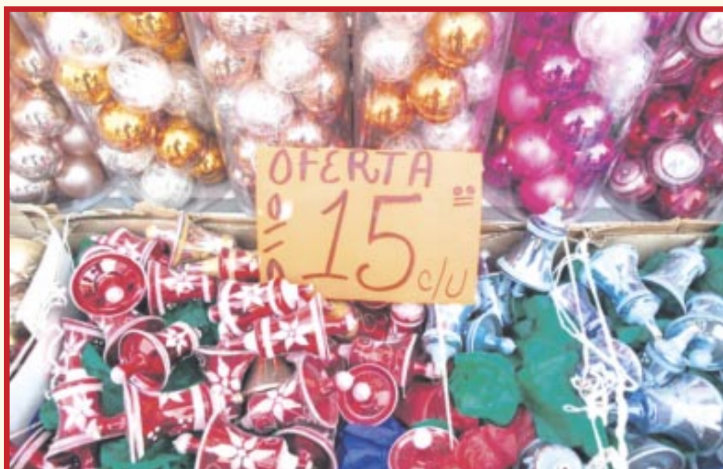
Los comercios y supermercados de Cancún han incrementado su oferta de artículos navideños.

Cancún.- Comercios y supermercados de Cancún han incrementado su oferta de artículos navideños, lo cual es aprovechado por algunas personas, quienes ya anticipan la compra de sus regalos y adornos.