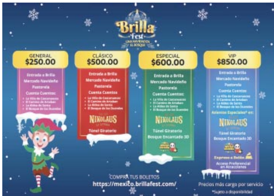
Estos son los paquetes disponibles para que puedas elegir tu experiencia a tu medida.

Asimismo, este proyecto se une a los centros de acopio para ayudar al Estado de Guerrero, y en cada juguete que donen por familia se le dará un acceso al parque.