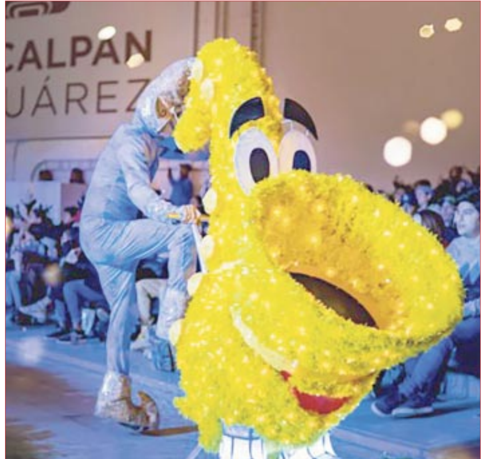
En la Carpa de circo podrás disfrutar de música y espectáculos acrobáticos, entre otros.