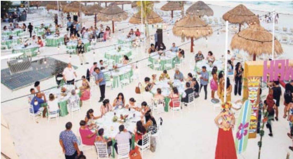
El Cancún World Fest 2024 está siendo organizado para conmemorar el 50 aniversario de Quintana Roo.

a esa entidad, quienes gustan de las artesanías que se hacen en Quintana Roo y también se promueven en el extranjero cuando lo adquieren los visitantes y se lo llevan a sus países de origen.