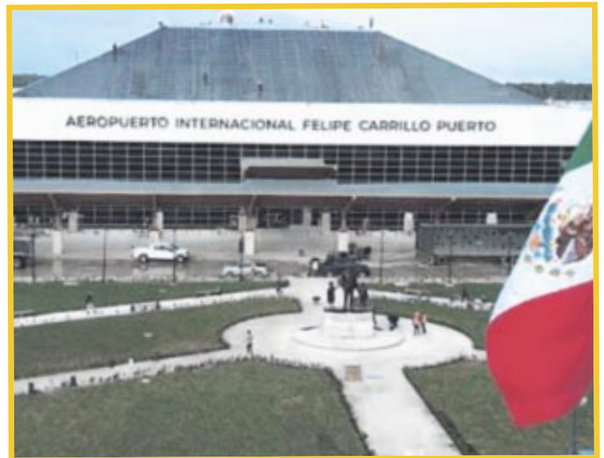
Instalan una Agencia del Ministerio Público de la Federación con sede en el Aeropuerto Internacional de Tulum.

El aeropuerto, que será operado por el Ejército, representa una prueba de fuego para conocer qué tan eficientes pueden ser las fuerzas armadas operando una terminal aérea, por lo que se ha establecido una nueva Agencia del Ministerio Público en el aeropuerto para reforzar la seguridad.