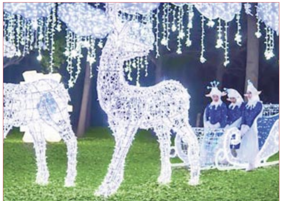
Los más de mil metros cuadrados están diseñados para hacerte pasar un momento increíble.