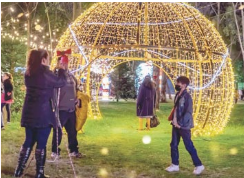
Tendrás cientos de oportunidades para tomarte fotografías en escenarios mágicos.

Se trata de Brilla Fest, un espectáculo que captura toda la magia invernal en un bosque encantado por la Navidad y donde se suman distintas actividades referentes a la época decembrina, es decir, que bien podrás encontrar renos, muñecos de nieve y hasta al mismísimo Santa Claus en forma de inflables iluminados de un tamaño monumental, perfecto para que te tomes una fotografía y te quedes un grato recuerdo.