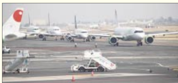
El AICM informó que aumentará la Tarifa de Uso de Aeropuerto (TUA) a partir del próximo año.

No hay pruebas de que el gobierno de la República Popular China esté directamente implicado. Sin embargo, la corrupción y la impunidad persistentes tanto en China como en América Latina hacen que los funcionarios de los gobiernos provinciales y municipales de la República de China se beneficien, al menos indirectamente, de estos grupos ilegales o por hacerse de la vista gorda.