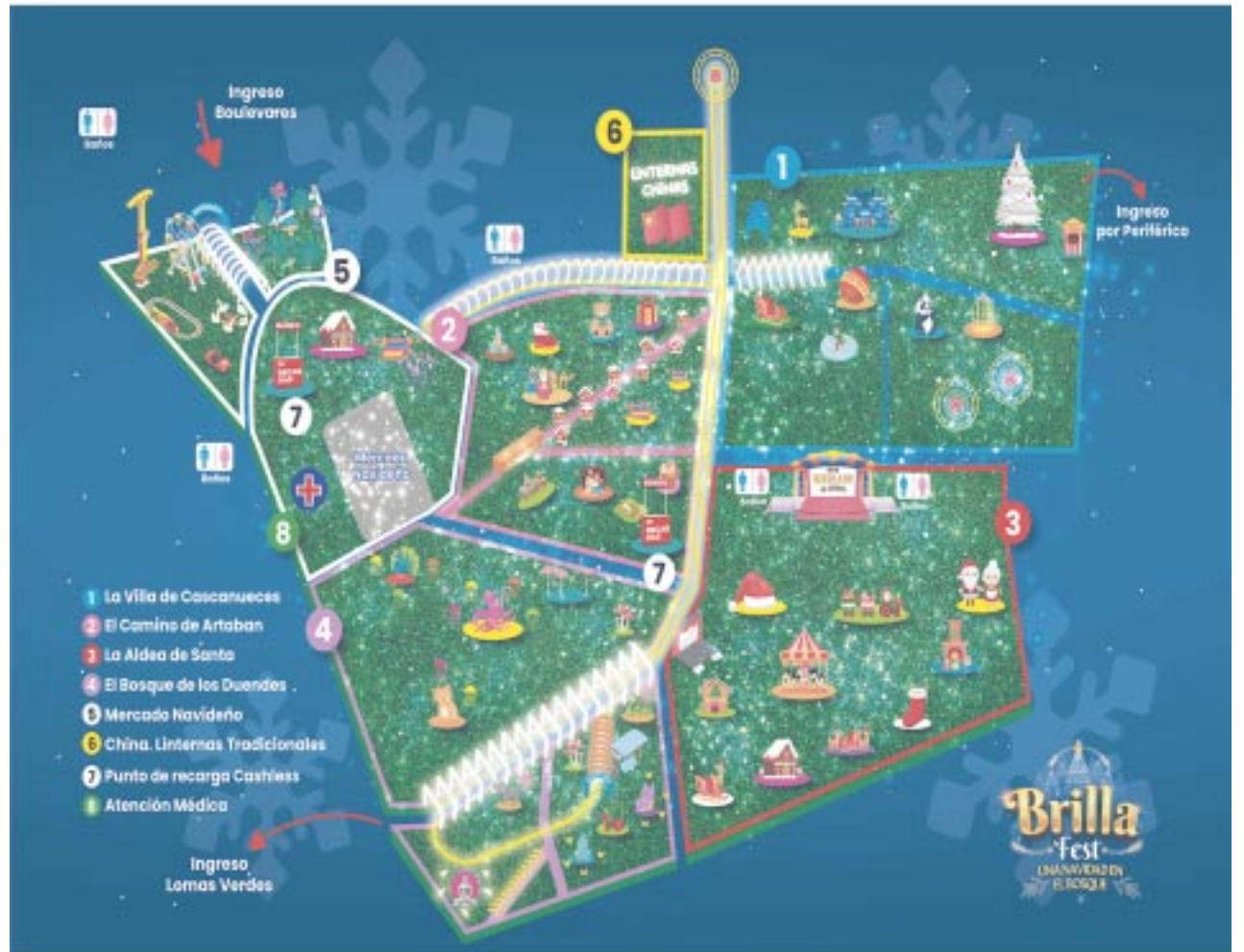
Este es el mapa con todas las atracciones disponibles en Brilla Fest.

Los boletos los puedes adquirir en la página web del Brilla Fest. Hay varios paquetes a elegir. El más económico es el general de 250 pesos por persona e incluye la pastorela, el encendido del árbol y entrada a Brilla. El boleto VIP