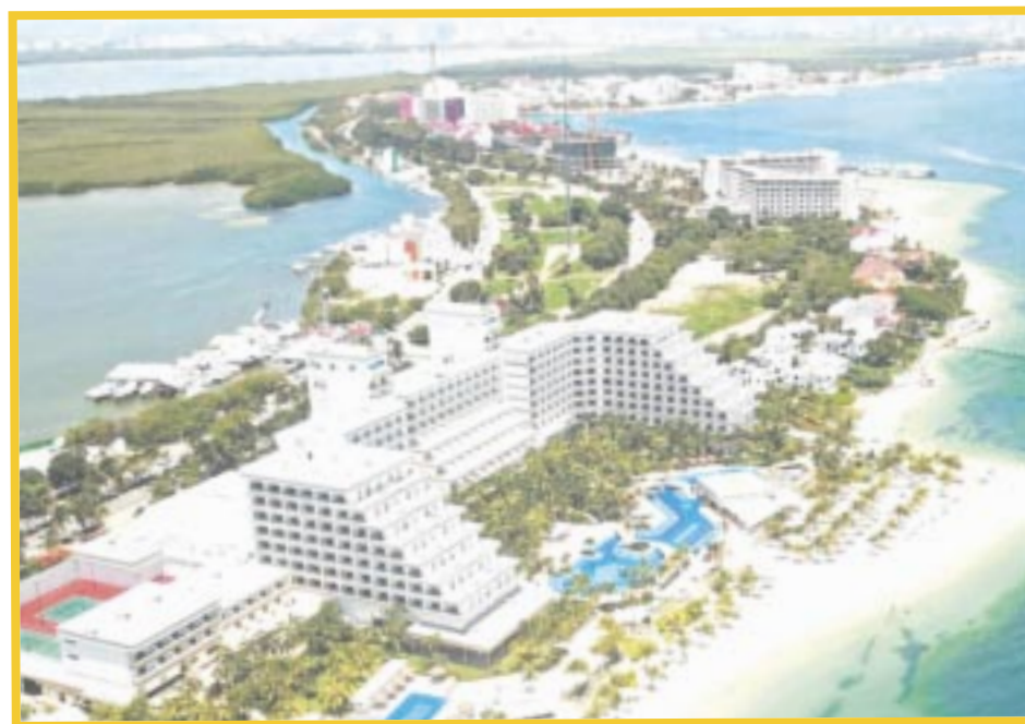
Secretaría de Turismo de Quintana Roo dio a conocer que se acabó el periodo de gracia y de concientización sobre el ReturQ.

Asimismo, refiere que alrededor del 80% de los hoteles instalados en el Caribe mexicano ya están inscritos, acotando que por su naturaleza las unidades de alojamiento a través de medios digitales, como Airbnb, serán consideradas en su propio padrón.