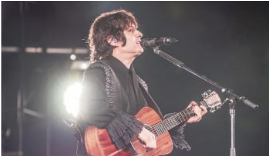
“00:00 Tour” logro reunir en su parada por la capital a más de 60 mil personas.