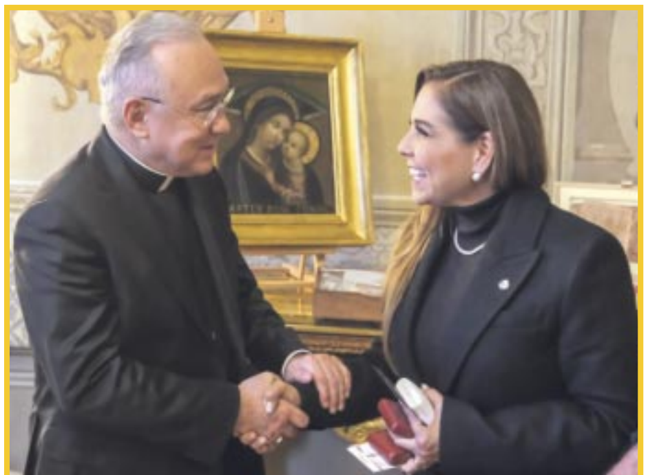
La gobernadora Mara Lezama Espinosa dialogó con Monseñor Edgar Peña Parra sobre el gobierno humanista mexicano y el trabajo en la construcción de obras históricas en Quintana Roo.

De esta manera, se evidencia el compromiso de la gobernadora Mara Lezama y del gobierno de Quintana Roo en trabajar en conjunto con instituciones internacionales y nacionales para lograr el desarrollo y bienestar de la población del estado.