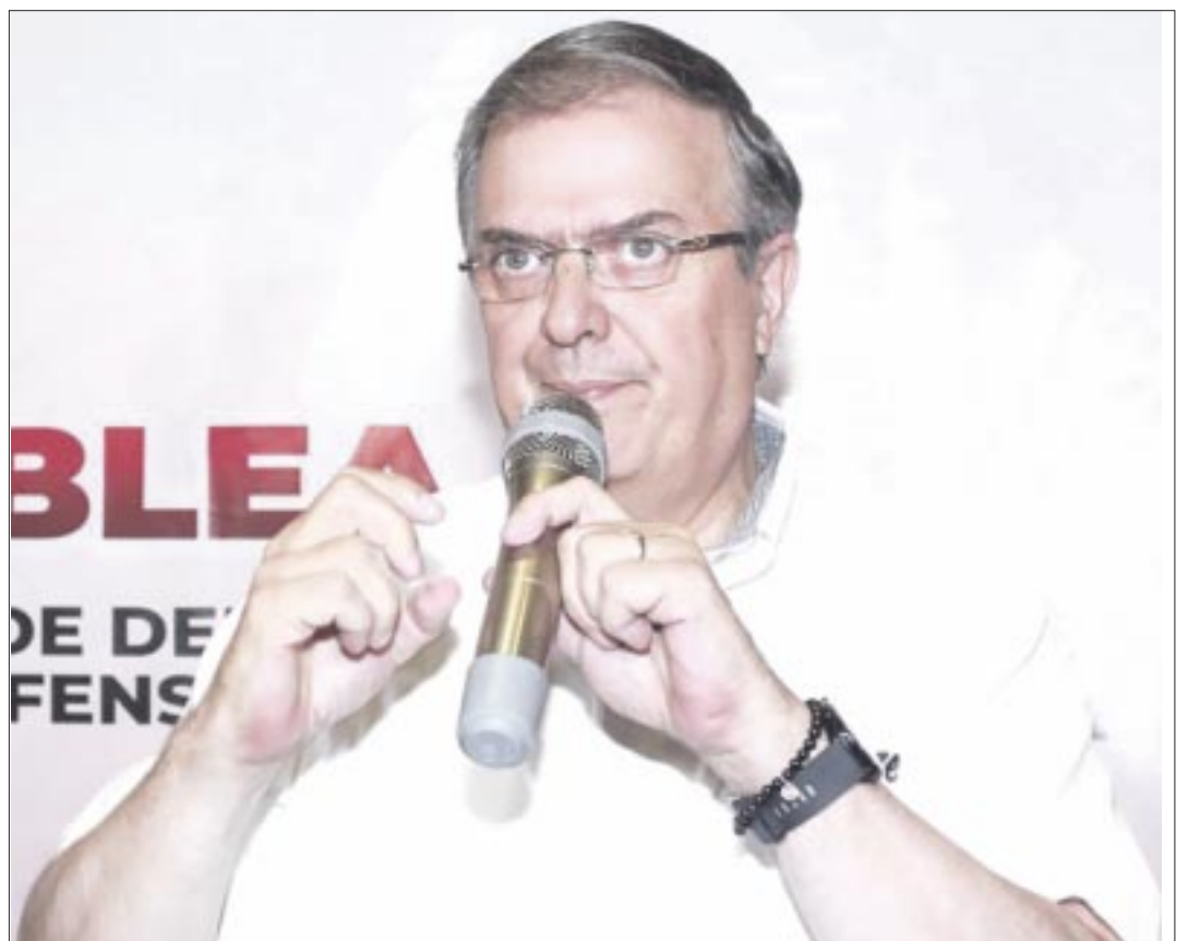
Marcelo Ebrard se vio obligado a respaldar la candidatura de Claudia Sheinbaum, pero no con mucho agrado.