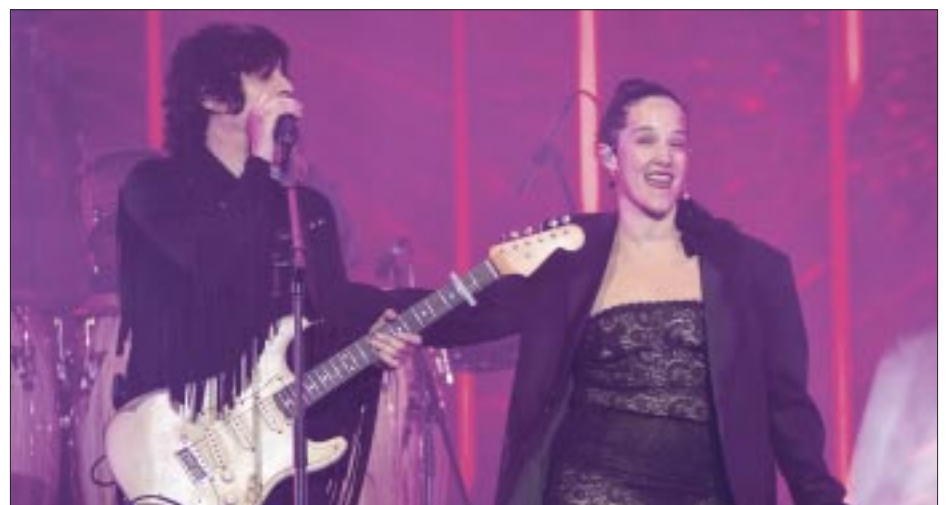
Otra de sus increíbles invitadas fue la siempre talentosa Ximena Sariñana.