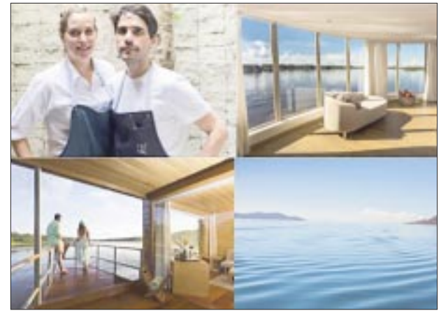
Paisajes, gastronomía, recorridos y mucho más en Perú.

☆☆☆☆☆ Aloft Hotels, es la marca que se identifica con los fans de la música y viajeros expertos en tecnología. Con la aper-