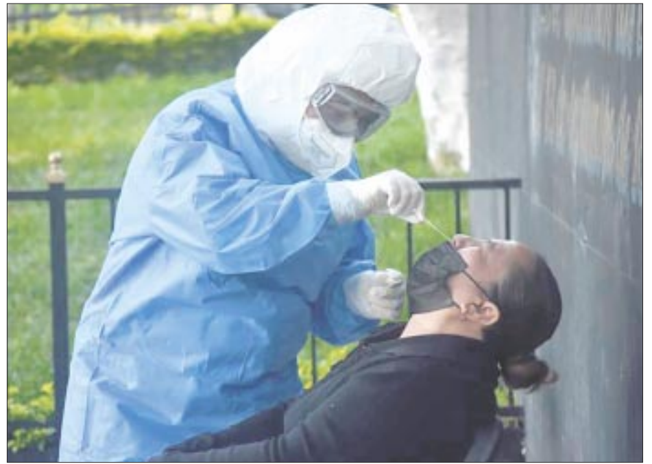
En la Ciudad de México confirmaron el primer caso de la variante Pirola, considerada “altamente contagiosa”, aunque no mortal.

Aquellos que creían que la Covid-19 había terminado están equivocados, pues los gobiernos de todo el sudeste