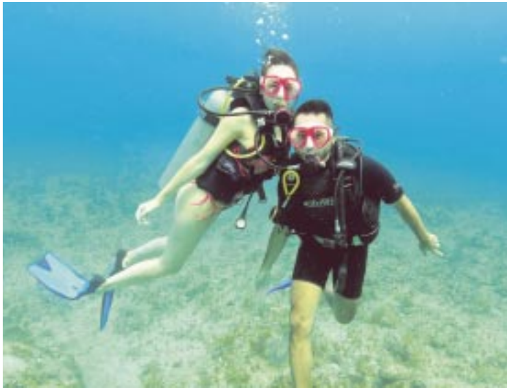
Buzos agremiados a la ANOAAT prevén que habrá un alza en sus actividades turísticas en Cozumel.

asociación han reportado decenas de cancelaciones.