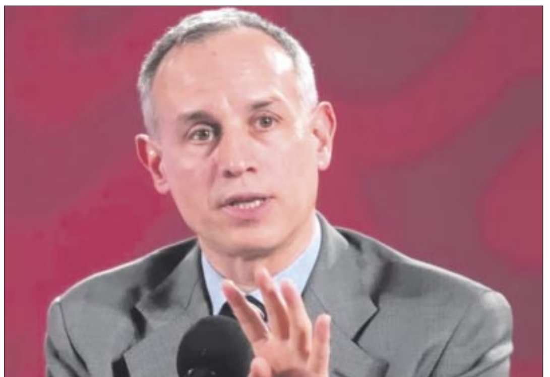
La actuación de Hugo López-Gatell durante la pandemia por Covid y dentro del sector salud son objetadas.

ramonzurita44@gmail.com ramonzurita44@hotmail.com