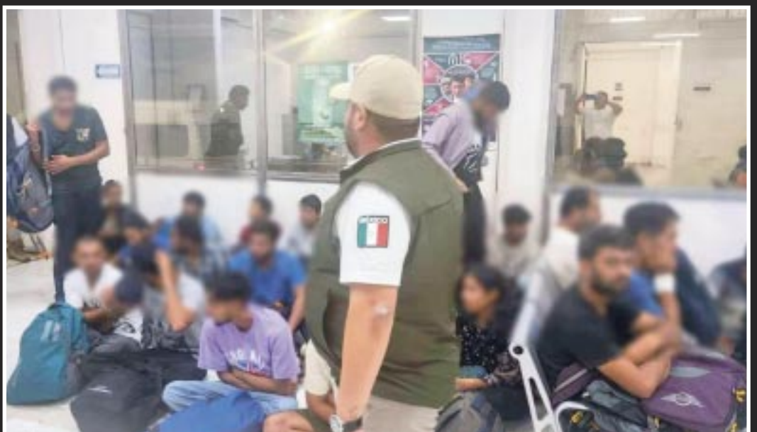
CISVAC revela que existe un incremento del 23% en el número de migrantes que buscan asilo y refugio humanitario en Cancún.

dad” y destacó que las necesidades primordiales se centran en atención médica y apoyo económico.