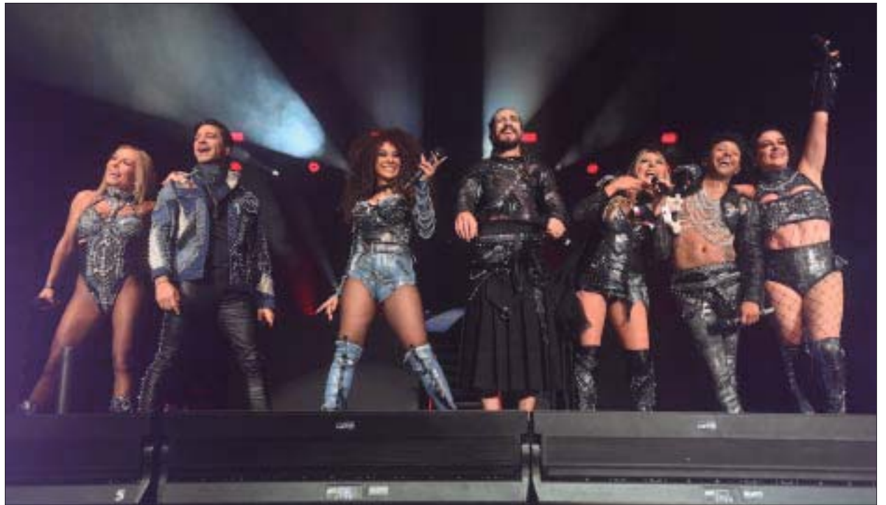
Con sus conciertos del tour Treinta los próximos 26 y 27 de enero, la agrupación llegará a 32 funciones desde 1998.

OV7 presenta Treinta el jueves 26 y viernes 27 de enero a las 20:30 horas en el Auditorio Nacional (Reforma 50, Bosque de Chapultepec). Boletos: $150 a $1500, disponibles en las taquillas del foro sin cargo extra y en el sistema Ticketmaster.