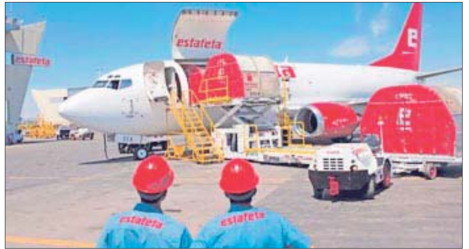
La empresa Estafeta informó que se encuentra en negociaciones con el AIFA para que forme parte de su red de aeropuertos, pero pidió tiempos adecuados.

Al respecto, el ministro Alberto Pérez Dayán lanzó al pleno la pregunta de, ¿por qué habremos de aceptar que se deje en manos (de las fuerzas armadas) un registro que de acuerdo con la propia ley es responsabilidad de la Secretaría de Seguridad Pública?, ¿Por qué la fuerza armada permanente ha de ser quien registre esa detención y ni siquiera le informe a la Secretaría de Seguridad Pública que la hizo?