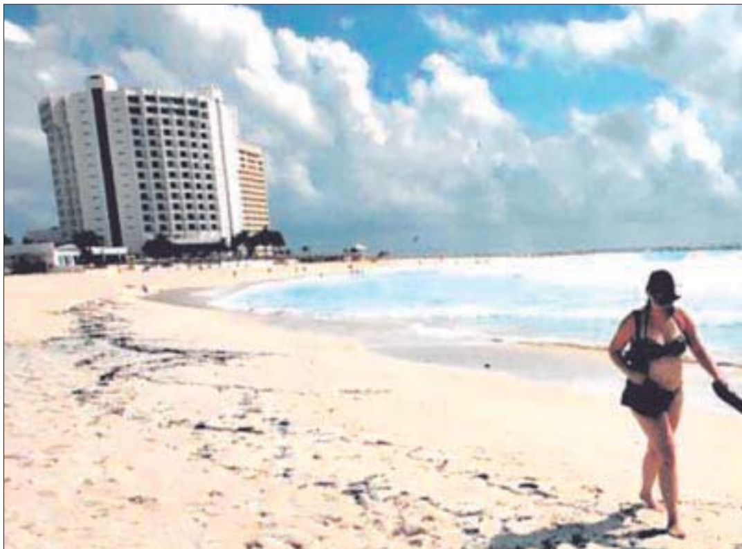
Pronostican que en municipios cercanos a la costa se presentarán chubascos aislados, en su mayoría durante la noche y madrugada, en tanto que durante el día el sol calentará los arenales.

En los municipios cercanos a la costa, se presentarán chubascos aislados, en su mayoría durante la noche y madrugada, en tanto que durante el día, el sol calentará los arenales.