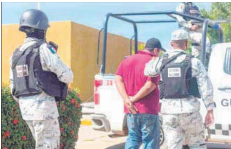
La Suprema Corte de Justicia de la Nación avaló que los militares puedan detener a civiles, al aprobar la Ley Nacional de Registro de Detenciones.

En su comentario a la Conamer, la empresa pidió a la autoridad aeronáutica un plazo de 16 meses.