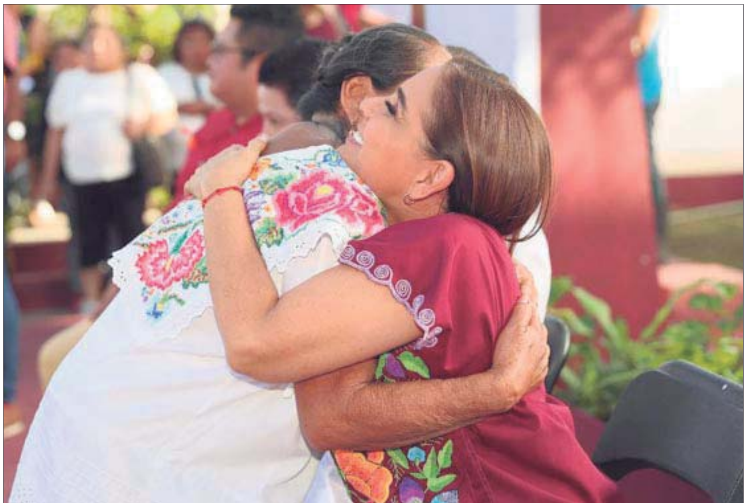
La titular del Ejecutivo estatal, Mara Lezama, añadió que el PED también establece las estrategias para fomentar la inversión responsable.