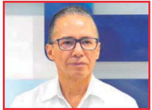
El Fiscal Óscar Montes de Oca, informó que durante la semana pasada, hubo 135 detenidos, así como 17 vinculaciones a proceso y se lograron tres sentencias condenatorias por robo.

de aprehensión. Del total de las detenciones, 28 fueron por delitos contra la salud, nueve por homicidio, ocho por robo, seis por el delito de violación; el rubro de vio-