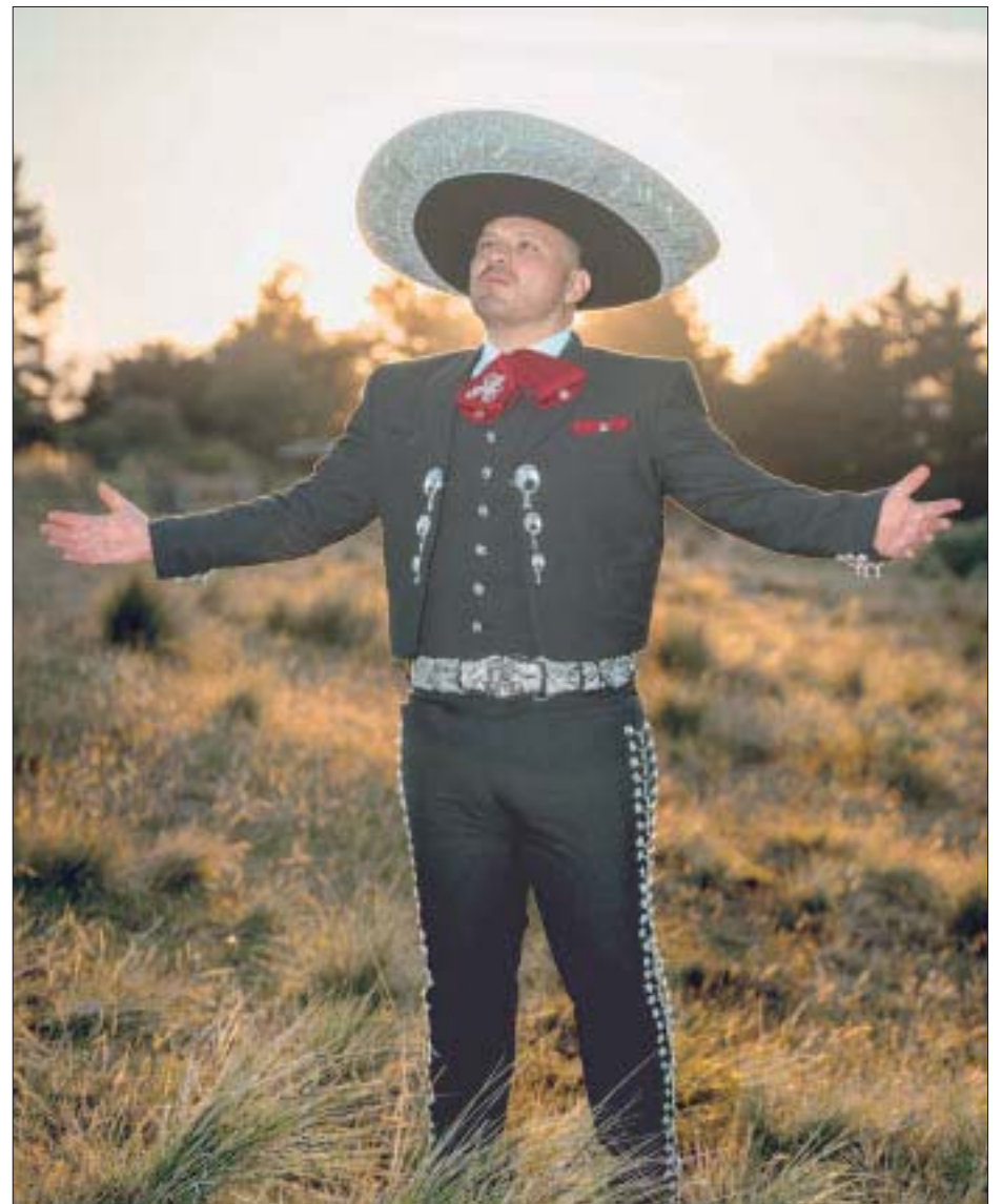
Sus primeras grabaciones fueron en 1999, en el género pop.

Este tema se trata de una obra compuesta por el peruano Gian Marco, Noel Schajris