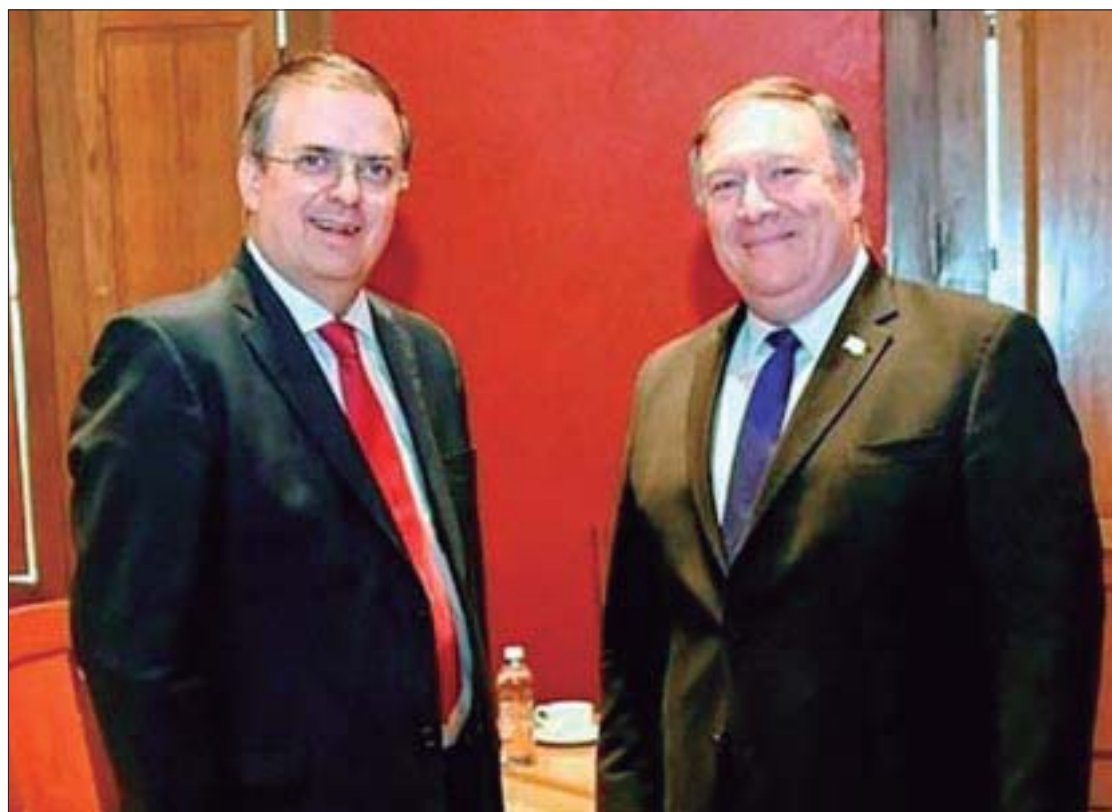
El canciller Marcelo Ebrard y el ex secretario de Estado de Donald Trump, Mike Pompeo.

*Conductor del programa Va en serio, Mexiquense TV Canal 34.2, IZZI Canal 135 y Mexiquense Radio