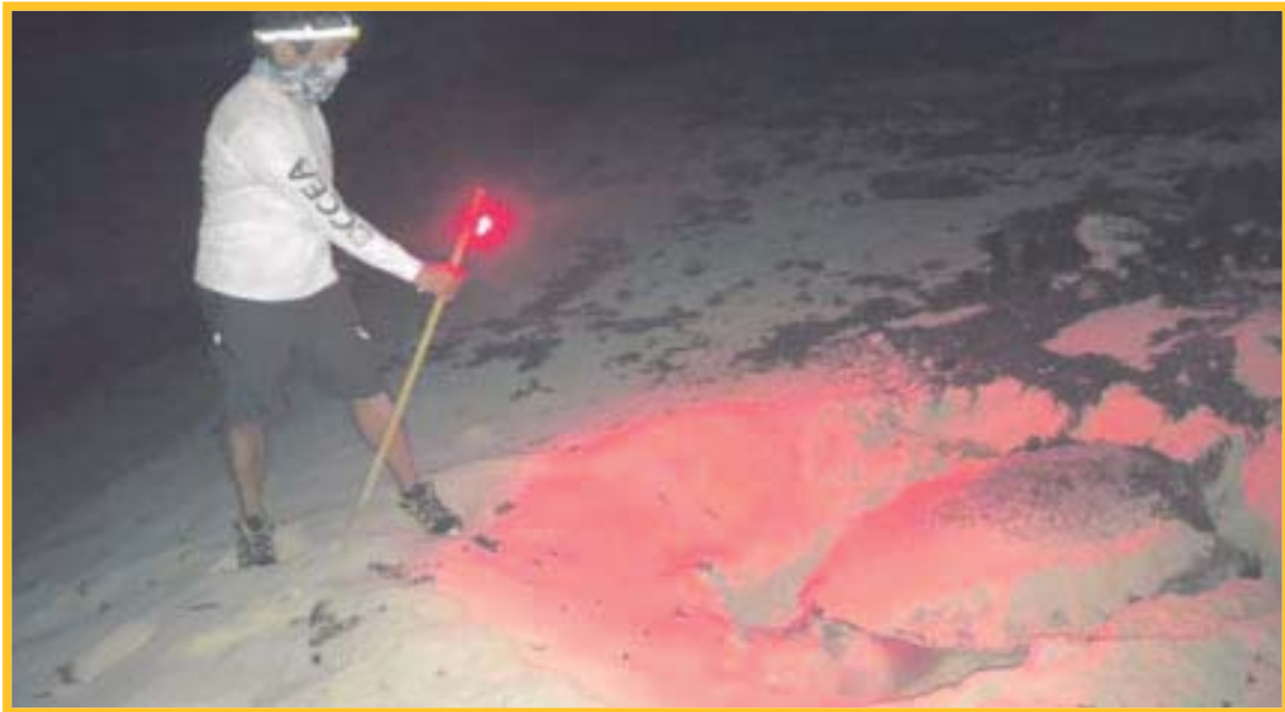
FPMC realizó la primera salida de este año a las playas del Parque Ecoturístico Punta Sur, donde se retiraron 90 kilogramos de desechos.

Buscan promover la participación social en actividades de conservación ambiental y el trabajo coordinado entre las instituciones, por lo que la FPMC mantiene abierta la invitación a escuelas, empresas, grupos organizados y a la ciudadanía en general, para sumarse como voluntarios en limpieza de playas.