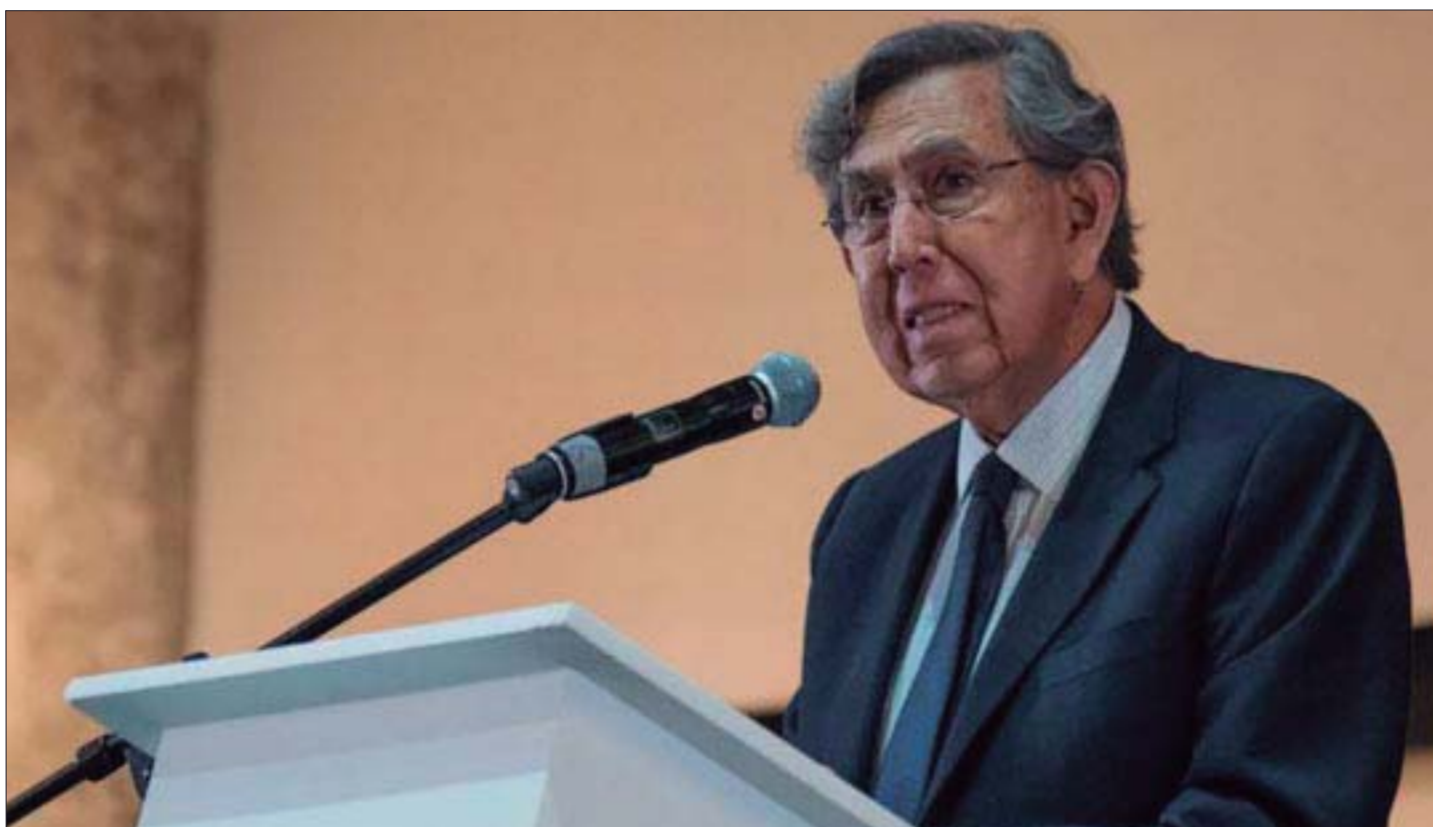
Cuauhtémoc Cárdenas está reconocido como uno de los personajes que ayudaron a fincar la democracia del país.