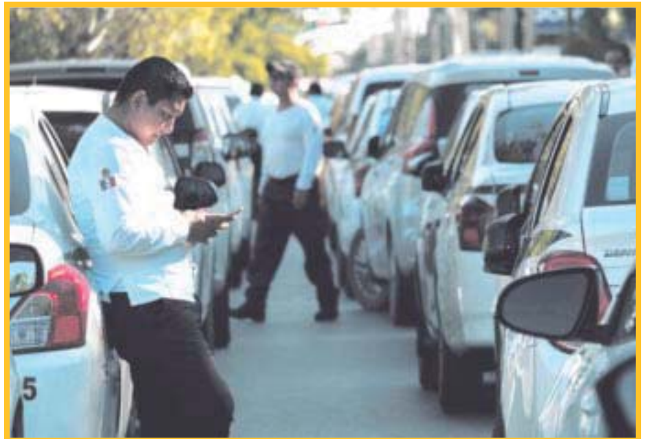
Gobierno estatal, taxistas y Uber, logran un cese de hostilidades en Cancún.

Finalmente, sobre las agresiones de los taxistas, comentó que ya se les ha hecho una advertencia a ambas partes y que, en caso de presentarse cualquier acto contra el estado de derecho, van a enfrentar los castigos correspondientes, pues en el caso de los choferes de Uber cuentan con un amparo federal, que les permite seguir trabajando.