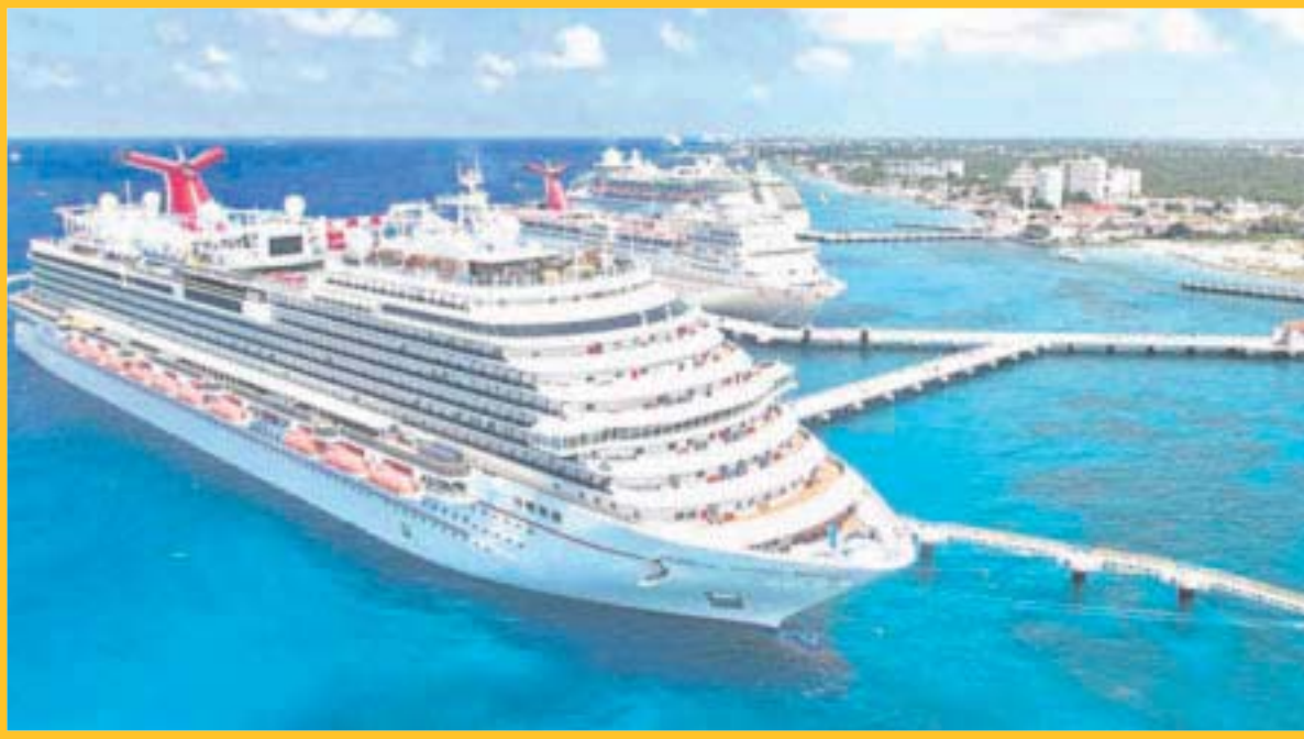
Los dos puertos de cruceros más importantes de todo el país se encuentran en Quintana Roo.

Desde 2022, la recuperación del sector cruceros ha sido paulatina, por lo que reportaron muy buenos números y para este 2023 apuntan para romper récords de atraques y por consiguiente de llegada de viajeros por este medio, así como de una importante derrama económica para el sector y otros de manera indirecta.