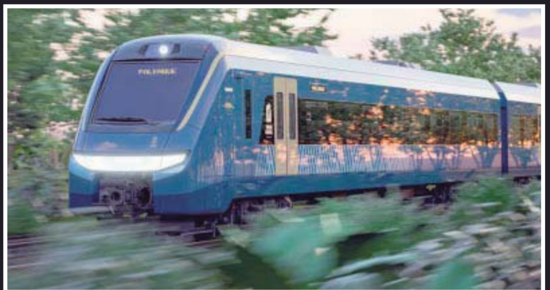
El Tren Maya gastó más presupuesto del aprobado.

Además, el 1 de agosto entró en vigor un decreto por el que se expropió una superficie de un millón 93 mil 118 metros cuadrados de propiedad privada para la construcción del Tramo 5.