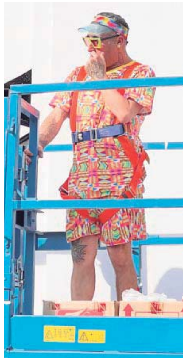
El destacado artista español , Okuda San Miguel, intervino la fachada exterior del emblemático edificio, previo a la inauguración de su Experiencia Inmersiva "Metamorfosis".

Con una producción 100% mexicana y con piezas monumentales creadas de manera exclusiva para la exhibición en México, algunas de ellas, diseñadas específicamente pa-