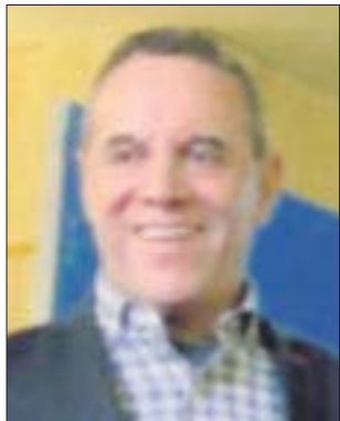
Por José Luis Montañez