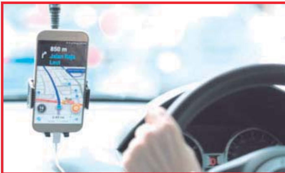
Temer monopolio de la plataforma Uber en Isla Mujeres, tras autorización del servicio.

Y es que, según estas declaraciones en el Caribe Mexicano la mayoría de los concesionarios no operan sus unidades, y llegan a tener varias placas “Esta práctica debe acabar para que los precios de los viajes bajen, pues en la actualidad, el ‘martillo’ (chofer contratado por el dueño de la placa) tiene que sacar su día, gasolina y el pago de alquiler”.