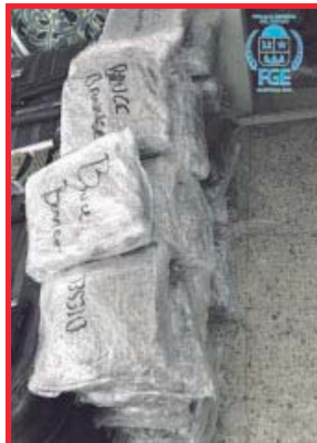
Cateo en un domicilio de Isla Mujeres, donde hallaron armas de fuego, cartuchos útiles y hierba seca con características de la marihuana.