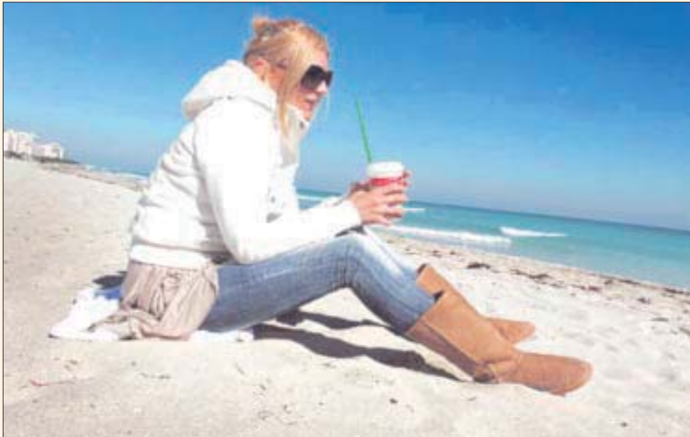
Las condiciones atmosféricas en la Península de Yucatán serán de cielo medio nublado, ambiente templado durante la mañana y caluroso en la tarde.

Cancún.— El fresquecito y el calor interactuarán en Quintana Roo, al mantenerse el astro sol durante el día, aunque el cielo permanezca de nublado a semi nublado y por las noches la temperatura bajará, ante la afectación de frentes fríos 28 y 29, además de un canal de baja presión sobre el sureste del país.