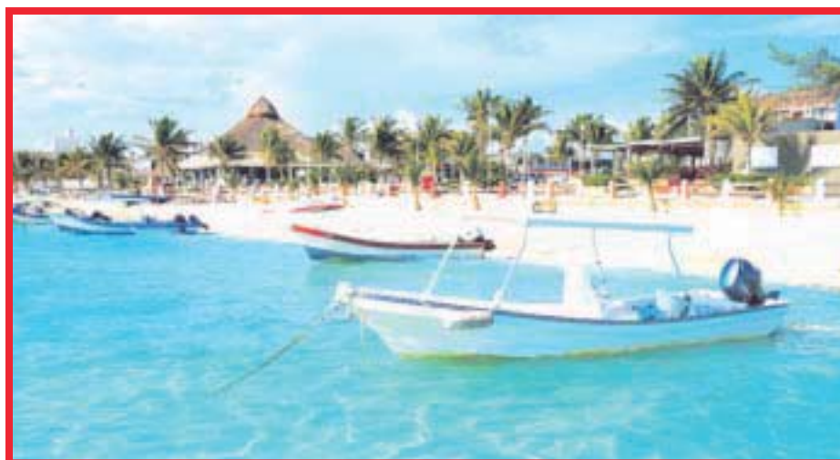
El número de visitantes que llegó a Puerto Morelos en 2022 fue un 46.8 por ciento mayor que la cantidad recibida en 2021.

“Somos un destino que ofrece al mundo un amplio abanico de experiencias turísticas, con bellezas naturales únicas, ambiente de paz y tranquilidad, excelente gastronomía y una gran infraestructura hotelera, pero sobre todo contamos con la calidez y profesionalismo de nuestra gente, que es nuestro principal activo”, concluyó.