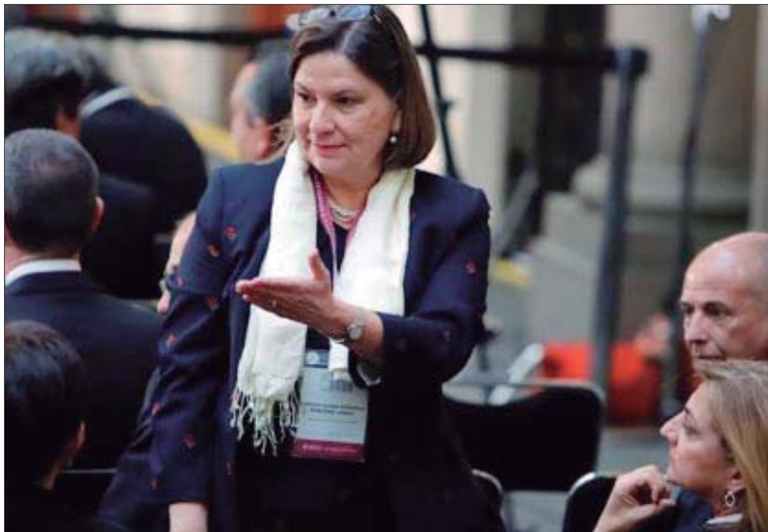
La diplomática Martha Bárcena ha sido un ejemplo de defensa nacional en el extranjero