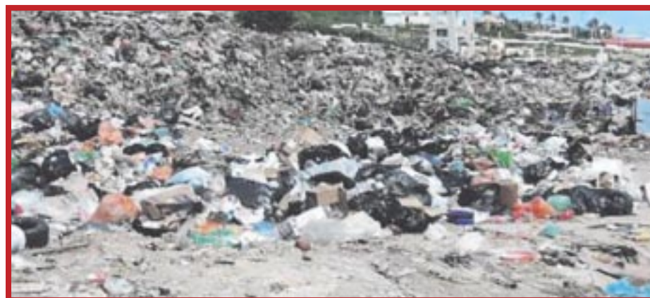
En Isla Mujeres proponen crear relleno sanitario propio, para no compartir más con Cancún y evitar mayores daños ambientales.

Mientras tanto, la empresa paramunicipal de Benito Juárez (Cancún), afirman que incumplió con el proyecto de saneamiento de la instalación anterior “Sin que conozcamos las cláusulas del contrato, evidentemente se ha violado el acuerdo en muchas ocasiones desde que inició el proyecto conjunto. O los Regidores y servidores públicos son comprados para dejar pasar todo, o pecan de ingenuos por negligencia”, señalaron.