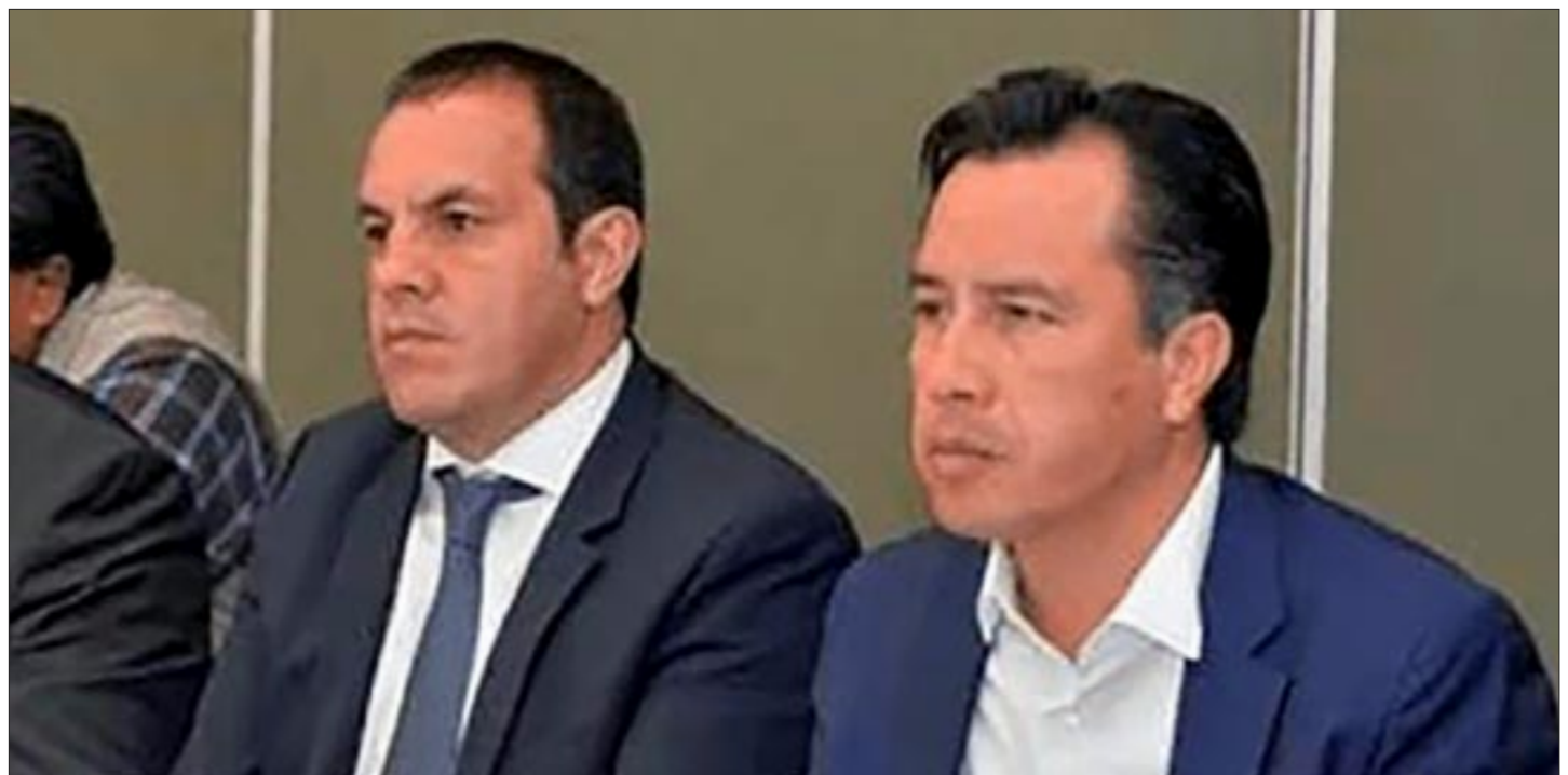
Los gobernadores Cuauhtémoc y Cuitláhuac son terroríficos, arbitrarios, pendencieros, ineptos y torpes.