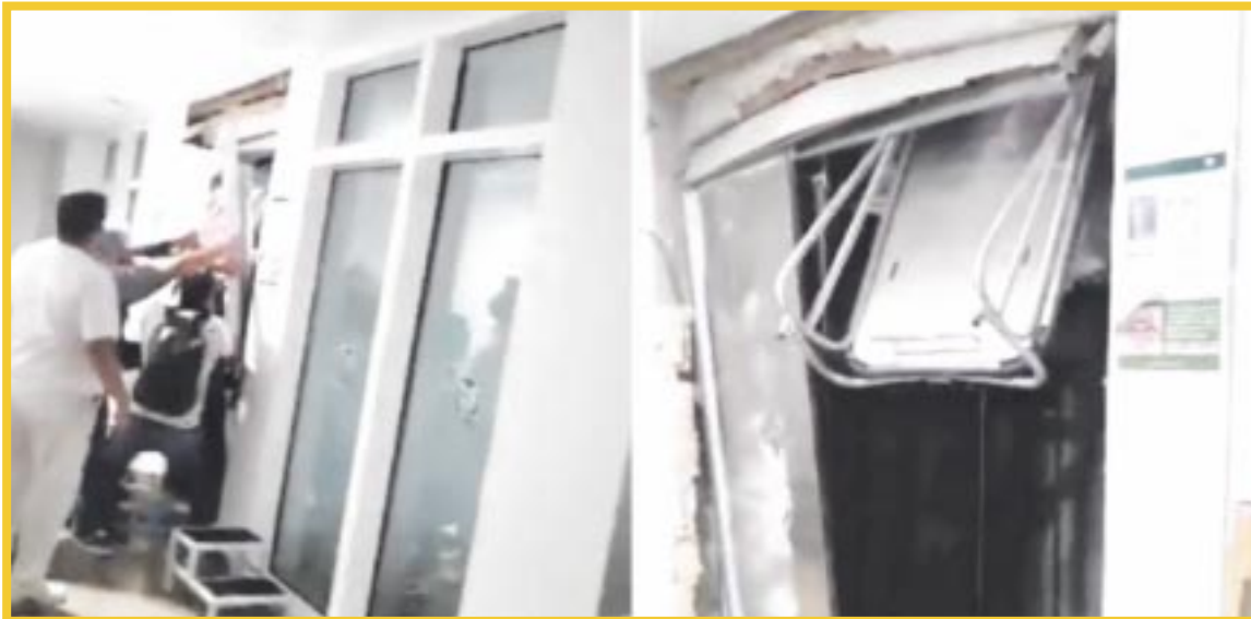
El IMSS, reveló los avances de investigación sobre el caso de la niña que murió tras falla de un elevador en Playa del Carmen.

Sobre la empresa de mantenimiento Sitravem, se informó que siguen las investigaciones internas en todas las delegaciones del IMSS, ya que existe un total de 30 contratos, los cuales suman 35 millones de pesos de 2019 a la fecha que han sido destinados al mantenimiento de elevadores.