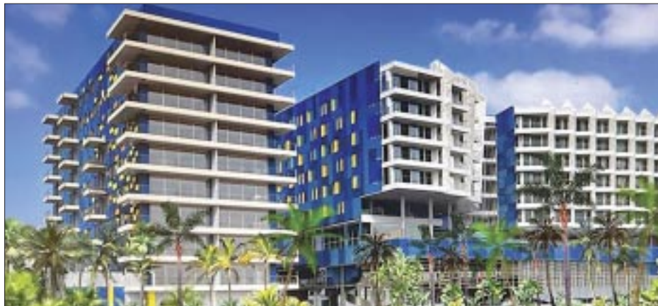
El hotel abrirá en septiembre próximo.

victoriagprado@gmail.com Twitter: @victoriagprado