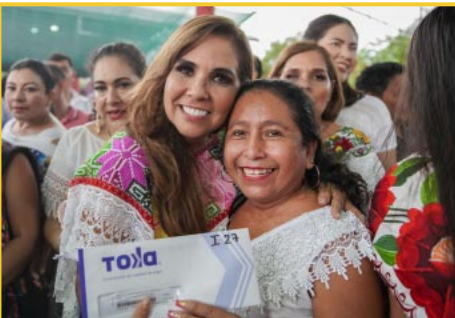
La gobernadora Mara Lezama, siempre cercana a la ciudadanía, destacó que son más de 39 mil tarjetas del programa Mujer es Poder que se distribuyen en todo el estado.

* Mara Lezama destacó que son más de 39 mil plásticos que se distribuyen en todo el estado