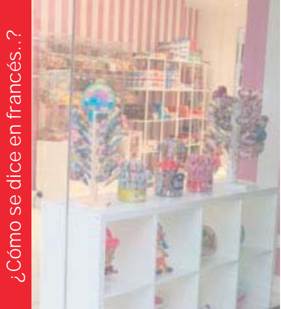
¿Cómo se dice en francés...?