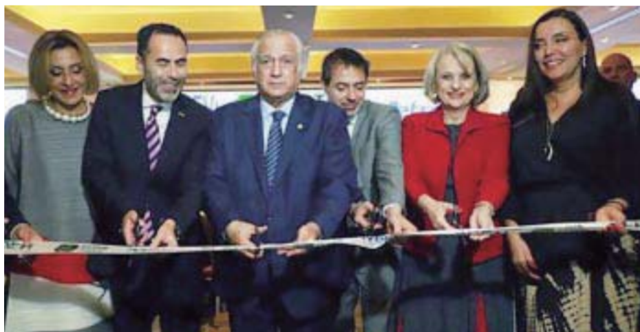
El corte de listón para iniciar los trabajos formales.

victoriagprado@gmail.com Twitter: @victoriagprado