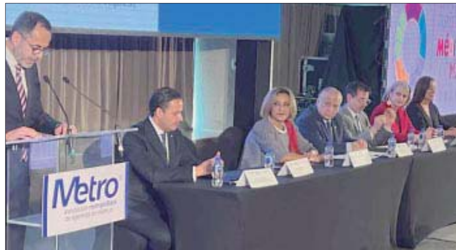
Durante la presentación de EPTUR.

El país invitado para esta versión de EPTUR fue España y, en su oportunidad, el embajador español en México, Juan Duarte Cuadrado , reconoció que, durante la pandemia, mientras varios países cerraron sus vuelos,