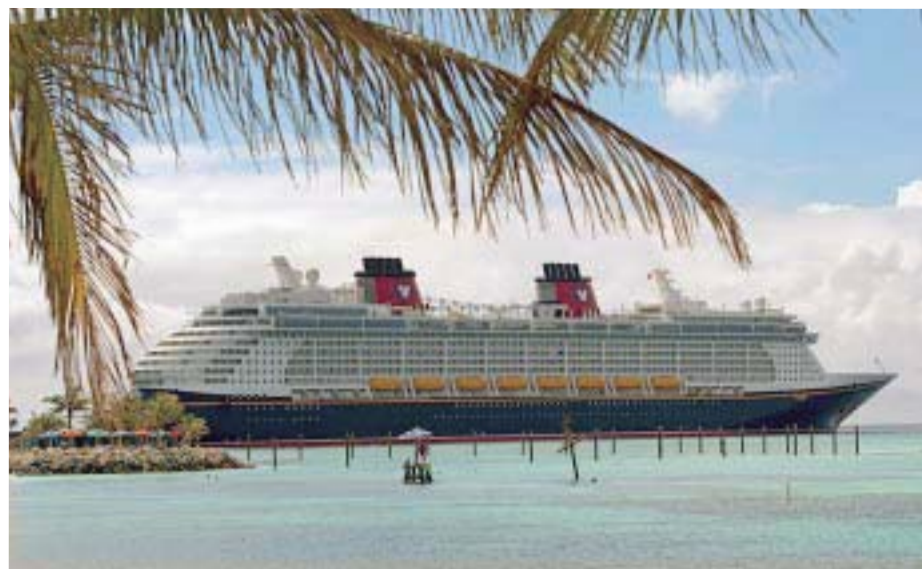
En los barcos, la diversión es garantizada.

CruiseLatino.com/Itinerarios2024 o visita a tu agentes de viajes favorito.