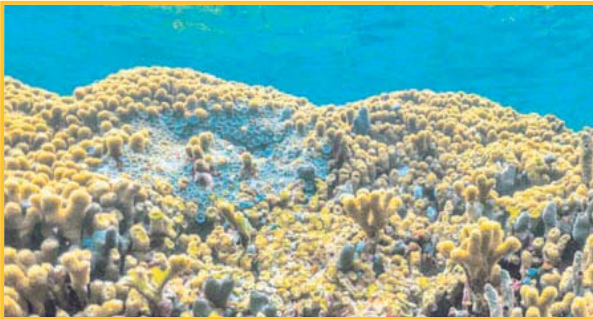
Sema, autoridades ambientales y ONGs Trabajan por una mayor protección al Sistema Arrecifal Mesoamericano.

Se dieron a conocer diversos temas y acciones que se requieren para promover la conservación de la mayor barrera arrecifal del Atlántico, como la gestión de recursos, la realización de convenios, fideicomisos y fondos ambientales, fortalecimiento institucional que redunde en el bienestar social de todos.