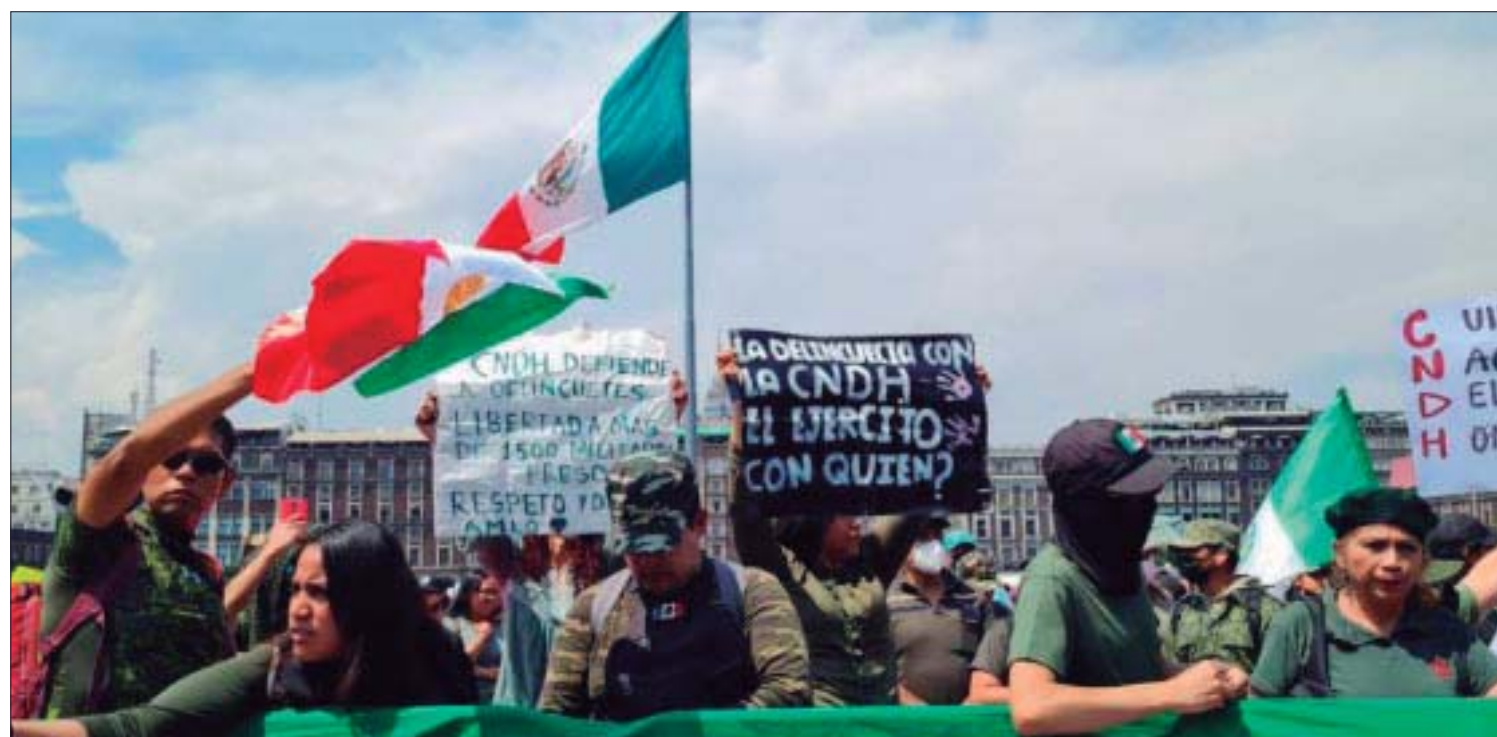
El hartazgo se está manifestándose a través de mítines o marchas.

*Conductor del programa Va en serio, Mexiquense TV Canal 34.2, IZZI Canal 135 y Mexiquense Radio