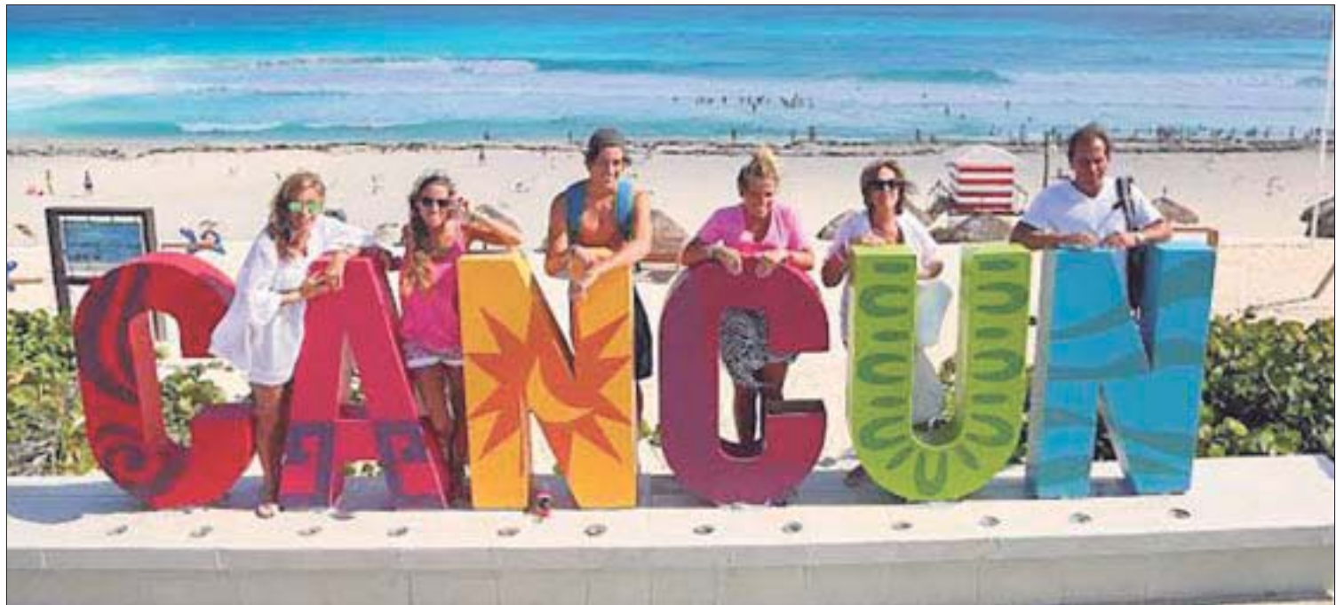
Desarrollan estrategias de protección y apoyo en materia de asistencia y contacto consular para turistas extranjeros en Cancún.

– Tendrán asistencia y contacto consular para víctimas de delitos