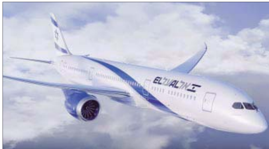
Iniciará la ruta Melbourne-Tel Aviv.

– Importantes iniciativas encaminadas a reducir el impacto ambiental pretende grupo Heineken