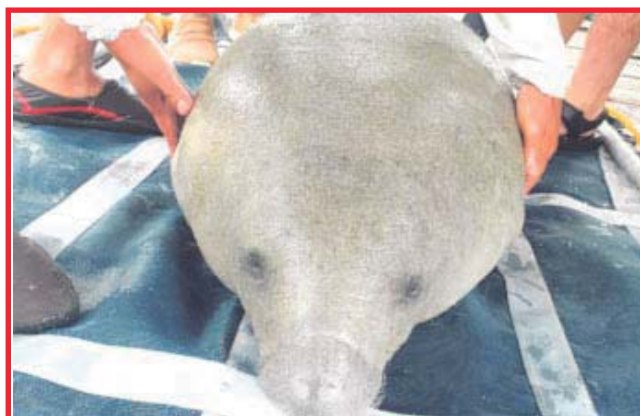
Verifican estado de salud del manatí “Pompeyo” que se encuentra en rehabilitación en el CARMA de Laguna Guerrero, Chetumal.