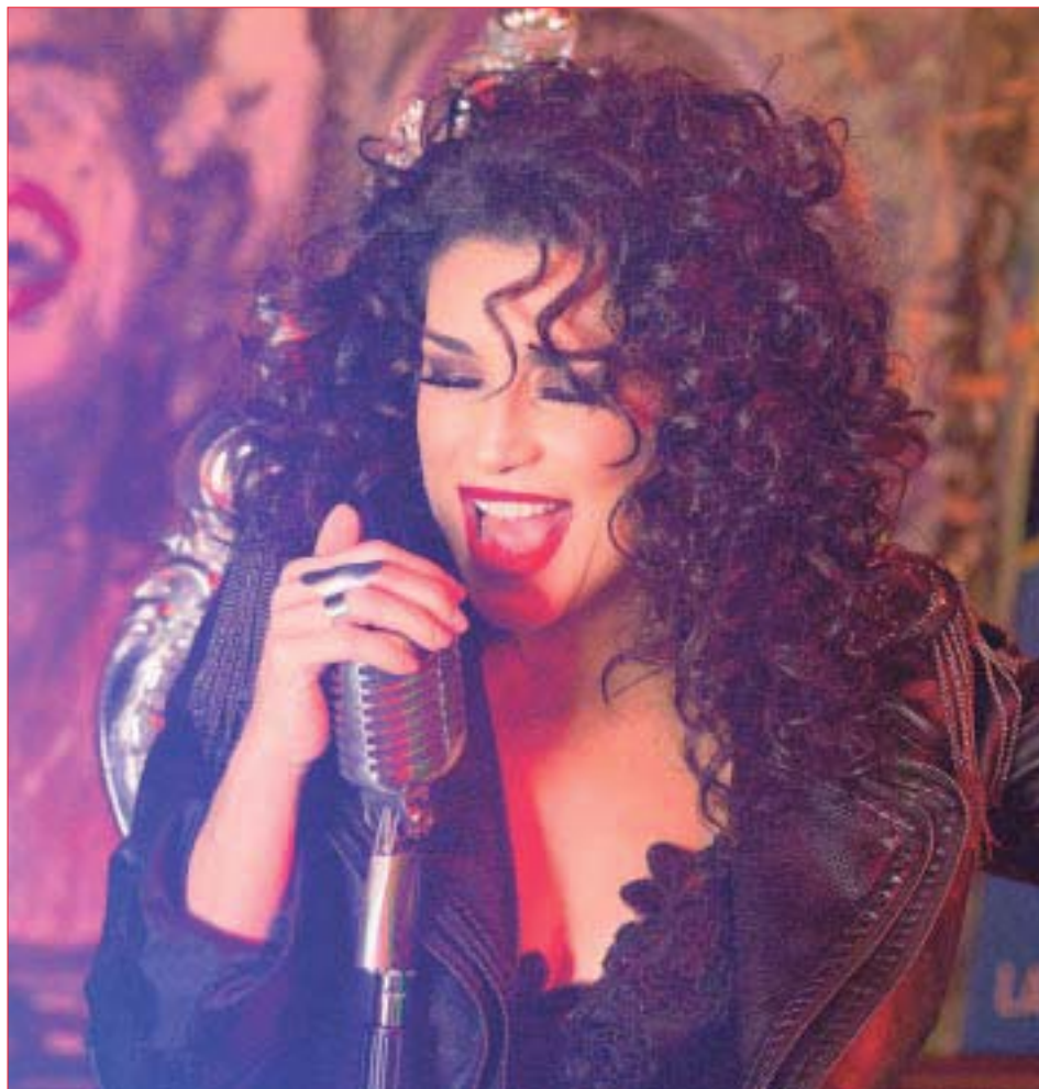
La cantante alista el lanzamiento de su nuevo disco "11/11", cuyo número afirma, es un código espiritual.

me encantaría, pero estoy concentrada en mi música, quiero reiniciar mi carrera. Aunque la actuación siempre va conmigo, el intérprete hace eso, cantar y ser el personaje de la canción".