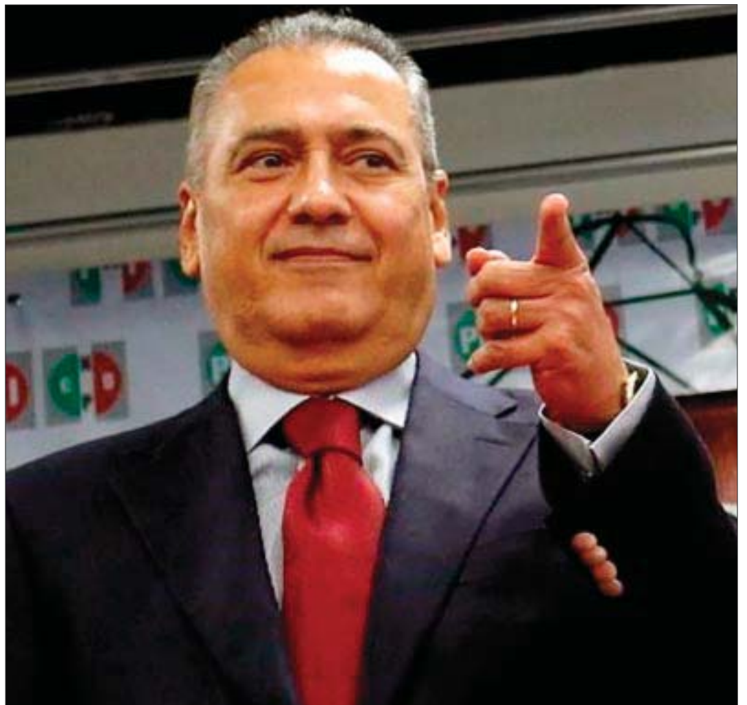
Manlio Fabio Beltrones regresa y deja sentir su músculo.