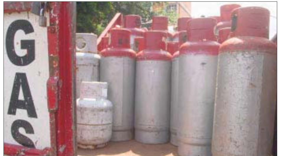
Muchos consumidores finales de gas LP compran, sin saberlo, el combustible que se ordeña en ductos.

La industria del gas LP ha hecho un llamado para que la Comisión Reguladora de Energía (CRE) replantee la