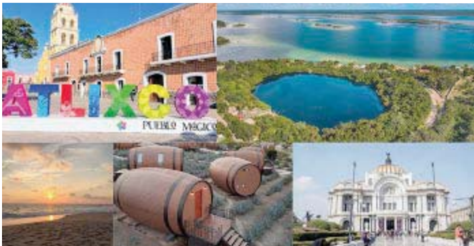
Los cinco destinos recomendados para vacaciones.

victoriagprado@gmail.com Twitter: @victoriagprado