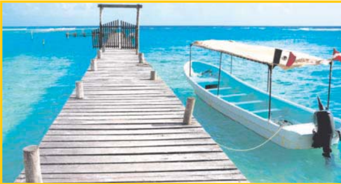
Chetumal y Mahahual , que pertenecen a la marca Grand Costa Maya, tendrán presencia en el Tianguis Turístico México 2023.

El director de Desarrollo Turístico de Othón P. Blanco agregó que prácticamente cada una de las 19 comunidades de la Ribera del Río Hondo cuentan con un balneario y es lo nuevo que llevan a la CDMX en busca de incrementar la presencia del turismo nacional e internacional en el sur.