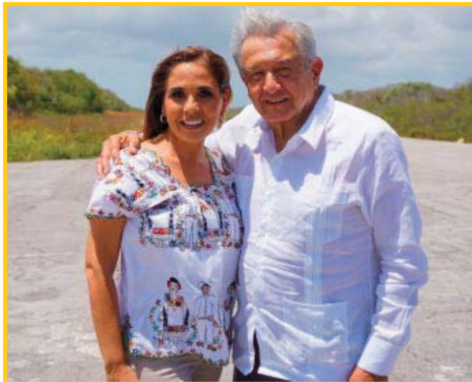
La gobernadora Mara Lezama acompañó al presidente Andrés Manuel López Obrador al recorrido de supervisión de los avances en salvamento arqueológico.

La gobernadora precisó que, las Jornadas Humanita-