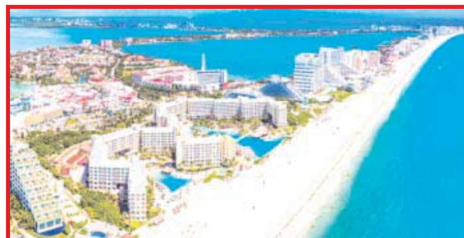
Empresarios de Cancún , demandan garantías para la seguridad y buena imagen del destino, principalmente en la Zona Hotelera.

Con esto se busca atraer la atención del turismo alternativo, el de naturaleza y de preservación y cuidado del medio ambiente en lugar del turismo de masa, que se enfoca principalmente en sol y playa “de acuerdo con diversos estudios, de cada 100 dólares que traen los turistas alternativos, 75 dólares se quedan en la comunidad; mientras que, en el turismo de masa, de cada 100 dólares solo 50 se dispersan entre la población”.