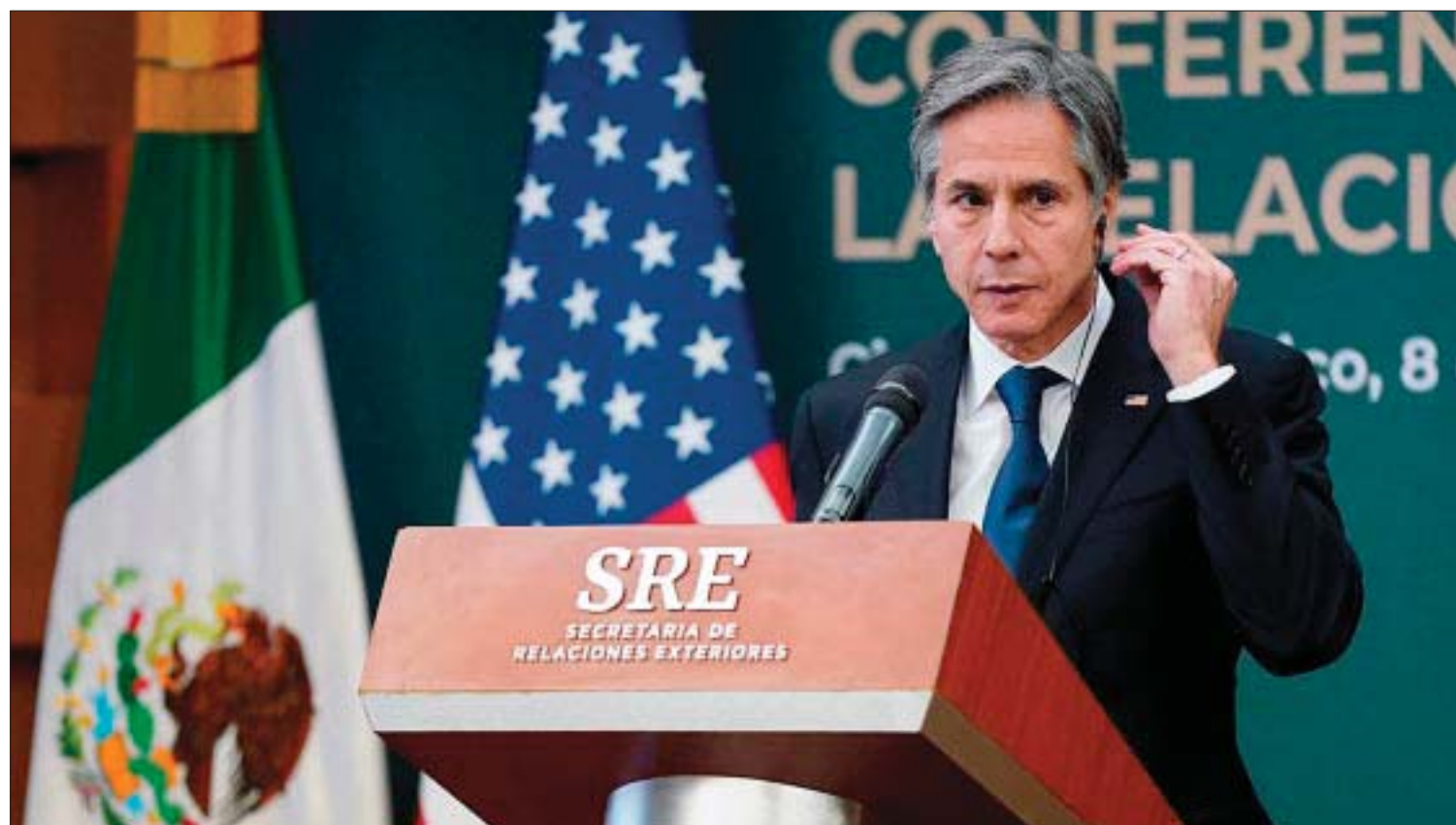
El secretario de Estado de Estados Unidos, Antony Blinken, señaló que el fentanilo está “matando a decenas de miles de estadounidenses y también a mexicanos”

*Conductor del programa Va en serio, Mexiquense TV Canal 34.2, IZZI Canal 135 y Mexiquense Radio