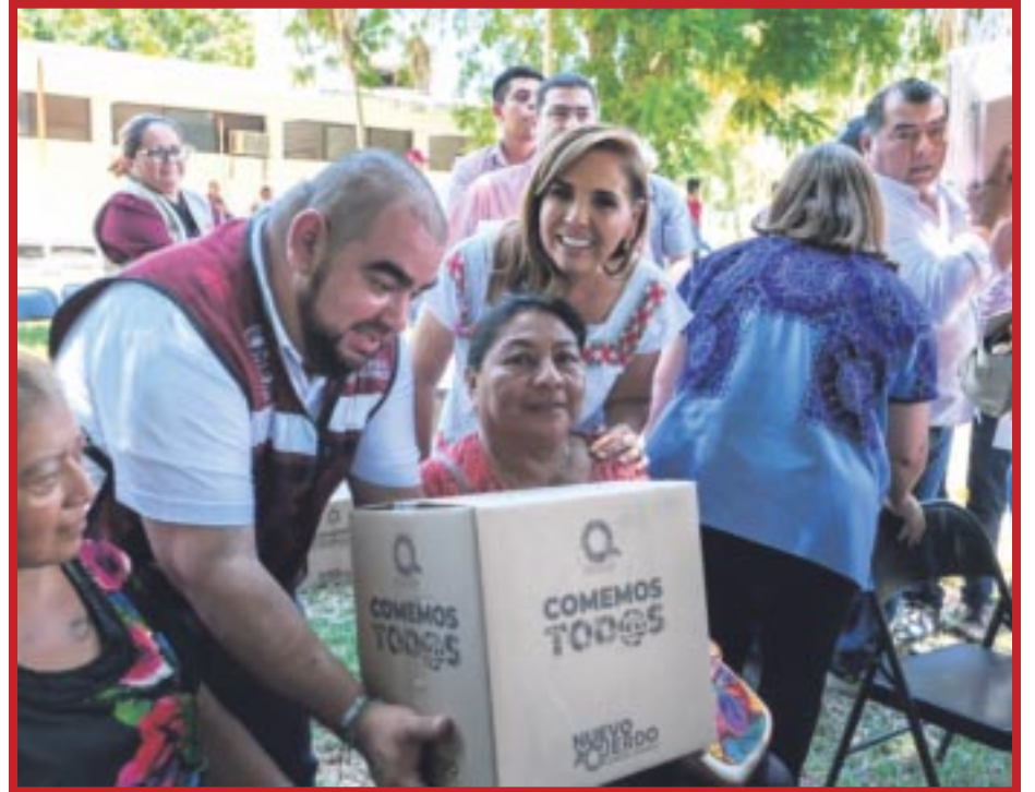
Mara Lezama, de propia mano, hizo entrega de las despensas con productos de la canasta básica, a beneficiarias del programa “Mujer es Vida” de la capital del Estado.