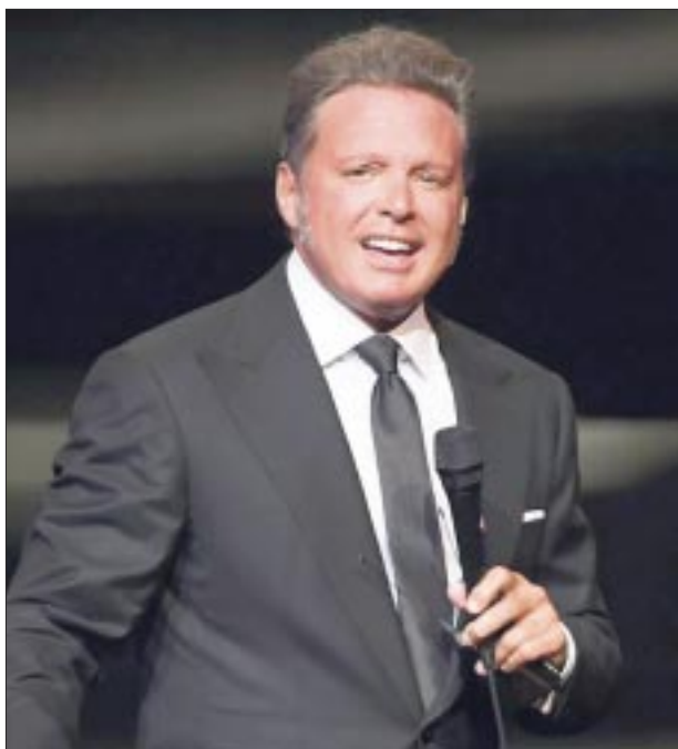
“El Sol” continúa siendo todo un fenómeno musical en el mundo entero.