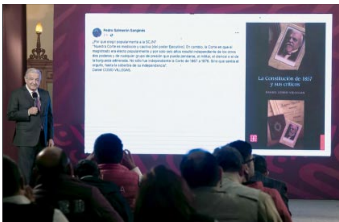
El enfrentamiento de los tres Poderes de la Unión nace en el propio Palacio Nacional.