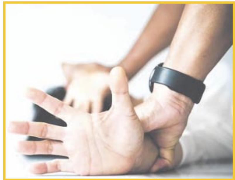
Fue aprobada la creación del Registro de Personas Agresoras Sexuales en el estado.

Se tratará de un sistema de información que contendrá los registros de personas sentenciadas con ejecutoria por un juez penal, cuya inclusión de una persona en dicho registro será realizada por la Secretaría de Seguridad Ciudadana.