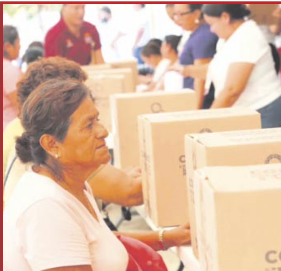
En el Instituto de Capacitación para el Trabajo se entregarán cinco mil 300 despensas en los próximos tres días y posteriormente, en las sedes Hábitat II y Hábitat III.