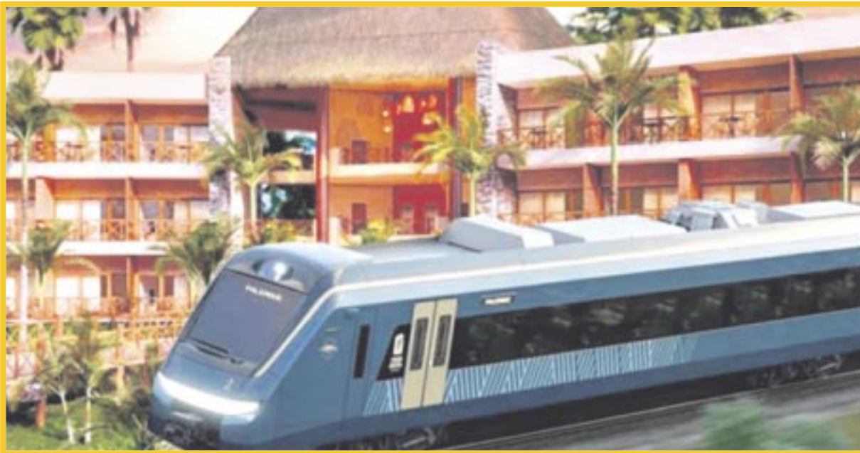
La Sedena informó que el hotel Tren Maya en Tulum quedará listo en tiempo y forma.