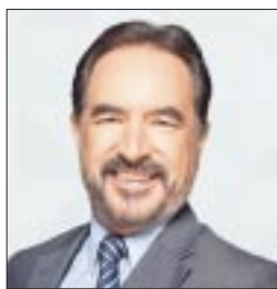
Por Carlos Ramos Padilla*

Por donde se vea, el país se está fracturando. Entiendo entonces por qué el ánimo social está a la baja y la confrontación está incrementándose. No hay día que no dejemos de enterarnos de un conflicto, un agravio o un acto de corrupción. Desde el amanecer, la nación despierta con una mañana cargada de odio, acusaciones, enfrentamientos. Las malas noticias abundan.