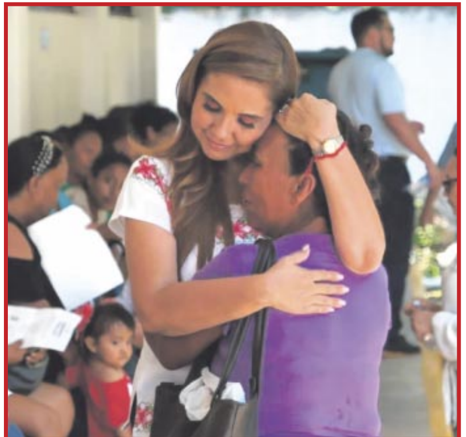
La gobernadora Mara Lezama les pidió a mujeres beneficiarias del programa “Mujer es Vida” sumar esfuerzos y estar unidas para salir adelante, sin que nadie se quede atrás.