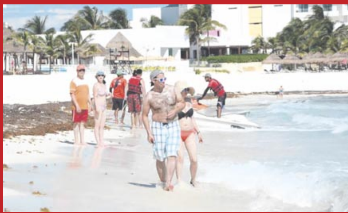
Se pronostica para Cancún clima bochornoso en el transcurso del día y cálido por la noche y madrugada.

Cancún.- En Quintana Roo se mantendrá el clima caluroso con cielo medio nublado durante el día y chubascos ocasionales sobre algunas zonas, ante la afectación de la entrada de aire húmedo proveniente del Mar Caribe y del Golfo de México hacia la región peninsular.