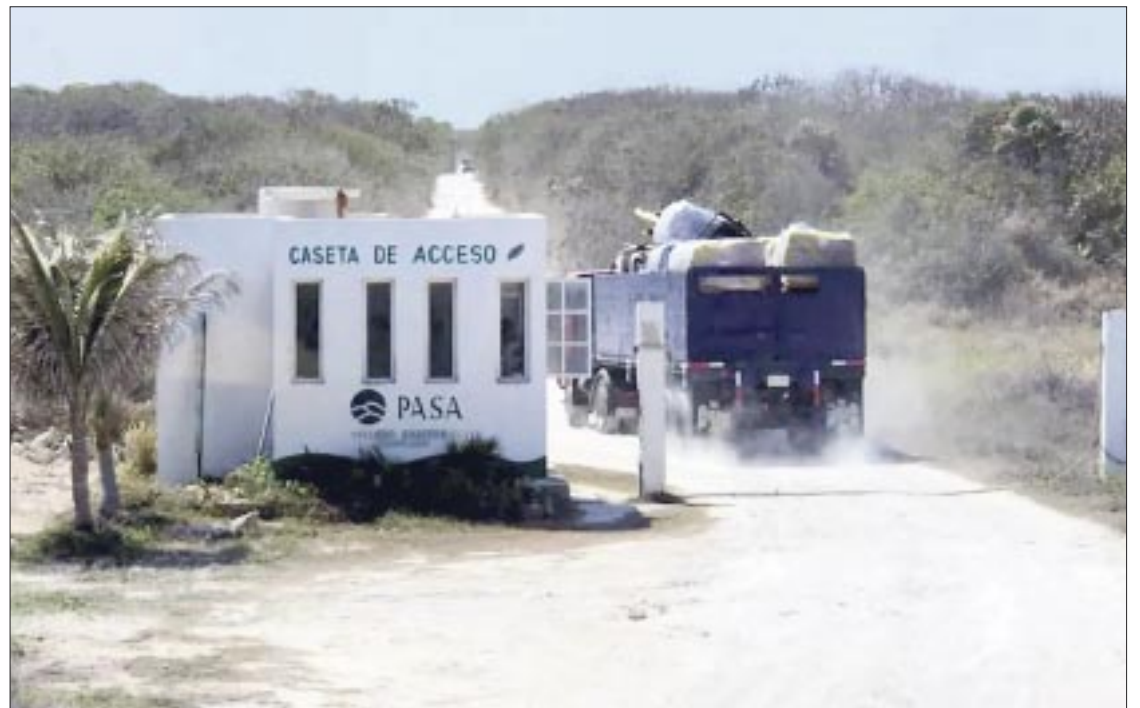
La Dirección de Ecología de Cozumel abrió una investigación sobre el manejo y destino final de la basura que llega a través de los cruceros.