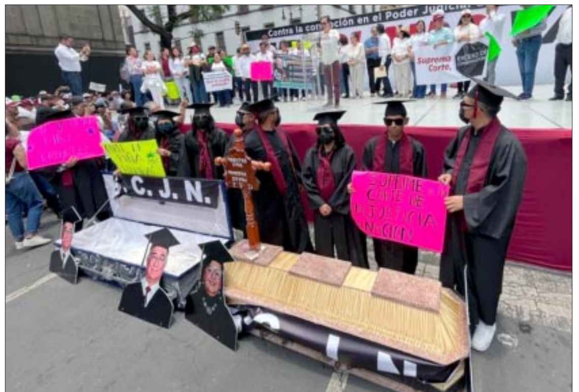
En pleno Zócalo un grupo de fanáticos quemaron la imagen de la ministra Norma Piña.