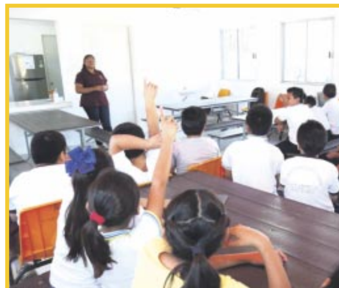
La Secretaría de Educación de Quintana Roo rechazó contundentemente la opción de ampliar el horario de clases en Quintana Roo.

Finalmente, adelantó que harán una revisión de la propuesta de los padres de familia para ampliar una hora el horario de clases, pero es un criterio que da la Secretaría de Educación Pública (SEP) “la petición de ampliar el horario de clases no viene de la asociación estatal de padres de familia, con quien trabajamos directamente, escuchamos a todas las voces, pero si tenemos que ser muy serios en el sentido de lo que convenga” concluyó.