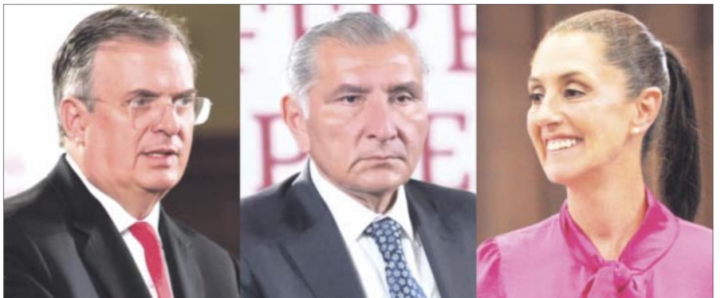
Marcelo Ebrard, Adán Augusto López y Claudia Sheinbaum se mantienen en la carrera por la candidatura presidencial.