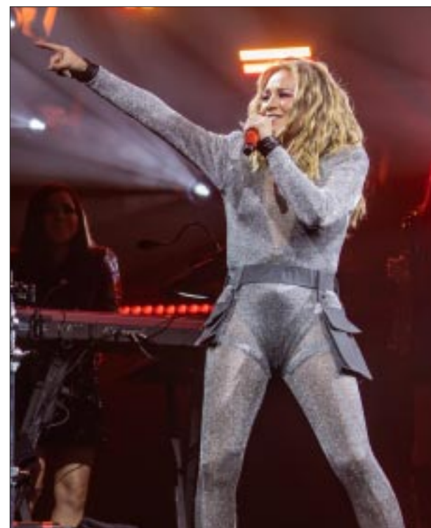
Entre otros temas “La Josa” cantó “Este Hombre No Se Toca”, “Tú Ya Sabes a Mí”, “Te Besé”, “Lo Que Te Mereces”, “La Loca” y “No Soy Una Señora”.