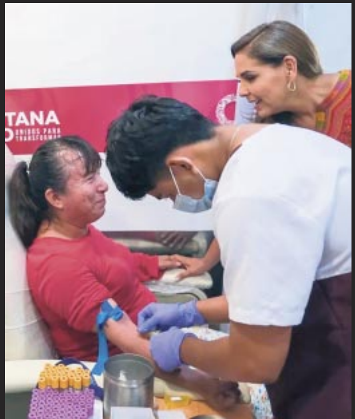
El programa Salud para Tod@s llegó a Villas Otoch Paraíso con la supervisión de la gobernadora Mara Lezama.

De acuerdo con la Secretaría Estatal de Salud (Sesa),