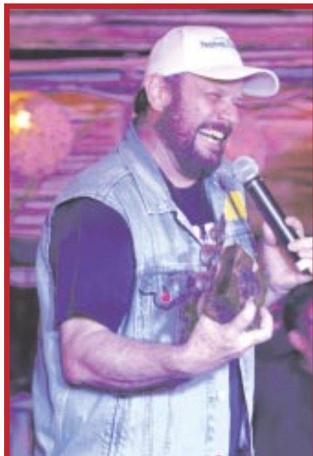
Con los éxitos “Ojalá”, “Tómame o déjame”, “Un buen perdedor” y “Cantares”, entre otras, Nicho Hinojosa cautivó a los presentes, que pedían más canciones y no querían que concluyera su espectáculo.