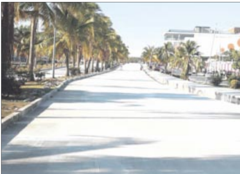
Celebran avances acelerados de las obras en el Boulevard Colosio en Cancún.

- Prevén autoridades terminar los trabajos antes del tiempo acordado