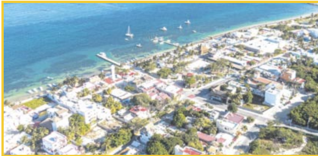
Este año se espera superar las 7 mil habitaciones de hotel en Puerto Morelos.

Se anticipa que, para el verano, la expectativa es mantener promedios de 90 por ciento de ocupación, previendo que sea a mediados de junio cuando comience a elevarse la afluencia de visitantes para tener una recuperación considerable. “El 2022 fue totalmente atípico para todo el estado y Puerto Morelos también alcanzó cifras récord, por lo que este año ya se tenía prevista una ligera baja, pero lo positivo es que