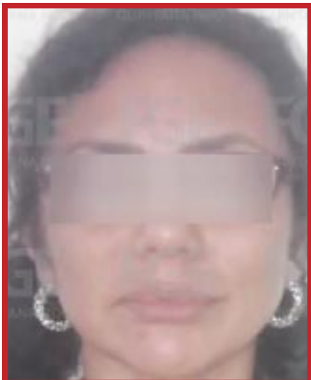
Se detuvo a una mujer extranjera, que organizaba las fiestas clandestinas.

Con estas acciones, la Fiscalía General del Estado, cumple su encomienda de investigar actos que vulneren la seguridad de las niñas, niños y adolescentes, con lo que se suma al Nuevo Acuerdo por el Bienestar y Desarrollo de Quintana Roo.