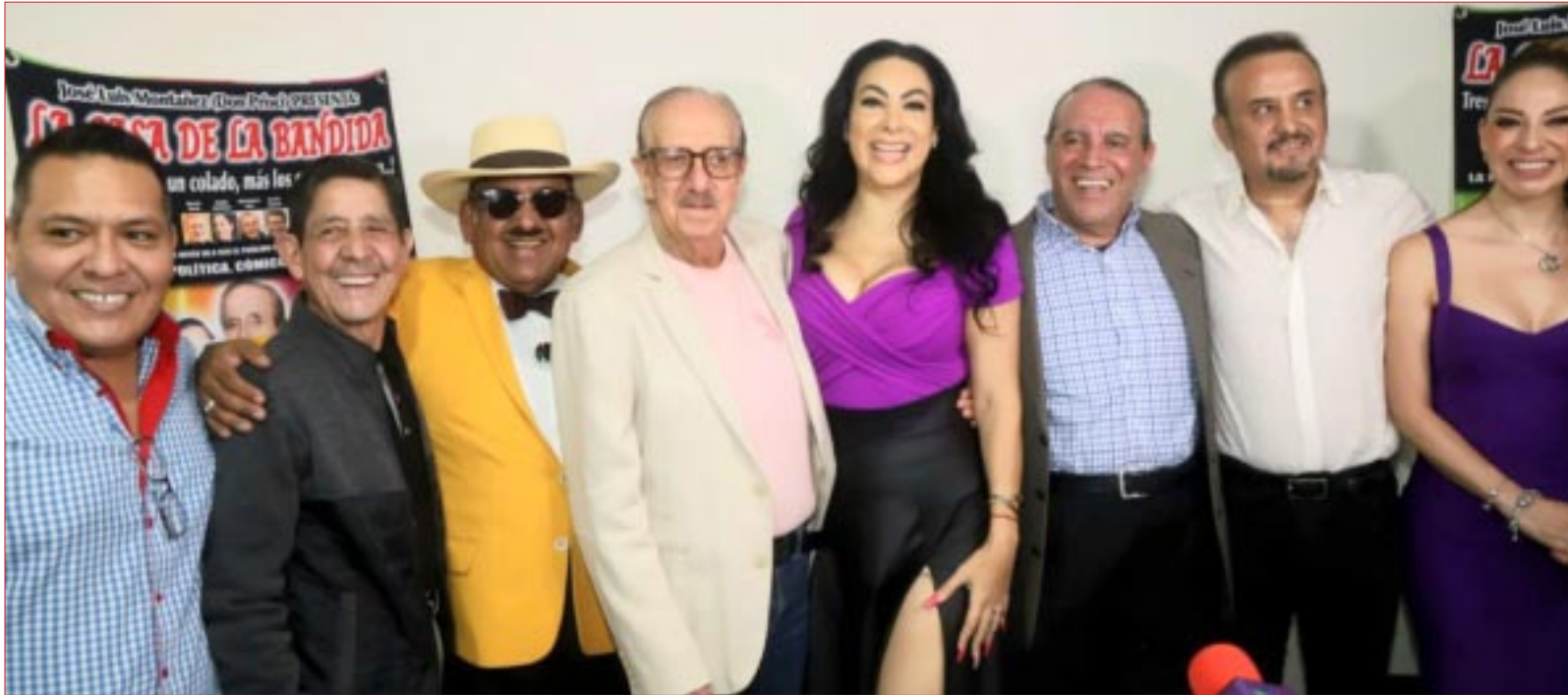
“La Casa de la Bandida, tres corcholatas, un colado, ¡más los que se apunten!” es un homenaje a Carmen Salinas y se estrenará el próximo 7 de junio.

Homenaje a Carmen Salinas en el marco del Día de la Libertad de Expresión