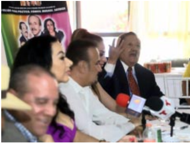
Pepe Arévalo y sus Mulatos van a poner el toque musical con clásicos de su repertorio y de otros grandes artistas.