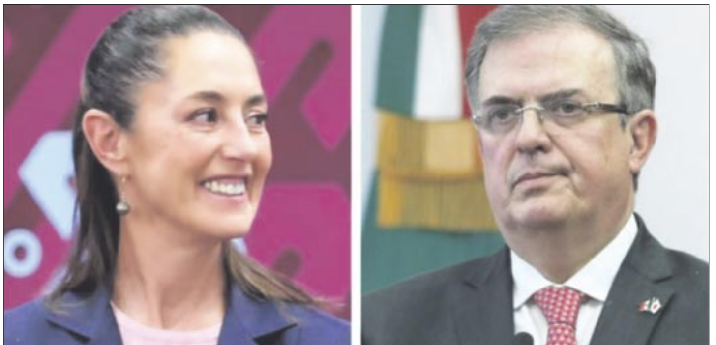
Solamente Claudia Sheinbaum y Marcelo Ebrard se enfilan a la disputa final por la candidatura morenista.