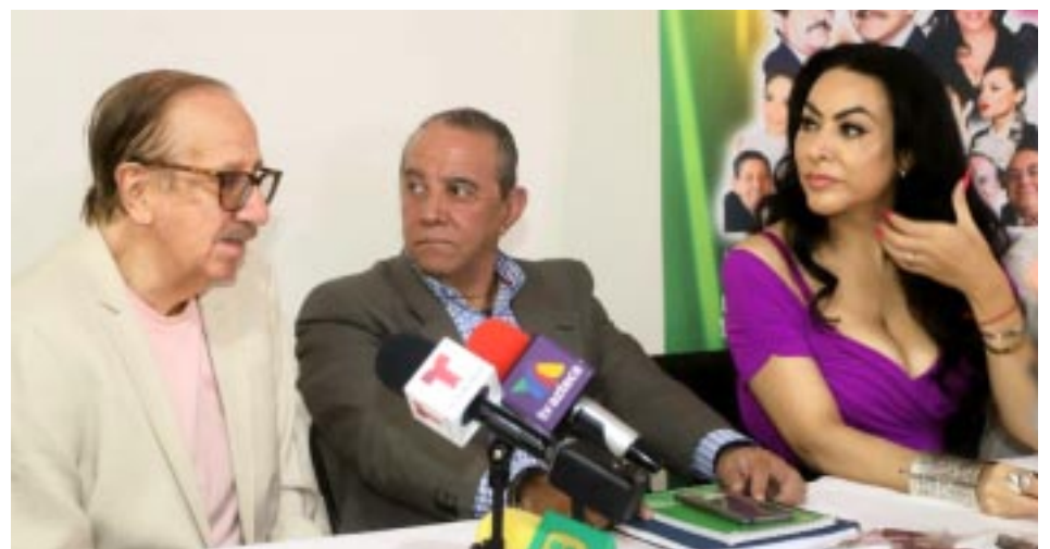
Jesús Martínez Rentería, conocido popularmente como Palillo , regresará a la vida gracias al gran talento del maestro Benito Castro.