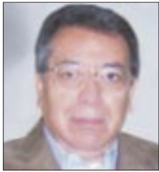
Por Roberto Vizcaino

Hasta hoy, el poder de las armas en México no había estado sometido al civil como ahora.