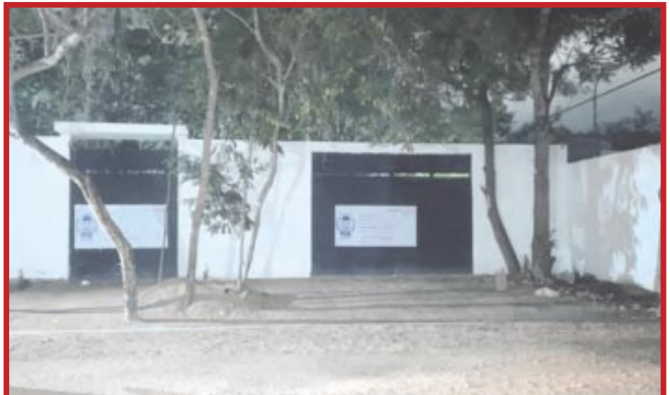
Tras un cateo se aseguró en la Supermanzana 523, en Cancún, un inmueble en el que se realizaban fiestas clandestinas que permitían el acceso a adolescentes.