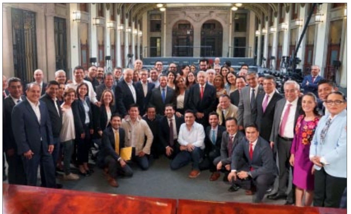
Los gobernadores de Morena, Claudia Sheinbaum y miembros del gabinete expresaron su respaldo incondicional a AMLO en lo que respecta a su criterio, muy personal, en política exterior.

*Conductor del programa Va en serio, Mexiquense TV Canal 34.2, IZZI Canal 135 y Mexiquense Radio