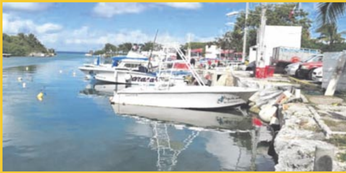
La Apiqroo realizará mesas de diálogo con prestadores de servicios en la Caleta en Cozumel para inspeccionar instalaciones.