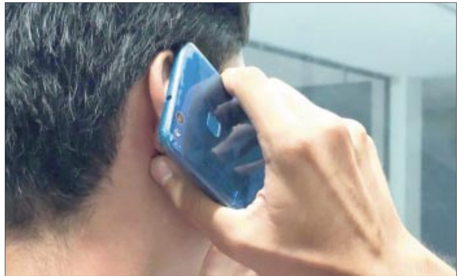
En este año, las entidades con más casos de secuestro de menores de edad son Ciudad de México y Edomex, de acuerdo con registros oficiales.

— Ciudad de México y Edomex, de las entidades con más reportes: Redim