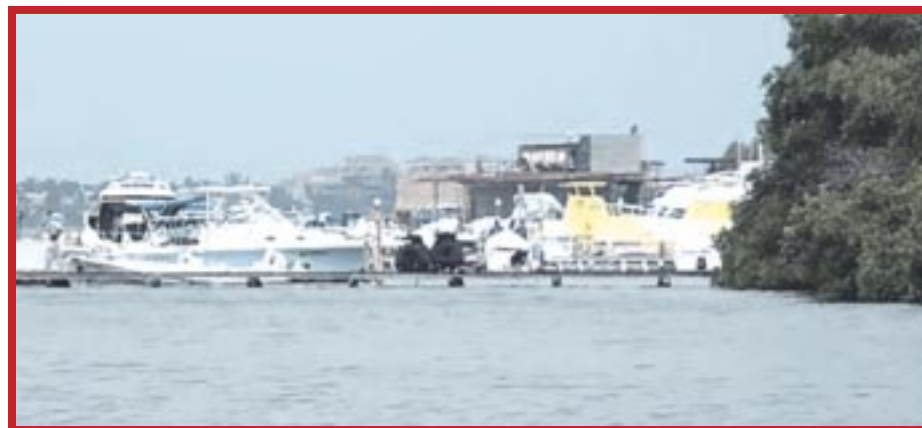
Asociados Náuticos de Q. Roo y la Conanp reforzarán la seguridad de las áreas naturales protegidas.

La Conanp contaba con dos embarcaciones y se complicaban los recorridos por toda la zona arrecifal, especialmente en las temporadas altas, no obstante, ahora podrán tener mejores operaciones. Durante la última encuesta que se hizo se pudieron identificar 300 embarcaciones pirata en todo el destino y si bien, la Conanp no tiene recursos para resolver esta problemática, sí podrán cuidar el área protegida.