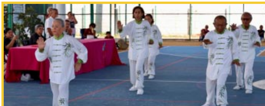
En los Juegos Estatales Deportivos y Culturales de Personas Mayores 2023 participaron 224 atletas de 10 municipios de la entidad quienes disfrutaron de estas actividades que también pretende resarcir el tejido social y mejorar la calidad de vida de quintanarroenses.

Los ganadores de los primeros lugares en deporte de natación en categoría varonil y femenil de dorso y crol fueron los municipios de Bacalar, Benito Juárez, Puerto