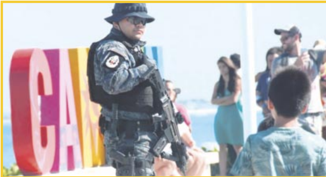
Reconocen autoridades policiacas que los destinos turísticos atraen a la delincuencia.

El titular de la Secretaría de Seguridad Ciudadana, Julio César Gómez Torres, reconoció que actualmente se enfrentan a un gran reto en materia de seguridad en el estado, pues los municipios con más turismo y actividad económica resultan atractivos para los grupos delincuenciales, por lo tanto hay mayor incidencia.