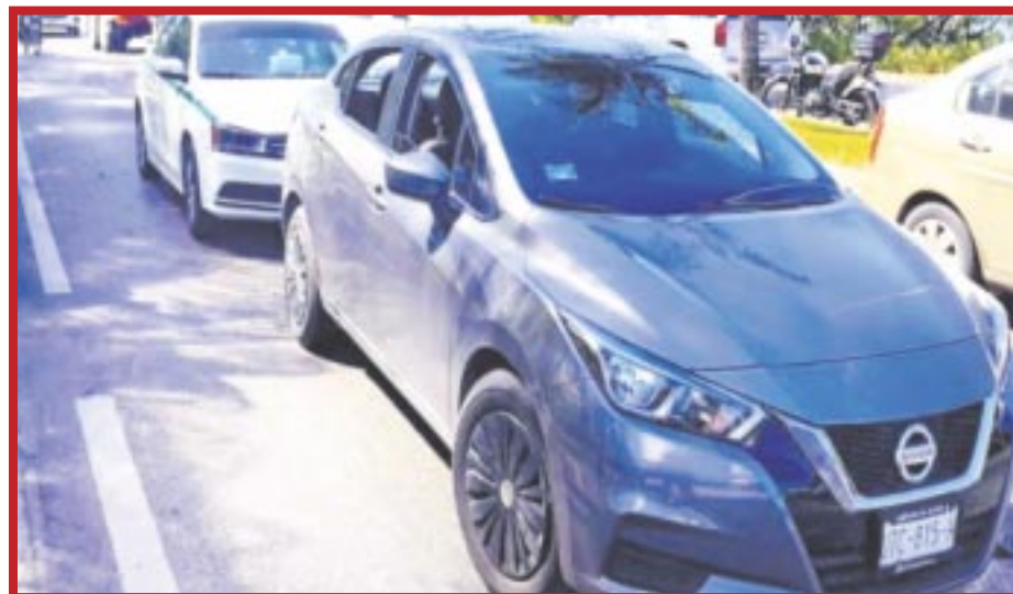
Empresas de Renta de Vehículos implementarán Inteligencia artificial para frenar el robo de sus unidades.