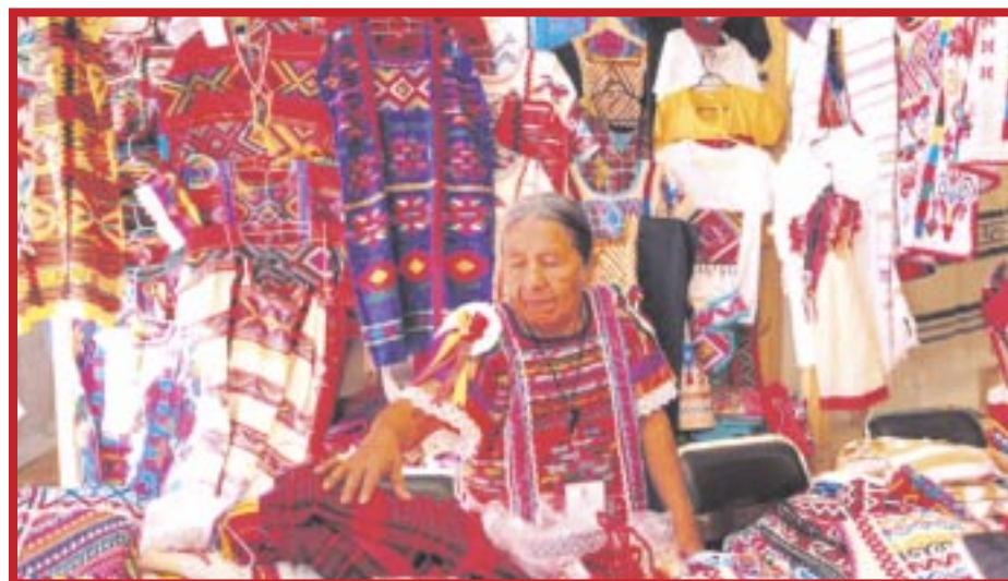
Con la presencia de artesanas y artesanos locales, Q. Roo estuvo presente en el tercer Encuentro de Arte Textil Mexicano 2023 en la Ciudad de México.

Con la presencia de artesanas y artesanos locales, Quintana Roo estuvo presente en el tercer Encuentro de Arte Textil Mexicano 2023 en la Ciudad de México.