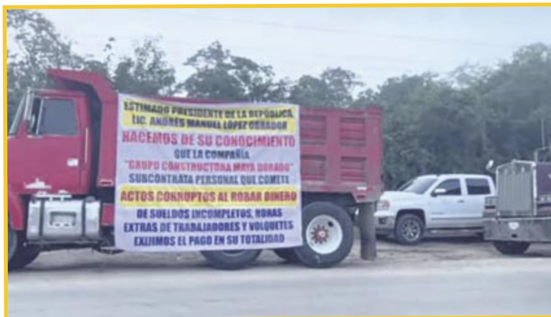
Volqueteros que prestan sus servicios en el tramo 7 del Tren Maya, suspendieron actividades por tiempo indefinido, ante la falta de pagos.

Se trata de aproximadamente 30 volqueteros afectados, quienes afirmaron que no reanudarán actividades en tanto no sea liquidado el adeudo “El paro de labores es por tiempo indefinido” dijo el volquetero, quien nos descartó cualquier otro tipo de manifestación, sino son escuchados.