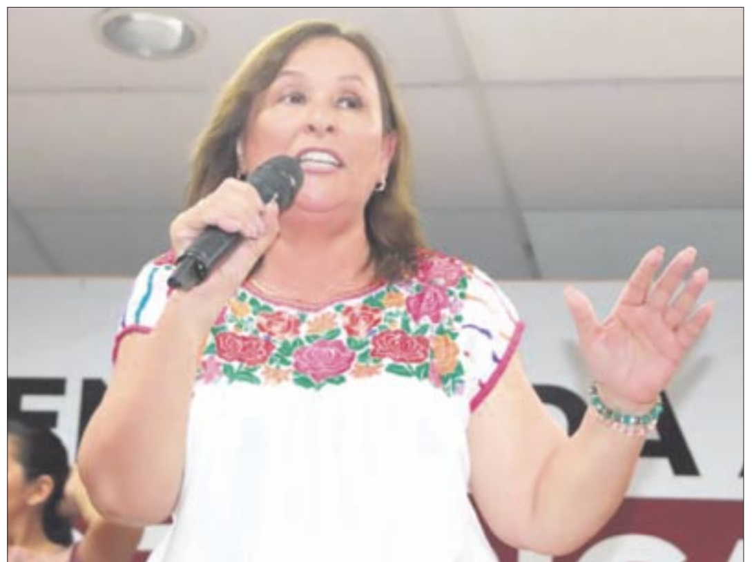
Rocío Nahle no ha sido bien aceptada en diversos sectores de la sociedad veracruzana.

ramonzurita44@gmail.com ramonzurita44@hotmail.com