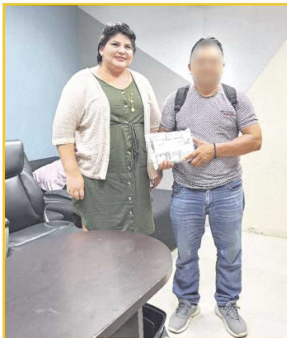
La Fiscalía General del Estado entregó a las autoridades del Comisario Ejidal de Chumpón el recurso robado, que asciende a un millón 200 mil pesos.

Los detenidos fueron llevados a la FGE para su certificación médica, entre otros trámites; posteriormente los trasladaron al Centro de Reinserción Social del municipio de Benito Juárez, donde quedaron a disposición del órgano jurisdiccional correspondiente, que en el término constitucional determinará su situación jurídica.