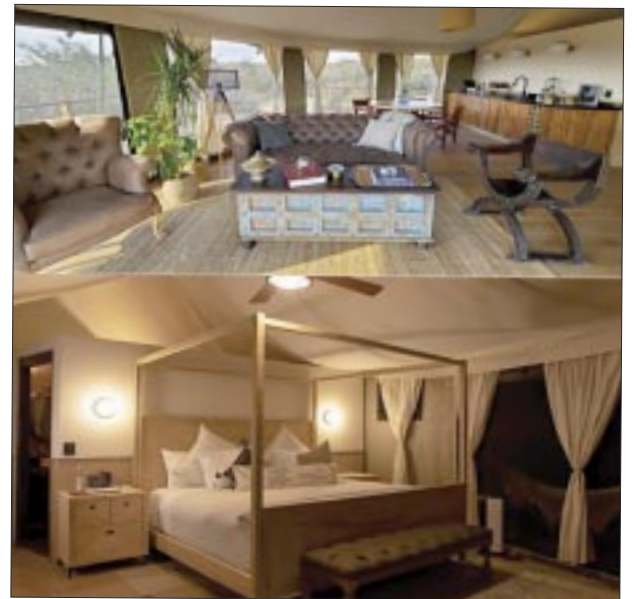
Interior del glamp-sitting .