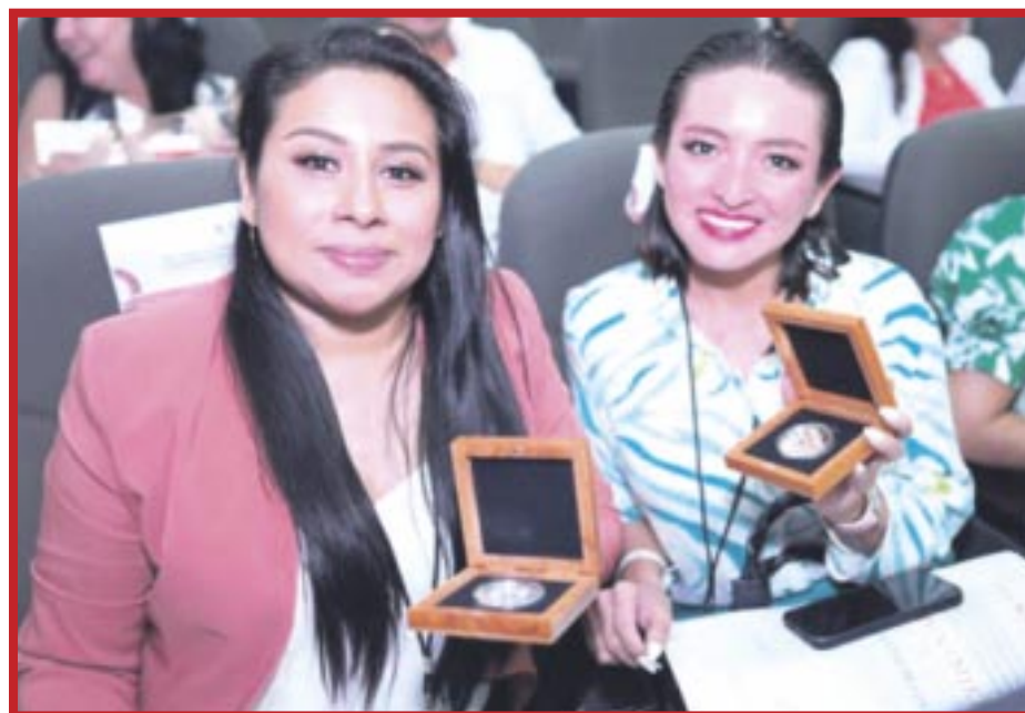
Docentes de Quintana Roo, Campeche, Tabasco y Yucatán, que recibieron el Reconocimiento a la Práctica Educativa 2023.

Los docentes compartieron las estrategias educativas que los han llevado a experiencias exitosas, las cuales se dieron a conocer a través de las relatorías de las cuatro mesas de trabajo, acción que se dio al finalizar el evento.