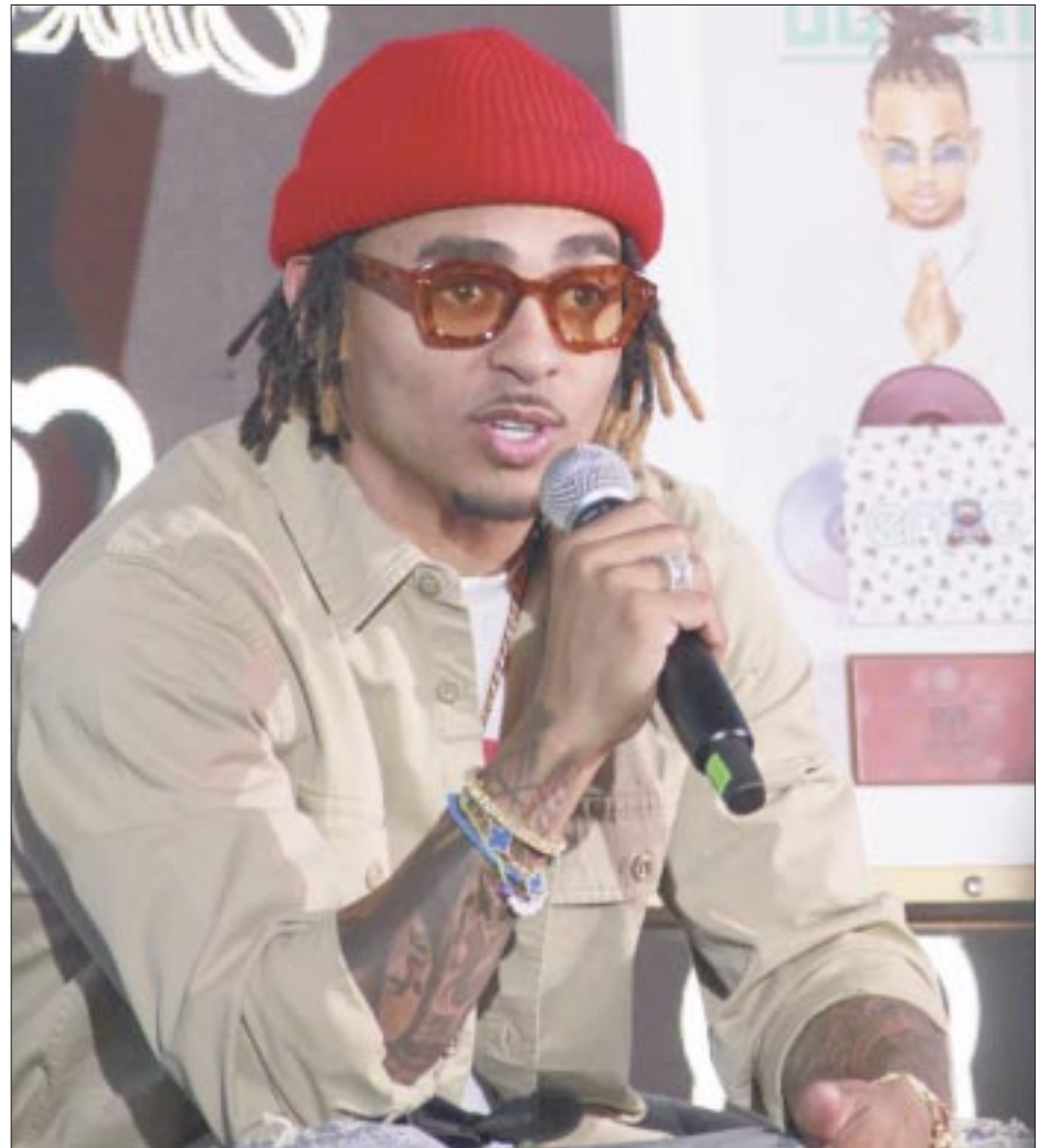
Después de su participación en Flow Fest, Ozuna promete un concierto para los próximos meses en México, pero en solitario.

Así que no te pierdas “Cosmo” la nueva producción de este gran artista que fue acreedor de múltiples reconocimientos por parte de su disquera Sony Music por su gran trayectoria.