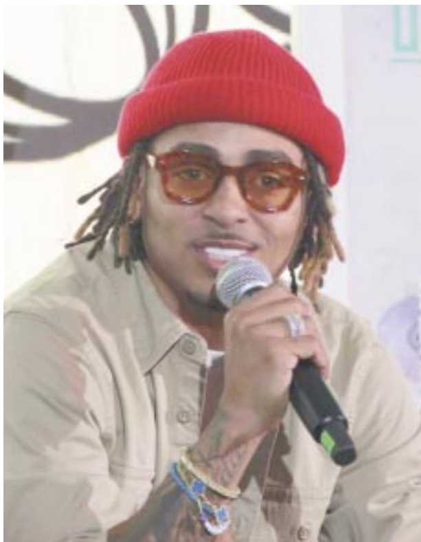
Ozuna marca la humildad y el amor como punto clave de su éxito.