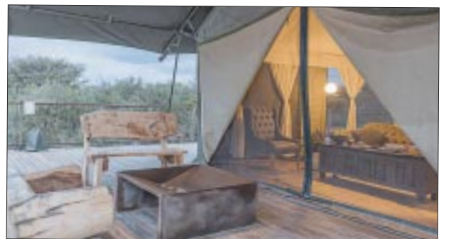
Lugar ideal para una escapada romántica y tranquila.

te y contar con más recursos para aprovechar en el destino, en beneficio directo de la derrama económica local.