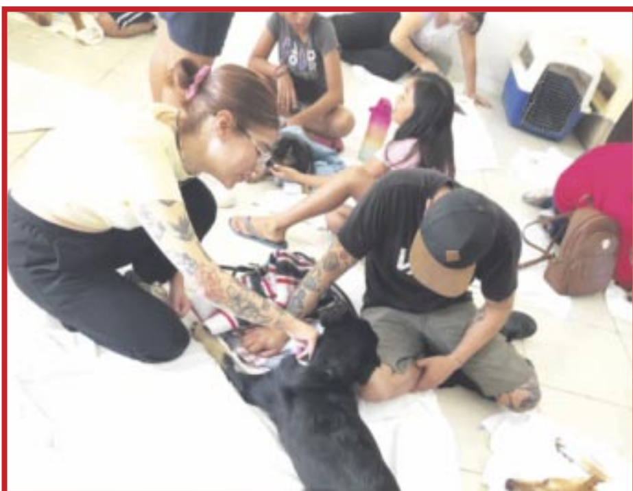
El Instituto de Biodiversidad y Áreas Protegidas de Quintana Roo participó en la campaña de esterilización masiva y gratuita de animales domésticos en Playa.

Durante esta actividad se contó con la presencia de personal del Centro de Control Animal, Asistencia y Zoonosis de Solidaridad, quienes apoyaron también como voluntarios en diversas áreas, además de encargarse de constatar que estas cirugías fueran realizadas bajo los parámetros de calidad pertinentes, que aseguraron la dignificación y el bienestar de todos los animales intervenidos.