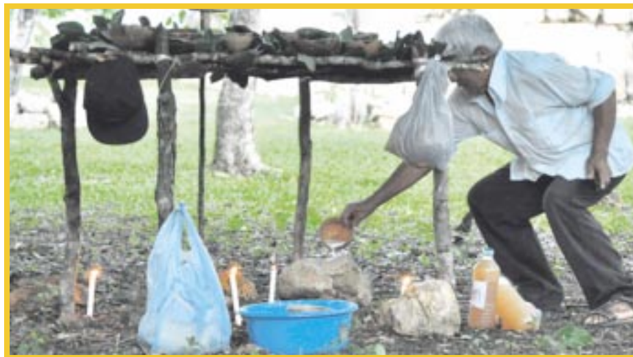
Denuncian desplome de las prácticas ancestrales mayas, por intolerancia religiosa.

En este marco dijo que “Para resguardarlas, es importante fomentar las costumbres en las escuelas para que los niños tengan conocimiento de la historia y puedan crear una identidad como pueblo”, concluyó.