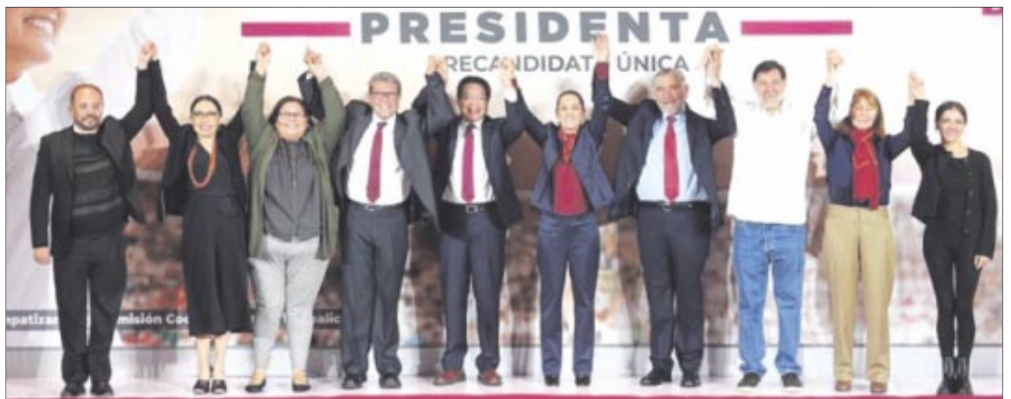
Ya son frecuentes los llamados a la unidad en Morena, por parte de la candidata presidencial Claudia Sheinbaum.