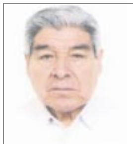
Por Eleazar Flores

SE LO ANTICIPÉ-. Colegas del gremio, originarios de Guerrero, fueron LA FUENTE primigenia del apocalipsis basurero que se veía venir, mucho más temprano que tarde, en la zona turística del puerto de Acapulco, de atención mediática inmediata, no así de pueblos distantes a diez minutos o menos, que ayer padecían del apoyo oficial, “hasta de unas botellas de agua”.