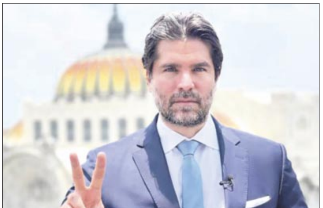
El actor Eduardo Verástegui es uno de los 6 aspirantes presidenciales independientes acreditados por el INE.