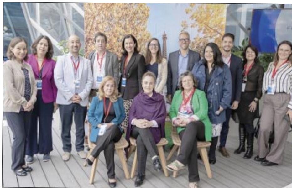
Los prestadores de servicios turísticos de Francia.

(más alto que la Torre Eiffel), en el corazón de la región de Occitania conecta a París con el Mediterráneo.