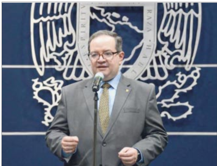
Leonardo Lomelí Vanegas, nuevo rector de la UNAM, afirmó que ve disposición al diálogo por parte del gobierno federal.

El incremento de los alimentos está impactando en los habitantes de Guerrero, debido a que algunos productos han llegado a duplicar su precio, como el jitomate, que tenía un precio de 19 pesos en octubre, y luego de Otis aumentó a 50 pesos el kilo.