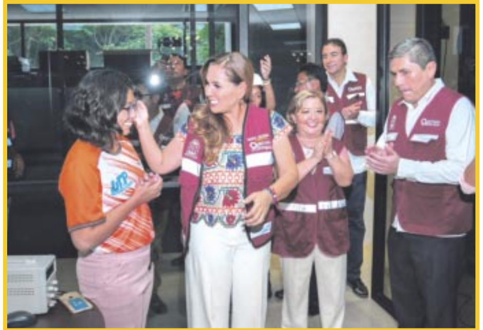
La gobernadora Mara Lezama Espinosa anunció un programa de becas para beneficio de 3 mil 400 mujeres estudiantes de educación superior.

A fin de trabajar juntos para poner a Quintana Roo a la vanguardia digital, la gobernadora Mara Lezama Espinosa se reunió con Carlos Slim Domit, Presidente del Consejo de Administración de Telmex, América Móvil y Grupo Carso, en Ciudad de México.