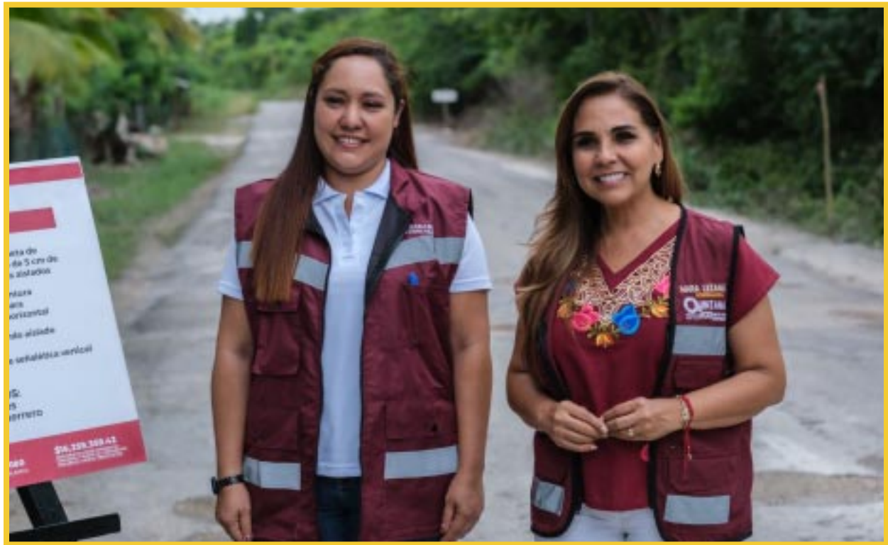
La gobernadora Mara Lezama Espinosa anunció la inversión de 16 millones 259 mil 350 pesos para la rehabilitación del camino de acceso a Laguna Guerrero, Ramal-Raudales, en una primera etapa.

la importancia de combatir la corrupción para maximizar los recursos disponibles y