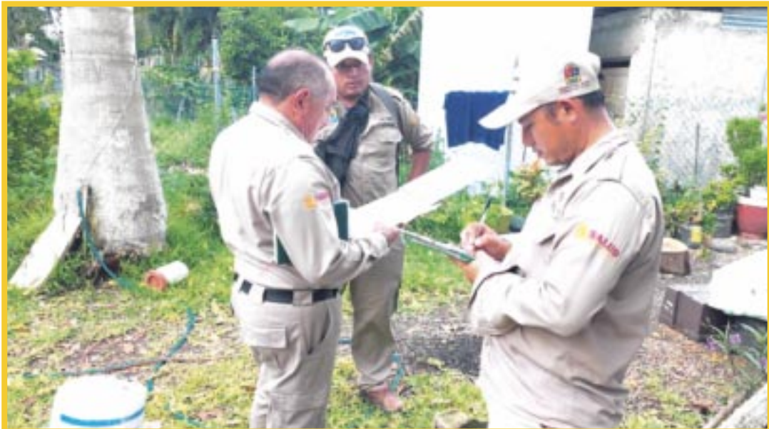
La OMS y la OPS reconocieron a Q. Roo por las acciones promovidas para erradicar el paludismo.