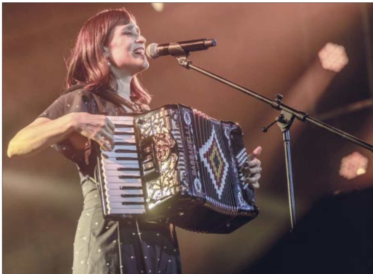
Julieta Venegas encantó a sus fans en el Teatro Metropolitán con un concierto lleno de pasión.