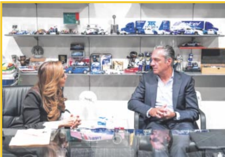
Mara Lezama se reunió con Carlos Slim Domit, Presidente del Consejo de Administración de Telmex, América Móvil y Grupo Carso, con el objetivo de trabajar juntos para poner a Quintana Roo a la vanguardia digital.

Mara Lezama dijo que este programa será de gran ayuda para mujeres que enfrentan dificultades económicas, sociales o culturales para realizar sus estudios superiores y participar en la vida productiva, especialmente aquellas quienes son jefas de familia y tienen responsabilidades laborales, que son barreras que limitan su pleno desarrollo.