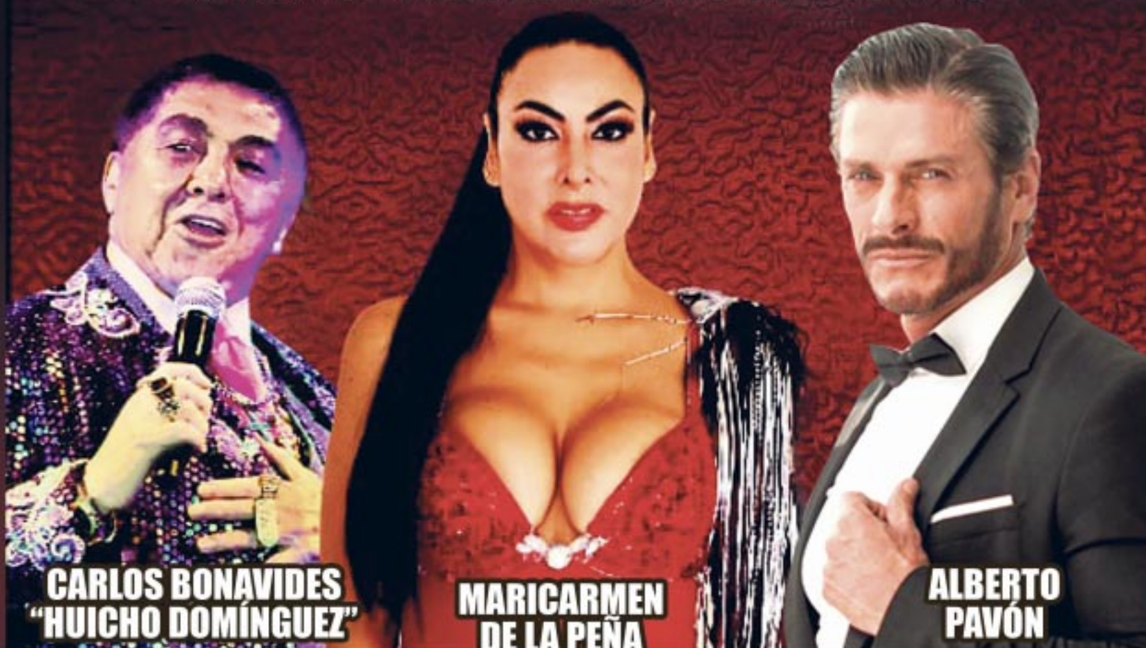
CARLOS BONAVIDES "HUICHO DOMÍNGUEZ"