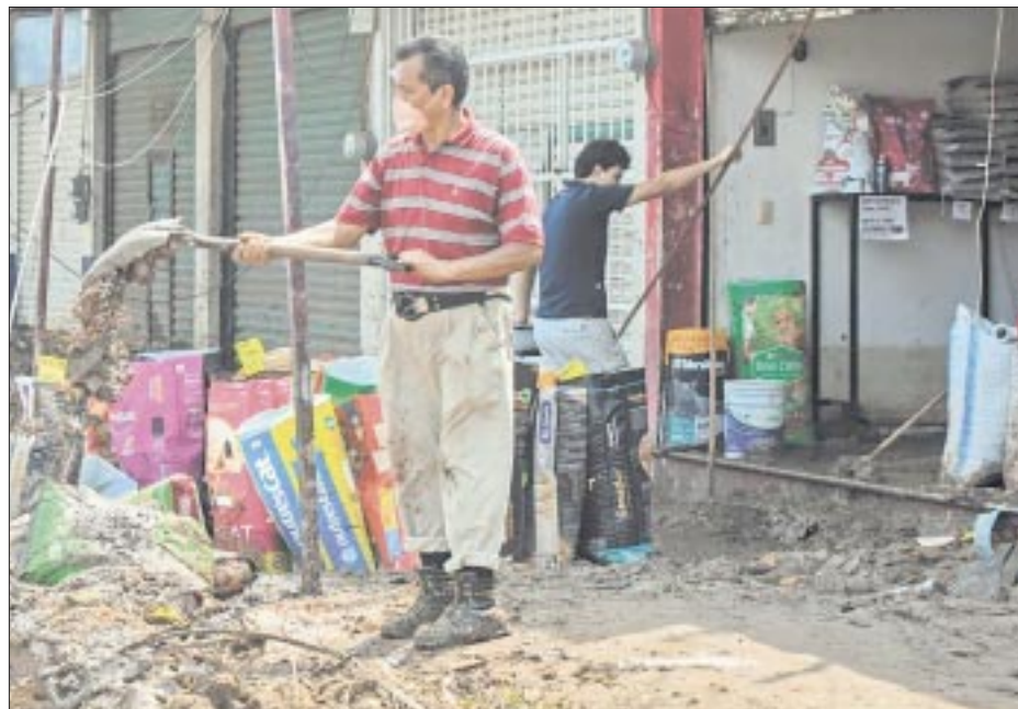
El 80% de los 16,000 pequeños negocios de la zona devastada por el huracán en Guerrero sufrió daños significativos luego del impacto del huracán Otis.

En este marco, aseveró que una administración “tiene que saber conservar aquello que forma parte de sustancial de la institución, pero también debe tener la sensibilidad de identificar los cambios y la forma de procesarlos sin estridencia, de manera prudente, pero sí con la firmeza de que la universidad esté al día ante el país y ante el mundo”.