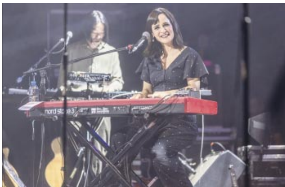
Fueron tres mil 100 personas las que abarrotaron el Teatro Metropolitán para disfrutar de la música de Julieta Venegas.

Luego de una salida en falso, Julieta Venegas regresó para ofrecer tres canciones más: “Oleada”, “Dame una oportunidad”, “Limón y sal” con las cuales cerró con broche de oro este espectáculo, que quedará en la memoria de los miles de fans que acudieron al recinto de la Ciudad de México.