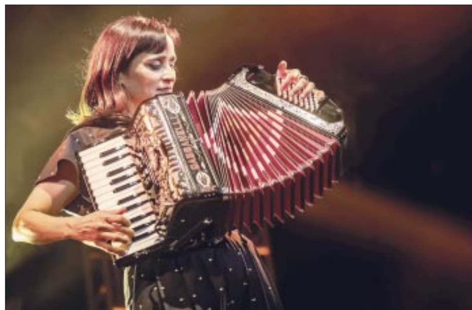
Julieta demostró su calidad como artista, pero también como ser humano, pues demostró cariño a sus fans en cada oportunidad.