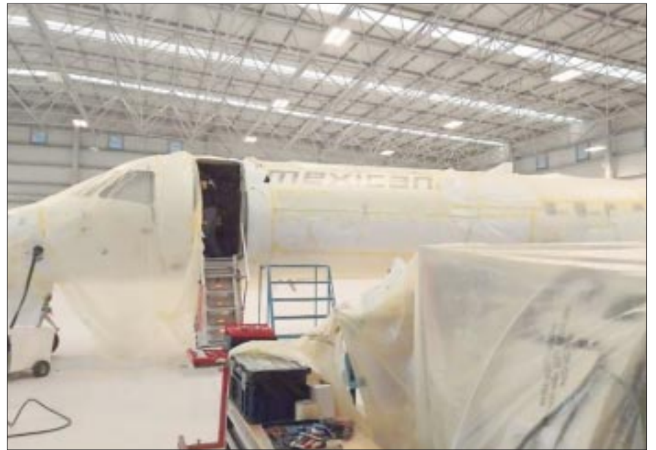
Los aviones que rentará Sedena para que Mexicana inicie operaciones en diciembre son repintados con el color blanco y el nombre de la aerolínea en su histórico color azul.

ha debido ajustarse a las condiciones de TAR. A los aviones arrendados a los militares ya les están pintando y colocando los logotipos característicos de Mexicana en el centro de mantenimiento que TAR tiene en Querétaro. Las aeronaves —marca Embraer 145— son más pequeñas que las anunciadas en el lanzamiento del proyecto, cuando inicialmente se preveía el uso de Boeings 737-800 con capacidad para 167 pasajeros, sin embargo, la aerolínea arrendadora sólo cuenta con aviones con capacidades de 50 a 70 personas. Los datos de la Agencia Federal de Aviación Civil (AFAC) al tercer trimestre de este año dan cuenta de que la aerolínea TAR sólo cuenta con cuatro aeronaves con una antigüedad