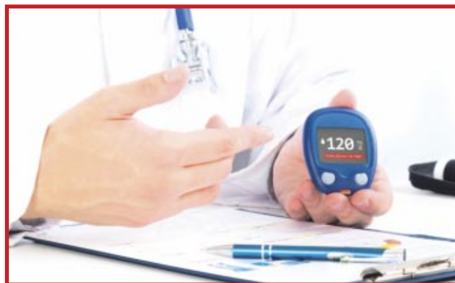
El Inegi señala que en Q. Roo, las enfermedades del corazón y la diabetes se ubicaron como las dos principales causas de muerte en 2022.

El Inegi reveló que también afectan enfermedades como tumores malignos y enfermedades del hígado, y en quinto lugar se rían las agresiones. Mientras que, las cinco principales causas de muerte a nivel nacional fueron: enfermedades del corazón, diabetes mellitus, tumores malignos, enfermedades del hígado y la enfermedad por el coronavirus. Quintana Roo representó la tasa más baja de defunciones, con 454 casos por cada 100 mil habitantes.