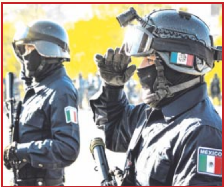
El 46% de los estados del país tiene mandos de seguridad provenientes de las fuerzas armadas. En el 2021 eran el 23%.

En los últimos dos años, se han duplicado los estados de la República con mandos de las secretarías de Seguridad Pública provenientes del Ejército y la Marina.