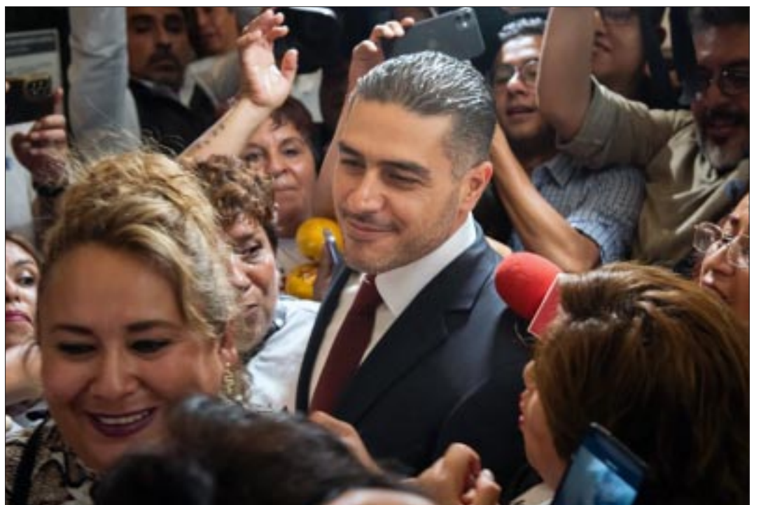
Omar García Harfuch continúa siendo el favorito para obtener la candidatura de Morena en CDMX.