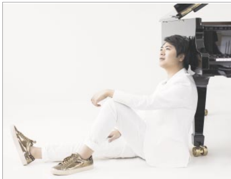
Estará acompañado por la Orquesta Sinfónica de Minería, bajo la dirección del maestro Carlos Miguel Prieto.

bles, desde su niñez hasta su vida adulta. El disco dado a conocer en 2022 actualmente cuenta con tres versiones: una con 14 canciones, otra con 28 y la más reciente, publicada este mes, tiene 33 temas que recorren la exitosa historia de la compañía cinematográfica a través de los temas de los filmes: Soul , Frozen , Tarzán , Pinocho , Blancanieves y los siete enanos , Coco , Encanto , La Bella y la Bestia , Aladdín , Mulan , El libro de la selva y Los Muppets .