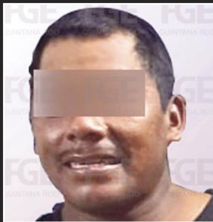
Un juez vinculó a proceso a Manuel “N” por su probable participación en el delito de feminicidio en grado de tentativa.

La FGE, en la misma diligencia, formuló imputación y tras los alegatos, un juez de control dictó vinculación a proceso a Manuel “N” por su probable participación en el delito de feminicidio en grado de tentativa, además impuso la medida cautelar de la prisión preventiva justificada.