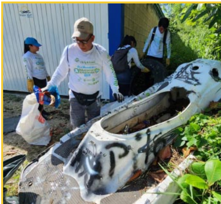
La jornada de limpieza número 44 se realizó en el manglar de Isla Mujeres, donde se levantaron 4.5 toneladas de desechos como llantas, enseres domésticos y basura en general.

tro compromiso con las y los quintanarroenses, mediante acciones que generarán nuevos empleos pensando las familias, trayendo bienestar social y mayor derrama económica, lo cual nos permitirá arribar a un mejor puerto”.