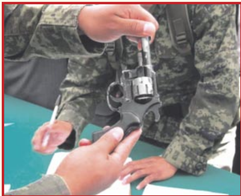
Inicia este lunes la campaña “Desarme Voluntario y Construcción de Paz” en los municipios de Othón P. Blanco y Bacalar.

Chetumal.- Par avanzar en la construcción de la paz y atender los orígenes de las violencias, se realiza la campaña “Desarme Voluntario y Construcción de Paz” en los municipios de Othón P. Blanco y Bacalar en coordinación del Secretariado Ejecutivo del Sistema Estatal de Seguridad Pública (SESESP) y la Secretaría de la Defensa Nacional (Sedena).