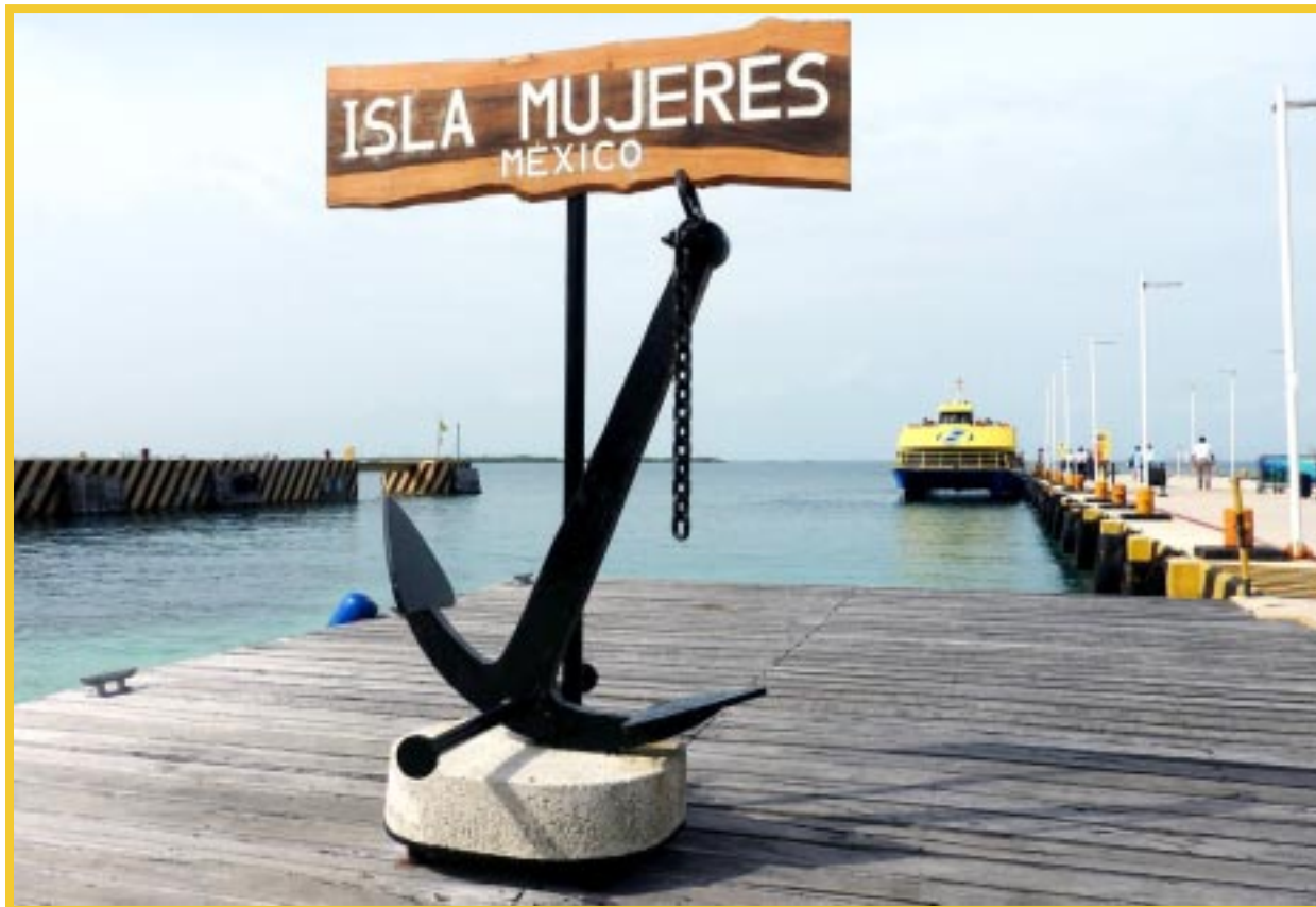
La Apiqroo operará directamente las terminales públicas de pasajeros y transbordadores en Cozumel, Isla Mujeres, Punta Sam, Puerto Juárez y Chetumal.

Añadió: “Esto nos dará la facultad de administrar,