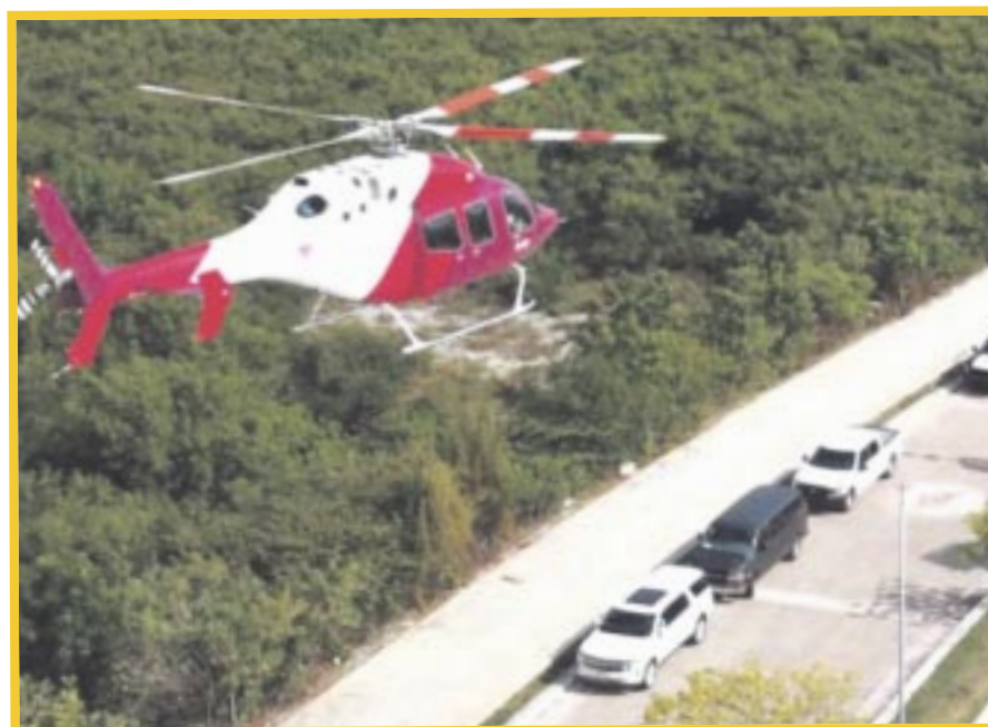
La Secretaría de Seguridad Ciudadana (SSC) confirmó que el traslado de funcionarios a bordo de los helicópteros ya no es posible.