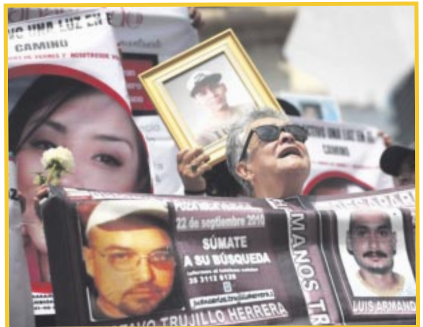
El año pasado, las autoridades recibieron 33 mil 478 reportes de personas desaparecidas y no localizadas, un alza de 171% respecto a 2021.

Alguien desaparecido se refiere a la persona “cuyo paradero se desconoce y se presume, a partir de cualquier indicio, que su ausencia se relaciona con la comisión de algún delito”.