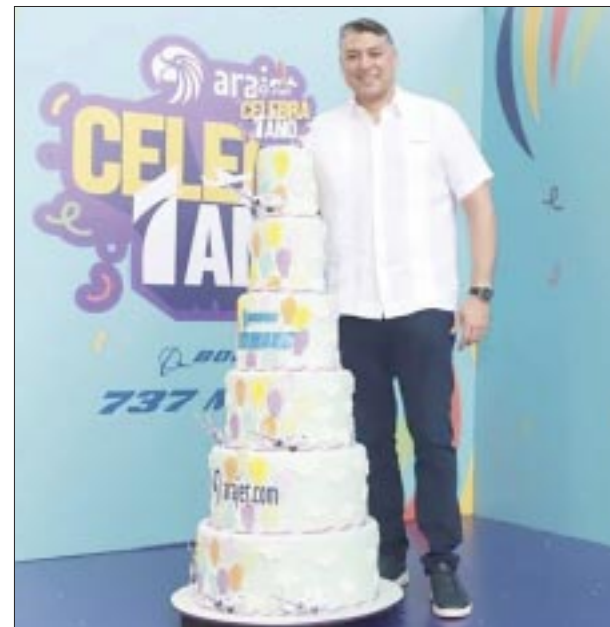
En el primer aniversario de la aerolínea.

El acuerdo interlineal permite tener más opciones a los viajeros de Emirates cuando se di-