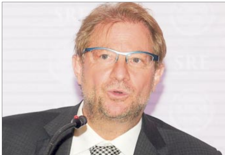
Fue detenido en Israel el escritor y ex diplomático mexicano Andrés Roemer, quien enfrenta varias acusaciones por los delitos de abuso sexual y violación.

En febrero de 2021, más de una decena de mujeres rompieron su silencio al acusar al escritor de abusos sexuales y comportamientos