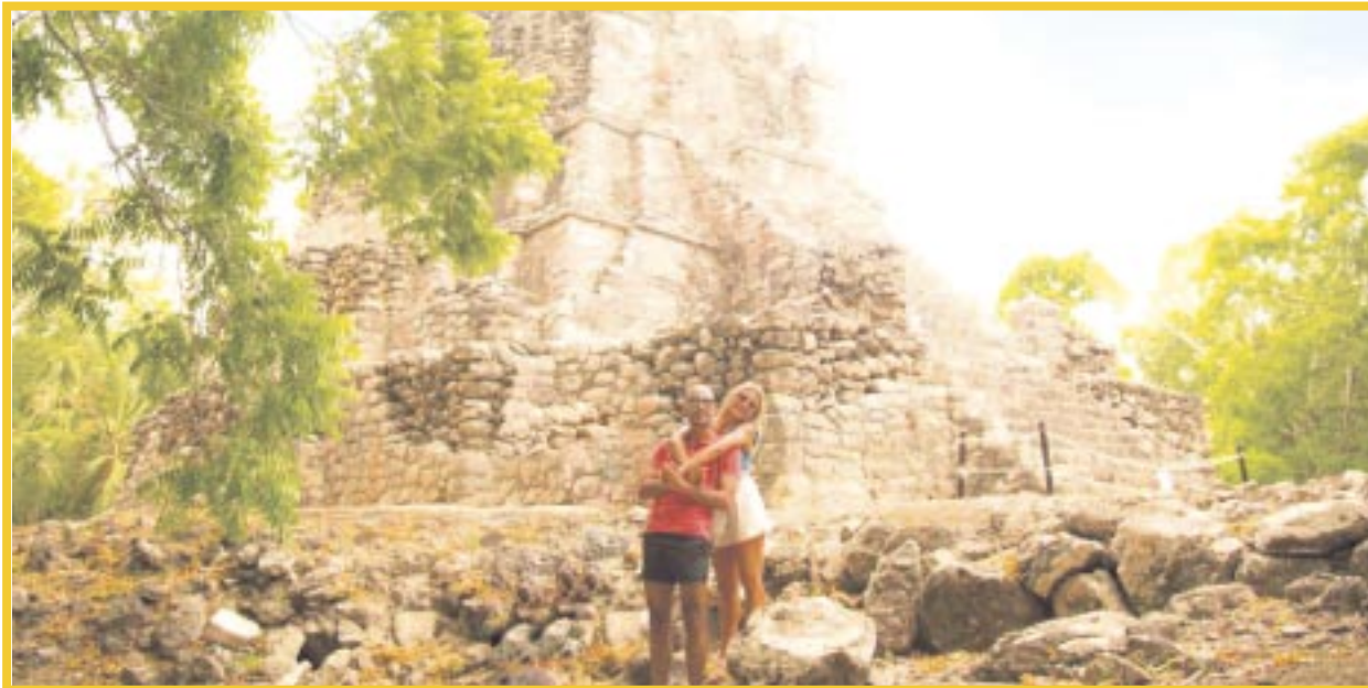
Maya Ka'an será promovido en el marco del IFTM Top Resa, Feria B2B del turismo en Francia.

Nueve comunidades del destino quintanarroense Maya Ka'an estarán presentes en el evento, con la intención de captar la atención de los turistas europeos que buscan experiencias únicas en contacto con la naturaleza y la riqueza histórica de la zona.