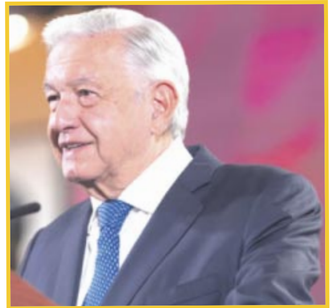
El presidente Andrés Manuel López Obrador calificó de “chuecos” y “falsarios” a los políticos de Estados Unidos que buscan culpar a México de la crisis por el fentanilo.

“Pero a ver, una sanción, no le vamos a autorizar 50 millones de dólares (...), si no les hemos pedido nada, nada, antes daban esos 50 millones, porque tampoco daban mucho”, agregó el tabasqueño.