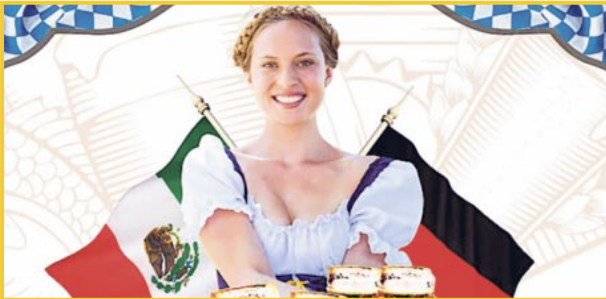
El Oktoberfest Cancún 2023 tendrá lugar en las instalaciones de Selina Cancún Laguna Hotel Zone en la Zona Hotelera.

El evento regresa con mucha energía a Cancún, por lo que se invita a las personas a esta festividad que se hace año tras año en Alemania, en la que podrán disfrutar de comida, bebidas, tradiciones del país europeo, música, área de juegos y bazar, entre otras actividades.