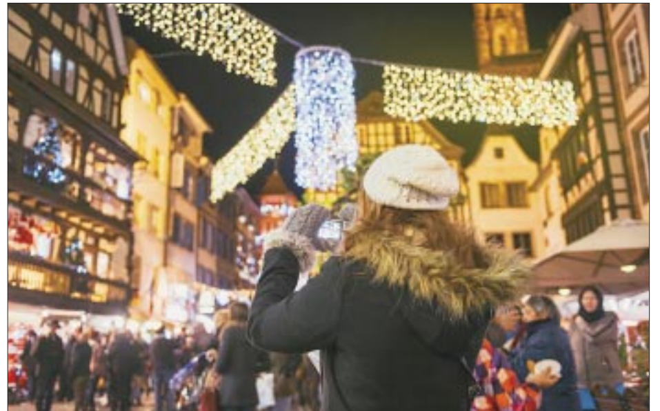
Los mejores precios para viajar en Fin de Año.

El organismo empresarial, que integra a más de 100 hoteles, 44 mil 500 cuartos en el Sureste de México y 73 mil en todo el país, señaló que en estricto apego a sus estatutos, la directora comercial de la compañía de Mer-