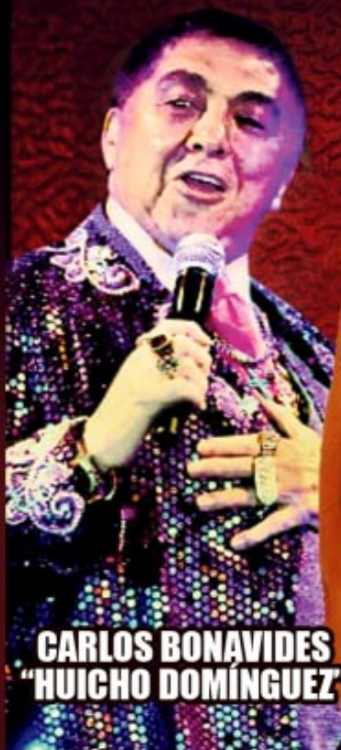
CARLOS BONAVIDES "HUICHO DOMÍNGUEZ"