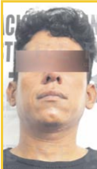
Un juez vinculó a proceso a Francisco “N” por el el delito de extorsión agravada.

Por estos delitos, Francisco “N” podría alcanzar una penalidad de hasta 37 años y seis meses de prisión.