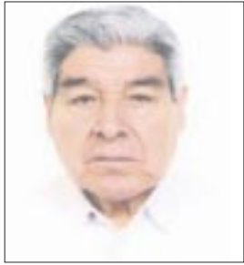
Por Eleazar Flores

A CONVENIENCIA DE AMLO-. No es la primera vez y seguramente no será la última en los once meses veinte días que le faltan al presidente Andrés Manuel López Obrador, como tal, para interpretar a su modo la reconocida y observada internacionalmente DOCTRINA ESTRADA.