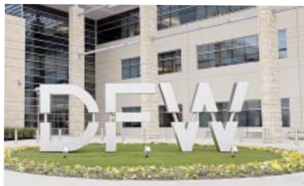
En enero de 2024 inician las celebraciones del 50 aniversario.