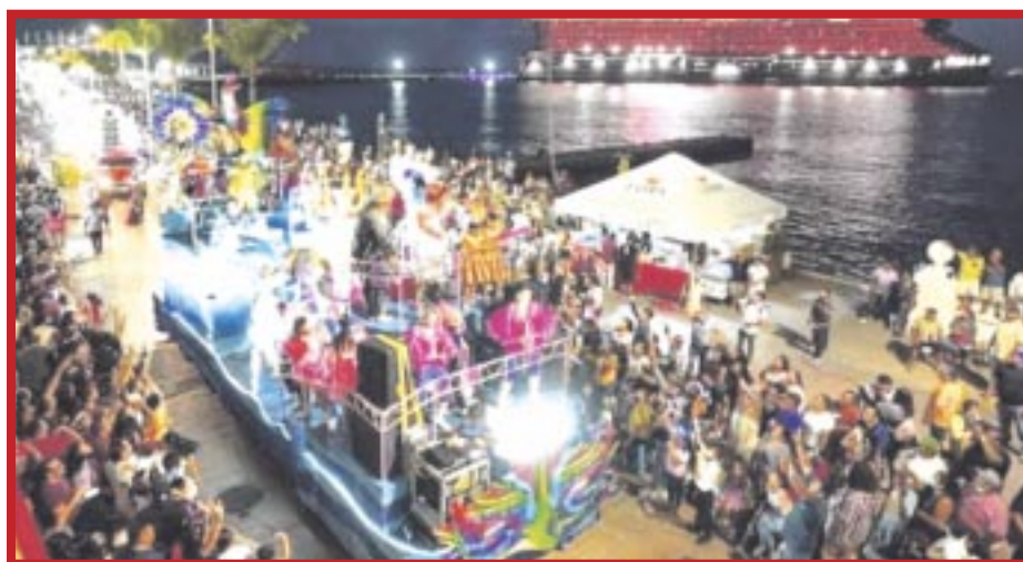
El Carnaval de Cozumel 2024 se llevará a cabo del 7 al 14 de febrero.