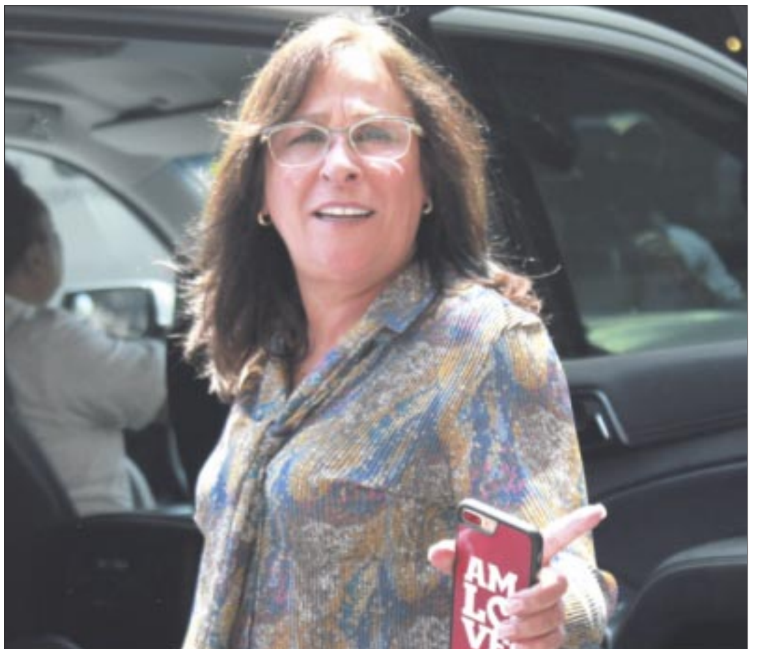
Rocío Nahle , zacatecana, no es bien vista por los veracruzanos para que los gobierne.

ramonzurita44@gmail.com ramonzurita44@hotmail.com