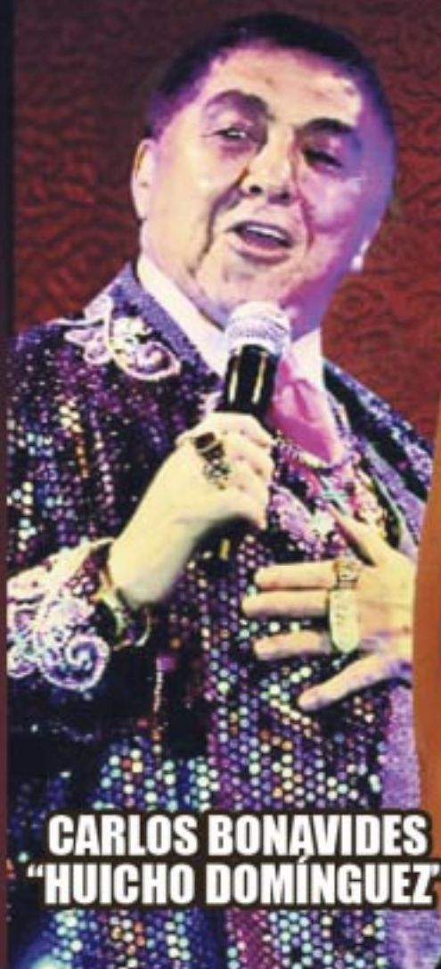
CARLOS BONAVIDES "HUICHO DOMÍNGUEZ"