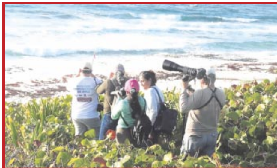
Se celebrará la 15 edición del Festival de las Aves Isla Cozumel, destino que se destaca como uno privilegiado para el aviturismo.

Cabe mencionar que el comité organizador del evento está integrado por la Conanp; la Fundación de Parques y Museos de Cozumel; el Planetario de Cozumel; la subdirección de Ecología; el Consejo de Promoción Turística de Quintana Roo; el Cozumel Birding Club; y la Universidad de Quintana Roo.