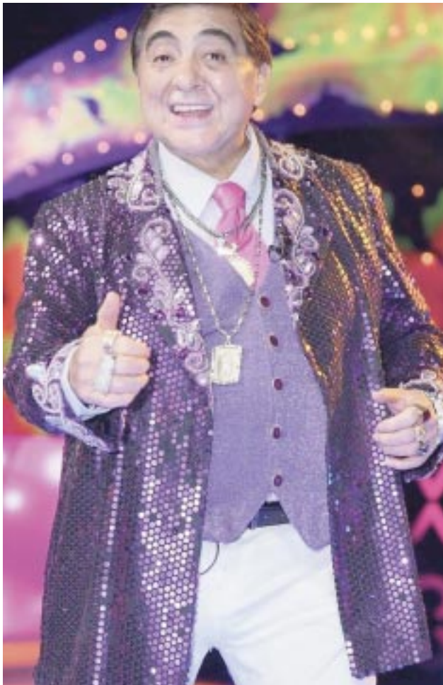
Carlos Bonavides, en su personaje de "Huicho Domínguez"