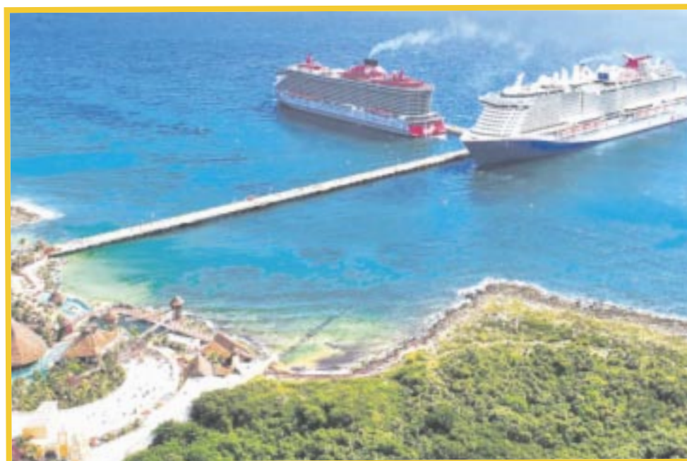
Por primera vez llegarán a Cozumel los cruceros de bandera Noruega, Viking Polaris y Viking Mars.