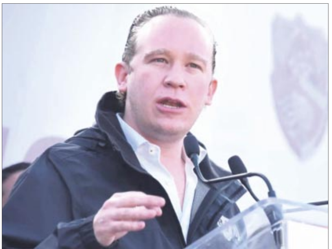
Santiago Taboada , alcalde de Benito Juárez, figura prospecto para la candidatura del FAM para la CDMX.

ramonzurita44@gmail.com ramonzurita44@hotmail.com