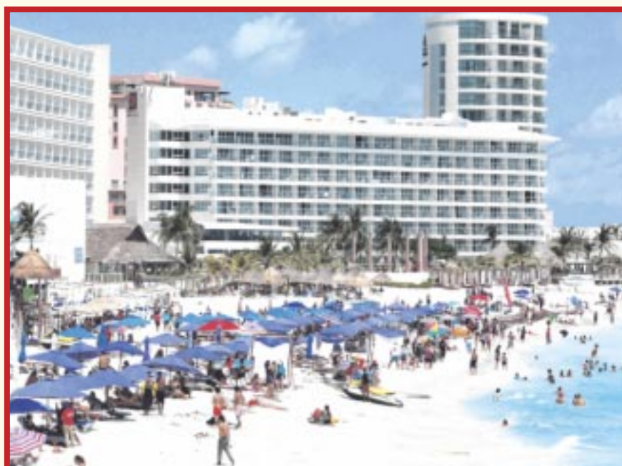
La Sedetur destacó cifras récord y logros significativos en materia de turismo en Q. Roo durante el 2022.

Aún después del estrepitoso golpe que representó el paso de la contingencia sanitaria por Covid-19 para el turismo en Quintana Roo, una vez que se controló la enfermedad a nivel mundial, el Caribe mexicano fue uno de los primeros lugares en recuperar a sus visitantes, y es que gracias a acciones de autoridades estatales y federales, la confianza en este sector sigue siendo depositada no sólo por los mexicanos, sino por muchos extranjeros que llegan a vacacionar.