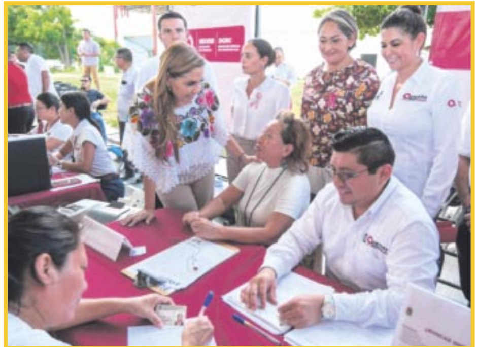
La gobernadora Mara Lezama Espinosa puso en marcha las Caravanas de Justicia para el Bienestar, con el apoyo de 13 barras de abogados y 15 instituciones de educación superior.