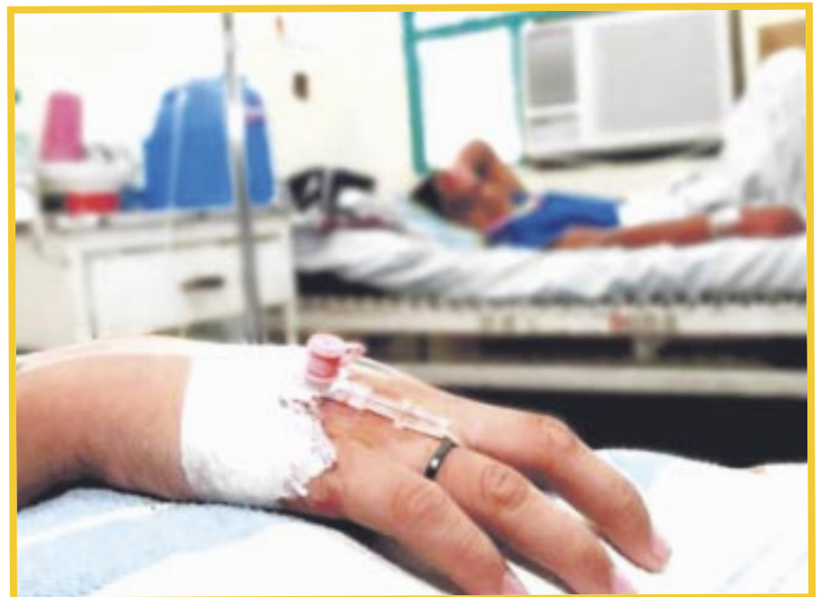
Para la semana 39 del año en curso se registraron 175 nuevos casos de dengue en Quintana Roo.

Quintana Roo no ha podido abandonar los primeros puestos de contagios a nivel nacional, pues ocupa el tercer lugar, después de Yucatán y Veracruz, en casos de dengue. Y es la segunda posición nacional en incidencia después de Yucatán.