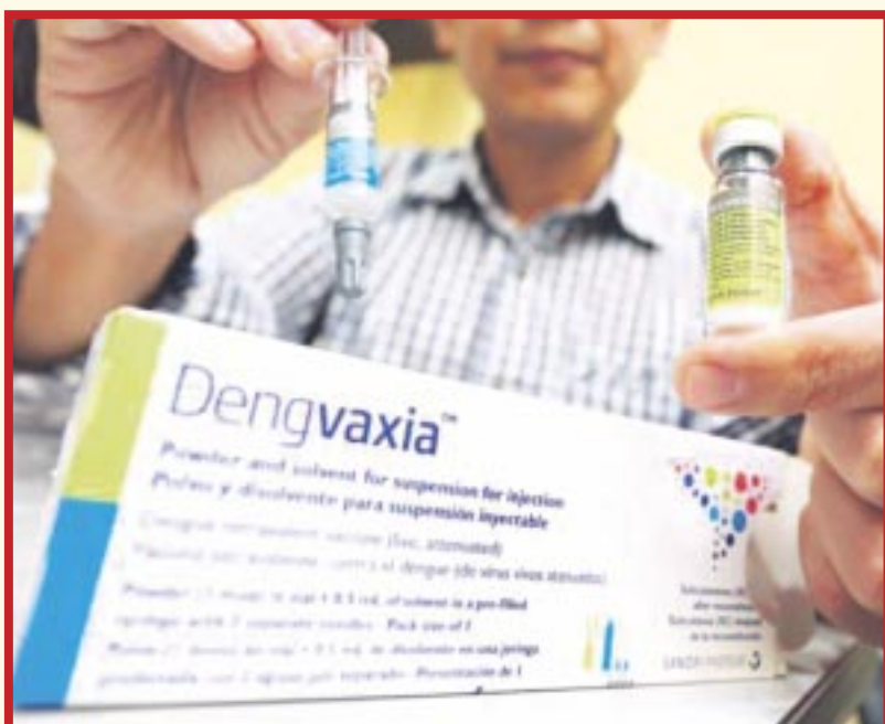
En 2015 apareció la primera vacuna contra el dengue, Dengvaxia del laboratorio Sanofi.

La Organización Mundial de la Salud (OMS) recomendó, por primera vez, a los países con elevada carga de dengue y alta intensidad de transmisión, la aplicación de la vacuna desarrollada por el laboratorio farmacéutico Takeda.