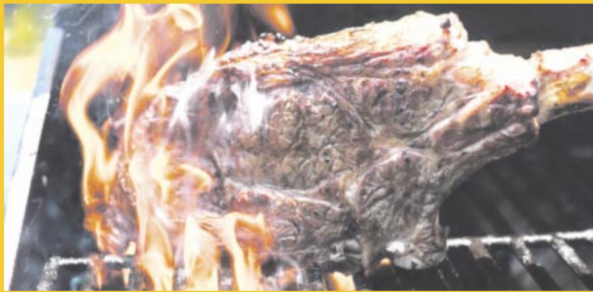
El Segundo Festival Parrillero de Quintana Roo está previsto para el 18 de noviembre en Isla Mujeres.

El primer evento de estas características tuvo lugar en Puerto Morelos, donde nació la idea de que fuera un festival itinerante que se estaría realizando anualmente, para llegar a todos los municipios de Quintana Roo, como parte del trabajo que impulsa la gastronomía local.