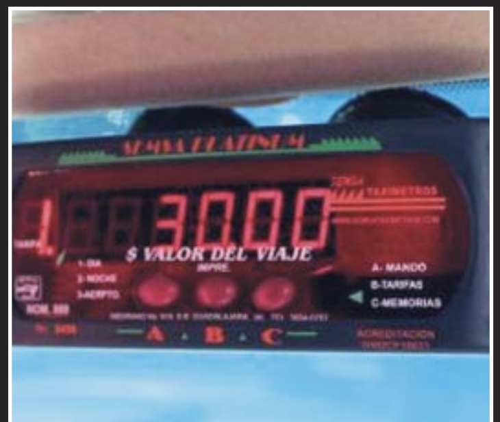
La implementación del taxímetro en el estado deberá estar cumplida antes de abril de 2024 en todas las unidades.

vechan el desconocimiento por parte de los visitantes de los tabuladores vigentes, así que cobran a discreción. Sucede aquí en Chetumal, en Bacalar, Mahahual y el norte del estado”.