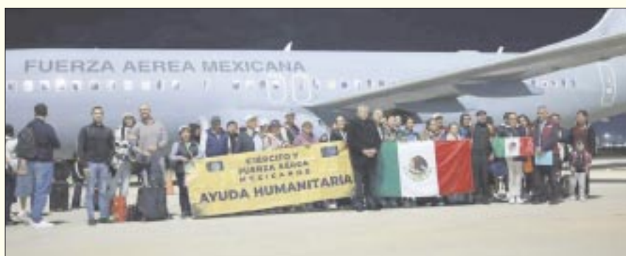
La misión de rescate de mexicanos atrapados en la zona de conflicto en Israel terminó esta madrugada con la llegada de dos aviones militares con 275 connacionales.

En la sesión virtual, los expertos señalaron que no hay evidencia científica que respalde su inmunogenicidad contra las nuevas variantes del virus Sars-Cov2 y que la farmacéutica carece de protocolos de farmacovigilancia en México.