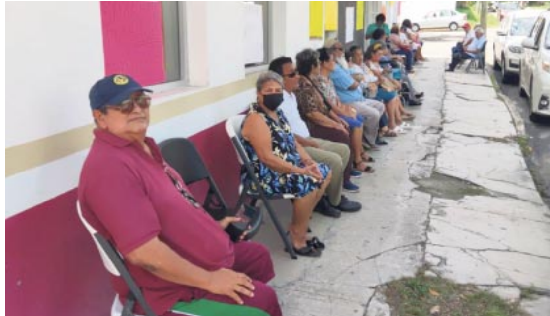
Miembros del ejido de Chetumal iniciaron una manifestación frente a Fonatur, ante el retraso en la liquidación final de 20 hectáreas expropiadas para el Tren Maya.