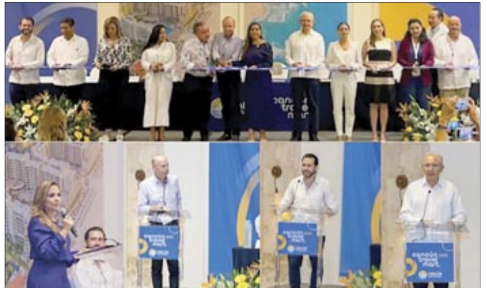
Antes del corte de listón los anfitriones se refirieron al importante evento.