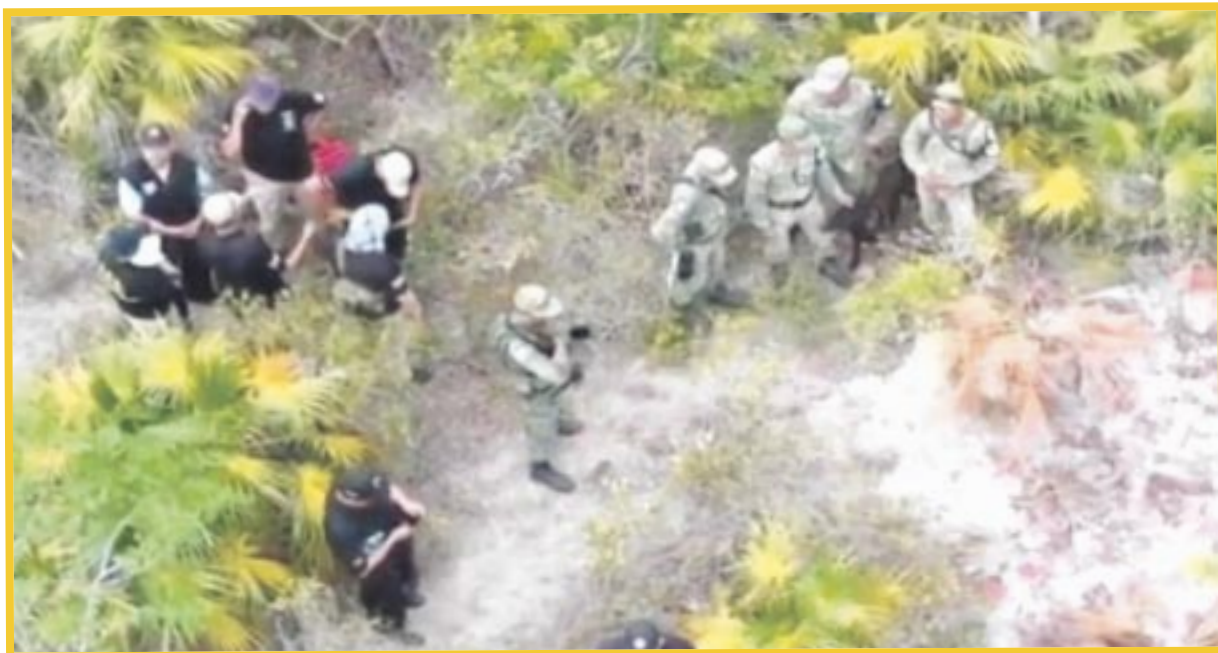
Comisión de Búsqueda de Personas en Quintana Roo, informó que requieren un aumento del 20 por ciento en sus recursos.

Destacaron que, durante los operativos de la búsqueda de personas en estas áreas se apoyan con la Marina, el Ejército Mexicano o la Secretaría de Seguridad Ciudadana, no obstante, sí requieren equipo personal como drones especiales y algunas unidades que sean todo terreno con el fin de depender de otros para seguir con las indagaciones.