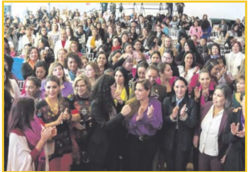
La gobernadora Mara Lezama Espinosa participó en la conmemoración de 70 años del voto de las mujeres en México “Del sufragio a la paridad”, organizado por Inmujeres.

La mandataria estatal Mara Lezama Espinosa refirió que en Quintana Roo el 64% de las diputaciones locales y las presidencias municipales son