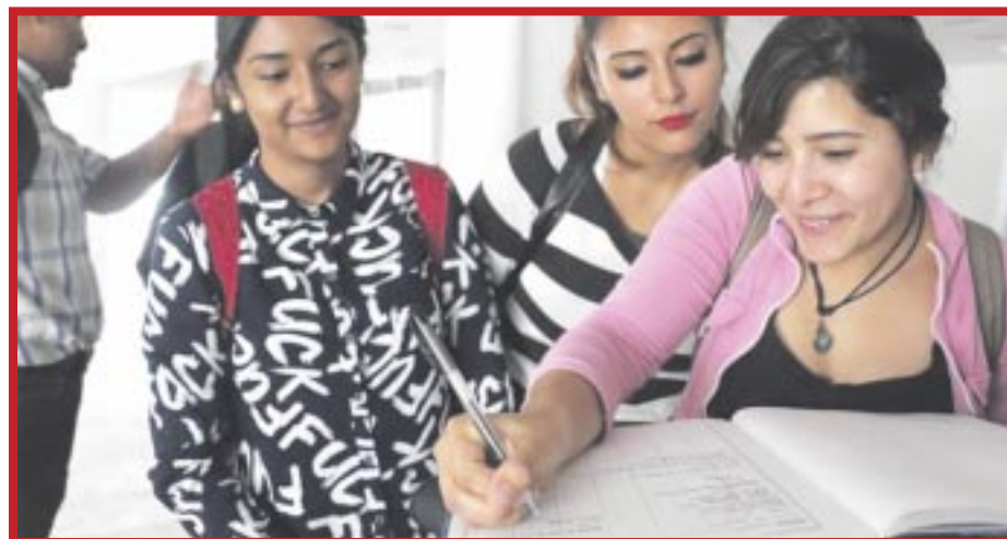
La consultora RH Group México dio a conocer que los quintanarroenses son los que más seguido cambian de empleo a nivel nacional.

Los jóvenes en cambio siempre persiguen un espacio donde puedan encontrar mayor tiempo libre y no una mejor compensación laboral o mejores prestaciones, y es que con jornadas laborales de 45 horas promedio en el sector turístico, la juventud en el Caribe prefiere incluso cambiar de actividad económica por una que demande menos tiempo.