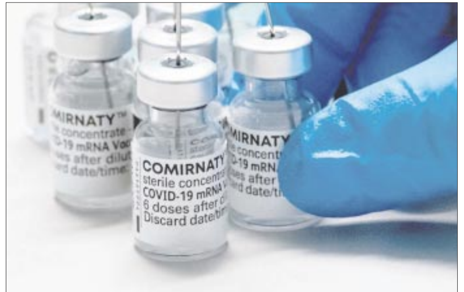
La vacuna Comirnaty de Pfizer, actualizada para enfrentar la variante ómicron XBB.1.5, recibió aprobación inicial del Comité de Moléculas Nuevas en México, de la Cofepris.

Los expertos aseguraron que el biológico presentado bajo el nombre de Vaxzevria no logró comprobar su efectividad, como reportan sus estudios clínicos de efectividad contra las nuevas variantes de Ómicron y, por lo tanto, se detiene el proceso de transición de la Autorización de