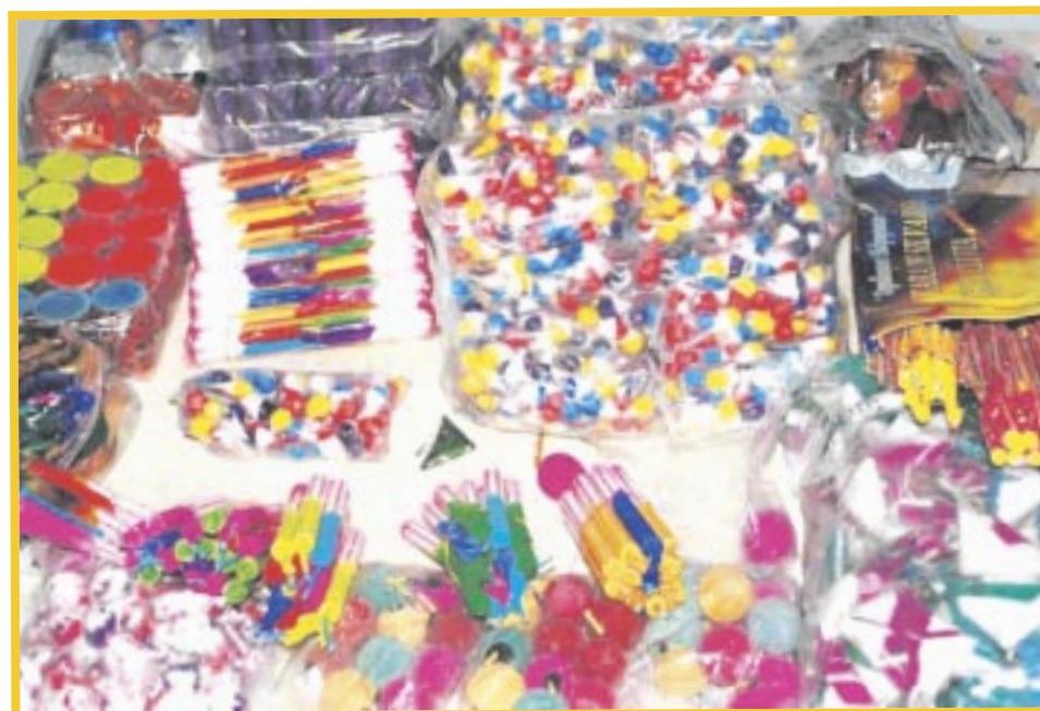
Protección Civil realizará operativos en los almacenes de vendedores de pirotecnia a partir de noviembre.

Sobre los vendedores irregulares, el secretario comentó que la dependencia a su cargo realizará los llamados correspondientes a la ciudadanía, para denunciar a quienes operen fuera de la ley y puedan aplicar las sanciones correspondientes.