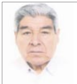
Por Eleazar Flores

AMLO CALLA EL TEMA-. Ahora que la dócil Cámara de Diputados -de mayoría morenista- ha obedecido instrucciones de su comandante guinda para aprobar la desaparición de partidas y fideicomisos del Poder Judicial Federal, procede voltear hacia el immaculado, pero sobre todo, intocable poder militar en este sexenio, escudriñando sus sueldos y prestaciones.