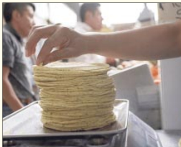
El Consejo Nacional de la Tortilla hizo un llamado al gobierno federal para que la tortilla sea considerada nuevamente en la canasta básica.

de ser esencial para la dieta de los mexicanos; en su elab-