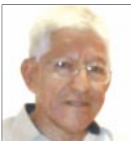
Por Ángel Soriano

Finalmente, el pleno de la Cámara de Diputados aprobó con 259 votos a favor, 205 en contra y una abstención el dictamen que modifica la Ley Orgánica del Poder Judicial de la Federación para impedir la creación de fideicomisos adicionales que no cumplan con la función principal de impartir justicia, pero que de manera perversa se difundió lo contrario.