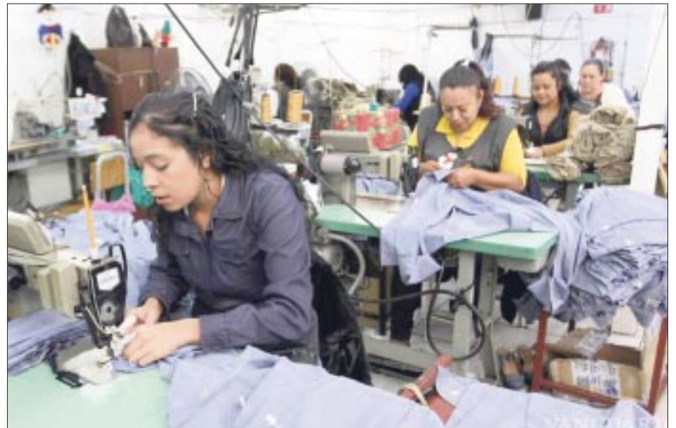
Empresarios se manifestaron en contra de reducir a 40 horas semanales la jornada laboral en México por los impactos económicos que conllevaría.

Roel hizo un llamado a fomentar el diálogo antes de