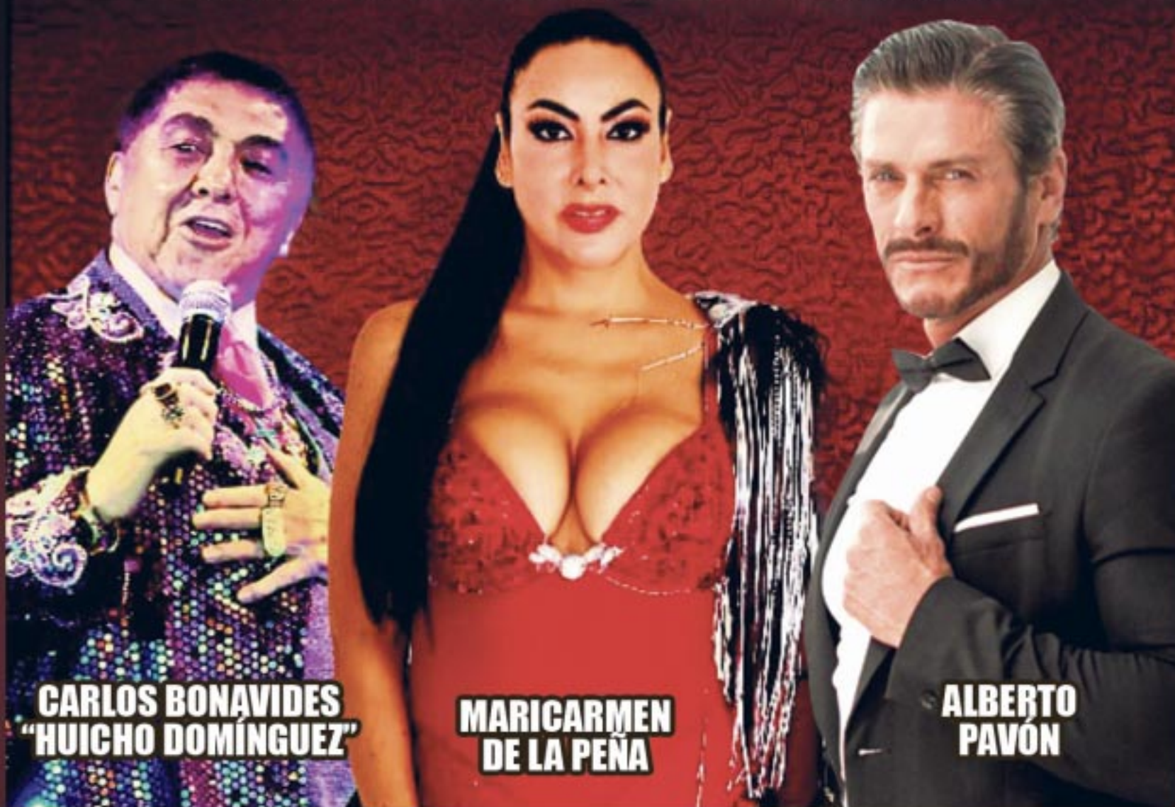
CARLOS BONAVIDES "HUICHO DOMÍNGUEZ"