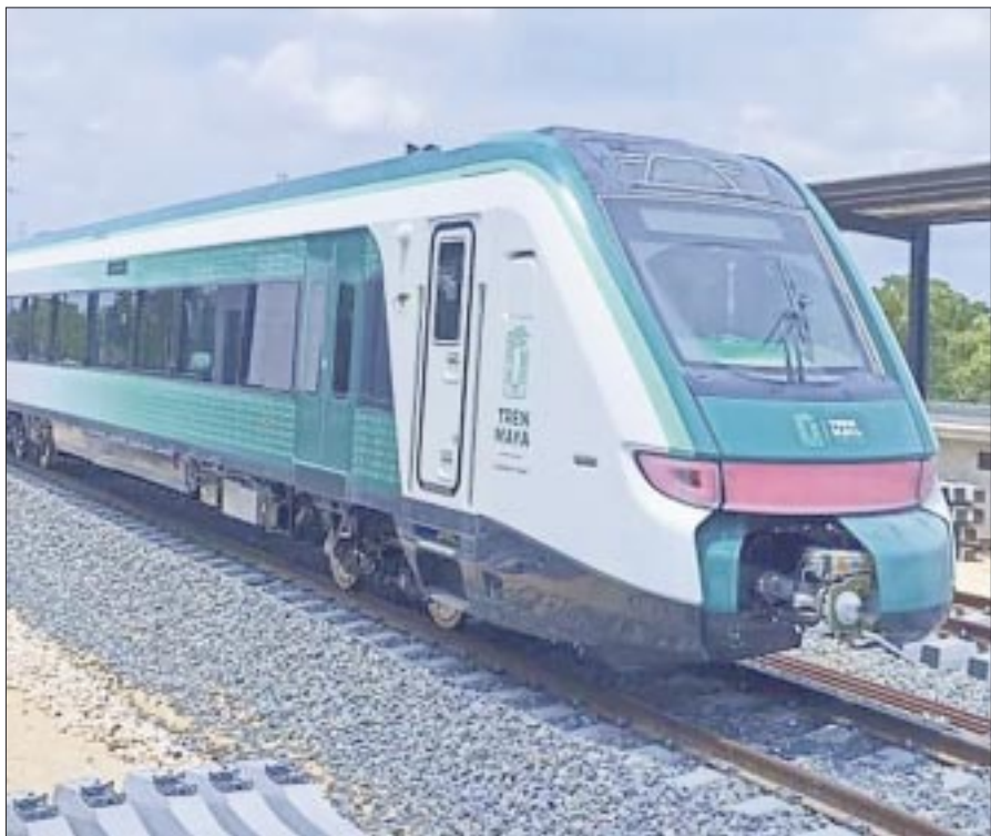
El proyecto del Tren Maya elevó la plusvalía de los inmuebles y las construcciones en el sureste del país casi 400 por ciento, en los últimos 3 años.

“Es un exhorto, hago un llamamiento a todos los abogados de México para que analicen si es constitucional, si no se va a romper el orden constitucional con lo que van a hacer, porque un poder independiente, igual que el Poder Judicial, otro poder independiente, el Poder Legislativo, que tiene la función de aprobar la ley de ingresos, que tiene como función legislar y de manera específica tiene como función aprobar el presupuesto, resulta que va a ser nulificado, porque van, seguramente, a presentar los legisladores de la oposición, un recurso para declarar inconstitucional la aprobación de la cancelación de los fideicomisos”, señaló.