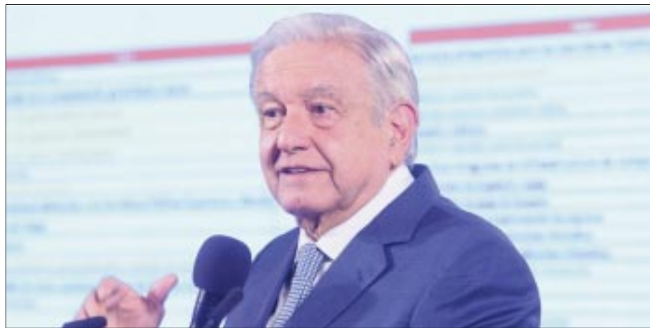
El presidente Andrés Manuel López Obrador llamó a la población a vacunarse sin miedo a los biológicos que se están usando en campaña contra influenza y Covid.

“Todo eso nos dice que el mercado inmobiliario se encuentra más fuerte que nunca y seguramente continuará siendo así durante el siguiente año, independientemente del estado de la economía”, enfatizó el estudio de Flat.mx.