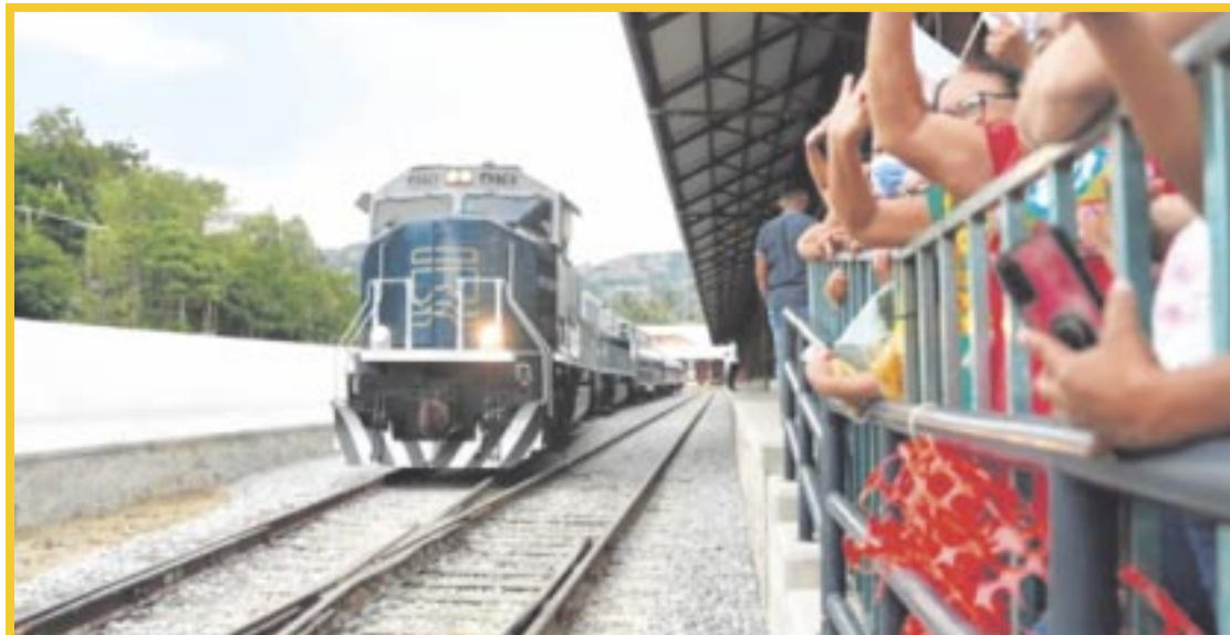
La inauguración del Tren Interoceánico del Istmo de Tehuantepec será el próximo 22 de diciembre.

“En toda esta franja del Istmo hay diez parques industriales, polos de de-