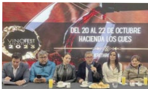
Durante la presentación del VinoFest International 2023 .