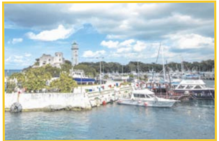
Cozumel, ha logrado sobresalir y posicionarse entre los 100 mejores destinos del mundo para el año 2023.