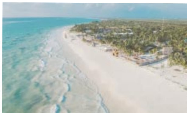
Nominan a las playas de Tulum como las mejores del mundo.

victoriagprado@gmail.com Twitter: @victoriagprado