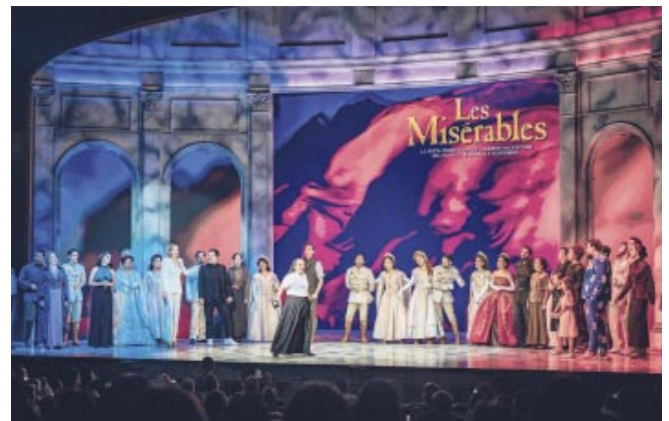
Una de las más aclamadas a su pasó por el Teatro Telcel es Los Miserables, que también tuvo su momento en esta noche de recuerdos.