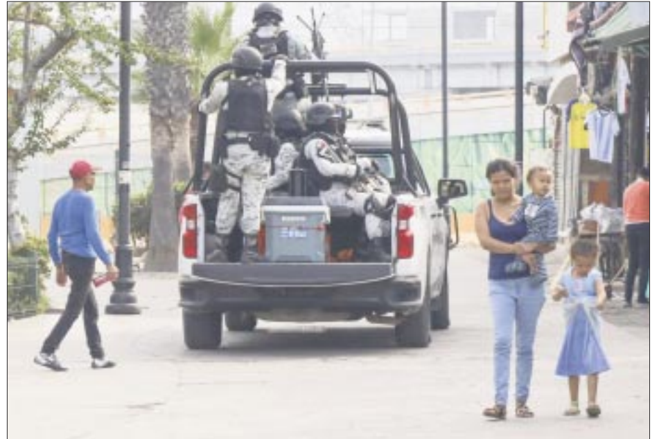
La percepción de la ciudadanía sobre la inseguridad en su lugar de residencia va en aumento, de acuerdo a una encuesta del Inegi.

“Lo anterior no representa un cambio estadísticamente significativo con relación al porcentaje registrado en junio de 2023, que fue de 62.3%. No obstante, representa un cambio estadísticamente significativo menor con respecto a septiembre de 2022, que fue 64.4%. En esta edición, 11 ciudades y demarcaciones tuvieron cambios estadística-