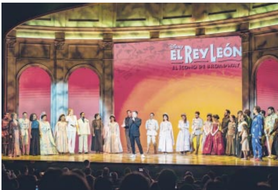
Otra de las obras que fueron recordadas fue el siempre exitoso Rey León.

En tanto Kate del Castillo se dijo honrada de ser la madrina de “estos 10 años de darnos tanto entretenimiento, de darnos tantas alegrías, llorar, lo que es el teatro, lo que es vivir el teatro”.