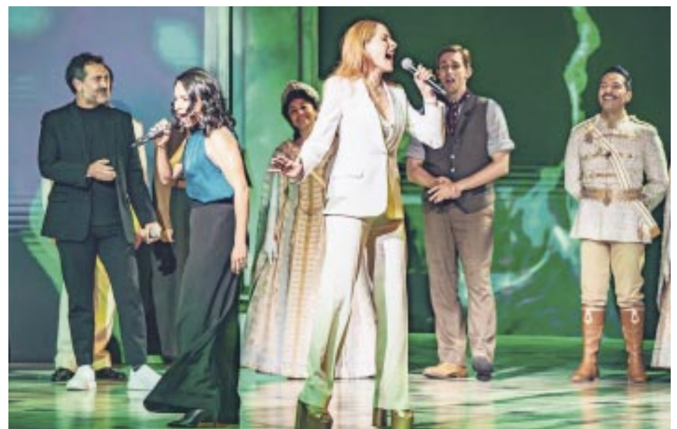
Ceci de la Cueva, hermosa y talentosa como siempre, demostró porque es una de las figuras más importantes del Teatro Musical.