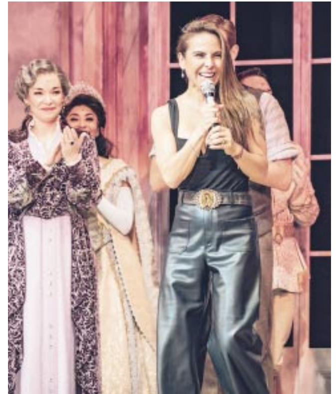
Kate del Castillo se dijo honrada de ser la madrina de estos 10 años del teatro Telcel.