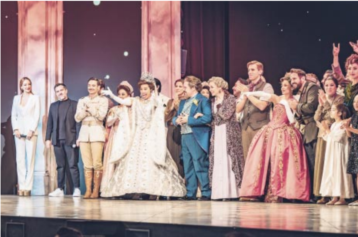
Actores de diferentes musicales subieron al escenario para felicitar al elenco de Anastasia.