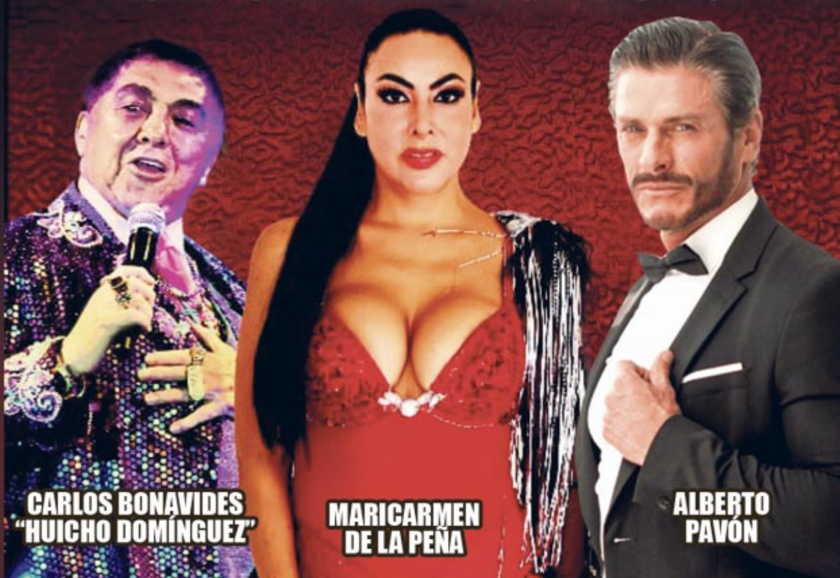
CARLOS BONAVIDES "HUICHO DOMÍNGUEZ"