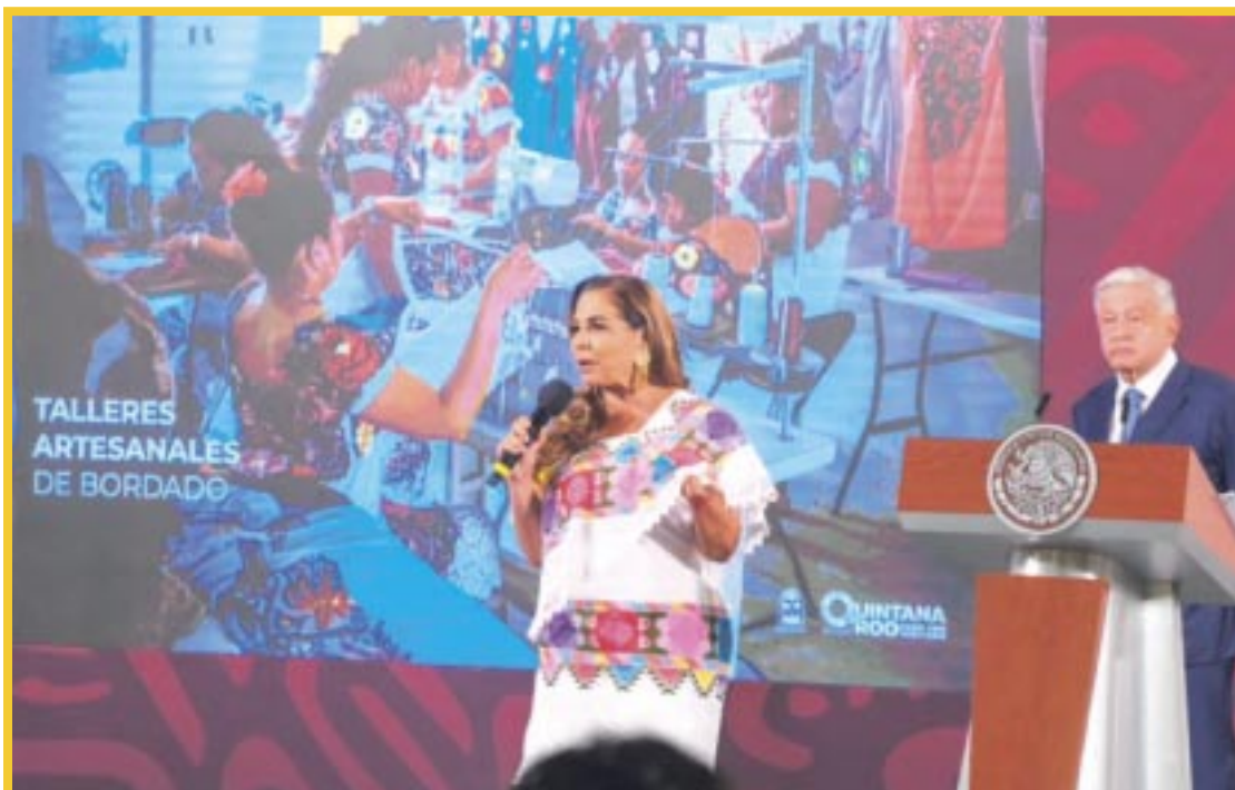
Mara Lezama destacó que el Tren Maya es un proyecto de gran impacto económico y social para cambiarle la vida a las personas, aún antes de su inauguración.

Finalmente, Mara Lezama aseguró que el Tren Maya y los proyectos que se generan en torno a él están cambiando la vida a la gente y devolviéndole al pueblo sus legítimos derechos de bienestar, con una repartición más justa y equitativa del éxito turístico.