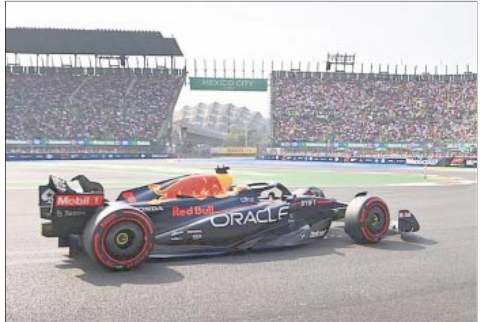
El Autódromo Hermanos Rodríguez recibirá el Gran Premio de México de la Fórmula 1 este fin de semana.

mio de México Fórmula 1 en la Ciudad de México ha sido galardonado en diferentes ocasiones como el mejor del año por parte de la Federación Internacional del Automóvil (FIA), por encima del resto de las sedes del campeonato, y se transmite a más de 200 países, recibiendo aproximadamente 2 mil 400 horas de cobertura a nivel mundial.