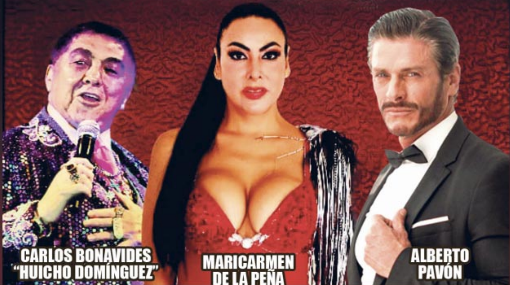
CARLOS BONAVIDES "HUICHO DOMÍNGUEZ"