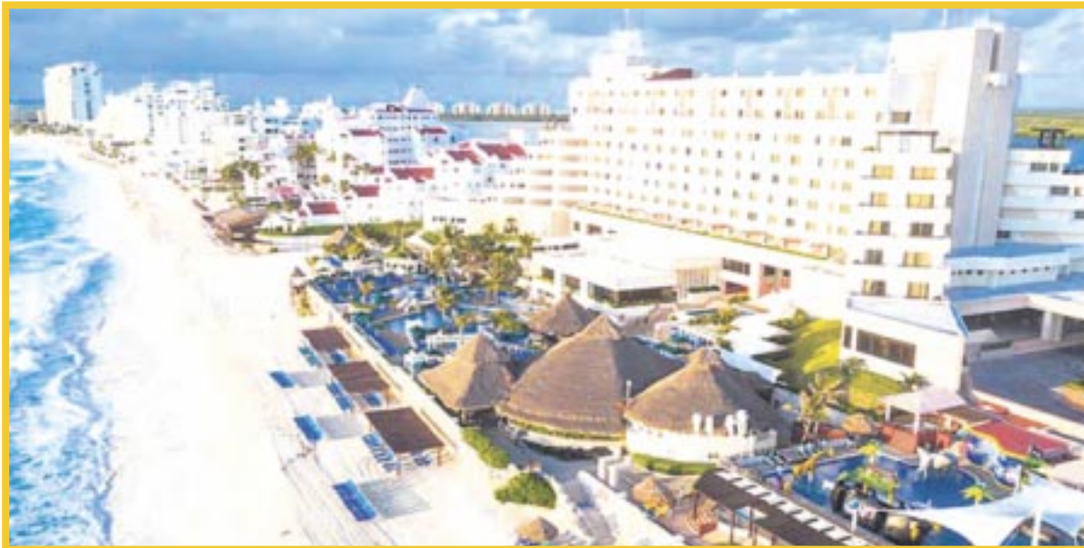
Las tarifas hoteleras en la entidad mostraron un incremento de hasta 9 por ciento durante el verano.

El sector continuará participando en las próximas ferias turísticas con el objetivo de implementar las estrategias de venta para las demás temporadas, con miras a aumentar más las tarifas hoteleras, sobre todo de cara a la temporada de invierno que se espera arranque en noviembre próximo.