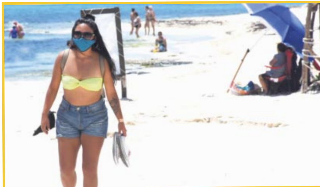
La Red de Monitoreo del Sargazo de Quintana Roo informó que las playas tienen presencia muy baja de la macroalga.

Asimismo, Isla Mujeres se destacó por no tener presencia del alga y solo la Bahía Petempich, Punta Caracol, Puerto Morelos Norte y Centro, reportaron presencia moderada de sargazo. El resto de las playas se encuentran libres del alga. En este sentido, la Red de Monitoreo del Sargazo informó que la temperatura máxima en el agua es de 30 grados centígrados, con oleaje promedio de 0.9 metros y que no se anticipa llegada masiva del alga en los próximos meses.