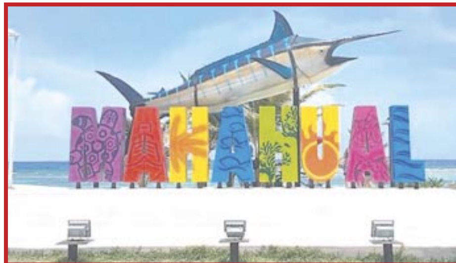
Durante el último año se han presentado nueve proyectos de construcción de infraestructura turística en Mahahual e Xcalak.

Y se espera que con el nuevo sistema de transporte ferroviario aumente la llegada de visitantes permitiendo alcanzar 20 puntos porcentuales más en cada promedio.