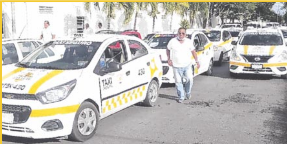
Los taxistas insisten en aumentar las tarifas de sus servicios, sobre todo, en Chetumal.