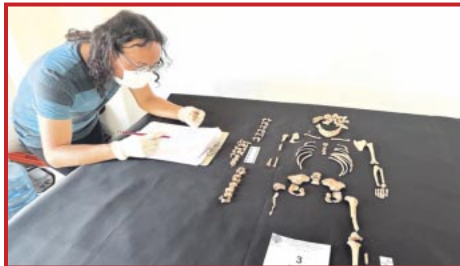
Once entierros humanos han sido recuperados por el INAH como parte de un salvamento arqueológico.

Bajo el nivel de piso de esa vialidad se identificaron 11 enterramientos primarios, es decir, que no habían sido alterados desde su inhumación original. De ellos, cinco corresponden a personas subadultas y estaban acompañadas por ajueres funerarios formados por vasijas, figurillas, fragmentos de obsidiana y puntas de proyectil. Destaca uno de los cinco esqueletos, el cual presenta modelado cefálico tabular erecto y modificación dentaria.