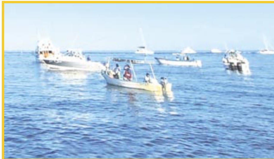
En la Isla de Cozumel, Anuncian tercer torneo de pesca deportiva “Hombres Caídos del Mar”.