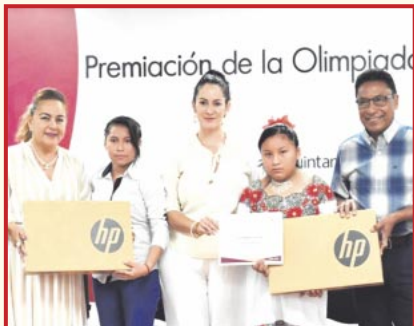
Se entregaron reconocimientos, premios y becas a las y los 10 alumnos ganadores de la Olimpiada del Conocimiento Infantil 2023.

Chetumal.- En reconocimiento a su destacada participación en la Olimpiada del Conocimiento Infantil (OCI) 2023, el gobierno del estado a través del secretario de Educación de Quintana Roo (SEQ), Carlos Gorocica Moreno, entregó reconocimientos, premios y becas a las y los 10 alumnos ganadores de dicho concurso.