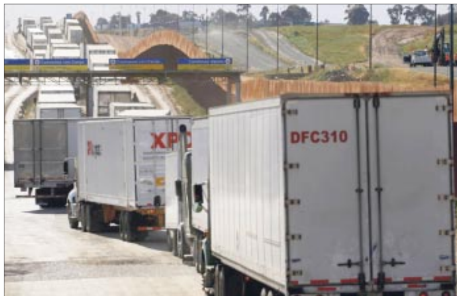
El endurecimiento de las revisiones aduaneras en la frontera norte por parte de Estados Unidos afecta el traslado de mercancías.

Esto ha afectado el comercio internacional en una zona donde al día se realizan 3 mil 500 cruces, a través de Córdova de las Américas, Zaragoza-Ysleta, San Jerónimo-