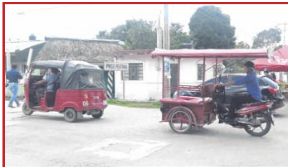
Autoridades en José María Morelos revelan que hay 446 mototaxistas operando, pero 40 cuentan con una póliza de seguro vencida.

Finalmente, reconoció que los operativos que realizan los inspectores son permanentes, aunque han causado inconformidad entre los operadores de mototaxis, “es importante para la ciudadanía de que cumplan con cada requisito, por su propia seguridad”, concluyó.