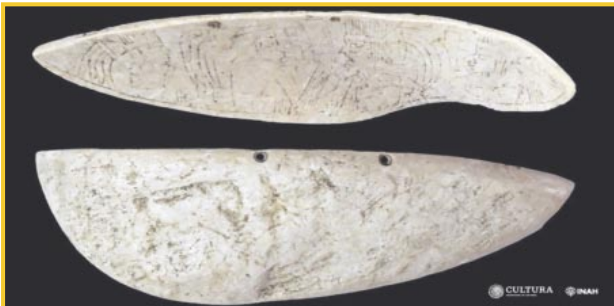
Una gargantilla hecha en caracola fue descubierta por el INAH, en el marco de las tareas de salvamento arqueológico en las obras del Tren Maya.