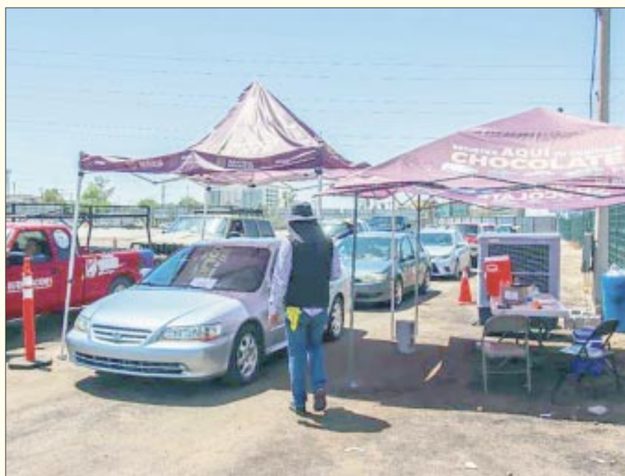
Un total de 1 millón 803 mil 58 vehículos de procedencia extranjera, conocidos como autos “chocolate”, han sido regularizados en 17 estados, reveló la SSPC.

Aún prófugos, el gobierno de EU también ha hecho público su interés de extraditar desde México a otros tres de los hijos del narcotraficante preso Joaquín “El Chapo” Guzmán que conforman la facción de Los chapitos: Iván Archivaldo Guzmán Salazar, Jesús Alfredo Guzmán Salazar y Joaquín Guzmán López.