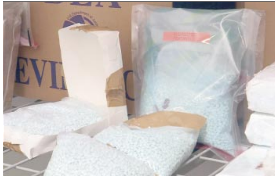
La DEA considera al Cártel de Sinaloa y al CJNG los principales introductores de fentanilo a Estados Unidos.

EU también ha aumentado el número de investigaciones y procesamientos por envene-