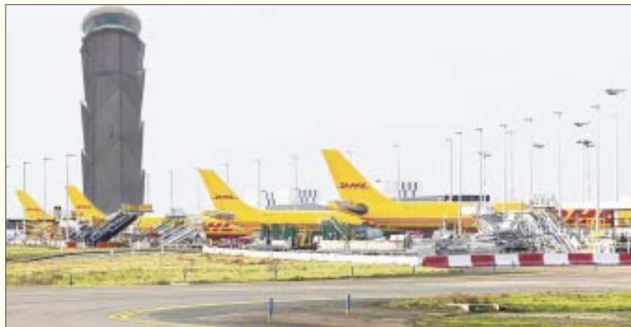
El nuevo Aeropuerto Internacional Felipe Ángeles logró posicionarse como la segunda terminal con más toneladas de mercancía manejada en el país.

“Ya se ha avanzado bastante con el apoyo de la gente, está la Guardia Nacional, y esperamos que ya pronto se restablezca la normalidad. La gente está apoyando, confirmo eso, ya se restableció el servicio de energía eléctrica, se quitaron los bloqueos y hay mucho apoyo de la población, en el caso de Frontera Comalapa y Motozintla”, añadió.