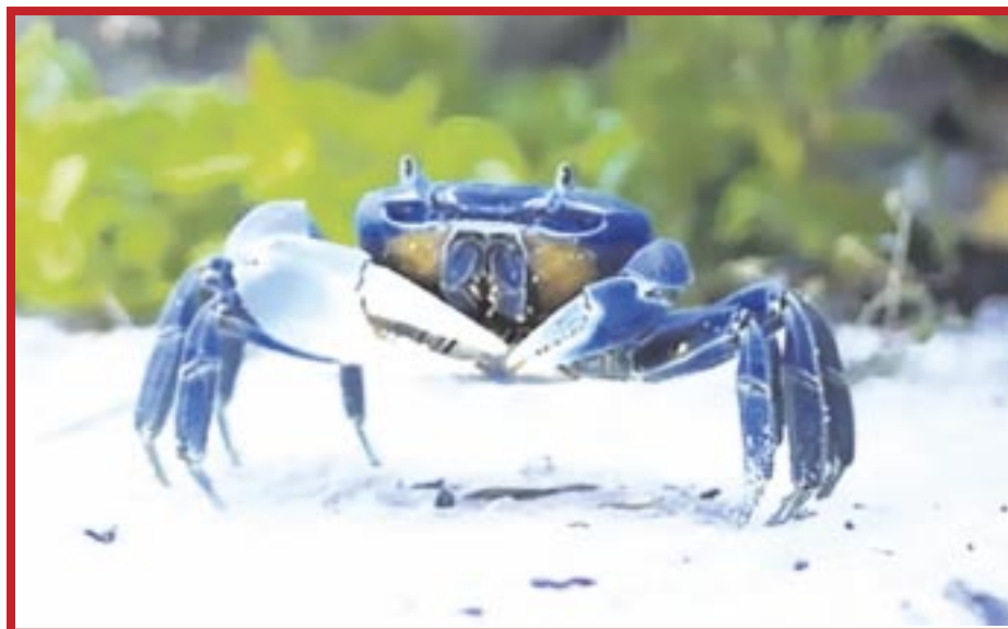
La presencia y ruta del cangrejo azul cambió de zona en Cancún.

Se calcula que cada año se cuentan hasta casi mil 500 ejemplares durante su cruce en los meses de temporada.