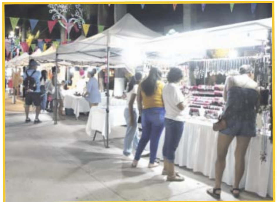
Se lleva a cabo el programa “Pabellón artesanal y gastronómico” en la isla de Cozumel.

Por último, dijo que aún hay espacios para los productores que gusten participar en este pabellón, los cuales solo tienen que acudir a la subdirección de Desarrollo Económico ubicada en altos Plaza del Sol, de lunes a viernes en horario de 9:00 de la mañana a 3:00 de la tarde, donde deberán informar sobre sus productos, y dónde se les orientará sobre cómo participar de forma gratuita en este grupo de comerciantes, así como también para adherirlos al grupo de WhatsApp en el que se les informará sobre las actividades próximas.