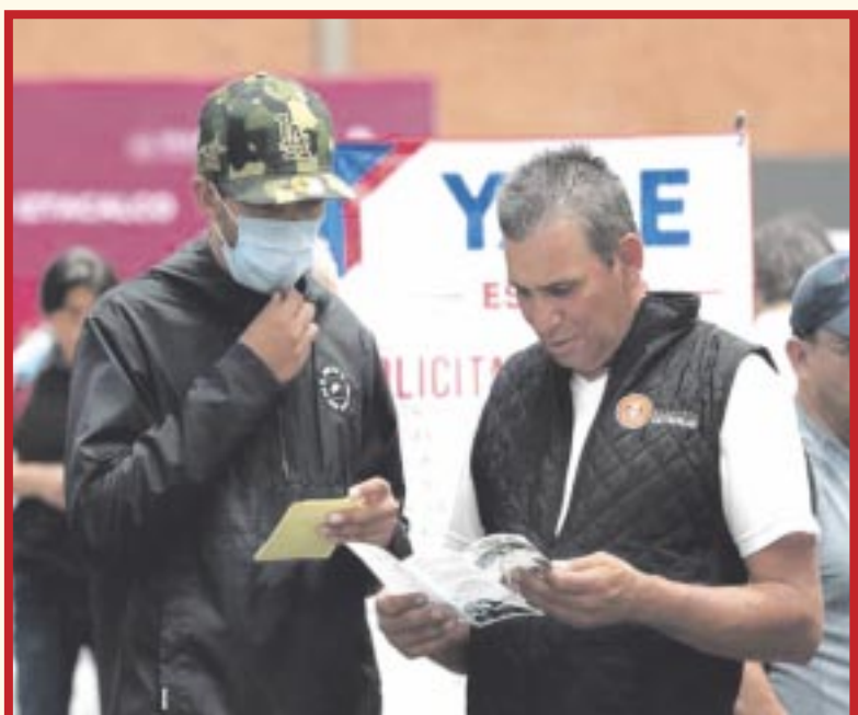
La población desocupada en México disminuyó en 308,000 personas en comparación con agosto de 2022, según encuesta del Inegi.

De acuerdo con datos de la Encuesta Nacional de Ocupación y Empleo (ENOE), la tasa de desempleo en México fue del 3% en agosto, informó el Instituto Nacional de Estadística y Geografía (Inegi). La mejora en el empleo se concentró en el sector de los servicios.