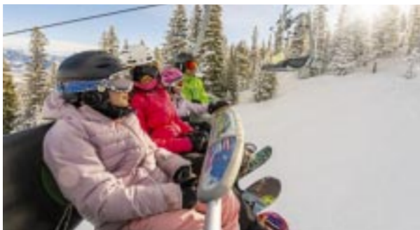
Aspen tendrá buenas nevas en invierno.

victoriagprado@gmail.com Twitter: @victoriagprado