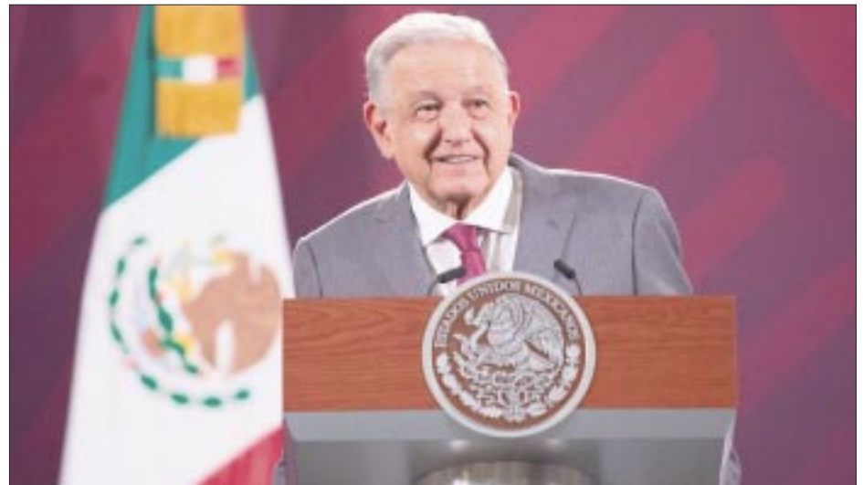
El presidente Andrés Manuel López Obrador reconoció que se incrementaron los homicidios dolosos en el país, en los últimos días.

El 27 de septiembre se registraron más homicidios en el Estado de México, con 11; Nuevo León, con nueve; Guanajuato y Jalisco, con