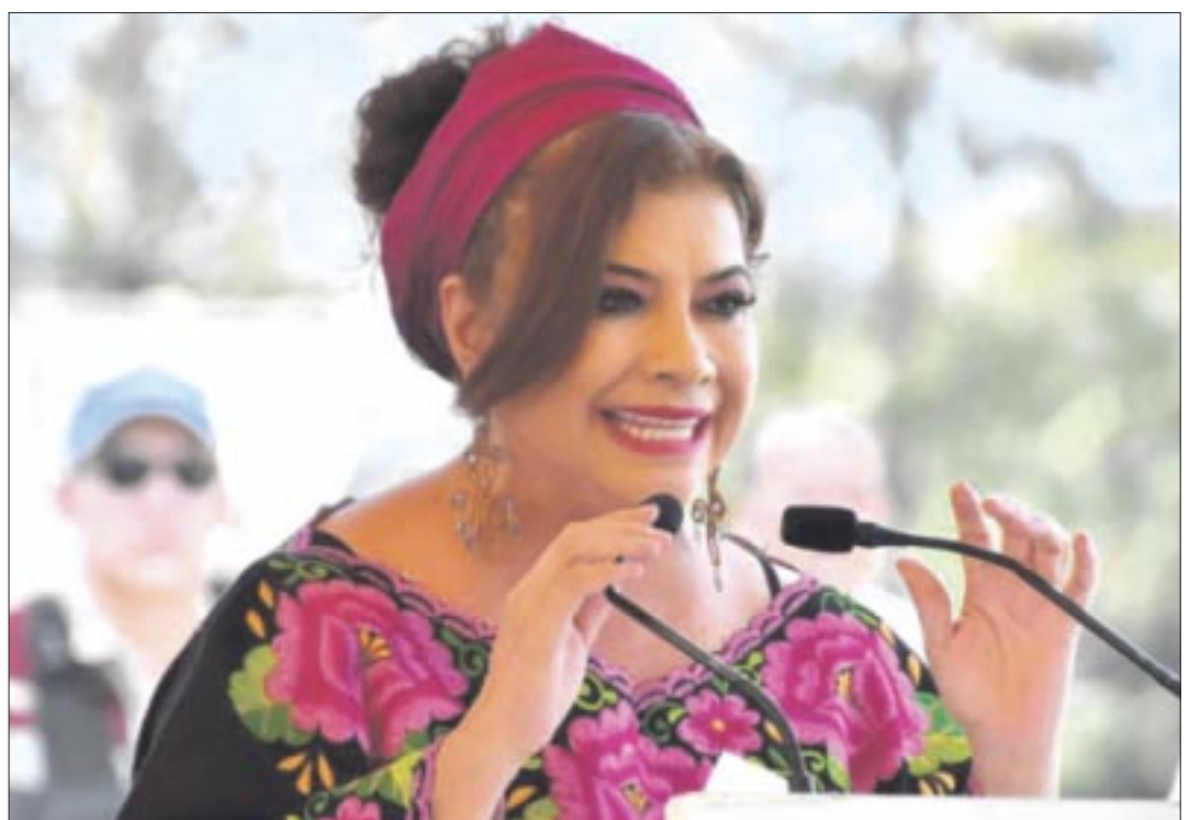
Mal y de malas inició Clara Brugada la búsqueda de la nominación de Morena a la CDMX.