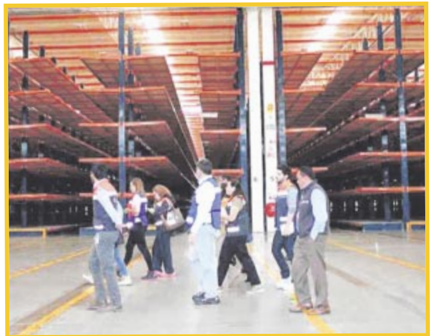
La megafarmacia prometida por el presidente Andrés Manuel López Obrador, iniciará operaciones este diciembre, informó la Cofepris.

Cofepris anunció que compartió con Birmex la ruta de acompañamiento regulatorio para vigilar la calidad, seguridad y eficacia de los medicamentos que se almacenen en la futura megafarmacia de AMLO.