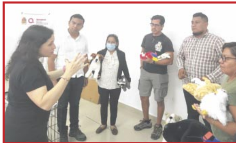
Imparten taller “Implementación de Refugios Temporales para Animales”.

También se realizó una simulación de implementación de un refugio temporal para animales domésticos ante una emergencia, donde pudieron conocer los kits de emergencia y desarrollar el protocolo de actuación correspondiente, para proceder al intercambio de experiencias.