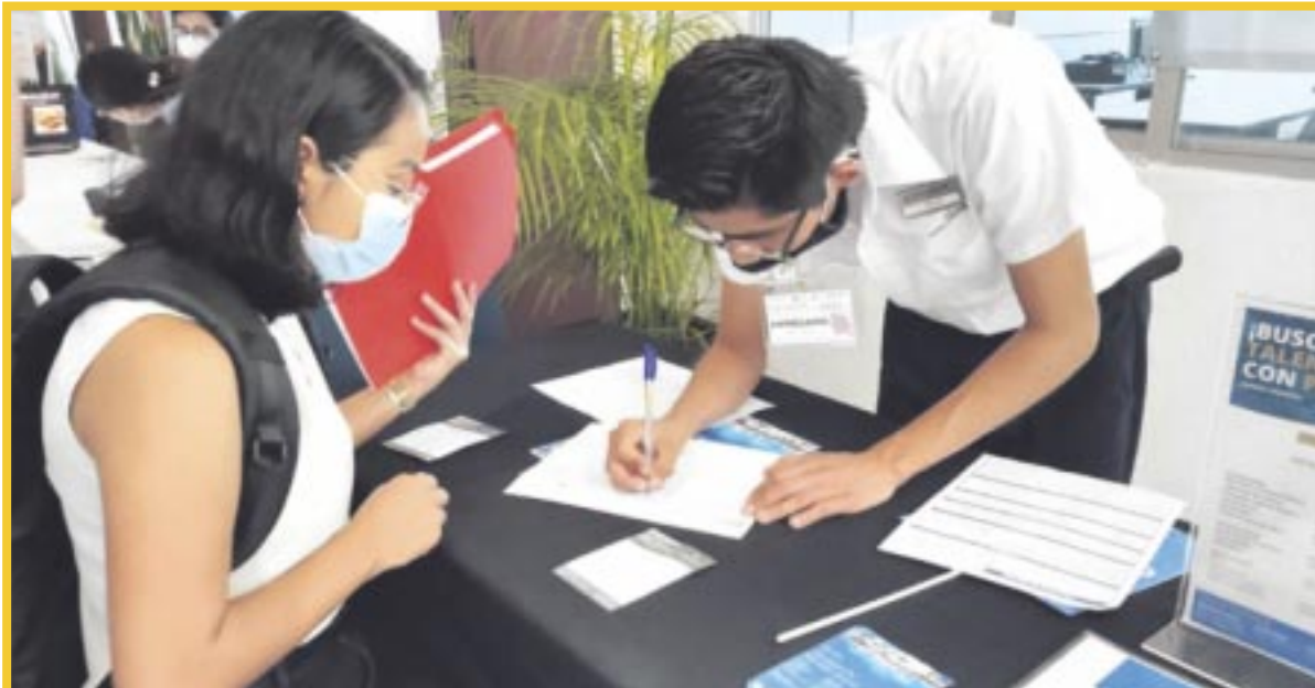
El gobierno estatal formalizó convenio para destinar 27 mdp para impulsar creación de empleos en el estado.

Quintana Roo suma entre enero y julio un total de 23 mil 185 nuevas fuentes de empleo, pues abrió 2023 con un total de 479 mil 784 trabajadores activos ante el IMSS, y al cierre de julio la cifra se ha incrementado hasta los 502 mil 969 empleados, una cifra que supera los registros de 2019.