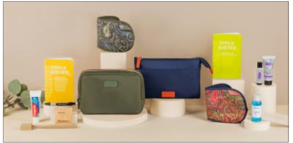
Aquí el kit sustentable.

2024 Stifel Aspen Winternational . Para la culminación del circuito de la Copa del Mundo de Esquí Audi FIS en los Estados Unidos, Aspen Snowmass será sede de las carreras de tecnología masculina para el 2024 Stifel Aspen Winternational del 1 al 3 de marzo de 2024. Los corredores internacionales competirán en