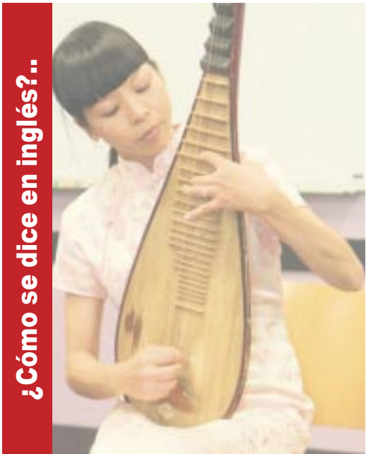
¿Cómo se dice en inglés?..

PISCIS • 19 FEBRERO-20 MARZO Controla tus impulsos porque podrías hacer daño a alguien a quien quieres muchísimo.