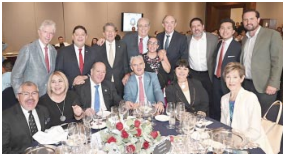
Algunos de los invitados a la celebración.

victoriagprado@gmail.com X: @victoriagprado