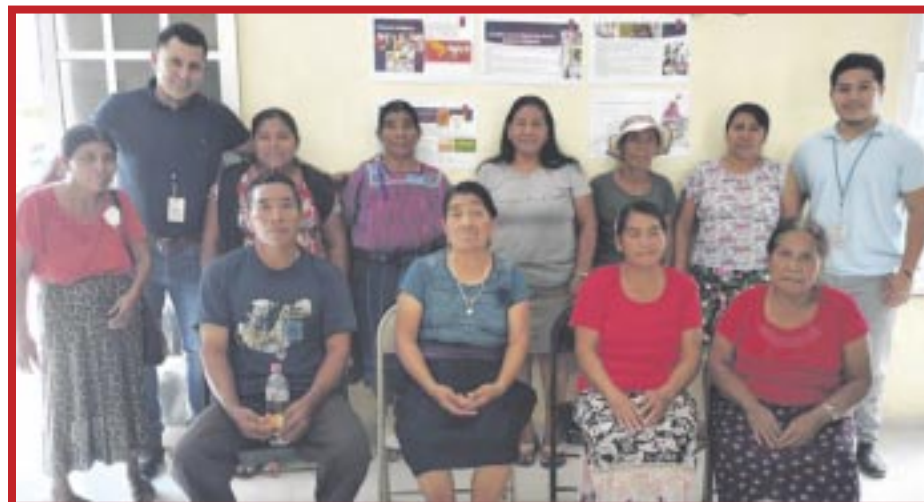
Realizan pláticas informativas y constructivas sobre los derechos de las mujeres indígenas.

Las mujeres indígenas son fundamentales en la preservación de las lenguas indígenas y la salvaguarda de recursos frágiles. Además, su conocimiento sobre el mundo natural, la salud, las tecnologías, los ritos y rituales distintivos y otras expresiones culturales significativas son invaluable.