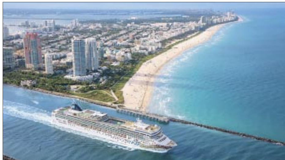
La industria de los cruceros se reunirá en Miami Beach.