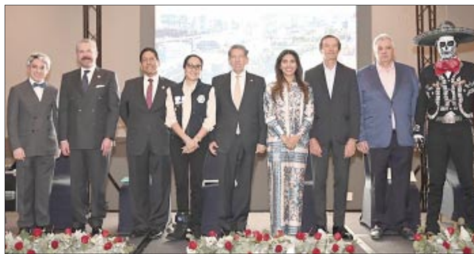
Durante la celebración del Día de la Hotelería.

la Asociación de Hoteles y Moteles del Valle de México.