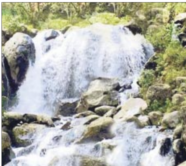
Así lucía hace poco tiempo, en la zona metropolitana de Ciudad de México