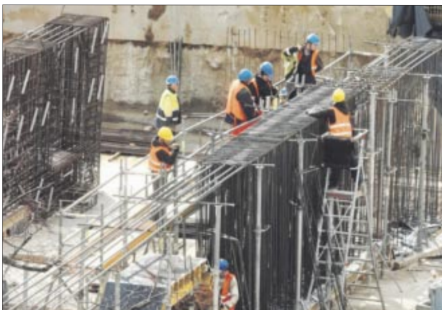
La industria de la construcción en México no ha podido superar los niveles de empleo que se tenían antes de la pandemia.

Asimismo, la ciudadanía reportó estar satisfecha con los servicios como suministro de agua potable y recolección de basura, con 50.7% y 72.6%, respectivamente.