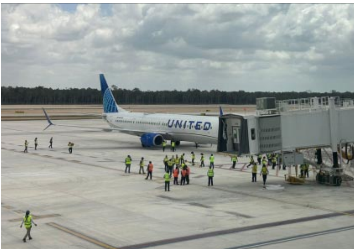
El Aeropuerto Internacional de Tulum se fortalece con la llegada de la nueva ruta aérea de United Airlines, aumentando la conectividad con Estados Unidos.

Tulum. — El Aeropuerto Internacional de Tulum celebra la llegada de una nueva ruta aérea de United Airlines que conectará la ciudad con Houston y New York. Esta nueva conexión se suma a los vuelos provenientes de Chicago que llegarán el próximo sábado, ampliando la oferta de 28 vuelos semanales para los viajeros.