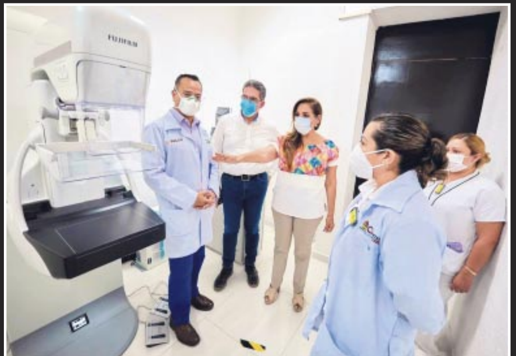
La gobernadora Mara Lezama supervisó el servicio de salud en el Hospital General de Felipe Carrillo Puerto, junto con el secretario estatal de Salud, Flavio Carlos Rosado.

En este sentido, se espera que la inclusión de nuevas rutas aéreas y la presencia de aerolíneas como Aerus contribuyan a consolidar a Cozumel como un destino turístico de primer nivel en el Caribe mexicano.