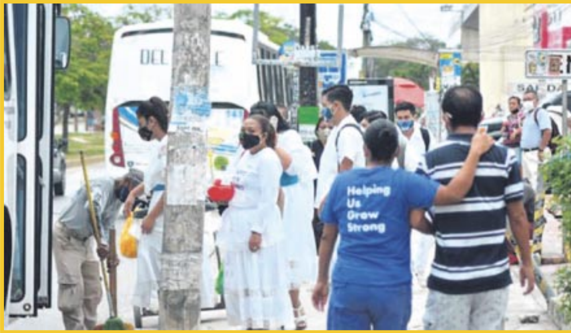
Por lo menos el 67 por ciento de los trabajadores en Quintana Roo sufren de estrés laboral.

Las mujeres sufren mayor estrés que los hombres, pues el 64% de quienes se encuentran en esta situación son féminas, ya que enfrentan problemas como acoso en la oficina, tiempo insuficiente para dedicarse a las labores del hogar o menosprecio de sus capacidades por cuestiones de género, según la consultora.