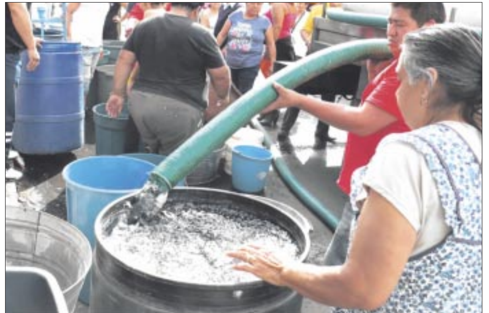
Sólo el 52 por ciento de la población urbana en México cuenta con suministro constante de agua potable, mientras que el 48 por ciento restante padece déficit, reportó el Inegi.

“En la pandemia decrecimos 20%; hoy se empieza a ver un poco de avance, tal vez este año podamos terminar con un crecimiento de 1%, muy ligero, pero al parecer se empieza a recuperar. Somos una industria con toda la capacidad para hacer cualquier obra, el ejército es una institución digna y respetada, pero su principal objetivo es cuidar la soberanía del país”, declaró Méndez Jaled.