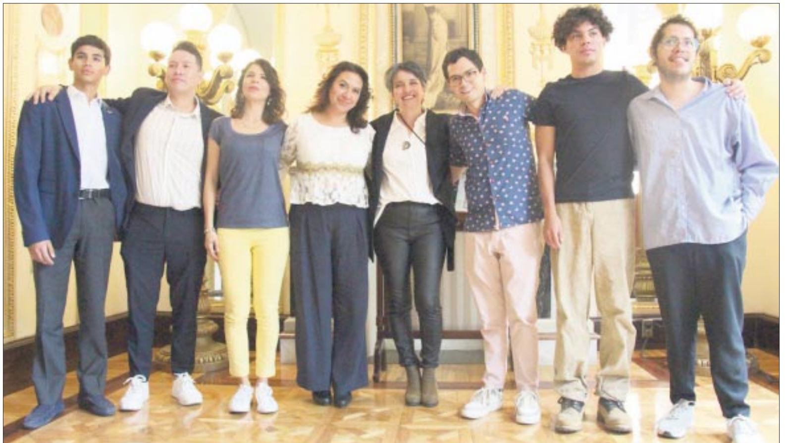
Algunos representantes de las obras a presentar , nos contaron algunos detalles, como fechas y sedes.

La Cartelera estará disponible en la página de la Dirección de Teatros de la Cuidad de México. Y en las redes sociales. Para comprar los boletos puedes acudir a las taquillas d ellos recintos o en www.ticketmaster.com .