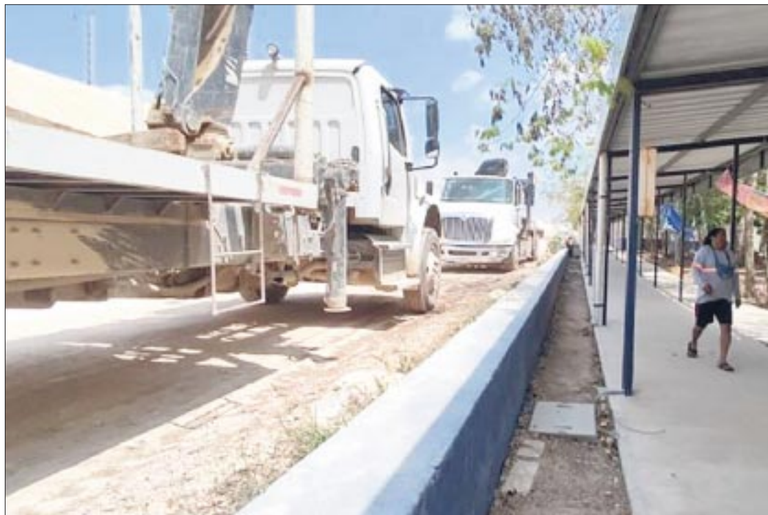
Las obras del Tren Maya continúan a marchas forzadas como lo es en el caso de Playa del Carmen, a la altura de Villas del Sol.

del Tren Maya se observa que la infraestructura supera el 70 por ciento de avance y los obreros aseguran que tienen como enmienda concluir más tardar pasando las elecciones, de modo que albañiles, carpinteros, electricistas y otros circulan por el “Mercado del Productor”, continuamente; asimismo, se observan camiones pesados de carga, entre volquetes y camionetas, de los cuales ya se han quejado algunos comerciantes en la zona, ya que alejan a la clientela; principalmente los vendedores de alimentos, quienes han denunciado una enorme cantidad de polvo de construcción.