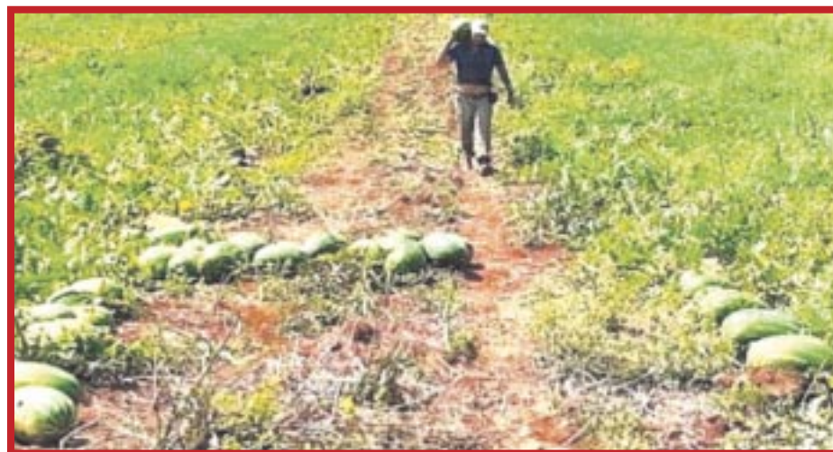
El subsidio de la CFE desapareció en las nueve unidades de riego de la comunidad de La Candelaria en el municipio de José María Morelos.

En este marco, hoteleros y restaurantes de grandes cadenas tienen tasados sus salarios en dólares y parece ser que ya se adecuaron esas finanzas para encaminarse a una recuperación absoluta.