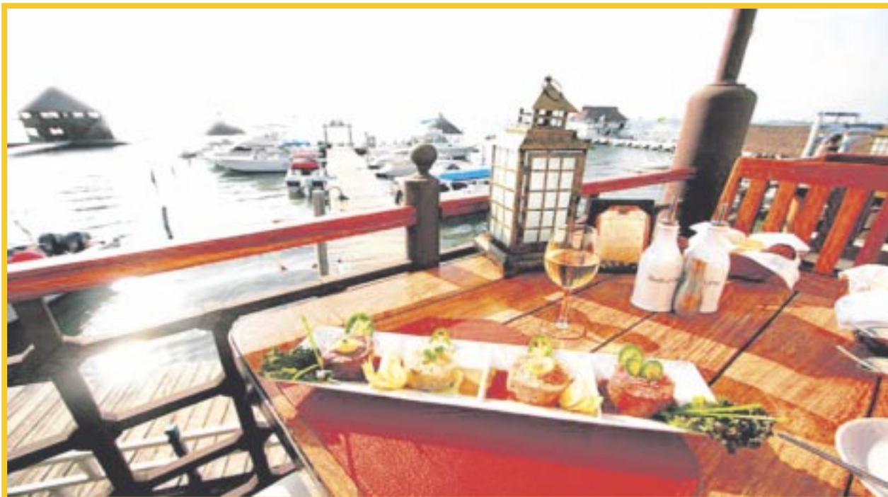
La Canirac reconoció que el sector restaurantero ha tenido que iniciar el proceso de ajuste de precios en sus menús al alza.

La Canirac de Quintana Roo reconoció que el sector restaurantero ha tenido que iniciar el proceso de ajuste de precios en sus menús, debido a que se ha vuelto insostenible mantenerse como hasta ahora, con la inflación constante y el encarecimiento de los insumos para elaborar los alimentos.