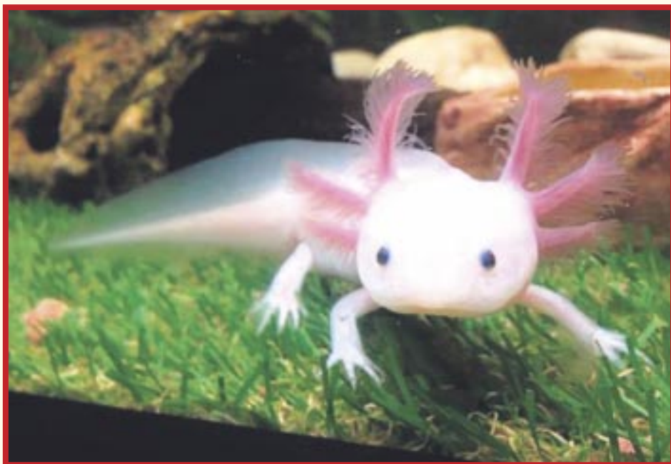
El Acuario Interactivo Cancún, de Delphinus, presenta la nueva exhibición permanente de 17 Ajolotes adultos, una especie única en el sureste mexicano.

Cancún.- El Aquarium Cancún (Acuario Interactivo Cancún) de Delphinus presenta la nueva exhibición permanente de 17 Ajolotes adultos, una especie única en el sureste mexicano, iniciativa que surge como parte del esfuerzo conjunto de conservación de la especie Ambystoma mexicanum .