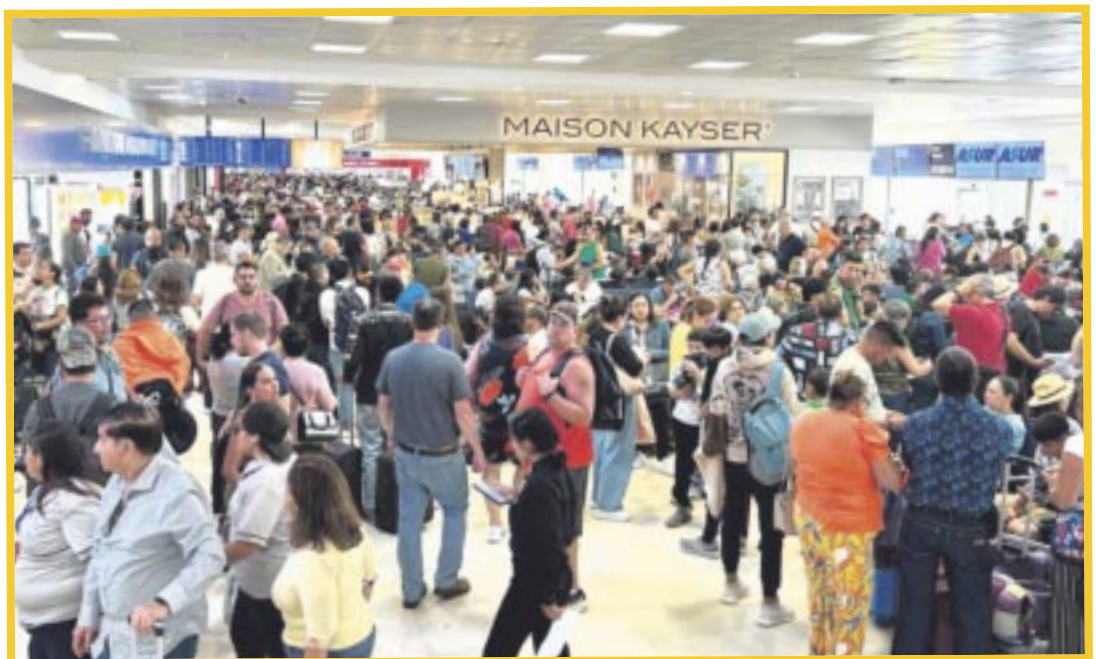
El nuevo Aeropuerto Internacional de Tulum, Felipe Carrillo Puerto, recibió las nuevas rutas aéreas de United Airlines.

Con estas nuevas conexiones, más de 6 mil 160 pasajeros semanales tendrán la oportunidad de experimentar la cultura maya, la tradición, la gastronomía y la extraordinaria belleza natural que ofrece el centro y sur del Caribe Mexicano.