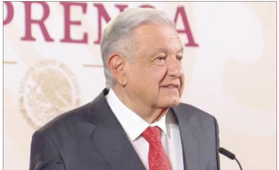
Andrés Manuel López Obrador aseguró que el proceso electoral y la transición presidencial será muy tranquilo y terso, pese a los asesinatos de aspirantes.

Además, García dijo que no solo se trata de la proveeduría de los equipos, sino que también se debe realizar la instalación, que puede llevar entre dos o tres meses, considerando que no se puede detener la operación de la planta porque se trata de modificaciones costosas para los permisionarios.