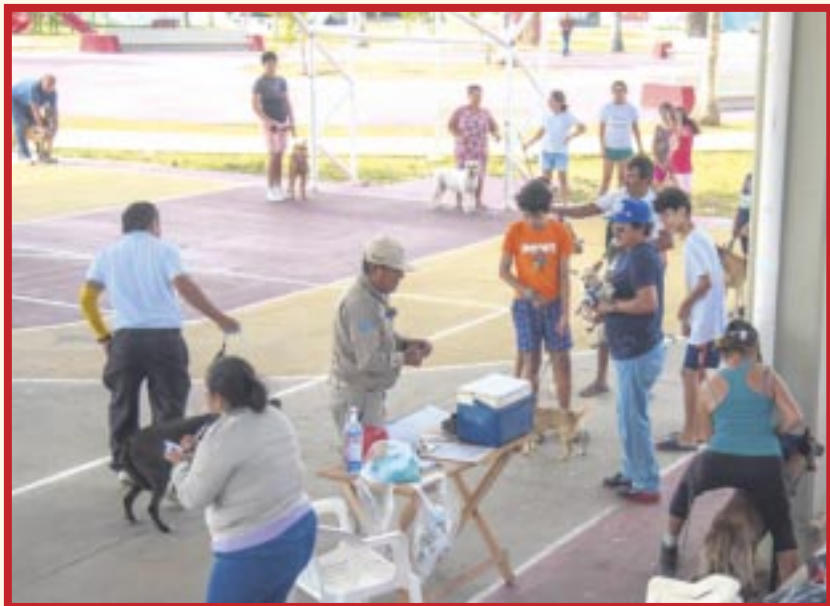
En el primer día de la Jornada de Vacunación Antirrábica Canina y Felina, del 31 de marzo al 06 de abril, se aplicaron 18 mil 460 dosis en el estado.

Chetumal. – Tras hacer un llamado a llevar a las mascotas a recibir la vacuna antirrábica, la Secretaría de Salud (Sesa) de Quintana Roo informó que en el arranque de la Jornada de Vacunación Antirrábica Canina y Felina se aplicaron 18 mil 460 dosis.