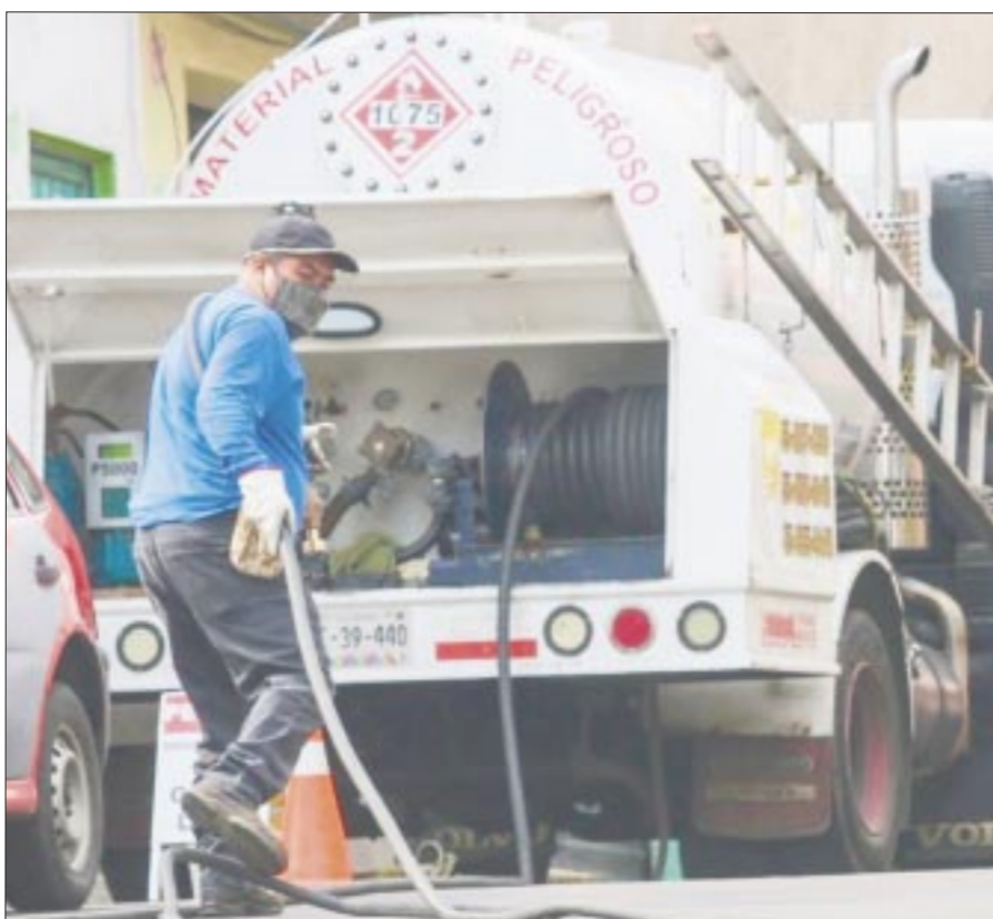
De mil 400 operadores de gas en el país, sólo 400 tienen las condiciones para cumplir con los controles volumétricos que exige el fisco mexicano

“Estoy muy contento, satisfecho, me han ayudado mucho, han actuado con integridad, rectitud, patriotismo y lealtad al pueblo. Y me han ayudado mucho”.