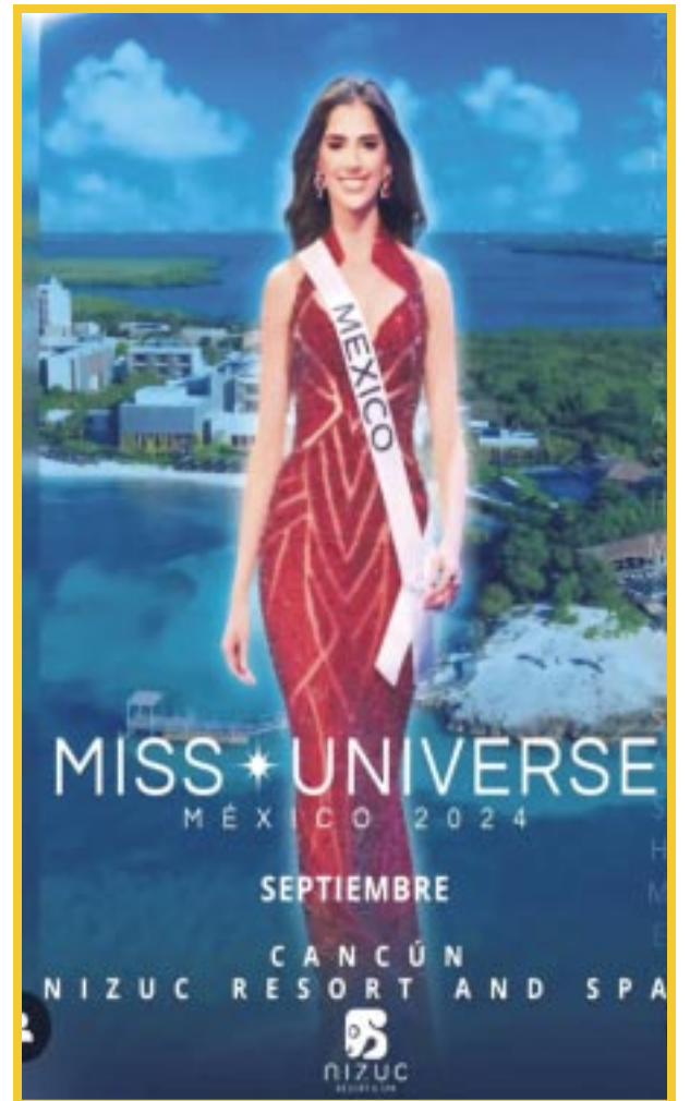
El comité organizador de Miss Universe México 2024 informó que Cancún será su sede este año.

El certamen Miss Universe México 2024 promete ser un evento sin igual, donde la belleza, la elegancia y la cultura mexicana se fusionarán en un escenario de ensueño en tierras cancanenses.