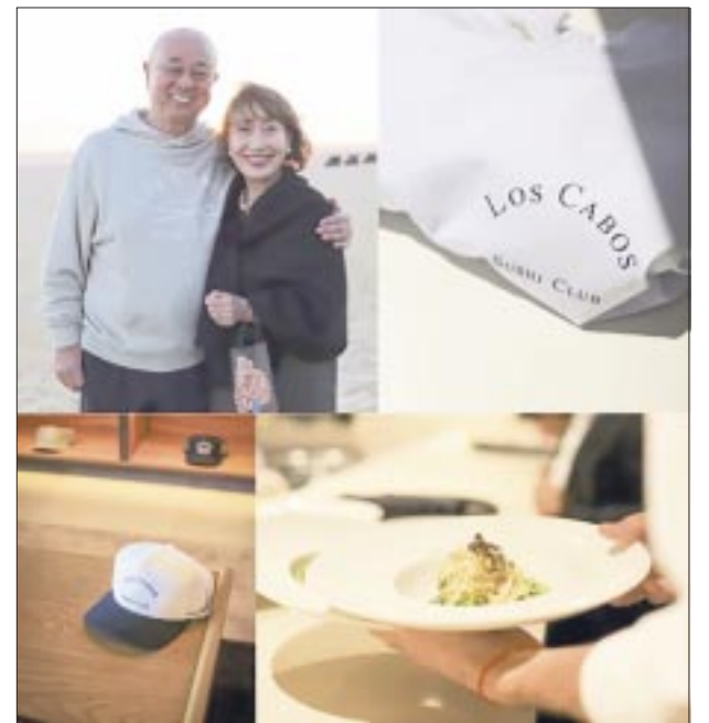
Nobu Matsuhisa, emprendedor visionario , ahora en Los Cabos.

En 2022, Delta se asoció con GPS Apparel by Gap Inc. para dar vida a la nueva colección de prototipos. Trabajar con Gap Inc. , empresa icónica y orientada a propósito con cartera de marcas conocidas en todo el mundo, como Old Navy , Gap , Banana Republic y Athleta , permite a la ae-