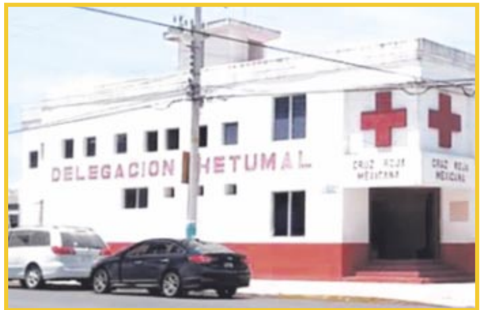
Cruz Roja de Chetumal busca recursos para comprar una ambulancia nueva.

Por su parte, la Cruz Roja Delegación Cancún sigue otorgando el programa de formación de guardavidas, con cursos que se llevan a cabo cada mes y medio, a fin de contar con personas capacitadas para ayudar a las personas en caso de alguna emer-