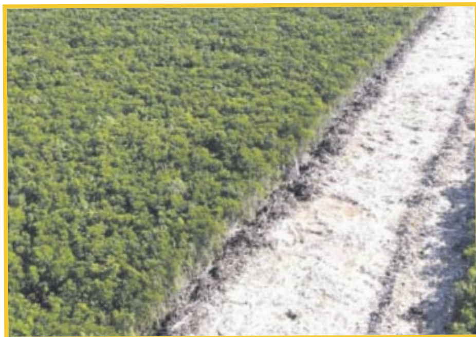
Desde el gobierno federal se realizó una mega expropiación de 105 inmuebles para continuar la construcción del Tren Maya.

De tal manera que, Fonatur, Fonatur Tren Maya y la Sedatu se coordinarán para cubrir con su presupuesto autorizado el monto de la indemnización, de conformidad con los avalúos que emitió el Instituto de Administración y Avalúos de Bienes Nacionales.