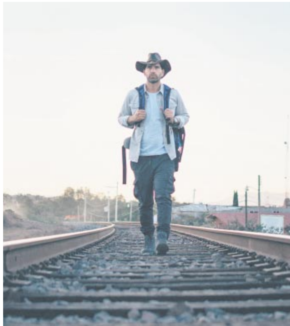
¿Y Tú, Tú Que Vas A Hacer? surgió de la necesidad de compartir las riquezas turísticas del país.

SVP Programming and Production de History 2