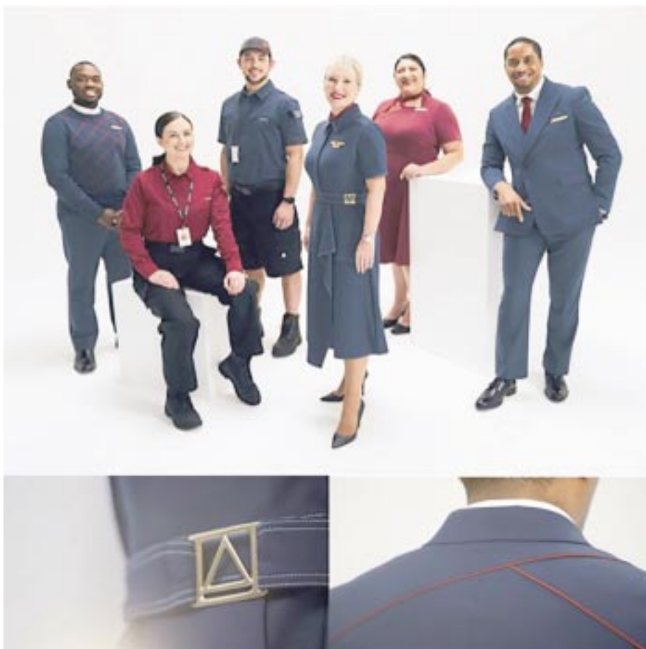
Los prototipos de los nuevos uniformes tienen colores más clásicos

victoriagprado@gmail.com X: @victoriagprado