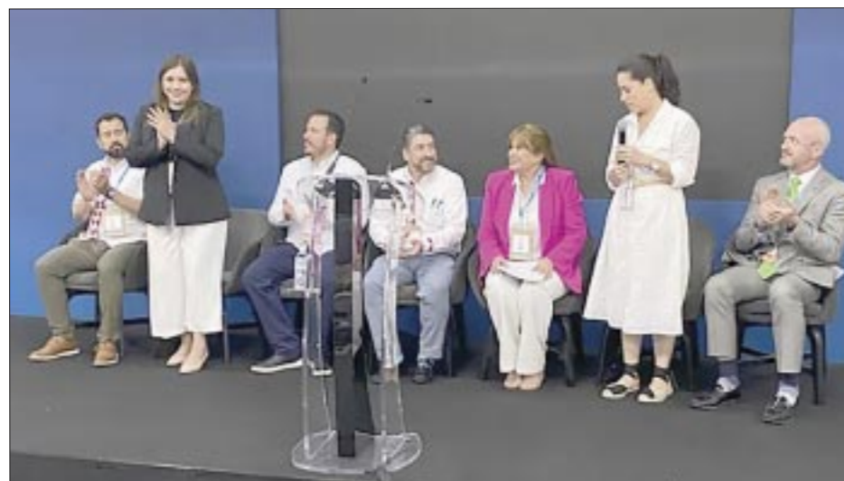
Unen esfuerzos Baja California Sur, Chihuahua y Sinaloa.