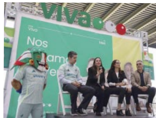
Durante el anuncio de la aerolínea oficial de la Selección Nacional de México.

☆☆☆☆☆ Ubicado en el barrio de Salamanca, uno de los más exclusivos de Madrid el hotel VP Madroño es referente para los viajeros que visitan la capital de España. Su inigualable localización, con fácil acceso a los principales centros de entreteni-