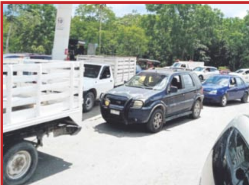
Sólo 40% de los propietarios de vehículos empadronados cumplieron con su pago de derechos en Felipe Carrillo.

Felipe Carrillo Puerto.- De acuerdo con la Dirección de Recaudación en el municipio de Felipe Carrillo Puerto, únicamente el 40% de los propietarios de vehículos empadronados cumplieron con su pago de derechos y aprovecharon el programa de estímulos fiscales que concluyó en marzo pasado.