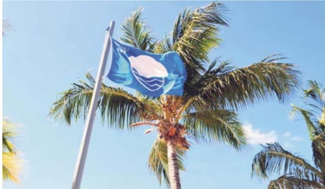
Trabajan para mantener distintivo Blue Flag en Isla Mujeres.

De tal manera que, a partir de este abril, los autos y camionetas deben pagar 25.86 pesos más el Impuesto al Valor Agregado (IVA) por los primeros 40 minutos que se mantengan esperando pasaje en los andenes de ascenso y descenso de pasaje en el aeródromo del