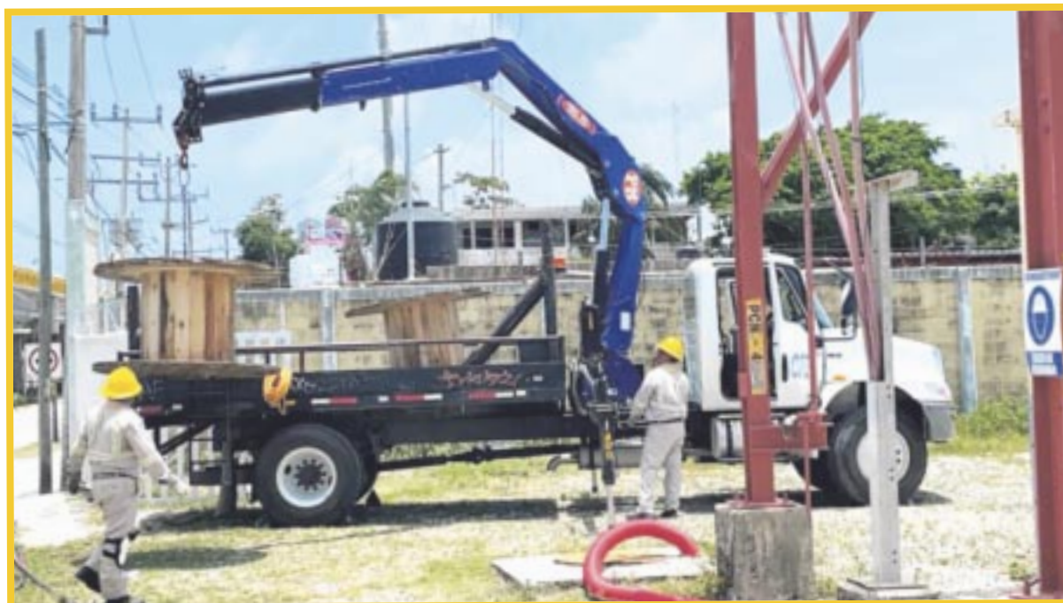
La CFE realizará cortes del servicio este viernes en diversas colonias y hoteles de Playa del Carmen.

Y los hoteles The Five Bech, Vicery Riviera Maya, Petit Latife y Hotel Ocean Riviera Paradise también enfrentarán este apagón de la energía eléctrica por al menos ocho horas, que es lo que promete la CFE, para no causar afectaciones mayores.