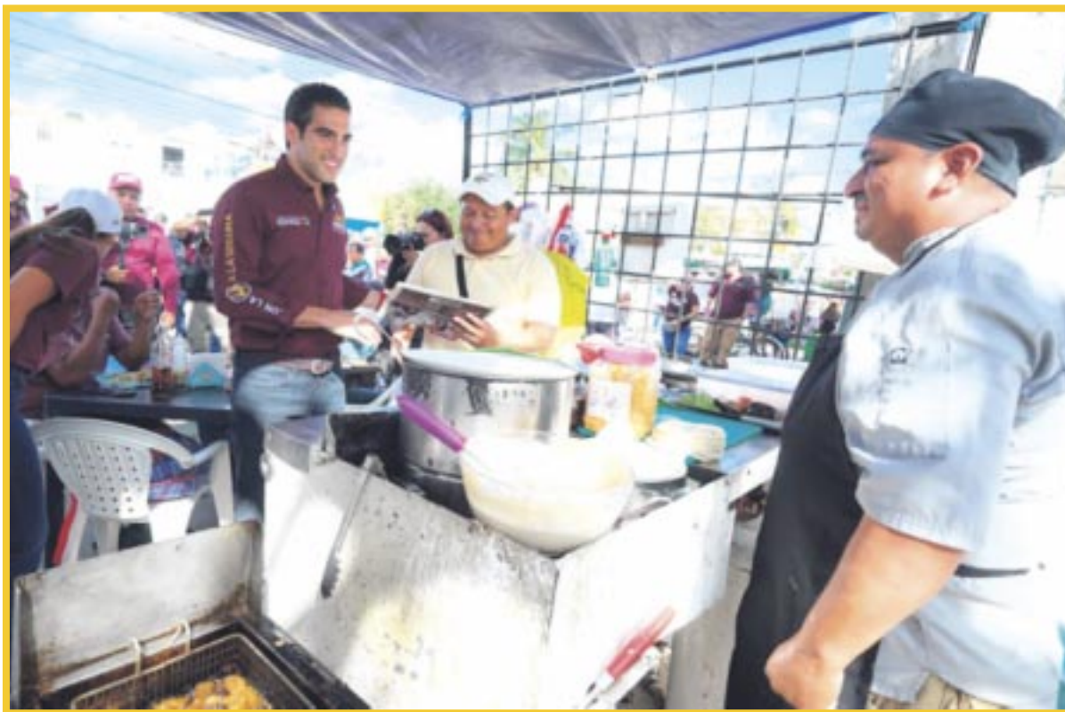
Gino Segura, candidato al Senado de la República, por la coalición Sigamos Haciendo Historia, recorrió las calles de Cancún en busca de apoyo ciudadano que fortalezcan su camino hacia el Congreso de la Unión.

“Tenemos la votación más grande de la historia en el país y si queremos continuar con la transformación del Estado con Gino Segura vamos a la Segura” concluyó.