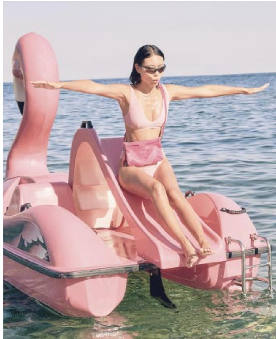
Esta segunda colaboración es perfectamente divertida y apuesta más por el rosa Barbie™.