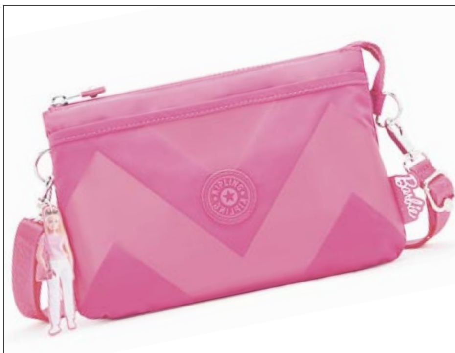
Se trata de vivir la vida a través de gafas y el color rosa, haciendo que cada día sea divertido con nuestras clásicas bolsas de mano y crossbodies.