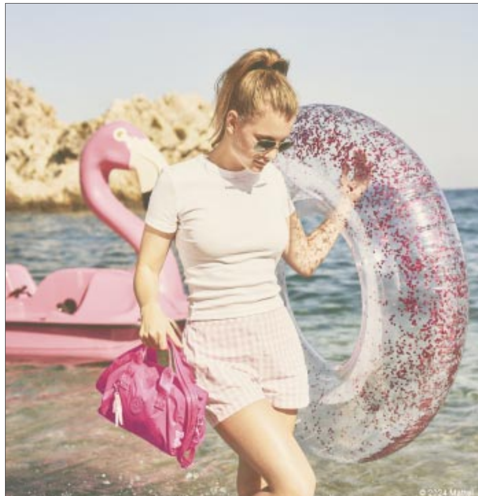
Esta colección llena de detalles imprescindibles, refleja el espíritu confiado y aventurero tan característico de Barbie.

Despierta a la Barbie que llevas dentro y prepárate para causar sensación, pues si bien, la colección Barbie X Kipling se agotó en línea, aún puedes conseguirla en Boutiques a partir del 22 de abril.