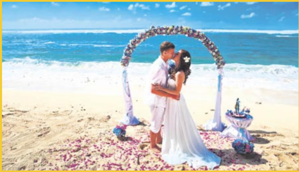
El turismo de bodas es un segmento que sigue avanzando considerablemente en Playa del Carmen.

En Playa del Carmen, el turismo de bodas es un segmento que sigue avanzando considerablemente en todas sus latitudes, tal como se refleja en la gran cantidad de enlaces que se tienen planeados en este destino para abril y mayo, que han demostrado ser los meses con mayor demanda.