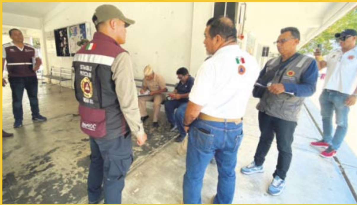
Coeproc llevó a cabo una supervisión de refugios anticiclónicos en la ciudad de Chetumal.

Con el objetivo de cuidar la seguridad y bienestar de la población ante la temporada de lluvias y ciclones tropicales 2024, iniciaron las visitas a los refugios designados, donde se recabaron datos detallados sobre las condiciones de infraestructura, capacidad de albergue y suministros necesarios.