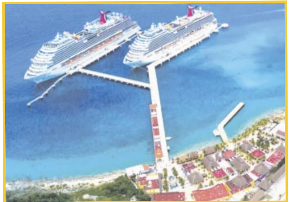
Cozumel mantiene una tendencia de crecimiento de doble dígito en captación de turistas de crucero.

Por su parte, la Secretaría de Turismo federal anticipa que para el cierre de 2024 Quintana Roo captará 57.6% del total de cruceros que están programados para todo el país, lo cual se queda corto en comparación con las cifras del año pasado, pero eso aún podría cambiar, cuando entre la temporada alta en la llegada de los hoteles flotantes. A decir de Sectur, la isla de las Golondrinas tendrá una participación de la industria de cruceros de 38.4%, con un total de 1,199 arribos; seguido de Mahahual, con 598, equivalente a 19.2% respecto del total nacional, y en un tercer lugar se posicionará Ensenada con 278 arribos y una participación de 8.9%.