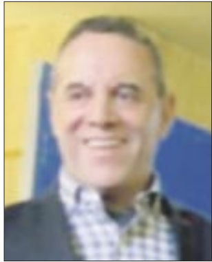
Por José Luis Montañez