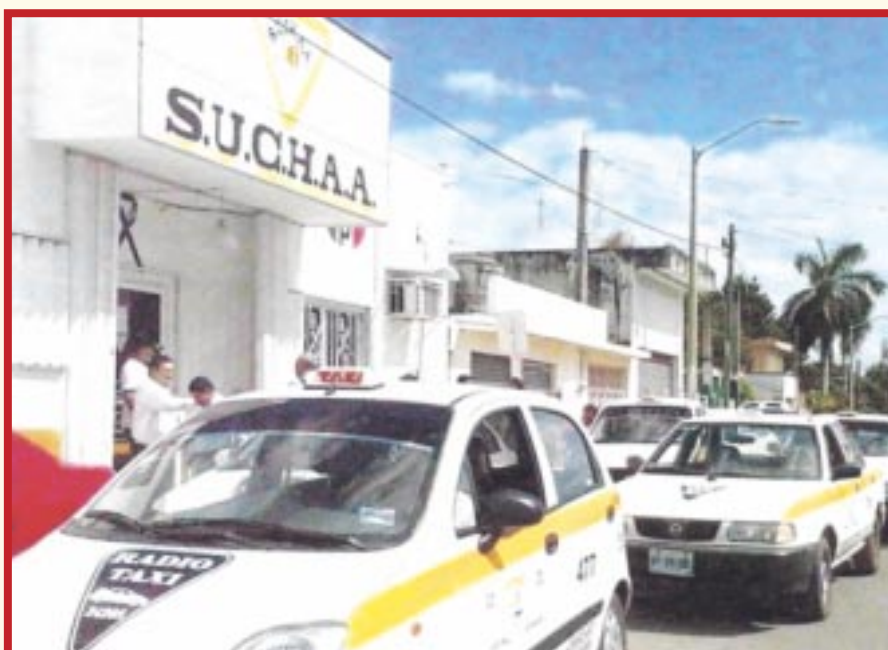
El Instituto de Movilidad de Quintana Roo descartó la posibilidad de autorizar el aumento al tarifario de los taxistas solicitada este año.

Chetumal.- El Instituto de Movilidad de Quintana Roo (Imoveqroo) descartó la posibilidad de autorizar el aumento al tarifario de los taxistas solicitada este año, y es que, el Sindicato Único de Choferes de Automóviles de Alquiler (Suchaa) en Othón P. Blanco (Chetumal) no entregó los estudios de factibilidad correspondientes.