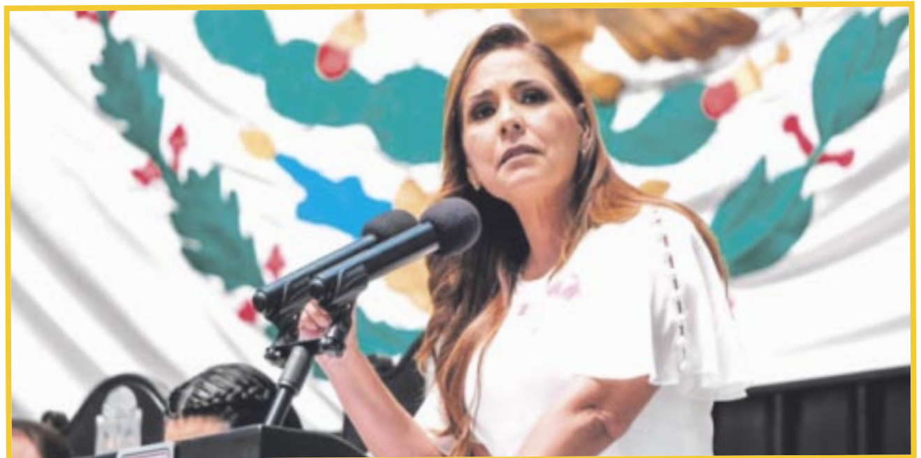
Mara Lezama Espinosa anunció la actualización y emisión del decreto de Zona Libre para Chetumal, con incentivos fiscales para personas físicas y morales que se dediquen a la importación.

La medida busca impulsar la economía local y generar beneficios para la capital. El decreto fue publicado en el Diario Oficial de la Federación el 22 de abril de 2024.