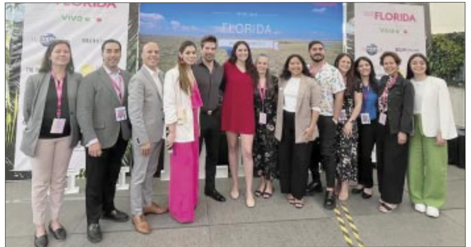
La Misión de Ventas de Visit Florida visitó Ciudad de México y Guadalajara.

☆☆☆☆ En el marco del Día Internacional de la Madre Tierra el pasado 22 de abril Solmar Hotels & Resorts re-