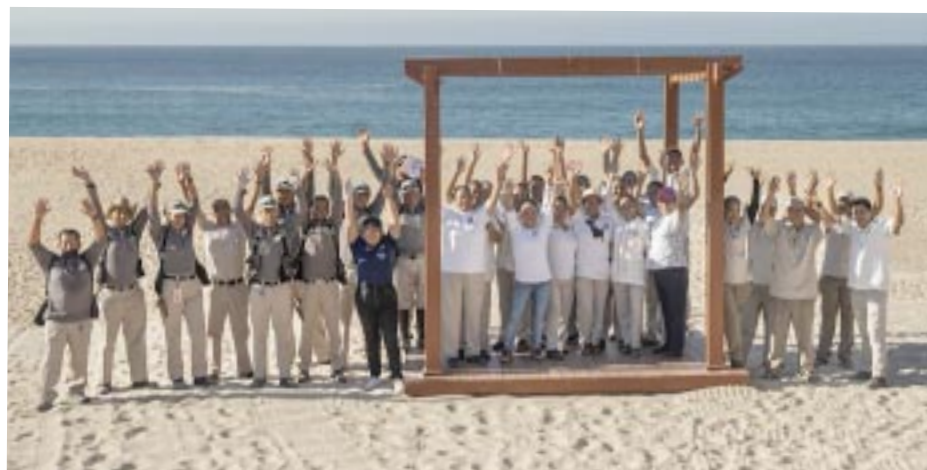
Celebran el Día de la Tierra limpiando playas.

victoriagprado@gmail.com X: @victoriagprado