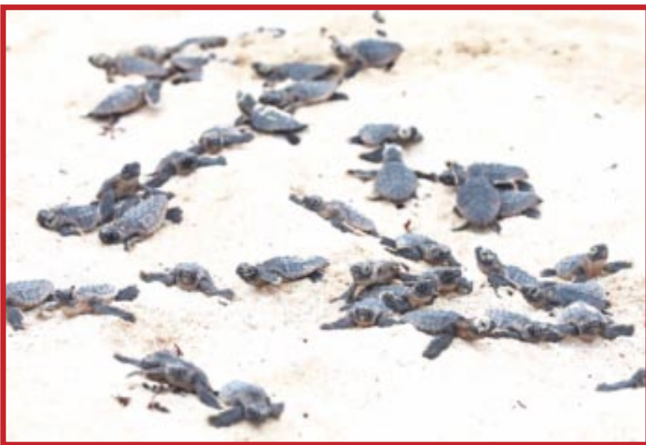
Alistan el “Programa de Protección a las Tortugas Marinas de Puerto Morelos 2024”.

Cabe recordar que, durante la temporada pasada se contabilizaron 2 mil 230 nidos de tortugas marinas en Puerto Morelos, con un estimado de entre 80 y 120 huevos por nido; pero solo una de cada mil tortugas liberadas alcanza la edad adulta. Las especies que llegan a las playas de Puerto Morelos son la Carey, Caguama, Blanca y Verde.