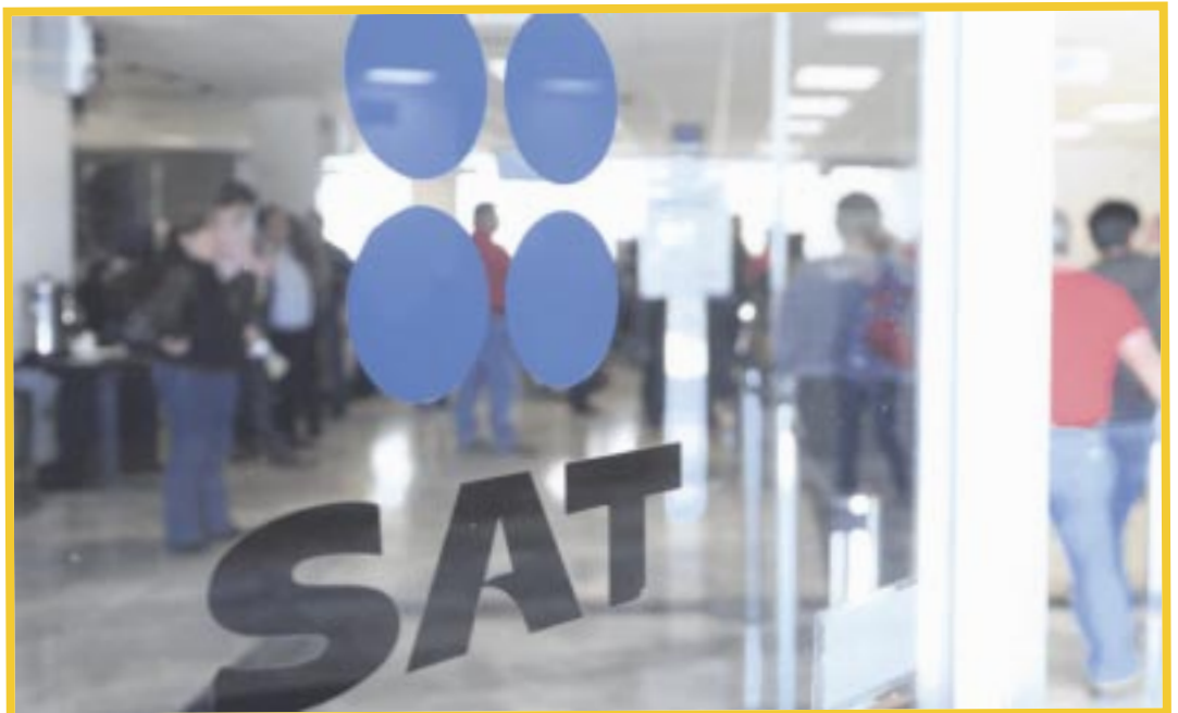
El SAT va a mantener una ampliación de horario para que las personas físicas presenten su declaración anual.

Asimismo, destaca que la declaración se debe presentar por las personas físicas que tengan dos o más patrones, si los ingresos anuales están por arriba de los 400 mil pesos, servicios profesionales, actividades empresariales, y aquellos que están en el Régimen Simplificado de Confianza, entre otros. El registro de la dependencia, refiere que la disponibilidad de las citas para esta semana en los módulos del SAT, están con una disponibilidad alta, a excepción de Cancún que reporta una disponibilidad media.