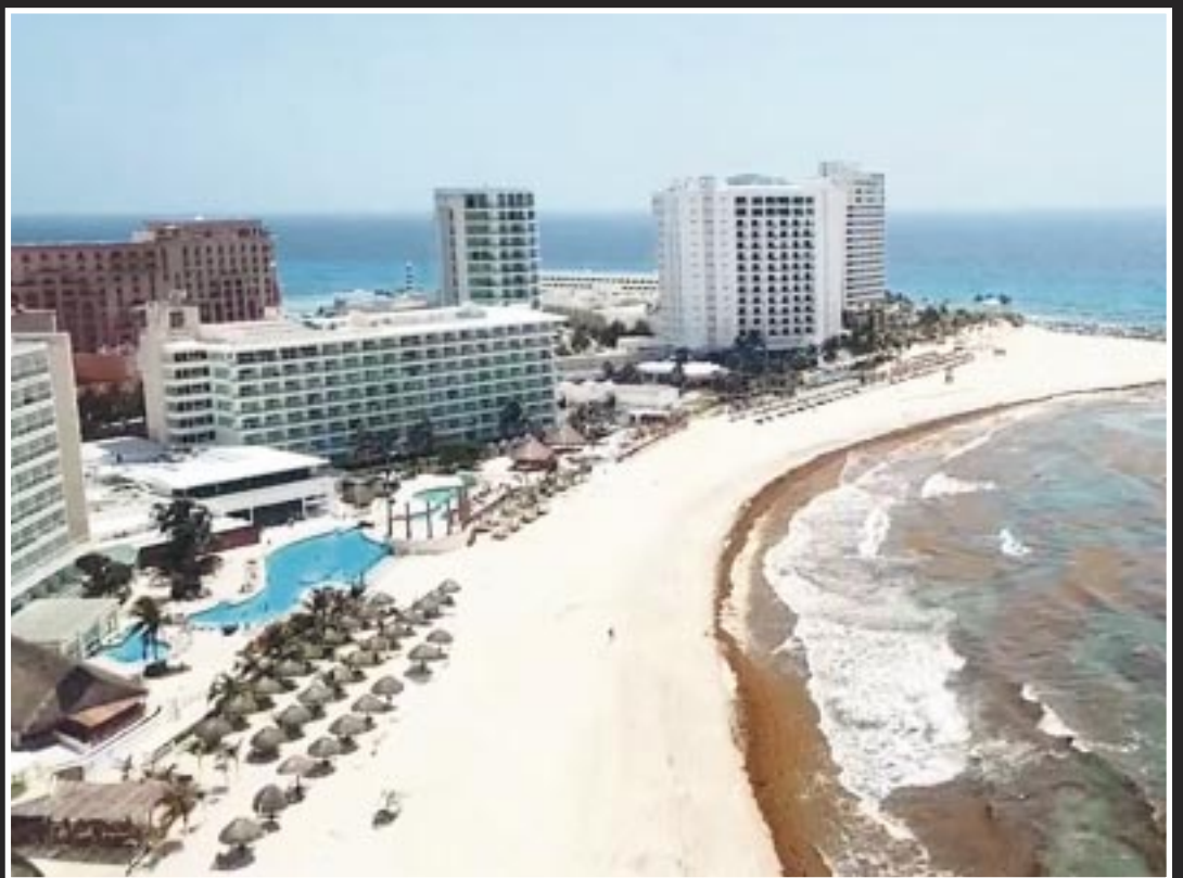
Hoteleros de Cancún aseguran que ya están listos para enfrentar la temporada de sargazo 2024.

indican que la región se encuentra en un nivel de alerta “bajo”, con la detección de apenas unos cuantos, pero las autoridades locales y empresarios turísticos están tomando medidas proactivas.