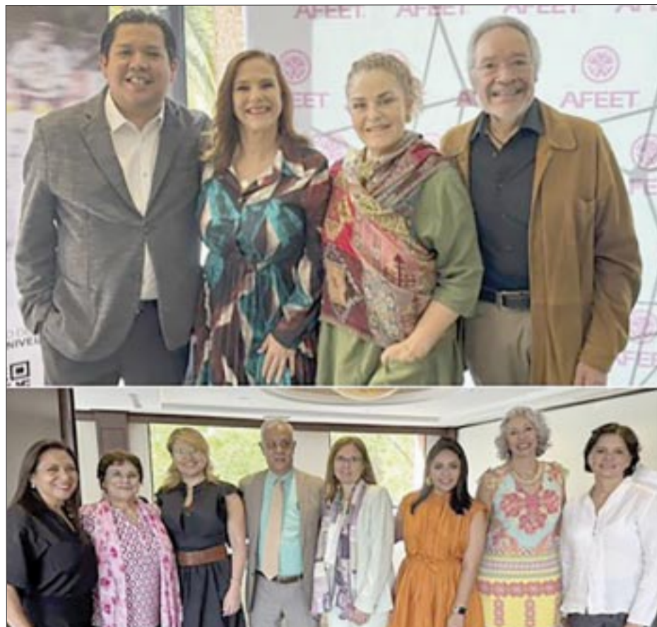
Los anfitriones de la tercera junta reglamentaria de la AFEET.