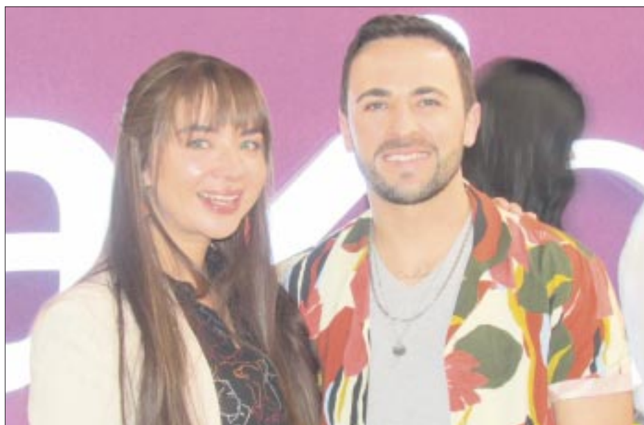
Contará con ex estrellas de inolvidables telenovelas infantiles como El diario de Daniela y Alebrijes y Rebujos.

Esta nueva producción es una historia original de Ocampo que se centrará en las familias reconstituidas en México, es decir, en las familias que se conforman de una pareja en la que ya existen hijos o hijas de alguno de ellos. El estreno de la telenovela está pautado para el próximo 21 de octubre por el canal Las Estrellas.