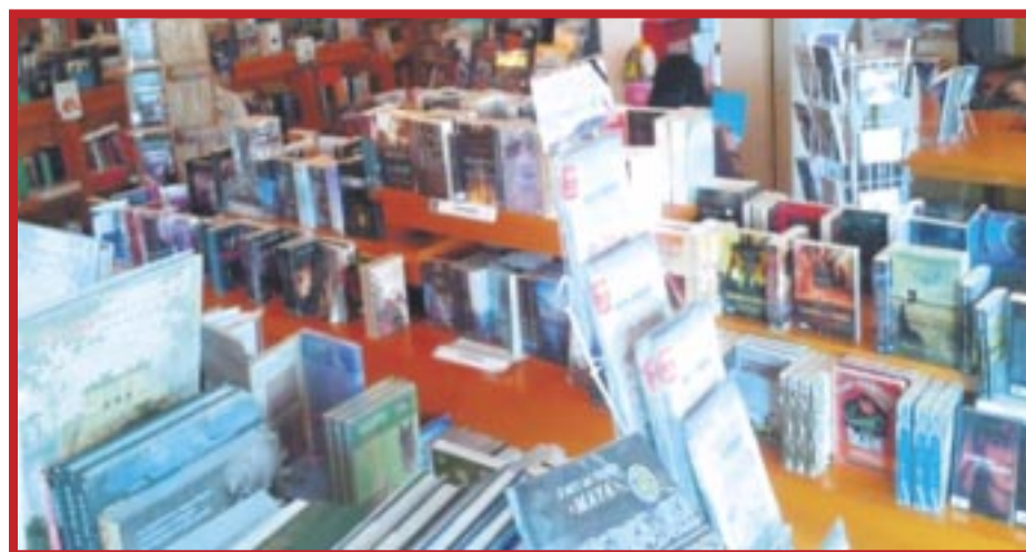
De por lo menos 80 librerías que existían en Cancún, unas 40 han cerrado ante la falta de lectores.