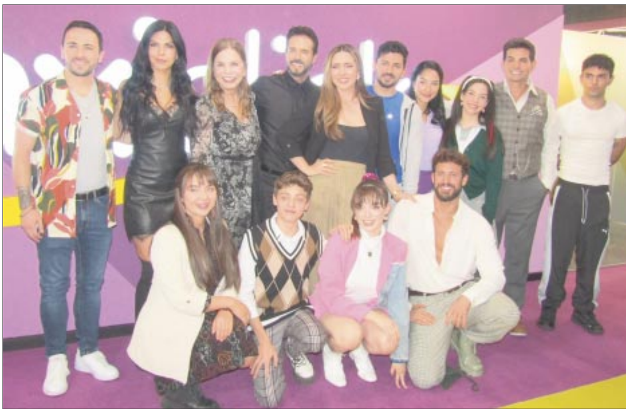
“Papás por conveniencia”, será protagonizada por Ariadne Díaz y José Ron para TelevisaUnivisión bajo la batuta de la productora Rosy Ocampo.