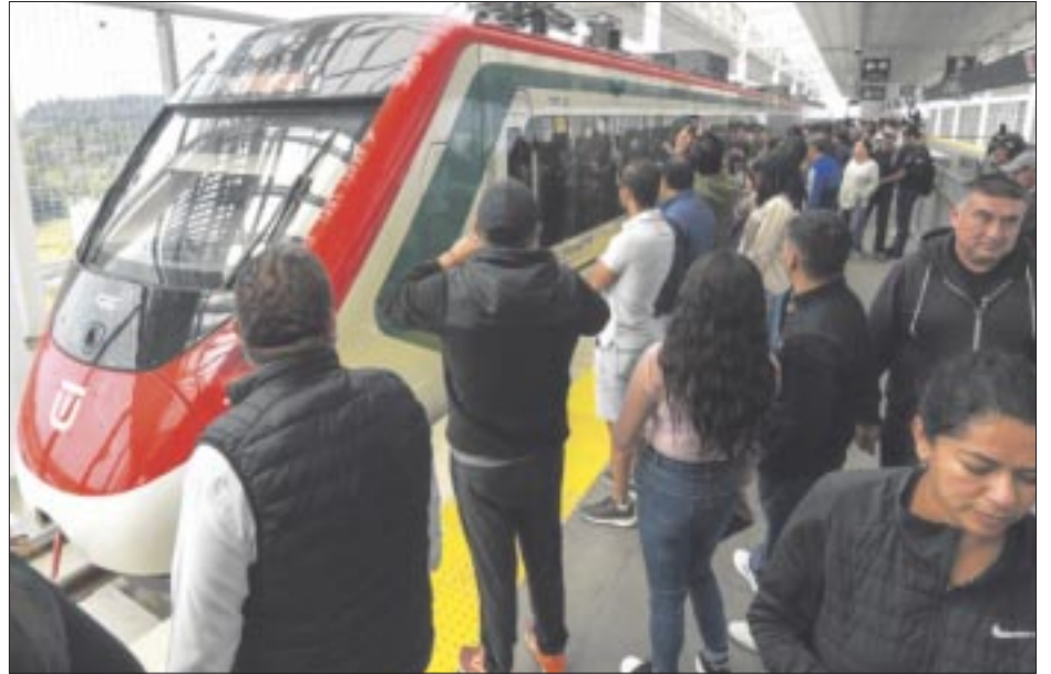
La obra total del tren El Insurgente estaría lista en este septiembre y el precio máximo del boleto será de 100 pesos, que cubrirá la ruta Zinacantepec-Observatorio y viceversa.