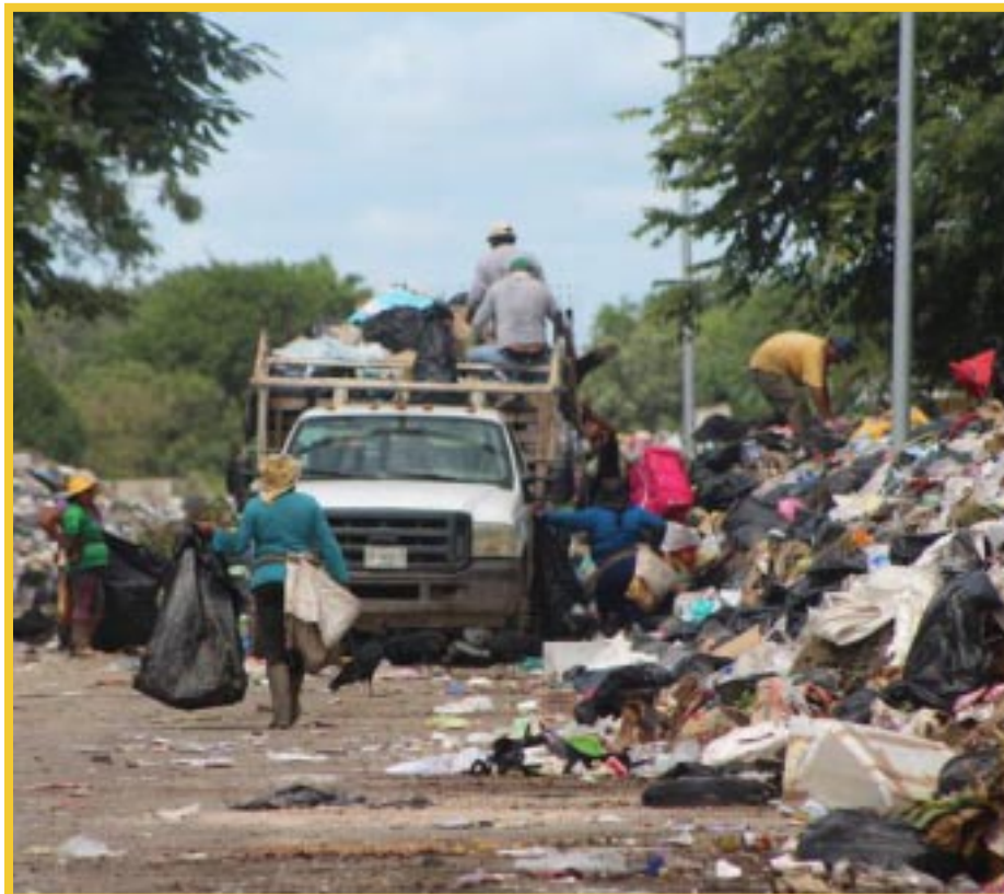
La acumulación de toneladas de basura sin un plan adecuado de manejo y tratamiento representa un riesgo para la salud de la población y para el ecosistema local.

Dijo que es momento de actuar y de trabajar juntos en la búsqueda de soluciones