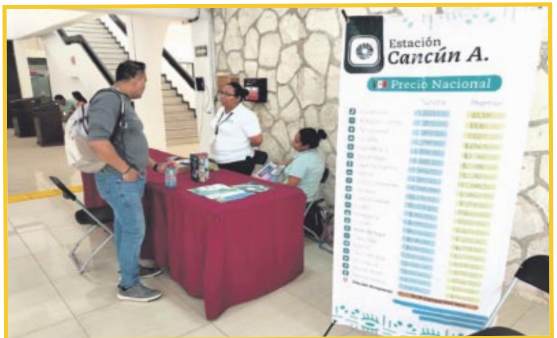
Personal del Tren Maya instaló un módulo para venta de boletos en el Palacio Municipal de Benito Juárez.

A Palenque, Chiapas, en clase Turista el valor del ticket es de 2 mil 123 pesos y en Premier 3 mil 391 pesos. Para Tenosique, Tabasco, es de mil 979 en Turista y 3 mil 128 en Premier; a Escárcega, Campeche, mil 563 pesos en Turista y 2 mil 496 pesos en Premier, y a Felipe Carrillo Puerto, mil 416 en Turista y 2 mil 261 en Premier.