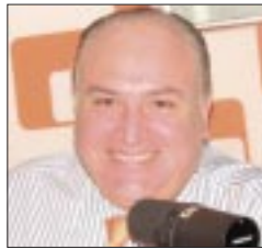
Por Víctor Sánchez Baños