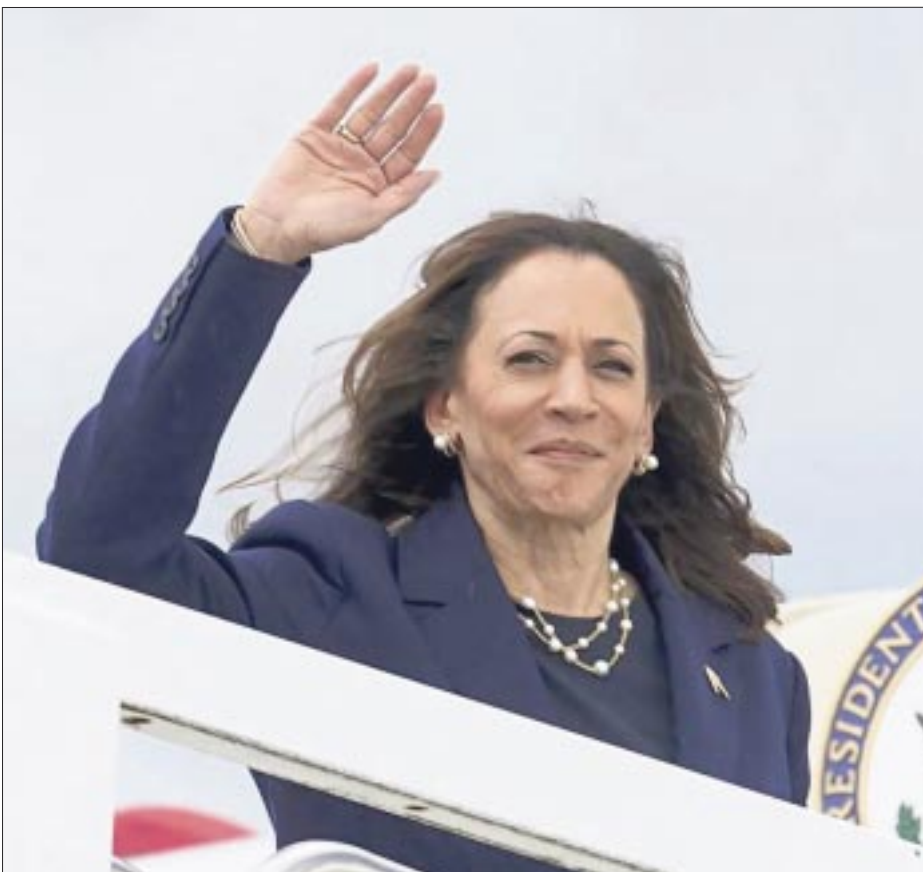
El rápido ascenso de Kamala Harris en popularidad, tras la decisión del presidente Joe Biden de abandonar su carrera, ha obligado al equipo de Donald Trump a recalibrar su estrategia.

— El rápido ascenso de Harris ha obligado al equipo del republicano a recalibrar su estrategia