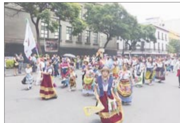
En la MegaCalenda de los grupos indígenas.

“Para nosotros, crear envases a partir de resina reciclable representa un proceso de gran valor social, porque no sólo es el componente, sino el esfuerzo de los que intervienen en esta cadena de valor como los socios, acopiadores, transportistas y fa-