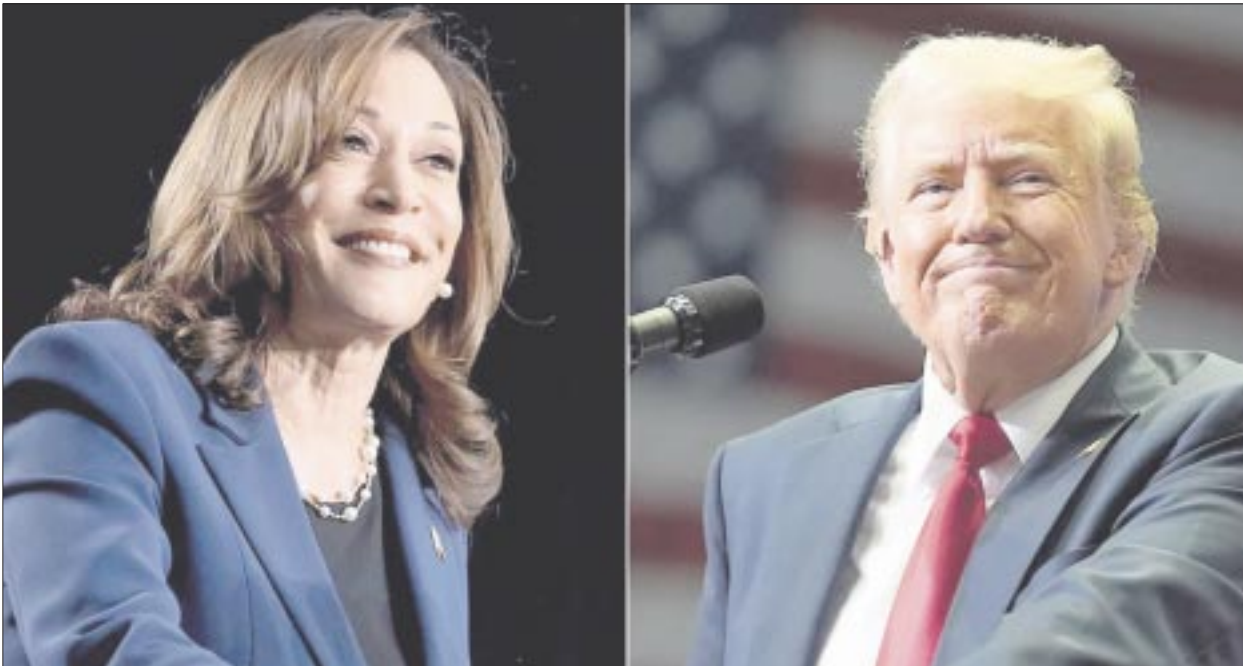
La demócrata Kamala Harris y el republicano Donald Trump debatirán en televisión el 10 de septiembre, anunció la cadena de televisión estadounidense ABC.