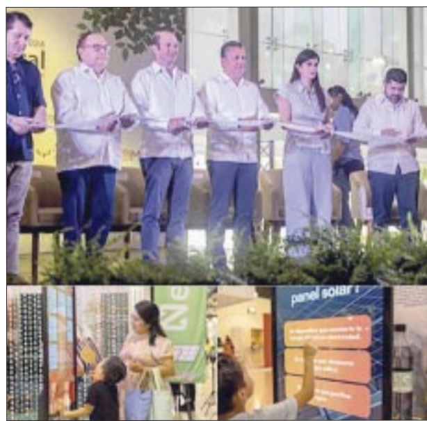
En el corte de listón de Expo Foro Ambiental 2024.

victoriagprado@gmail.com X: @victoriagprado