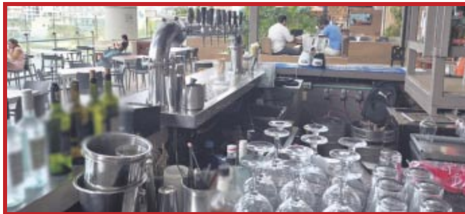
El 70 por ciento de los restaurantes sufrieron afectaciones por el apagón que se registró en Cancún el miércoles de la semana pasada, reportó la Canirac.

Los datos de la Canirac destacan que menos de 1% de los negocios cuentan con una planta de luz, para hacer frente a este tipo de apagones, de modo que, es imposible que puedan vender cuando esto ocurre “Muchos negocios cerraron sus puertas antes de lo previsto, al no tener energía eléctrica que les permitirá dar servicio, cobrar con tarjeta o incluso poder brindar luz a los comensales” dijo, eso sin mencionar que mucha de su materia prima se echó a perder.