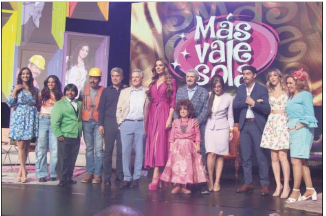
Esta comedia trata principalmente de los problemas a los que se enfrentan las mujeres en estos tiempos.