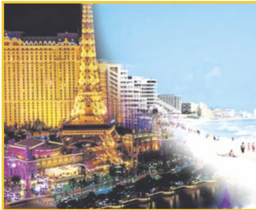
Oferta hotelera en Quintana Roo se encuentra a 20 mil habitaciones de alcanzar la de Las Vegas.

Y concluyó que cambiará la dinámica de traslado entre los destinos de Quintana Roo. “Una vez esté abierto a finales de año, la conexión de los dos aeropuertos Cancún-Tulum, ahí vamos a tener una mecánica distinta y la otra parte que sería Tulum-Chetumal pasando por Bacalar, se supone que estarías aterrizando en Tulum y estarías a una hora de Bacalar, ya cambia mucho el esquema de cómo nos trasladamos a los lugares, el ejemplo es el turismo en Europa que está mucho con el tren” concluyó.