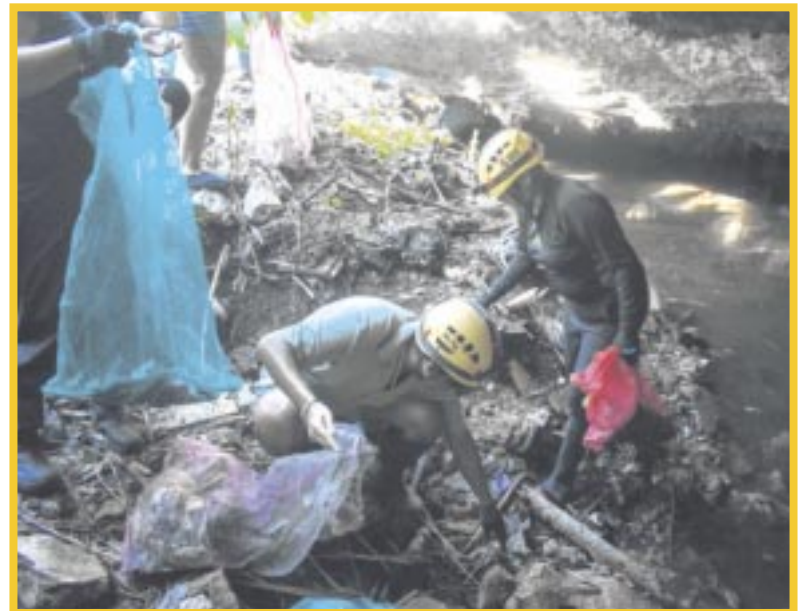
El colectivo Cenotes Urbanos y la Asociación Civil ALAK, llevó a cabo una brigada de limpieza en el Cenote Chipec Encapuchado, ubicado en Solidaridad.

El IQJ continuará promoviendo este tipo de iniciativas, asegurando que las juventudes quintanarroenses sean protagonistas en la conservación de nuestro entorno y el bienestar de futuras generaciones.