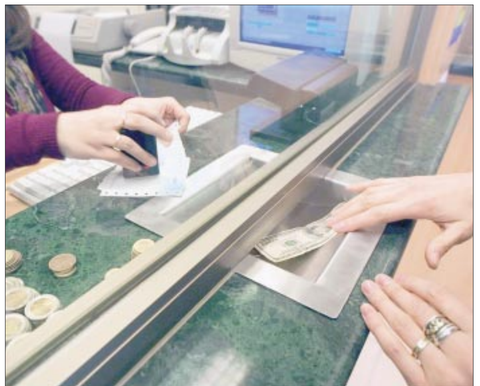
El tipo de cambio , ayer por la mañana, cotizaba en 20.14 pesos por dólar a la venta en ventanillas de Citibanamex.

La controvertida reforma, promovida por el presidente saliente, Andrés Manuel López Obrador, busca, entre