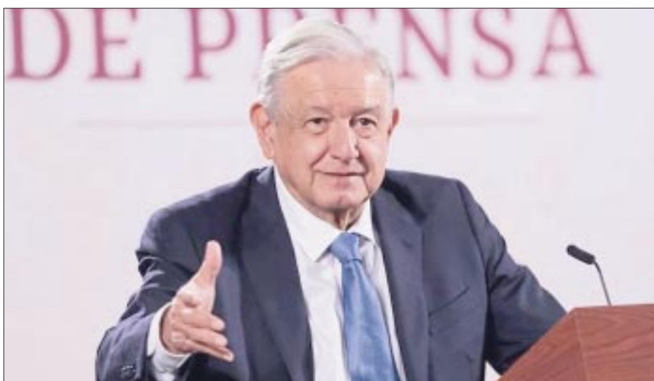
Andrés Manuel López Obrador aseguró que la depreciación del peso mexicano se debe a factores externos, y no a las reformas que está proponiendo en el Congreso, principalmente la del Poder Judicial.