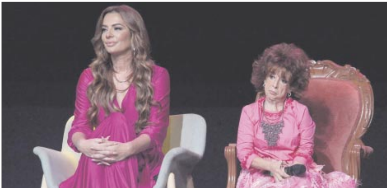
No te puedes perder “Más vale sola” a partir del domingo 1 de septiembre por el canal de las estrellas a las 20:00 horas.